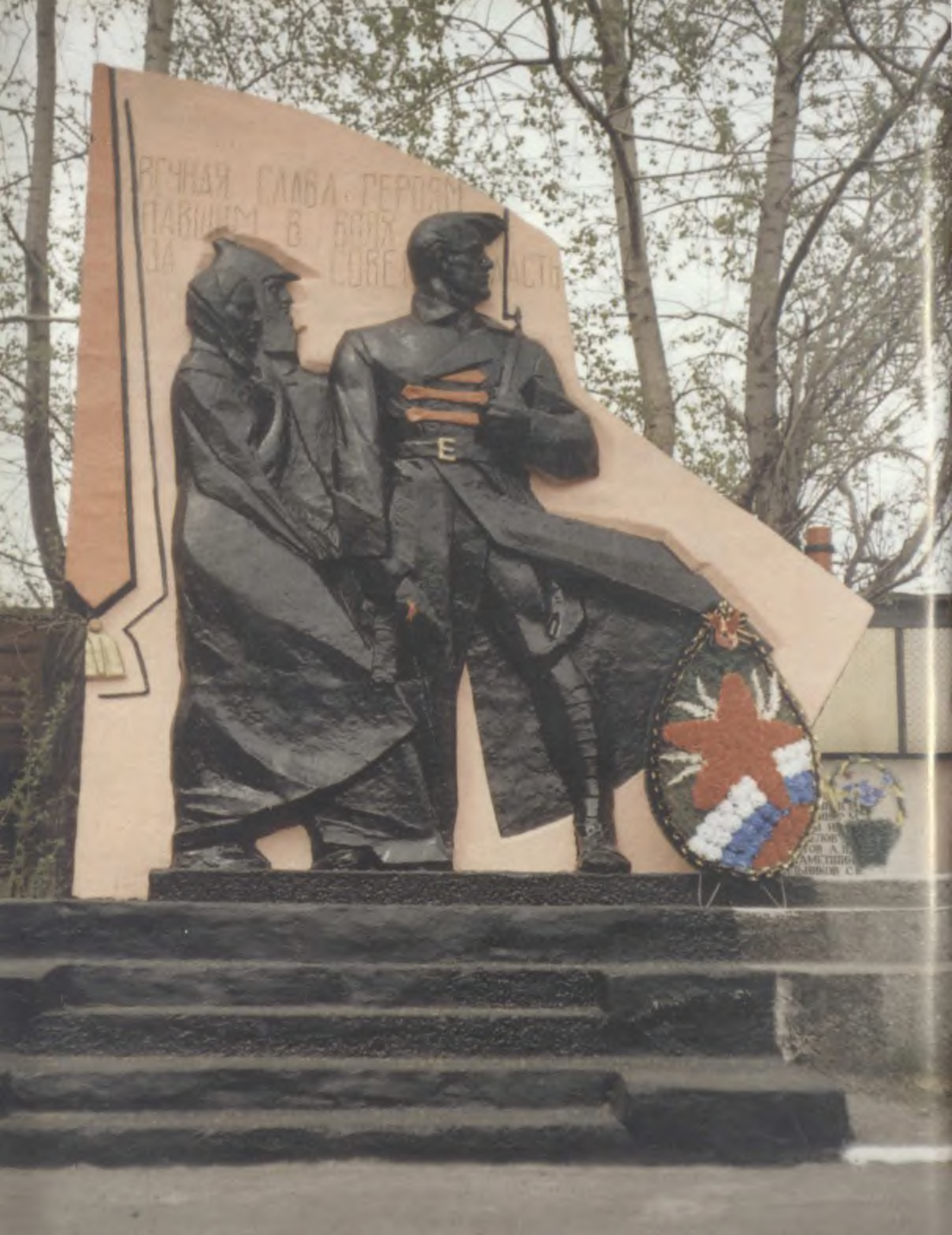
Город Первоуральск. Памятник героям гражданской и Великой Отечественной войн.