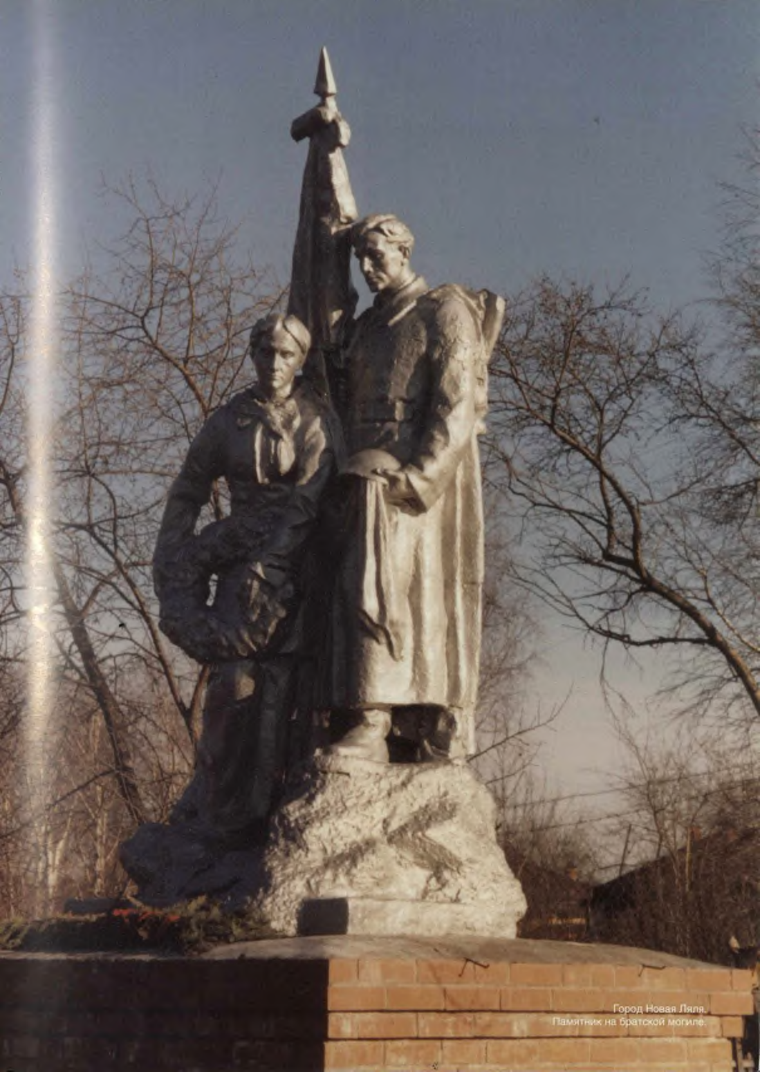
Город Новая Ляля. Памятник на братской могиле.