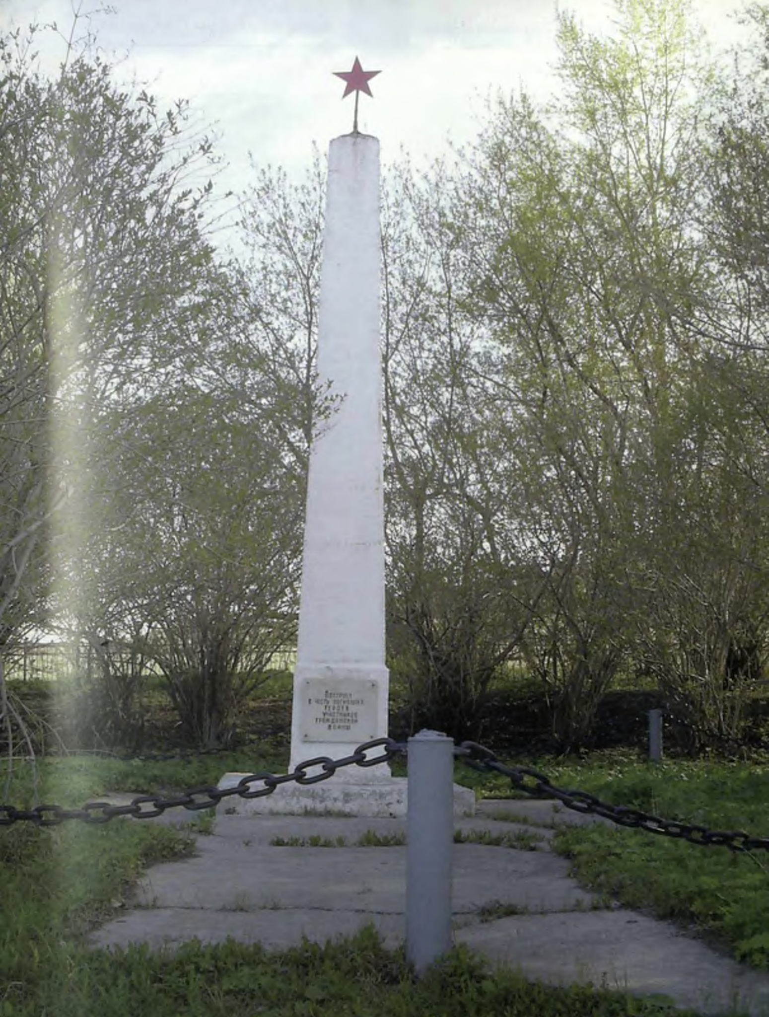
Город Верхний Тагил. Обелиск героям гражданской войны.