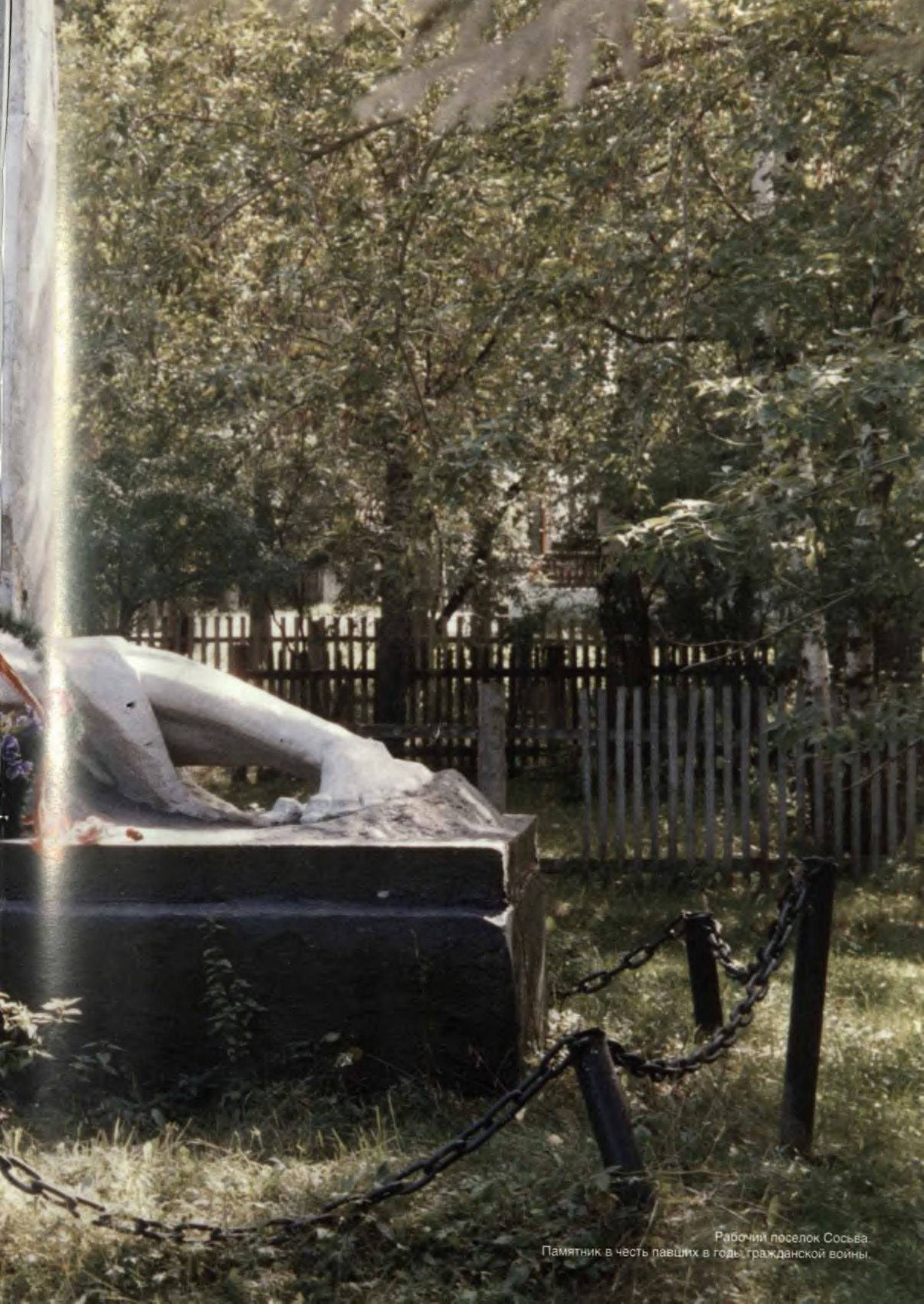
Рабочий поселок Сосьва Памятник в честь павших в годы гражданской войны.