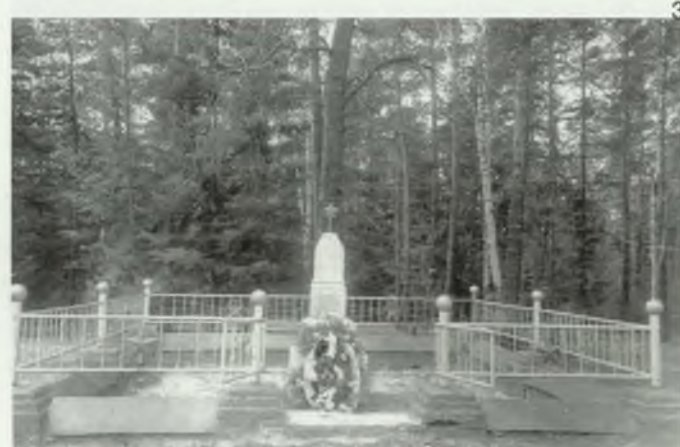
6. Интернациональная могила и памятный знак участникам боев за реку Актай.

Братская могила красноармейцев – русских и китайцев на правом берегу реки Актай в полукилометре от поселка лесозавода «Пролетарий».