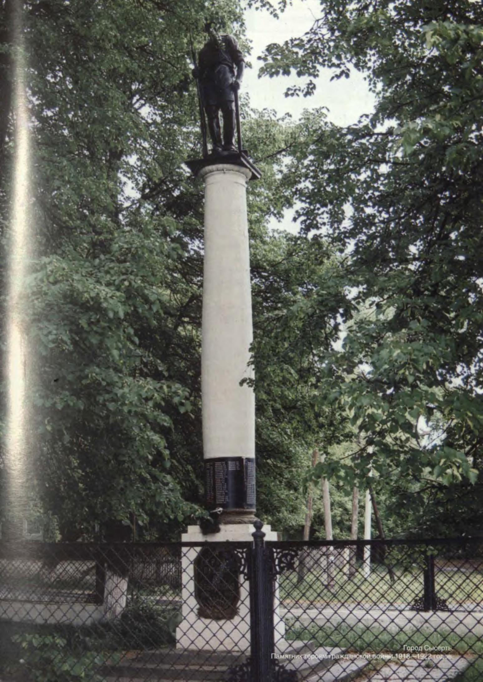
Город Сысерть Памятник героям гражданской войны, 1918–1922 годов.