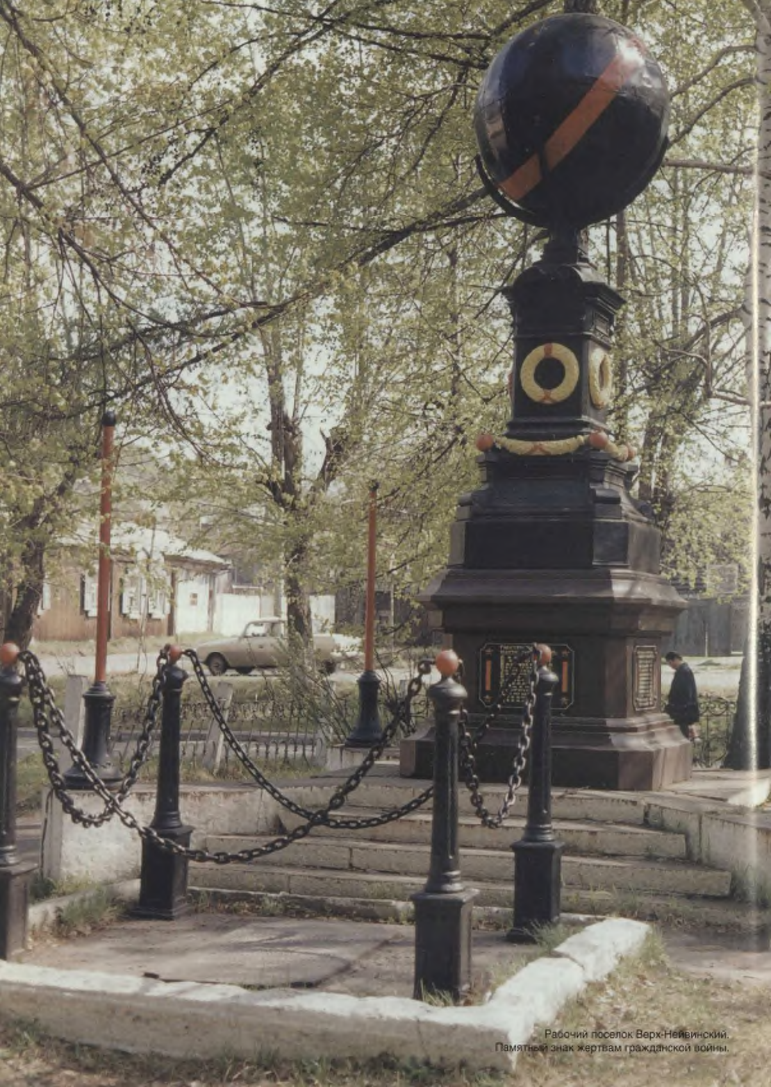
Рабочий поселок Верх-Нейвинский. Памятный знак жертвам гражданской войны.