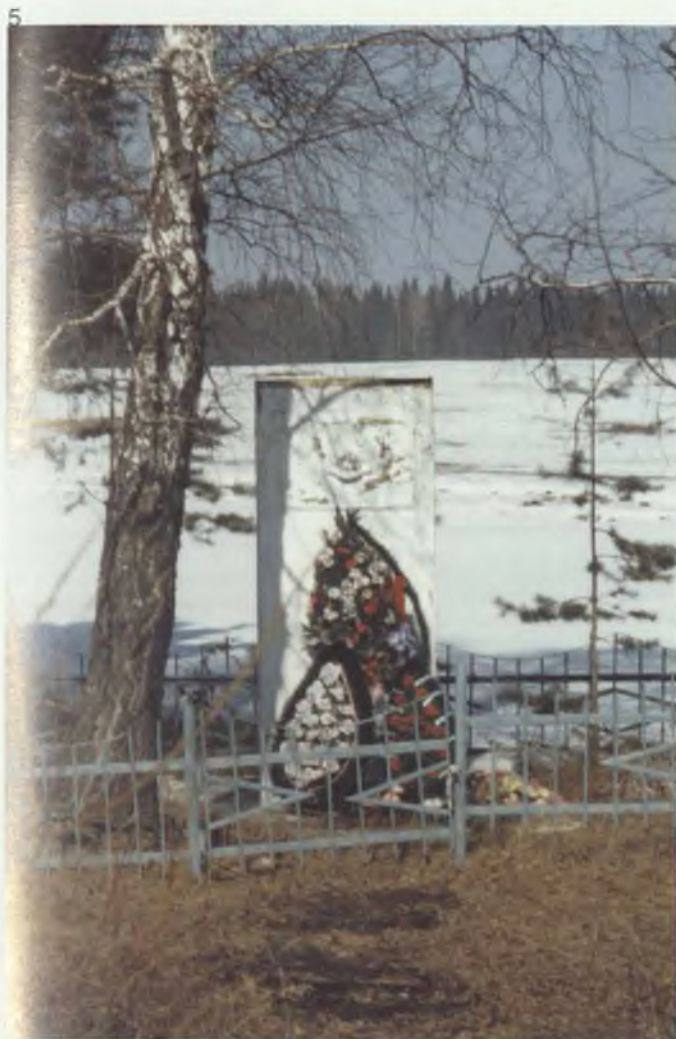
4. Братская могила и памятный знак на южной окраине г. Верхотурья.

Находится на территории сортоиспытательного участка. Знак воздвигнут в 1918 году на братской могиле расстрелянных активистов советской власти, партизан и подпольщиков. В эту могилу бросали убитых из Верхотурской тюрьмы, из застенков колчаковской разведки и карательного отряда, находившегося в Верхотурье. Точных данных о количестве захороненных в братской могиле нет. Известно, что в этой могиле покоится прах Даниила Илларионовича Мальцева, командира партизанской группы, именем которого названа одна из улиц.