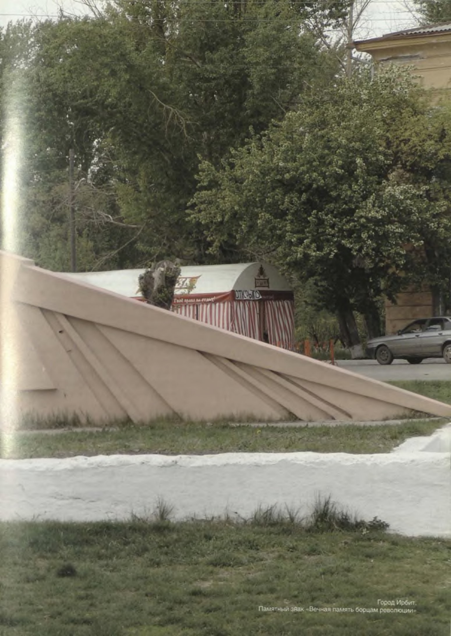
Город Ирбит. Памятный знак «Вечная память борцам революции»