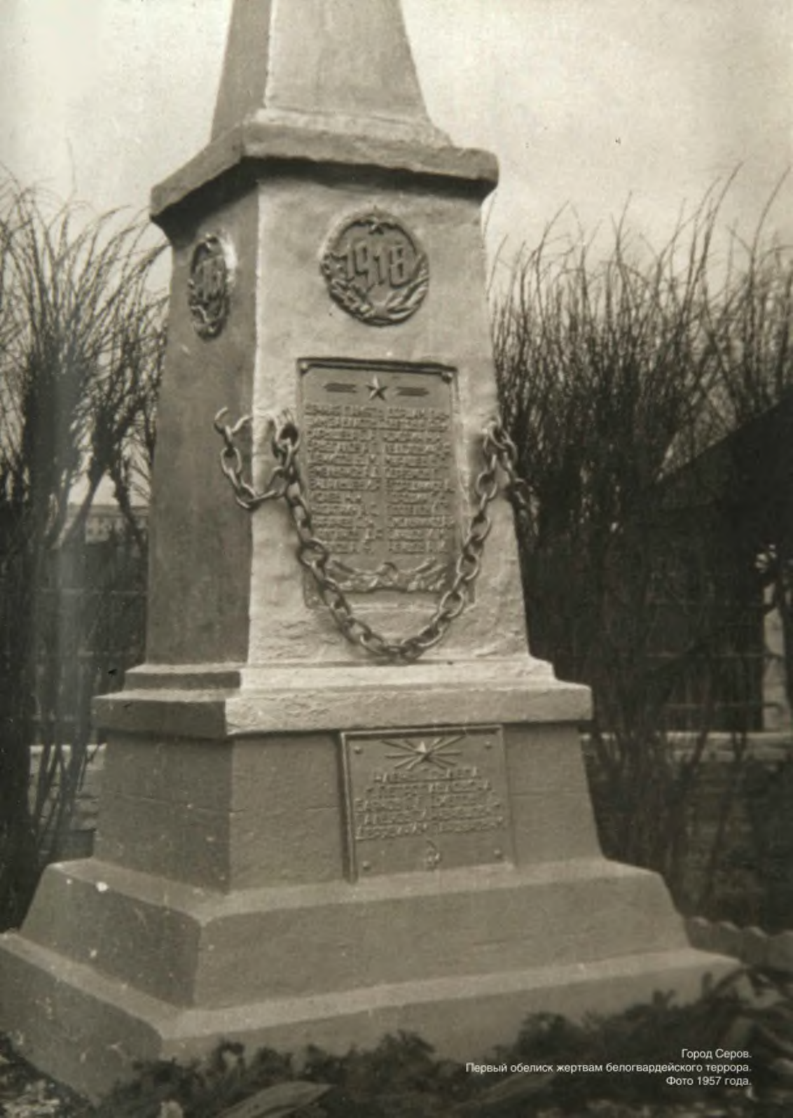
Город Серов. Первый обелиск жертвам белогвардейского террора. Фото 1957 года.