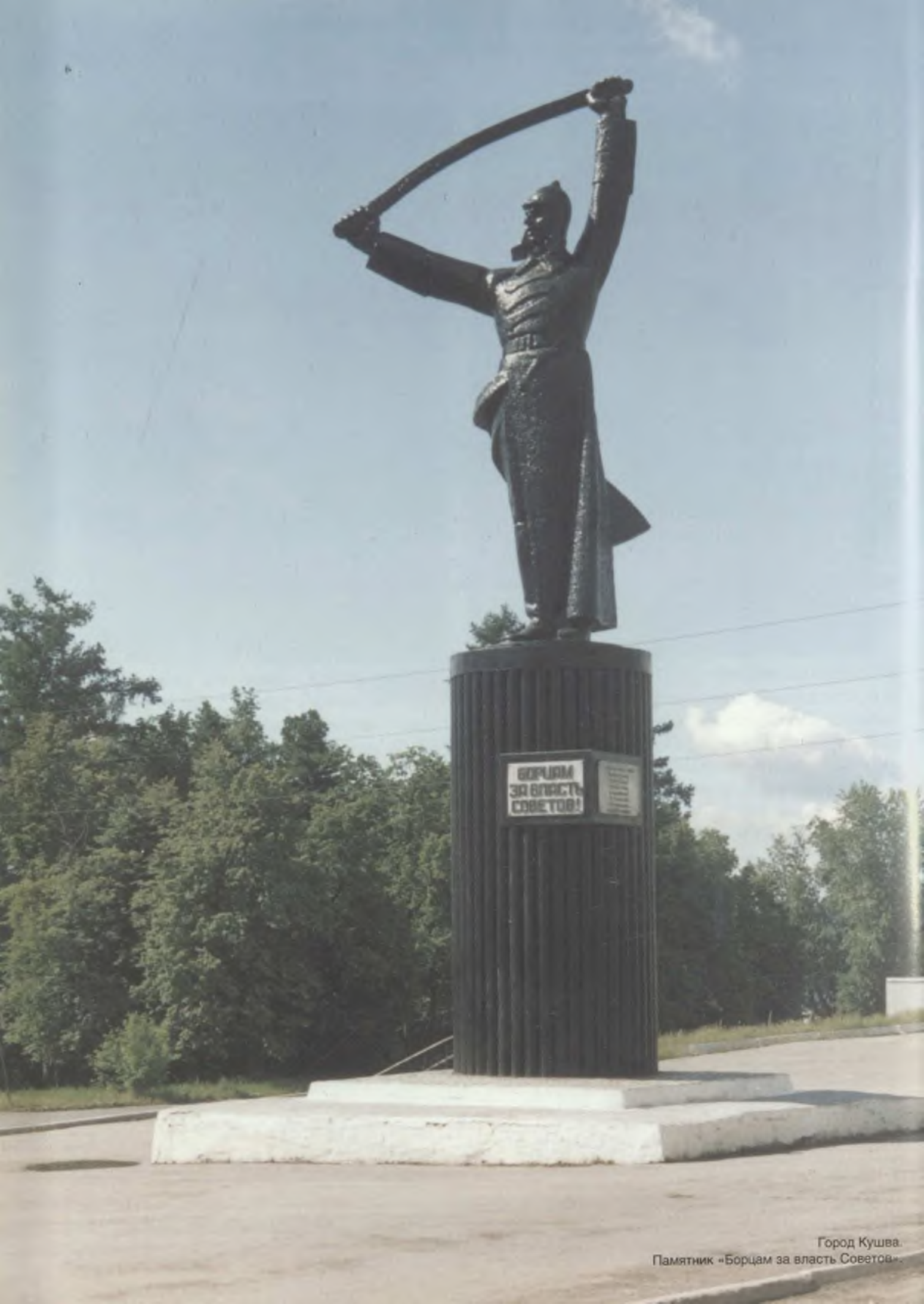
Город Кушва. Памятник «Борцам за власть Советов».