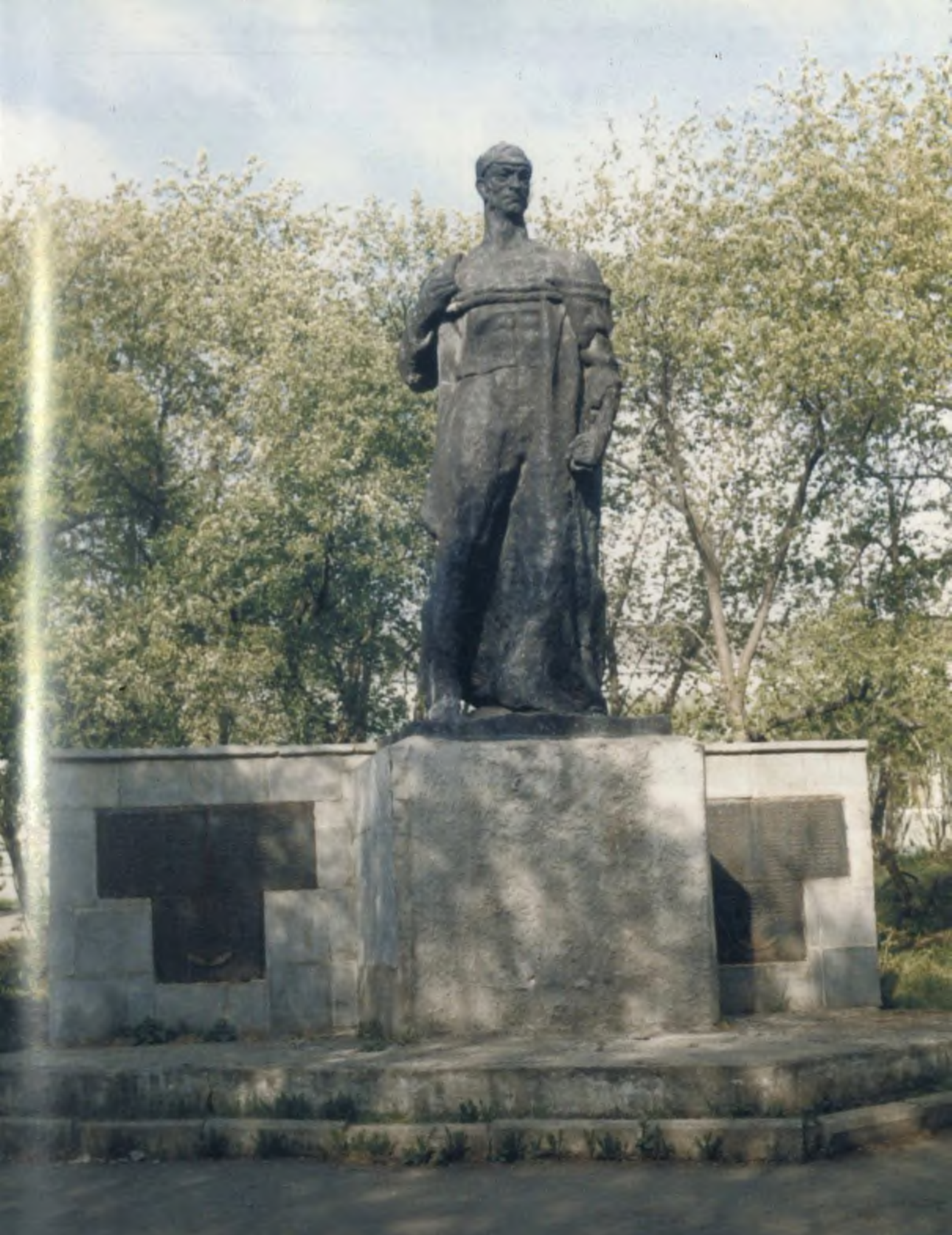
Город Берёзовский. Памятник «Непокорённый».