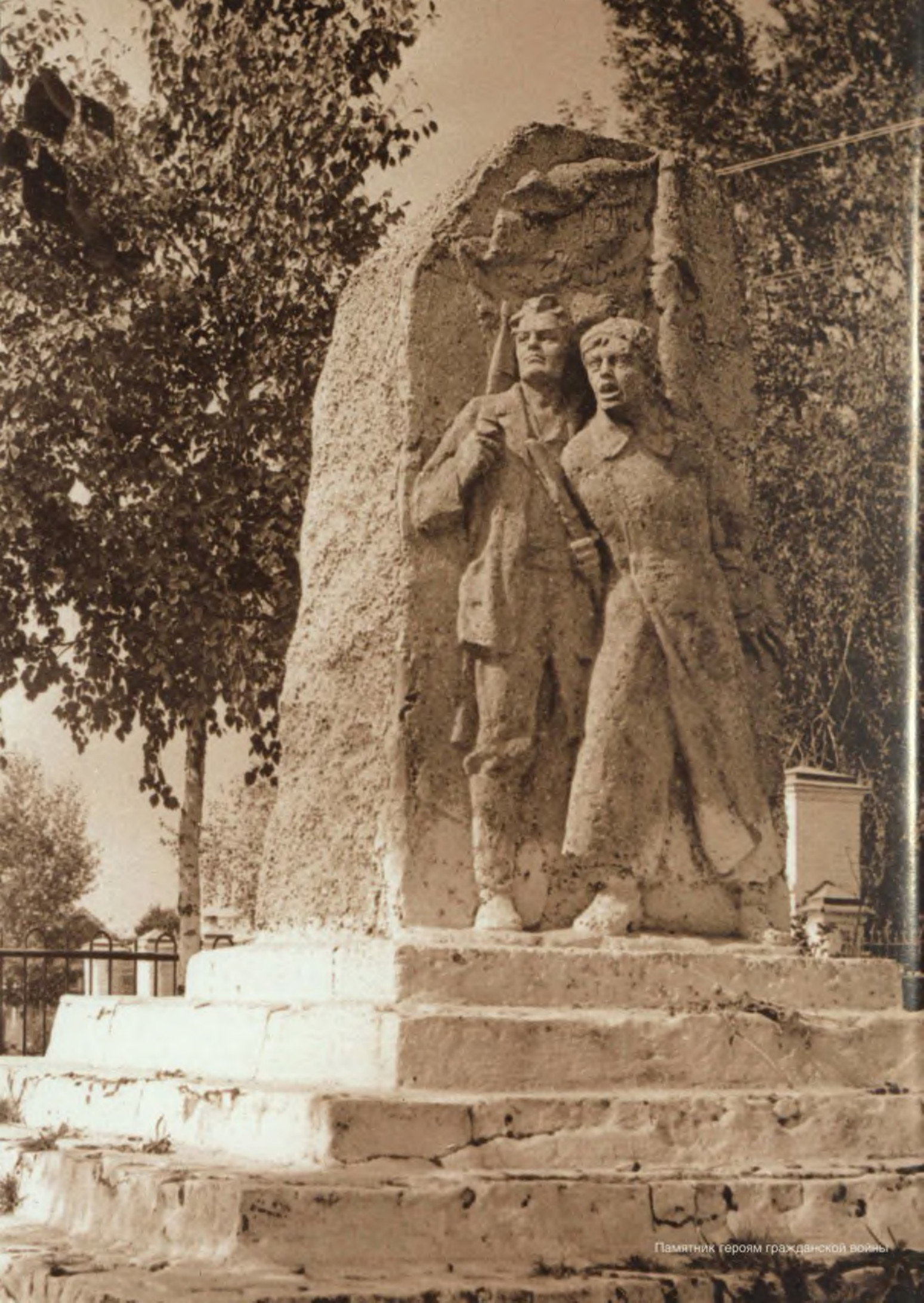
Памятник героям гражданской войны