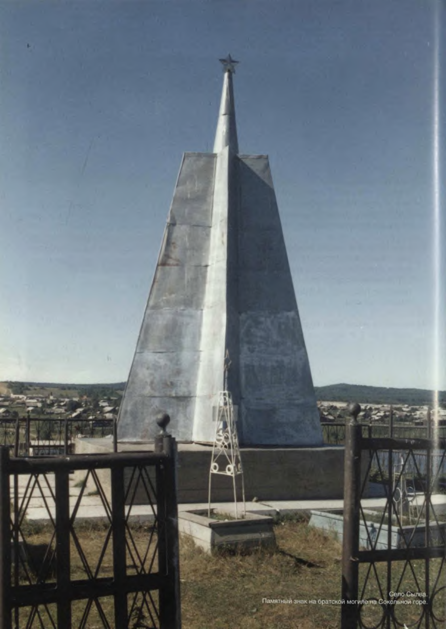
Село Сылев. Памятный знак на братской могиле на Сокольной горе.