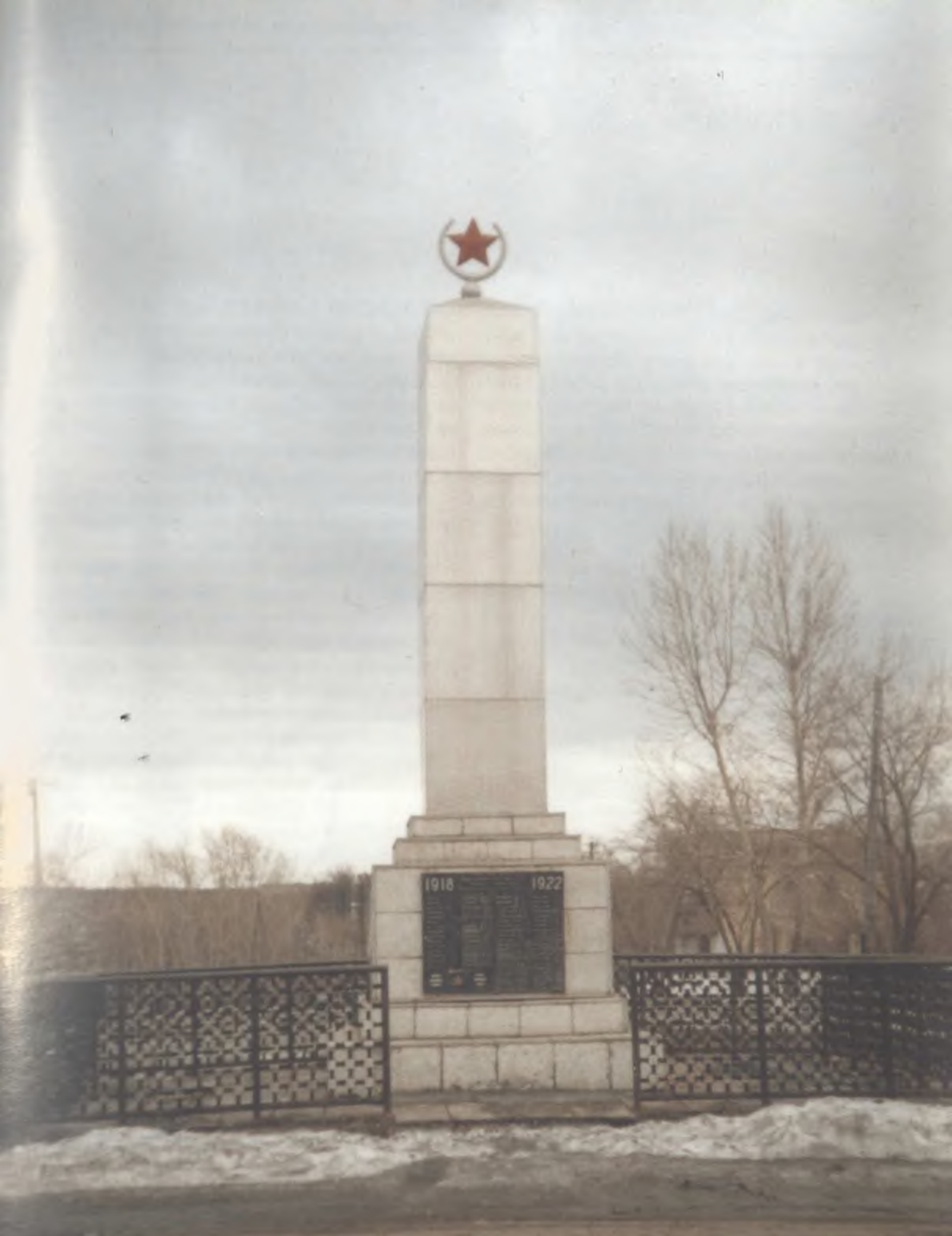
Рабочий поселок Верхняя Синячиха. Обелиск в честь погибших в годы гражданской и Великой Отечественной войн.