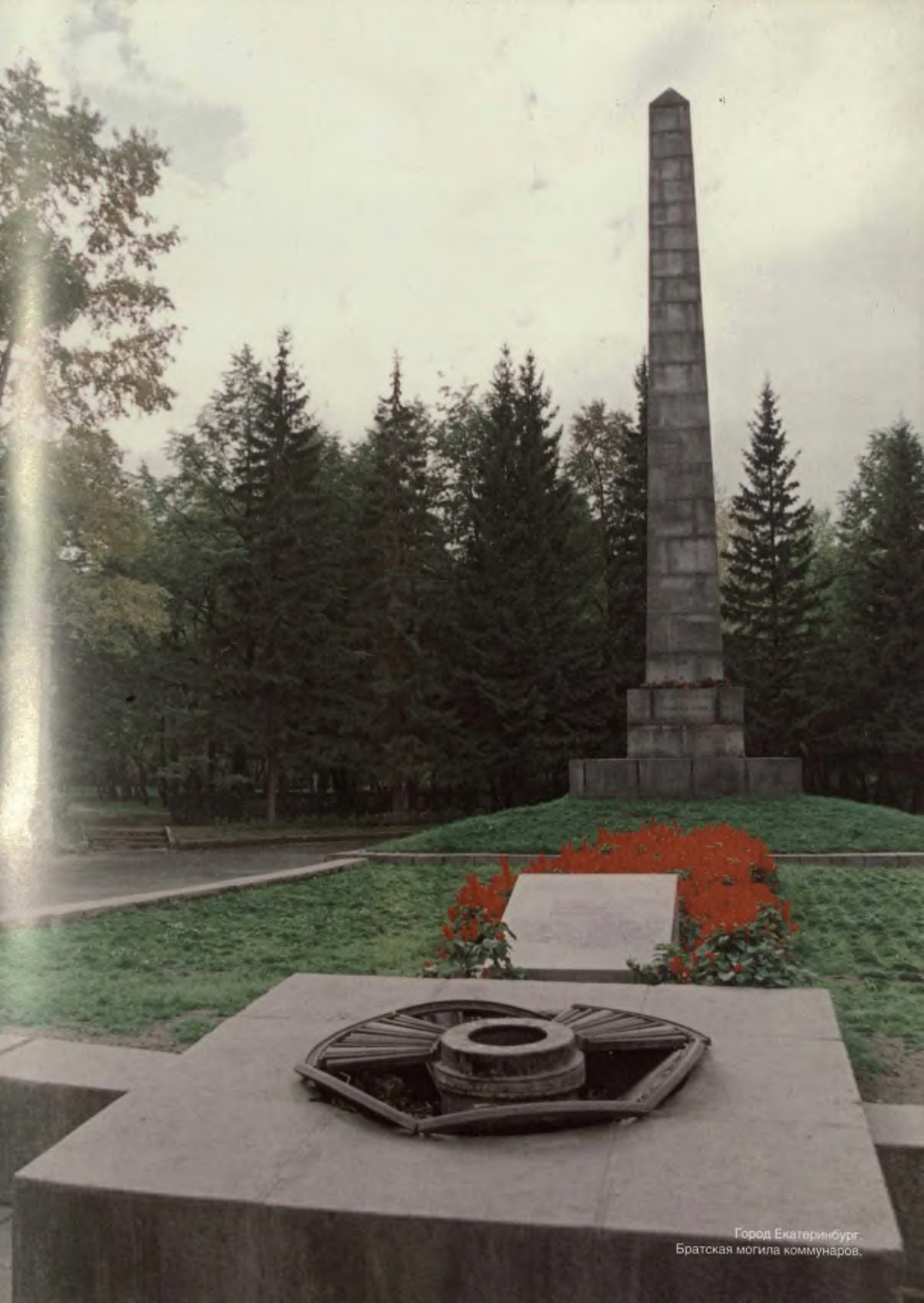
Город Екатеринбург. Братская могила коммунаров.