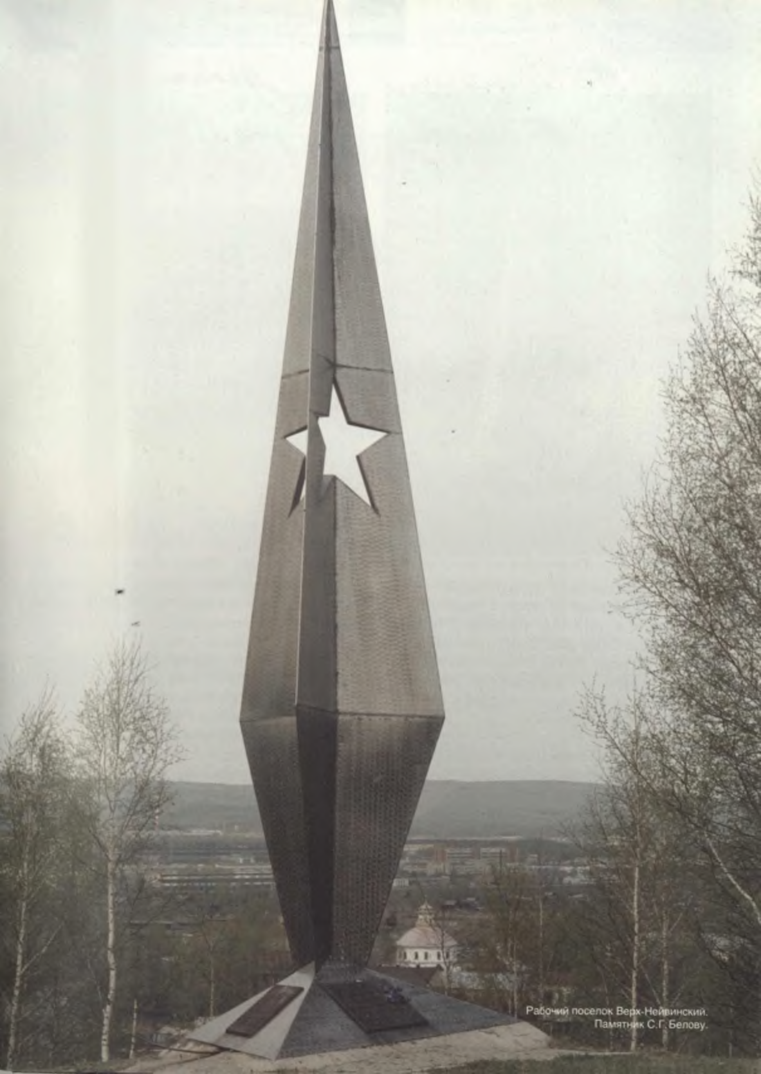
Рабочий поселок Верх-Нейвинский. Памятник С.Г. Белову.