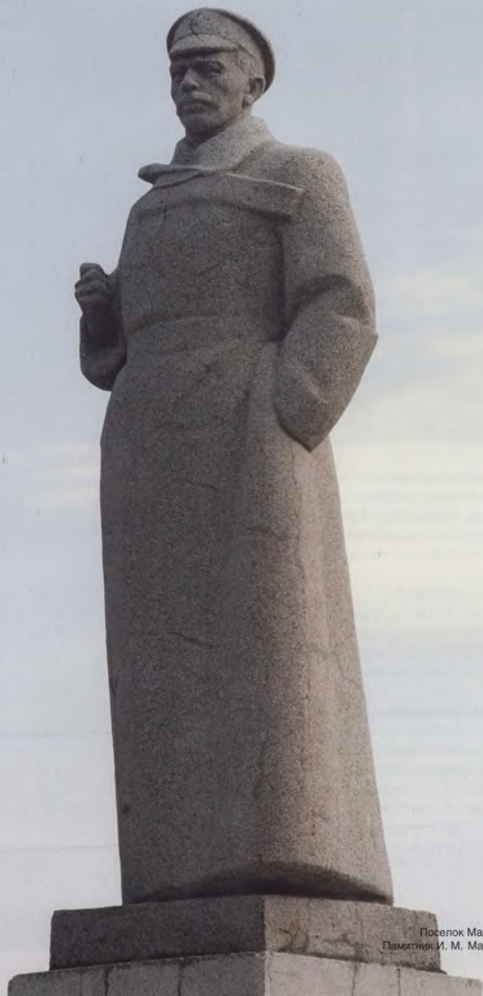
Поселок Мальшева. Памятник И. М. Мальшеву.