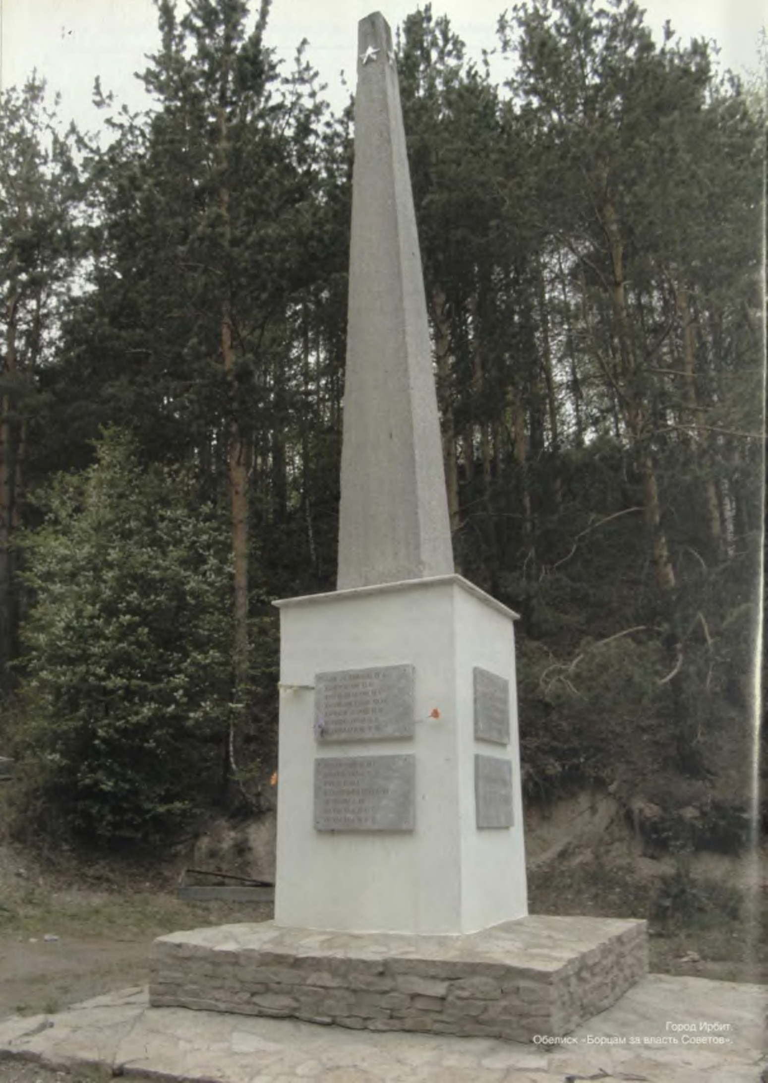
Город Ирбит. Обелиск «Борцам за власть Советов».