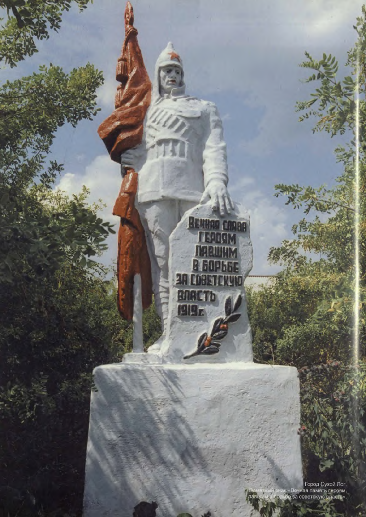
Город Сухой Лог. Памятный знак «Вечная память героям, павшим в борьбе за советскую власть».