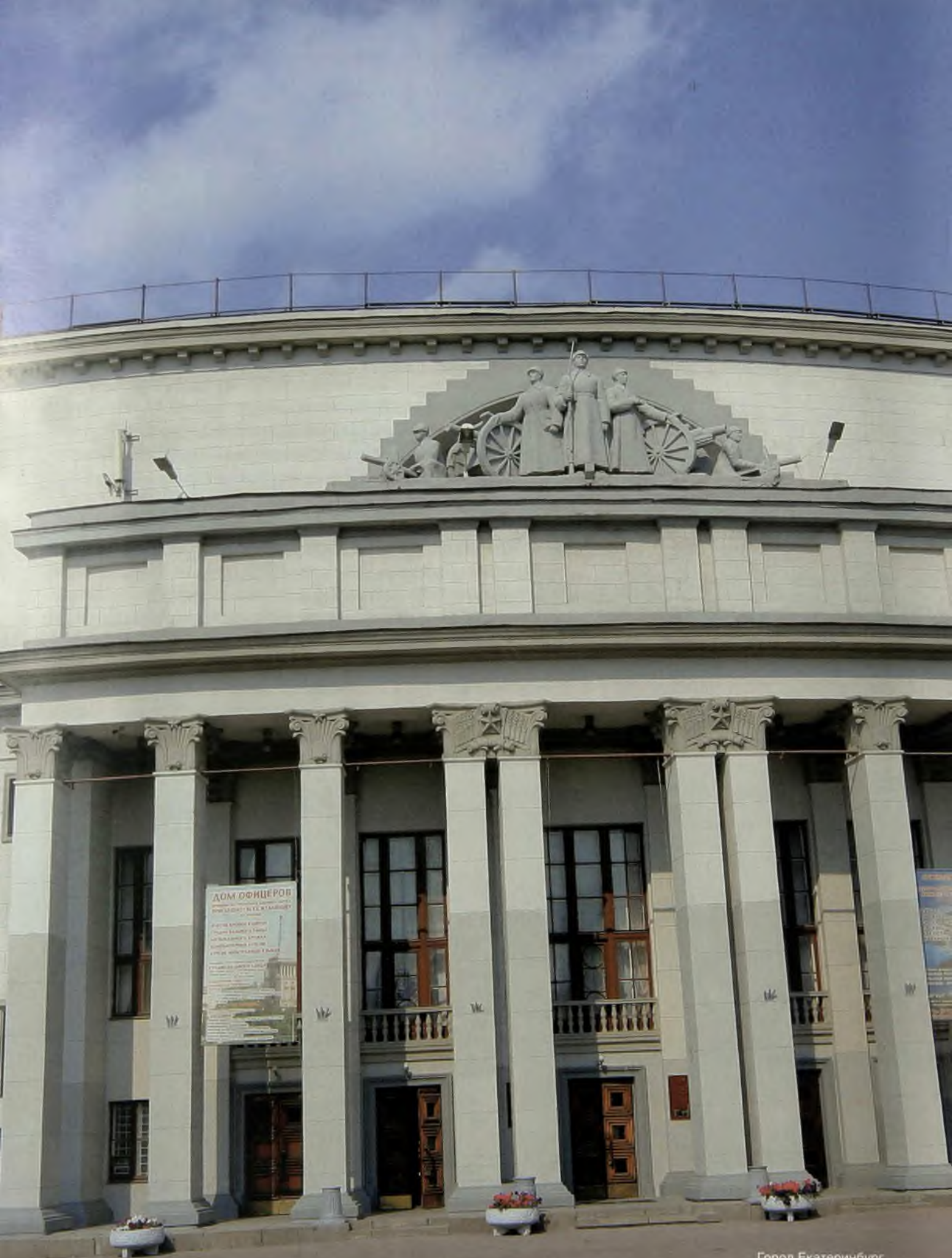
Город Екатеринбург. Дом офицеров Приволжско-Уральского военного округа.