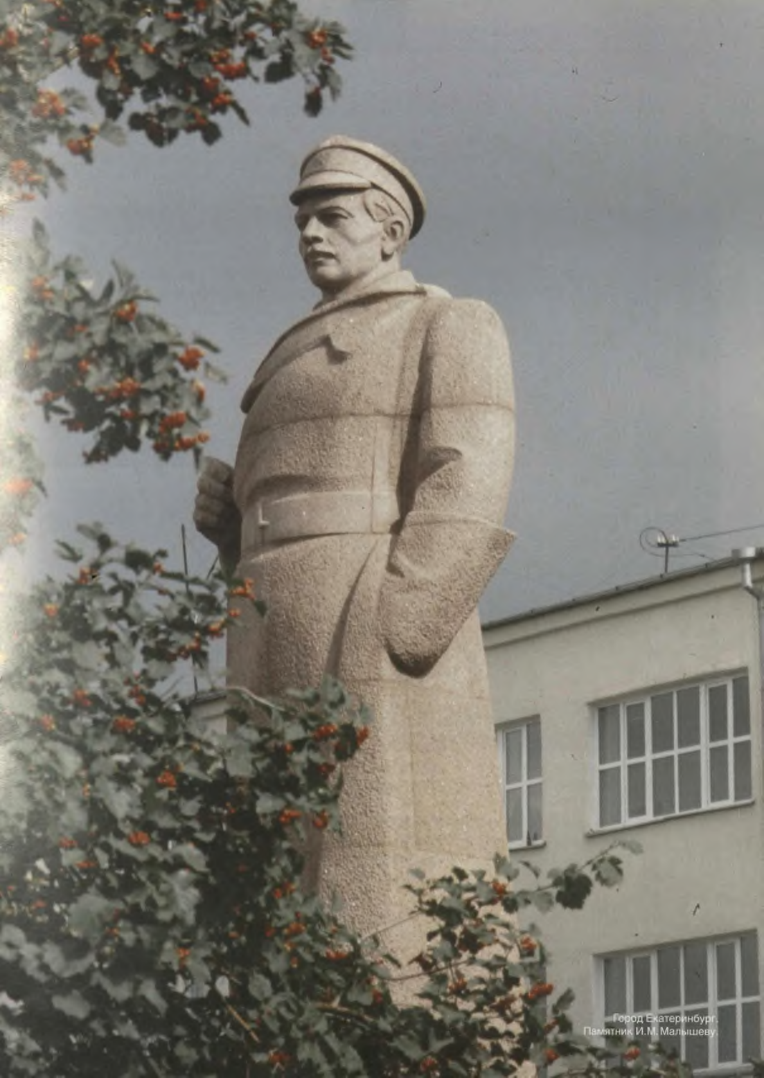
Город Екатеринбург, Памятник И. М. Малышеву.