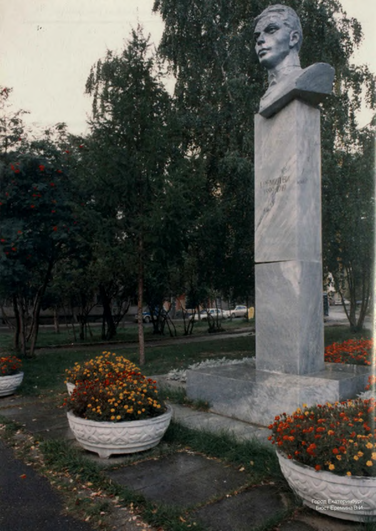
Город Екатеринбург Бюст Еремина В.И.