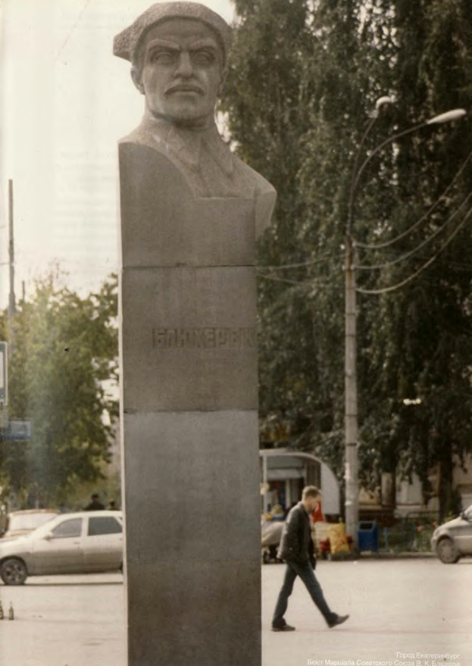
Город Екатеринбург. Бюст Маршала Советского Союза В. К. Блюхина