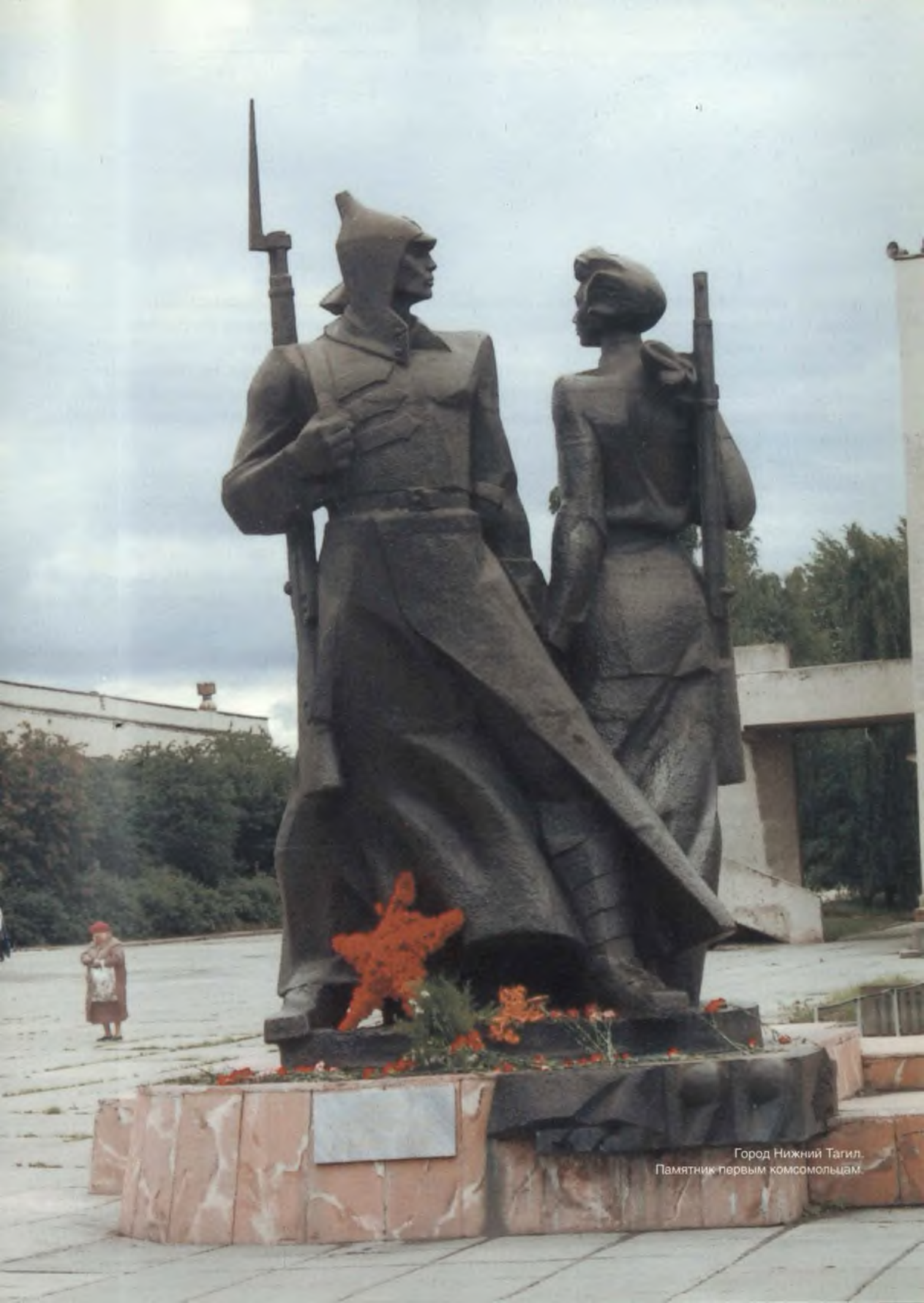
Город Нижний Тагил. Памятник первым комсомольцам.