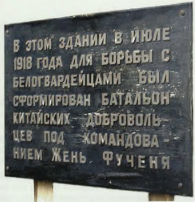
В этом здании на улице Павлова, 33 был сформирован батальон китайских добровольцев