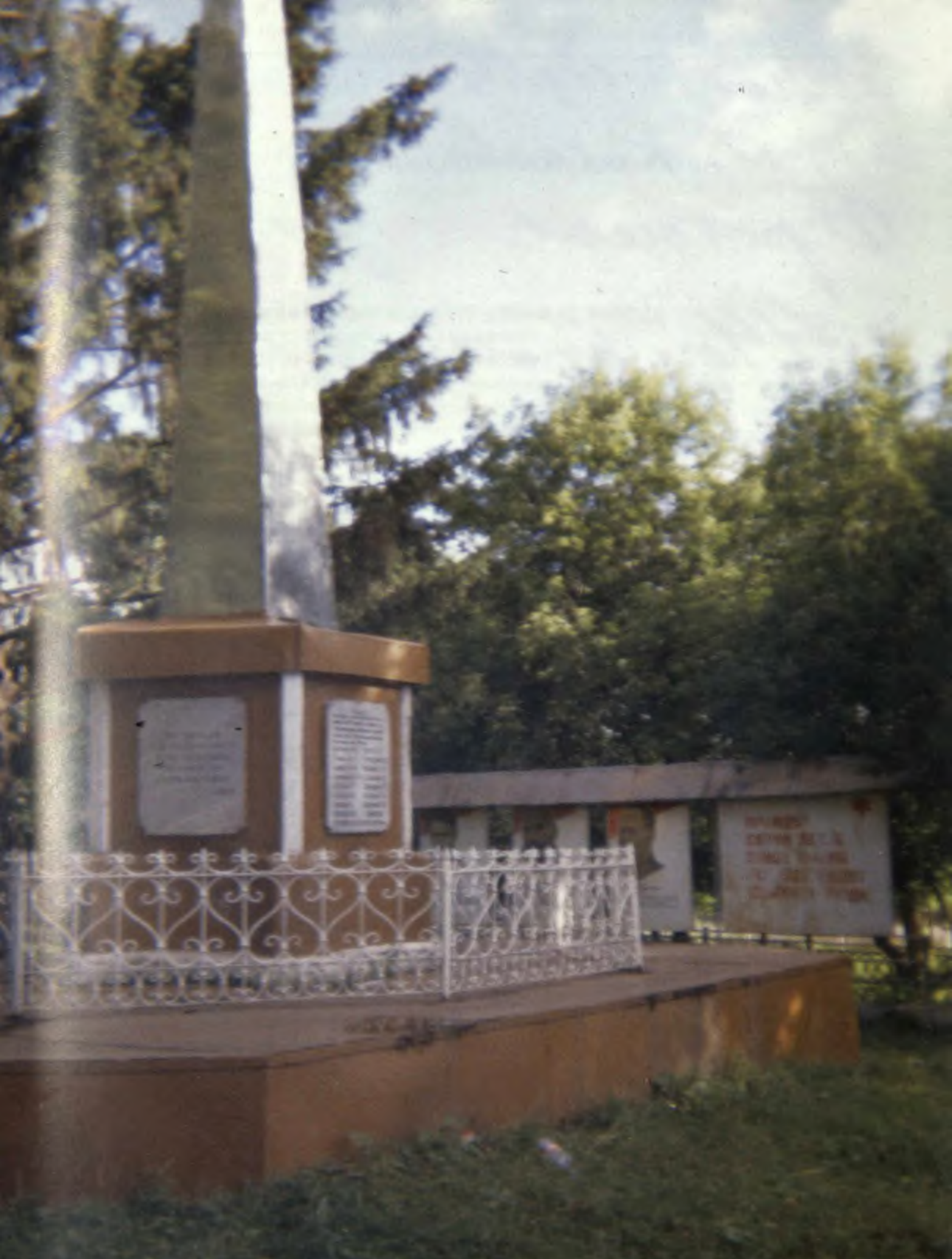
Рабочий поселок Арти. Обелиск на братском захоронении 44 революционеров, казненных в июле 1918 года.