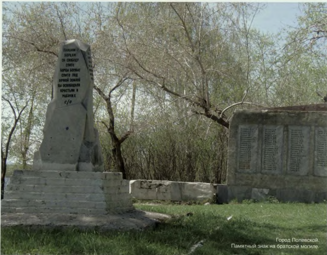
Город Полевской. Памятный знак на братской могиле.

Памятный знак «Защитникам Отечества – воинам гражданской и Великой Отечественной войн». Сооружен в 1965 году. Автор проекта – И.Е. Романов.