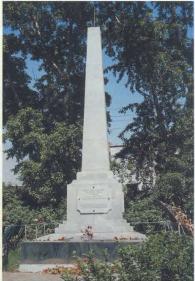
Город Арамиль. Памятный знак в честь земляков, погибших в годы гражданской и Великой Отечественной войн.

В девяностые годы XX века установлены мемориальные доски с именами погибших арамильцев. Общая высота – 4 метра. Памятный знак сооружен по инициативе и на средства жителей города. Изготовлен на заводе мраморных изделий в г. Полевском.