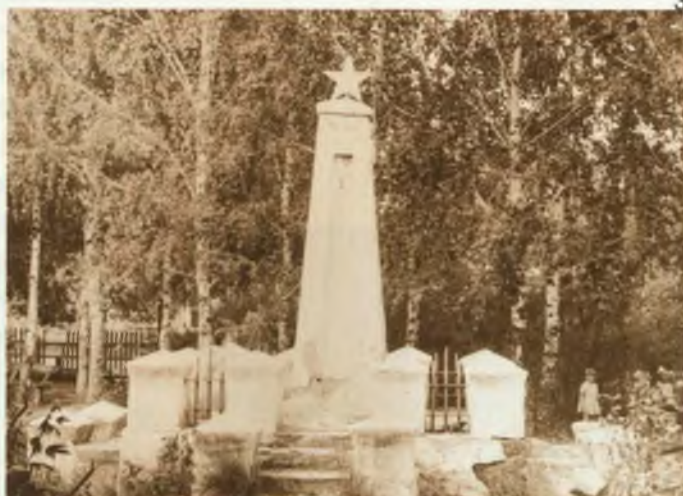
Ивановича – активного участника гражданской войны.