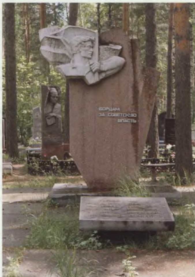
Город Асбест. Памятный знак в честь участников установления советской власти и гражданской войны.