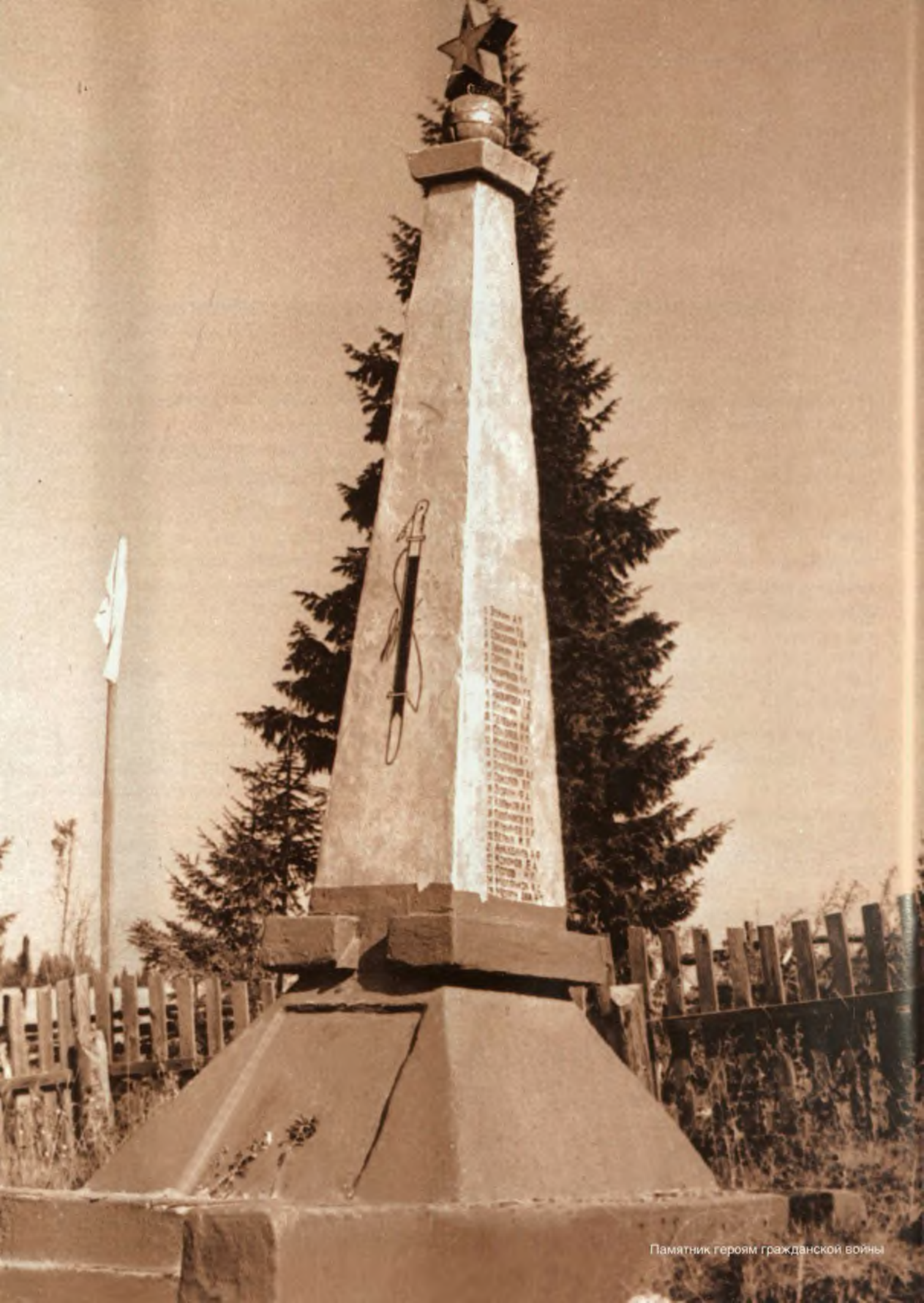
Памятник героям гражданской войны