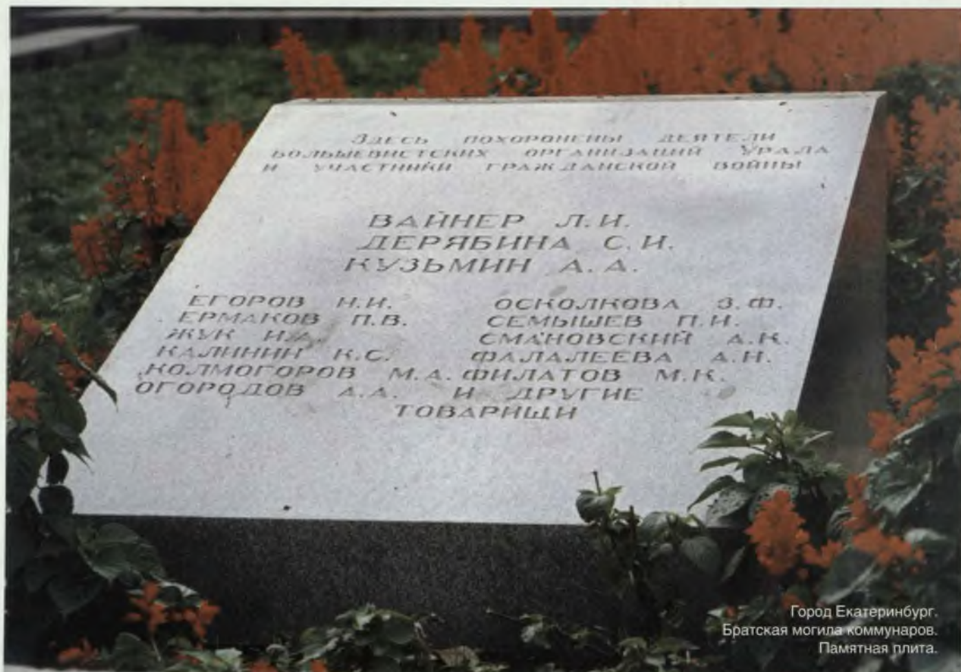
Город Екатеринбург. Братская могила коммунаров. Памятная плита.

В 1919–1920 годах площадь становится традиционным местом захоронения уральских коммунаров, сложивших свои головы в борьбе за Советский Урал. Здесь похоронены верх-исетские рабочие-красногвардейцы, погибшие в боях с контрреволюцией, а также