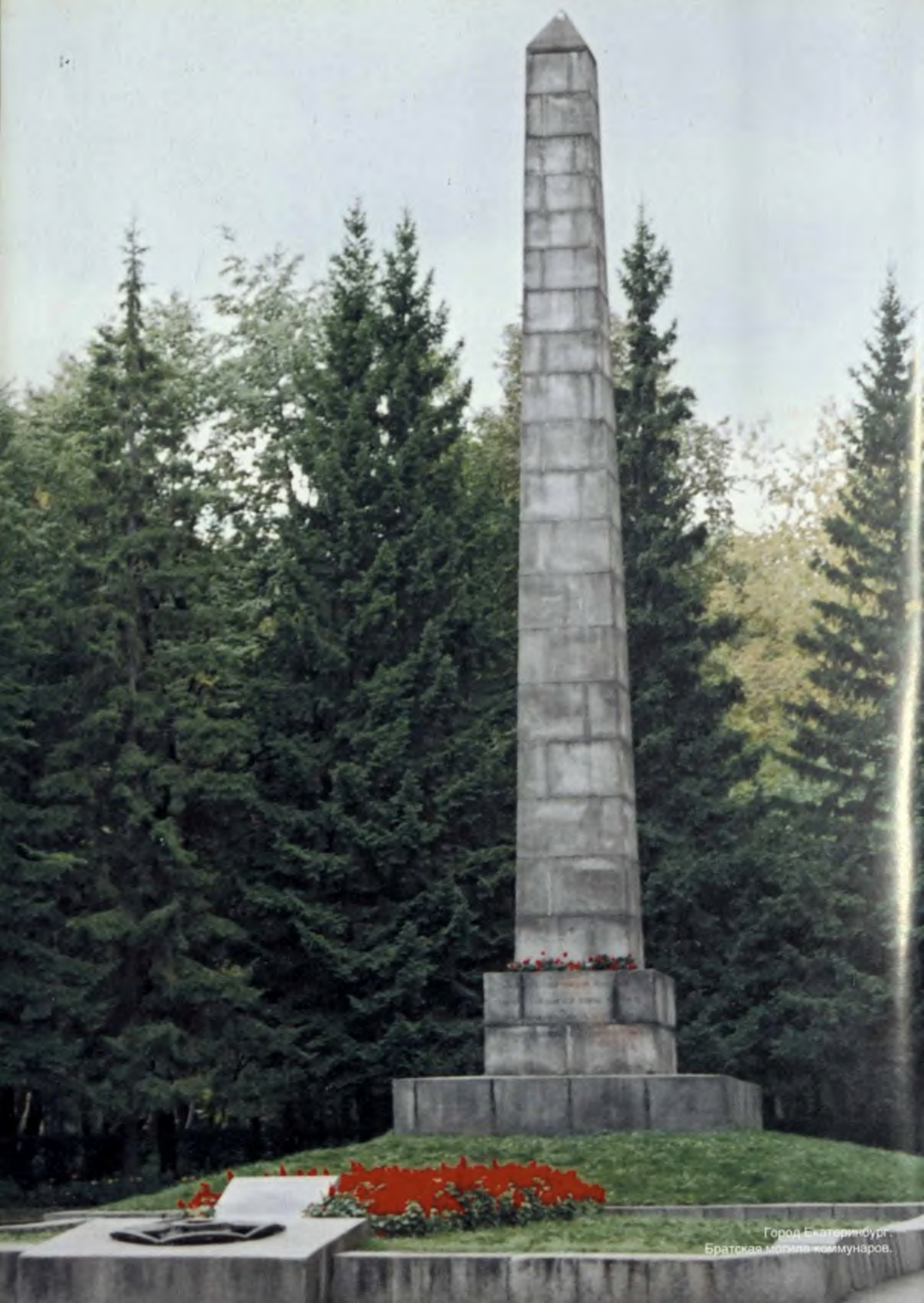
Город Благояинбург. Братская могила коммунаров.