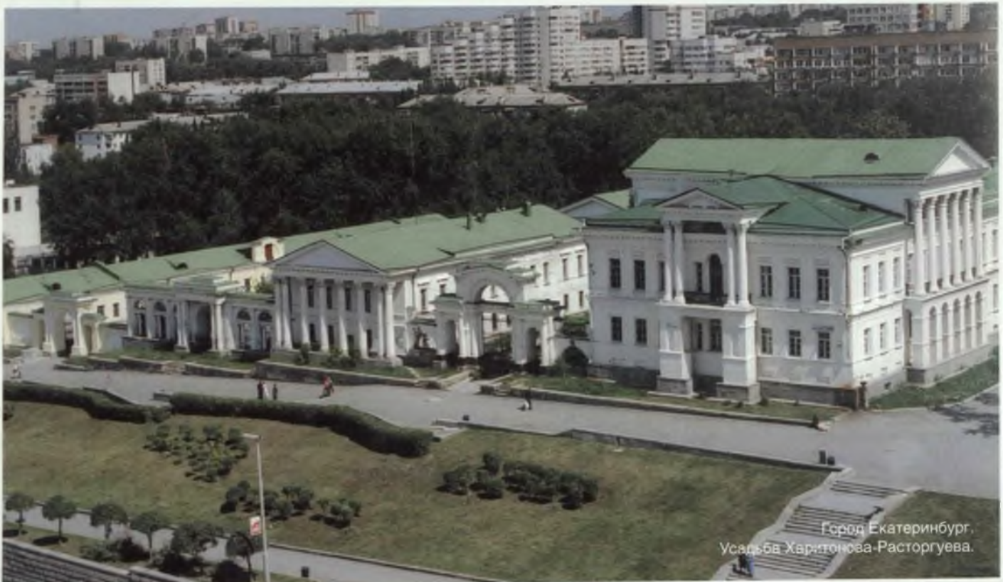
Город Екатеринбург. Усадьба Храмцова-Расторгуева.