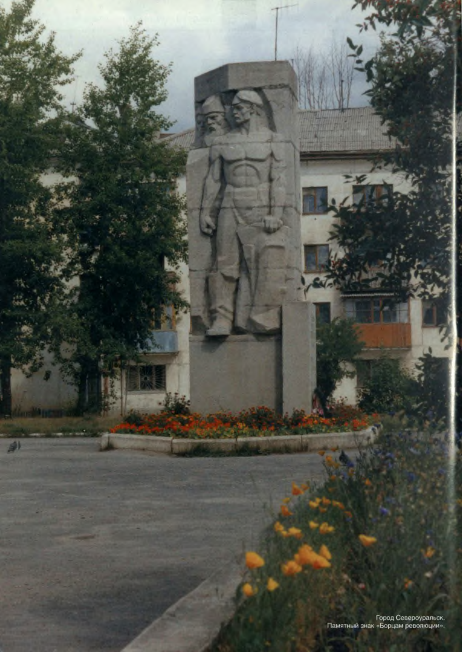
Город Североуральск. Памятный знак «Борцам революции».