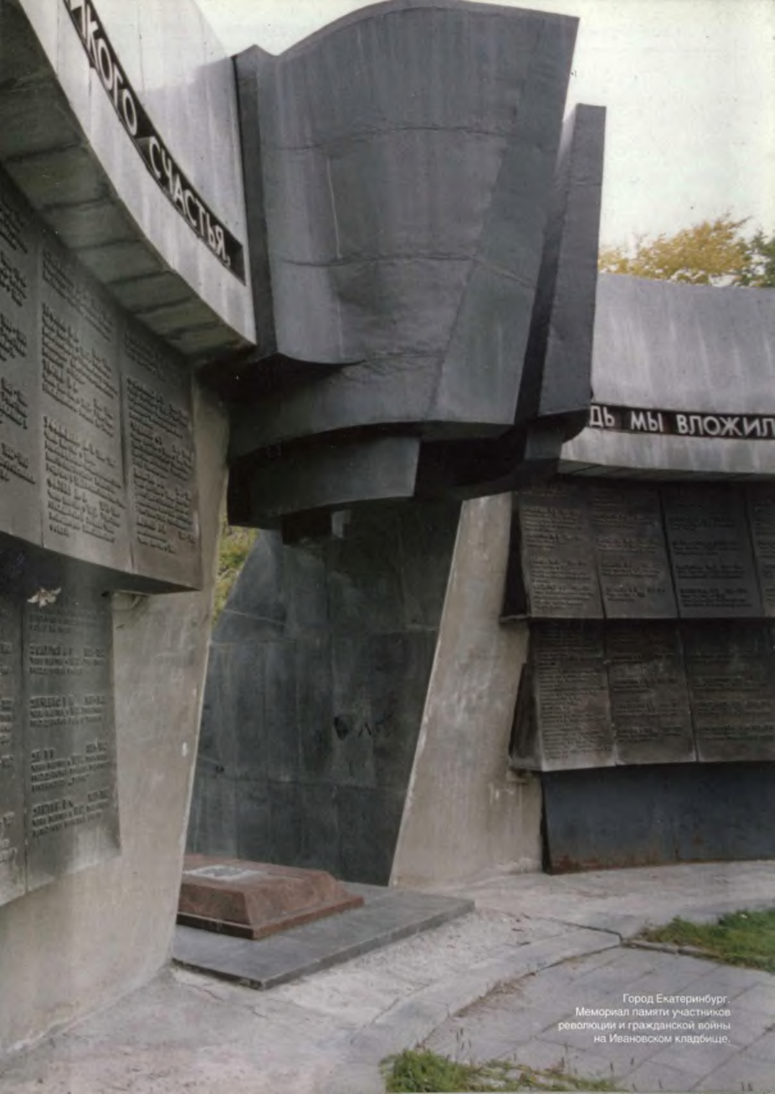
Город Екатеринбург. Мемориал памяти участников революции и гражданской войны на Ивановском кладбище.