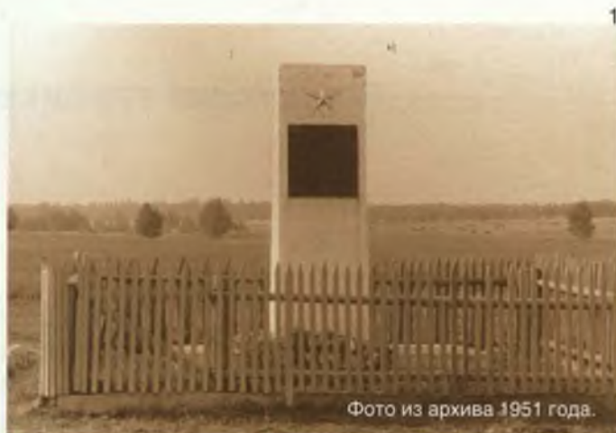
Фото из архива 1951 года.