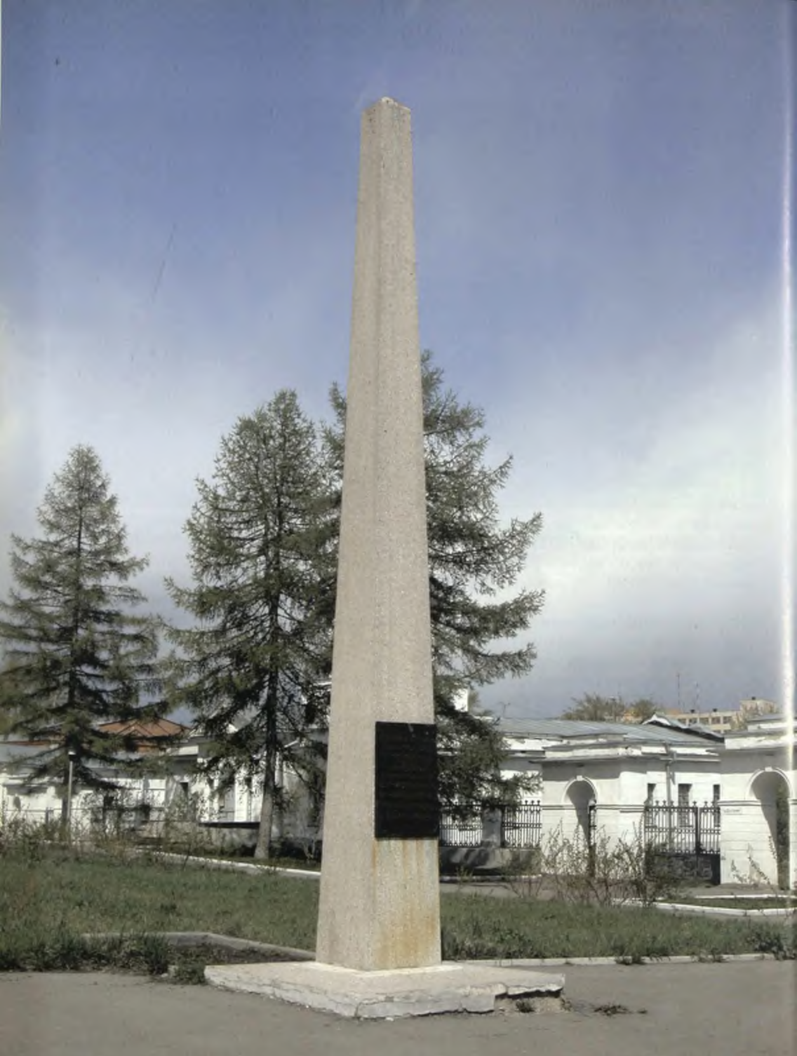
Город Каменск-Уральский. Обелиск «Героям и жертвам гражданской войны 1918–1921 годов»