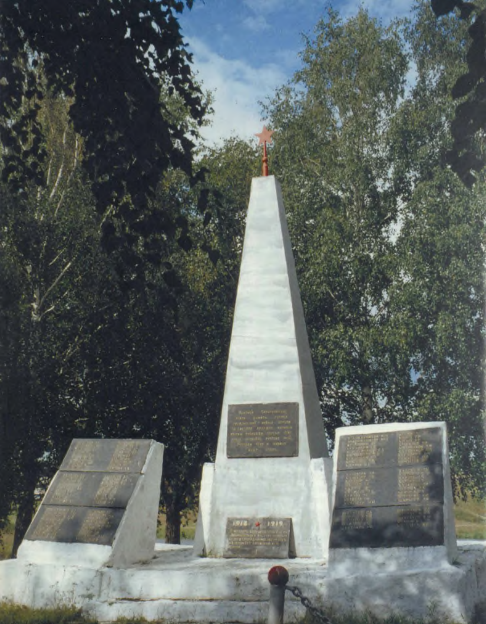
Село Нижняя Синячиха. Памятный знак в честь земляков, погибших на фронтах гражданской войны в 1918–1919 годах.