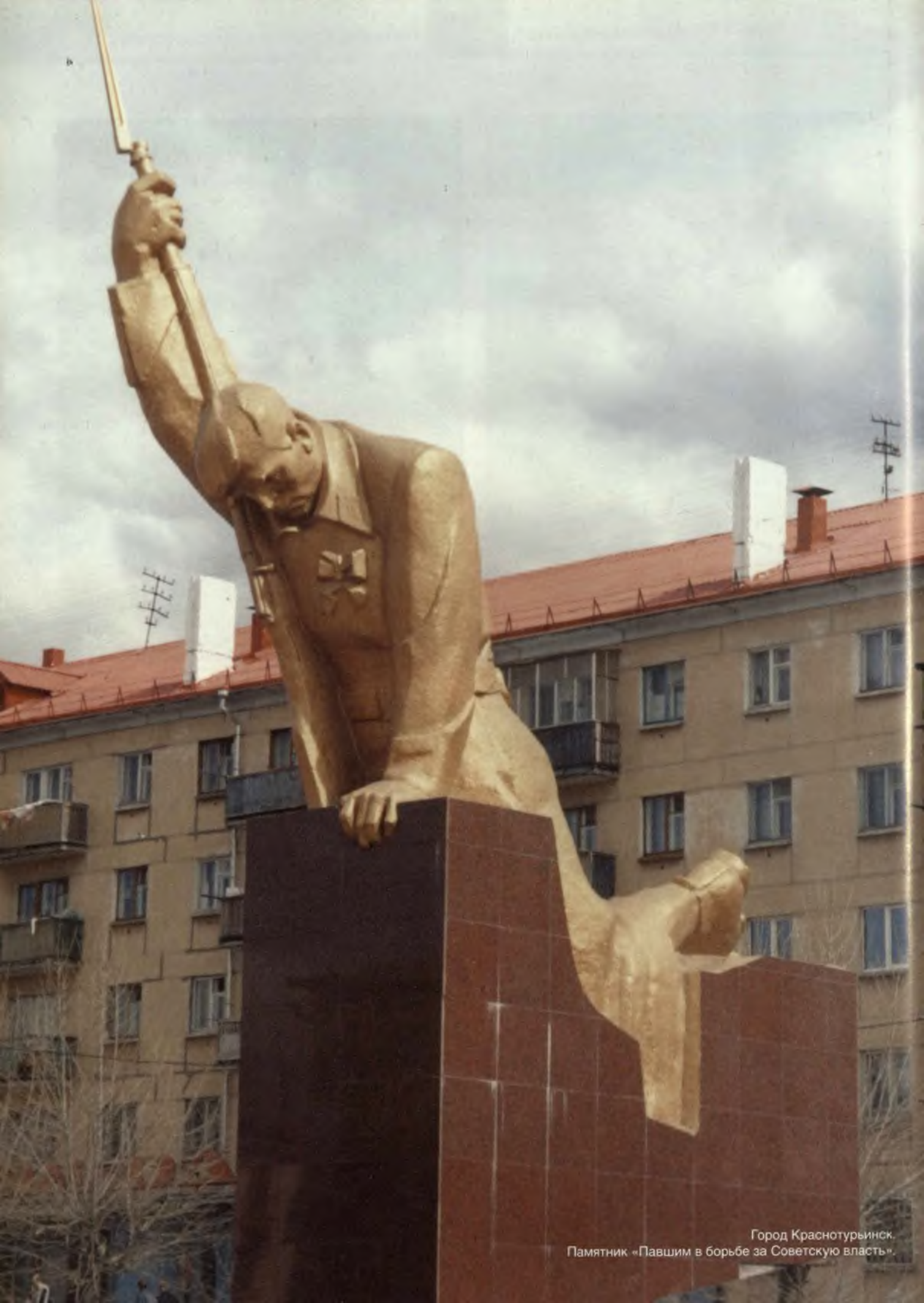
Город Краснотурийск. Памятник «Павшим в борьбе за Советскую власть».