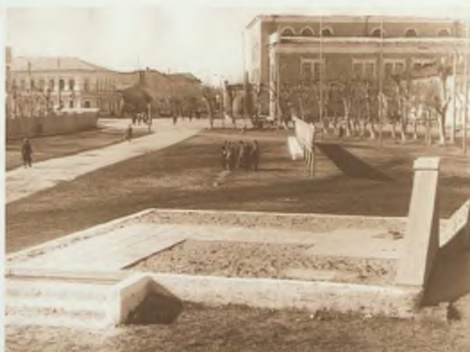
Город Ирбит. Памятники «Борцам за власть Советов» и «Вечная память борцам революции» до реконструкции.