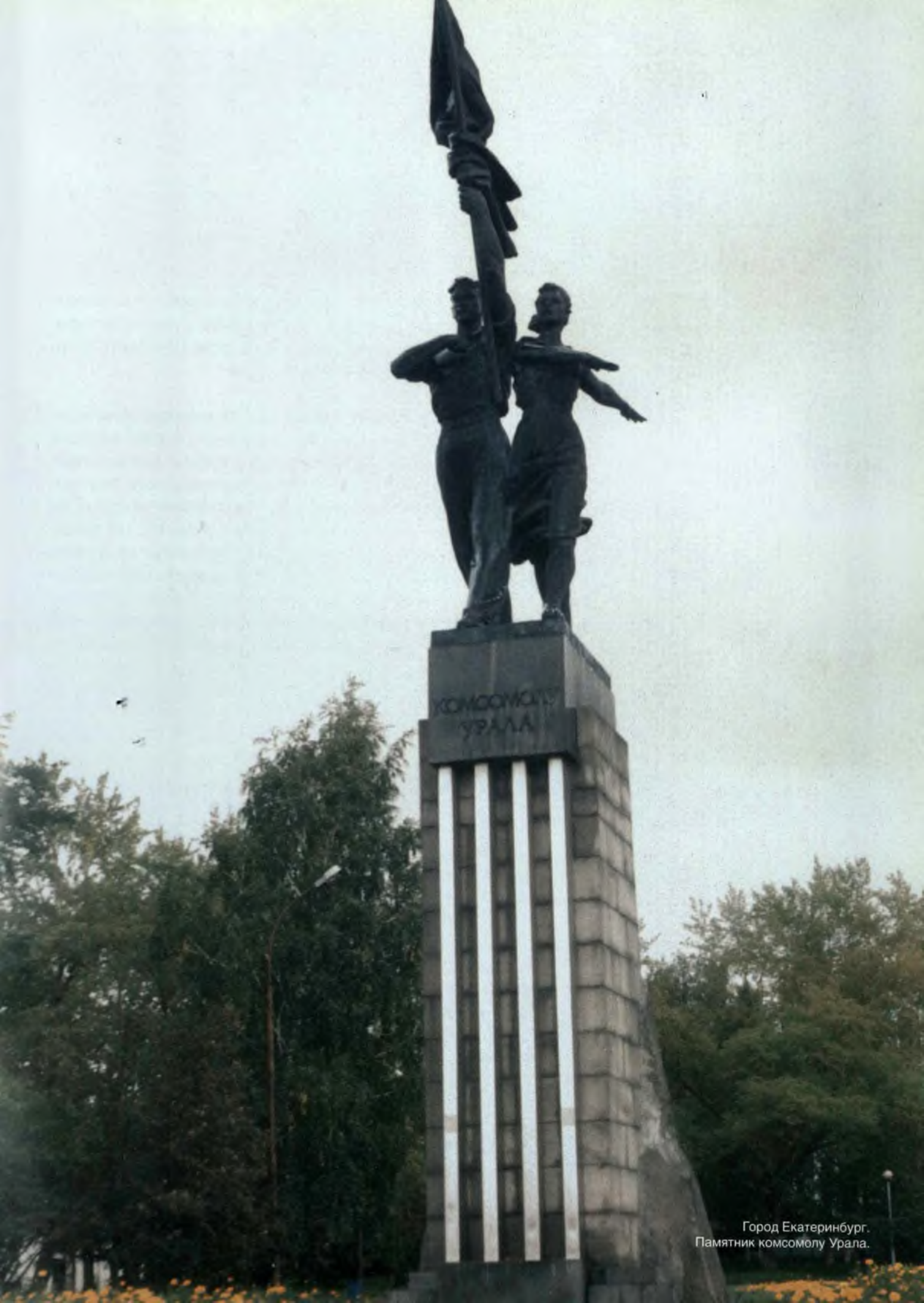
Город Екатеринбург. Памятник комсомолу Урала.