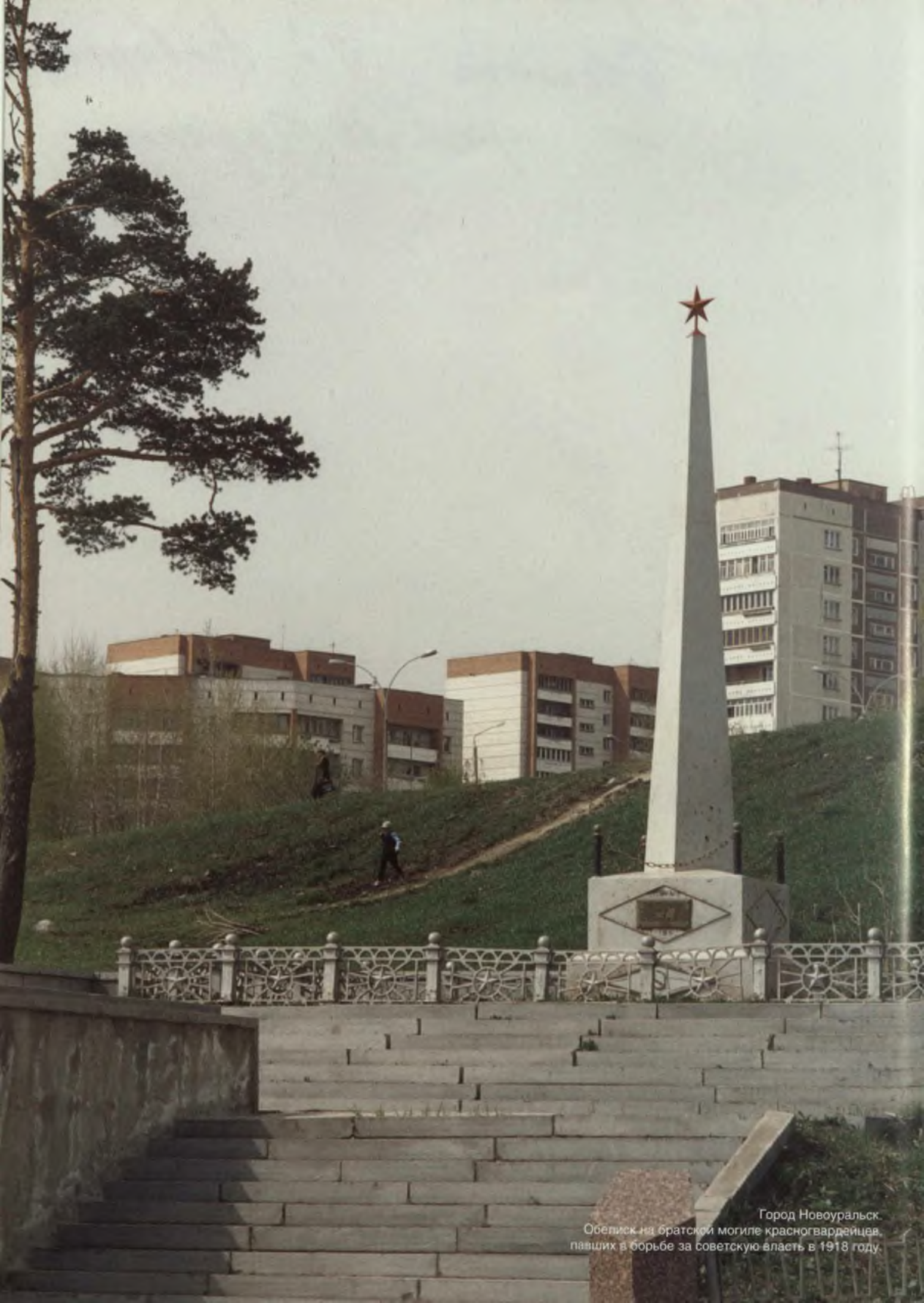
Город Новоуральск. Обелиск на братской могиле красногвардейцев, павших в борьбе за советскую власть в 1918 году.