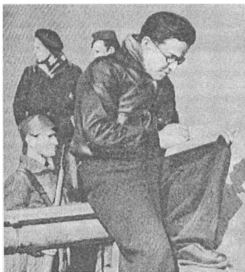
М. Е. Кольцов на передовой линии фронта. 1936 г.