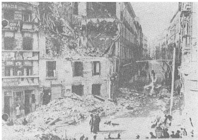
Мадрид после бомбардировки