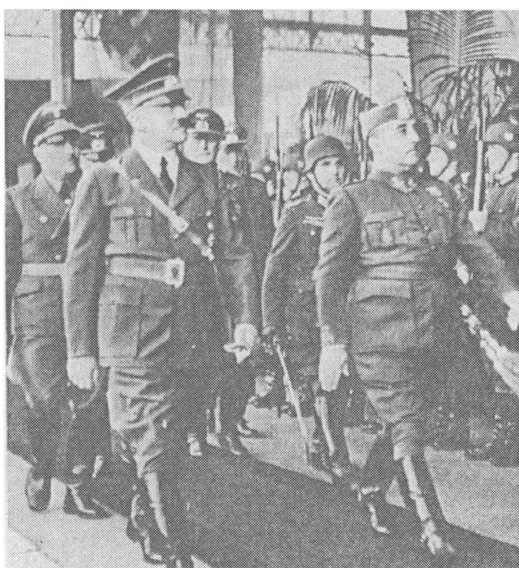
Союзники. А. Гитлер и Ф. Франко