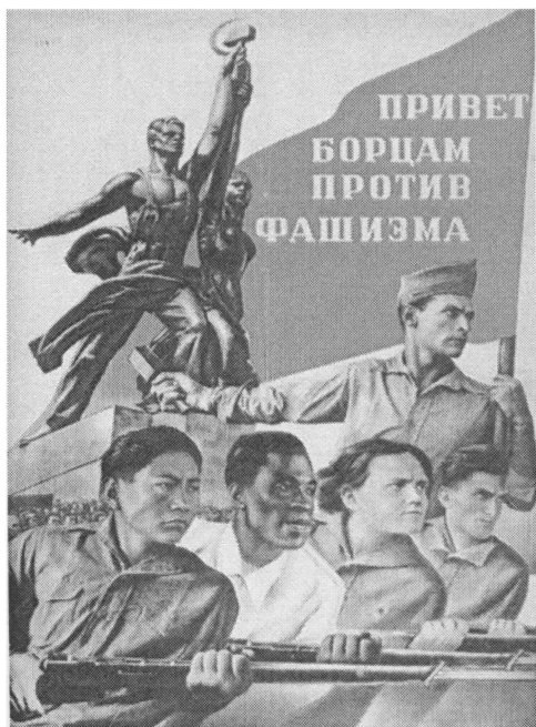
Плакат художника В. Корецкого. 1937 г.