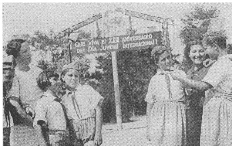
Эвакуированные в СССР испанские дети