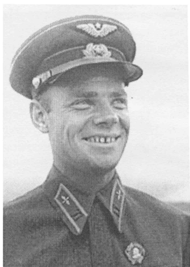
С. И. Грицевец