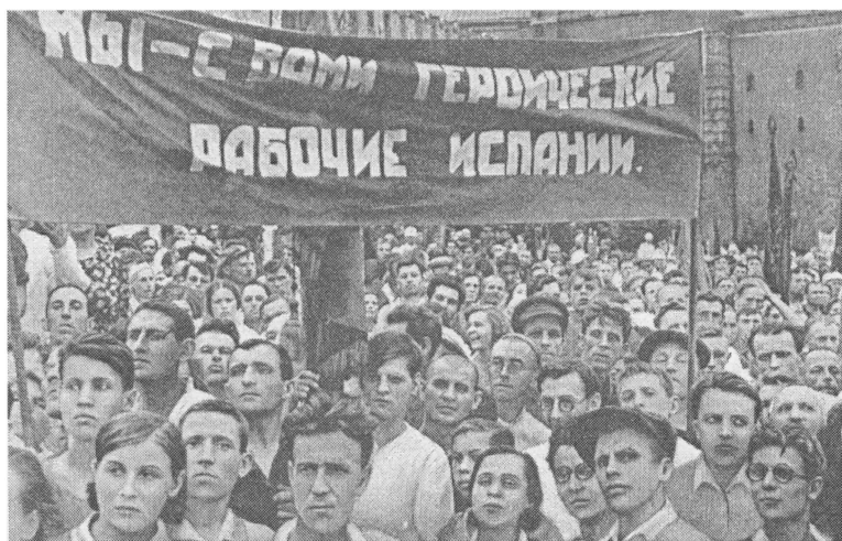
Митинг в поддержку Испанской республики. 1936 г.