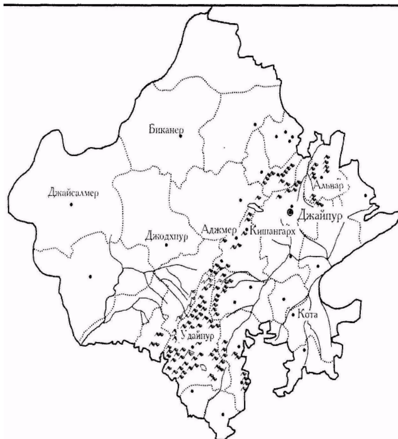
Главные города и княжества Раджастхана