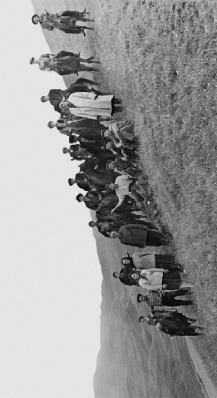
Чечня, группа живогноводов с. Игум-Кале на пастбище. 1970 г.