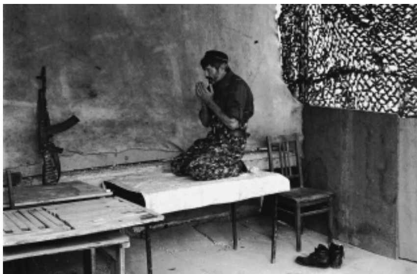
Намаз с “Калашниковым”

ствольника. Когда польхнуло в окне, ребята, видимо, не поняли, что грохнули его, иначе они раньше меня бросились бы за трофеем, у снайперов-то оружие дорогое. А я понял раньше, что ребята его достали и с другой стороны дома сквозанул в проем. Ребята еще гроыхали, а я первым подбежал к снайперу, кажется, он был еще живой. Да при нем же деньги были. И схватил, что мне причитается, и опять ринулся в свой проем. Те ребята, должно быть, потом удивлялись, не найдя оружия. Ан не зевай! Сами виноваты. Такой порядок, пусть сами на себя обижаются» (Халид).