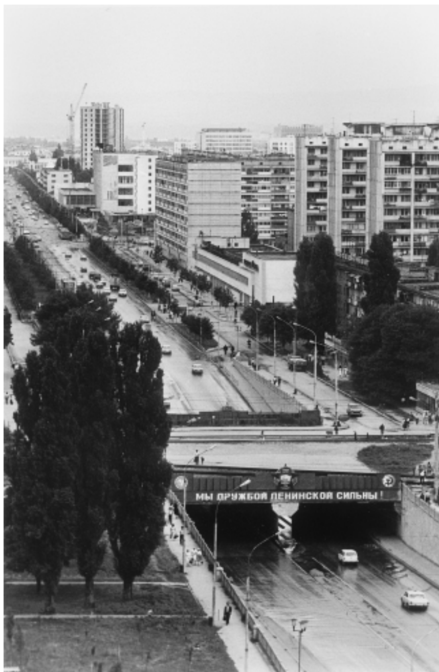
Город Грозный. 1985 г.