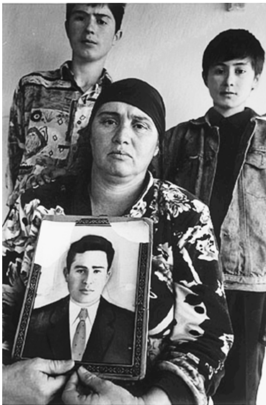
Чеченка с фотографией покойного мужа и с детьми