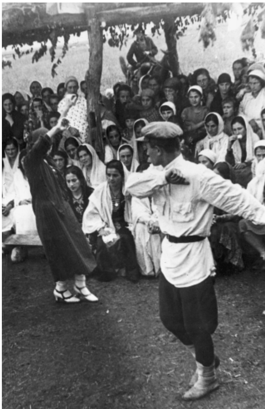
Чечня, жители с. Урус-Мартан. 1939 г.