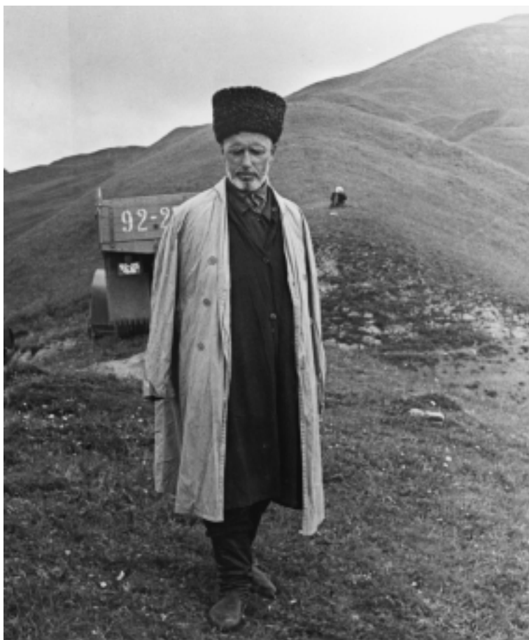
Чеченец с. Саярсана Ножай-Юртовского района. 1970 г.

вследствие их подозрительности, склонности к коварству и суровости, выработавшихся, вероятно, во время вековой борьбы (?). Неукротимость, храбрость, ловкость, выносливость, спокойствие в борьбе – черты чеченцев, давно признанные всеми, даже их врагами. В обыкновенное время идеал чеченцев – грабеж. Угнать скот, увести женщин и детей, хотя бы для этого пришлось ползти по земле десятки верст и при этом рисковать своей жизнью – любимое дело чеченца....Во время своей независимости (?) чеченцы, в противоположность черкесам, не знали феодального устройства и сословных разделений. В их самостоятельных общинах, управлявшихся народными собраниями (?), все были абсолютно равны (?). Мы все “уздени” (т.е. свободные, равные), говорят теперь чеченцы. У немногих только племен были ханы, наследственная власть которых ведет свое на-