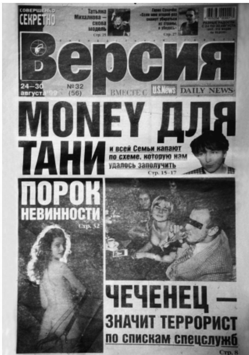
Первая страница газеты “Версия”