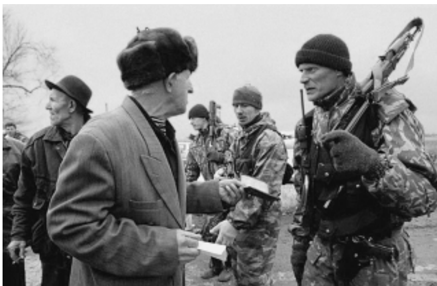
Блокпост “Кавказ”

мориал” 11 . Имеются достоверные свидетельства о том, что основные жертвы воюющие и мирные граждане понесли в начальный период войны. Хорошо известны многочисленные случаи, когда в условиях жестоких боев в Грозном и в других местах убитых и даже раненых не вывозили. Тема брошенных трупов – стала одной из главных в военных историях. Она обросла чудовищными слухами, в которые люди верили и рассказывали друг другу уже после войны.