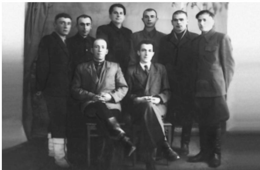
Комсомольский актив Назрановского района Чечено-Ингушетии. 1959 г.

в Казахстане и Киргизии 524 тыс. человек (418 тыс. чеченцев и 106 тыс. ингушей) в Чечено-Ингушетию прибыло 432 тыс. (356 тыс. чеченцев и 76 тыс. ингушей), в Дагестан – 28 тыс. (в основном чеченцы) и в Северную Осетию – 8 тыс. ингушей. Таким образом, общее население республики составило 892,4 тыс. человек, из них 432 тыс. – чеченцы и ингуши. В Казахстане остались проживать 34 тыс. чеченцев и 22 тыс. ингушей (в этой же справке приводится и другая цифра: на 15 октября 1960 г. на территории Казахстана – около 100 тыс. и на территории Киргизии 6 тыс. чеченцев и ингушей).