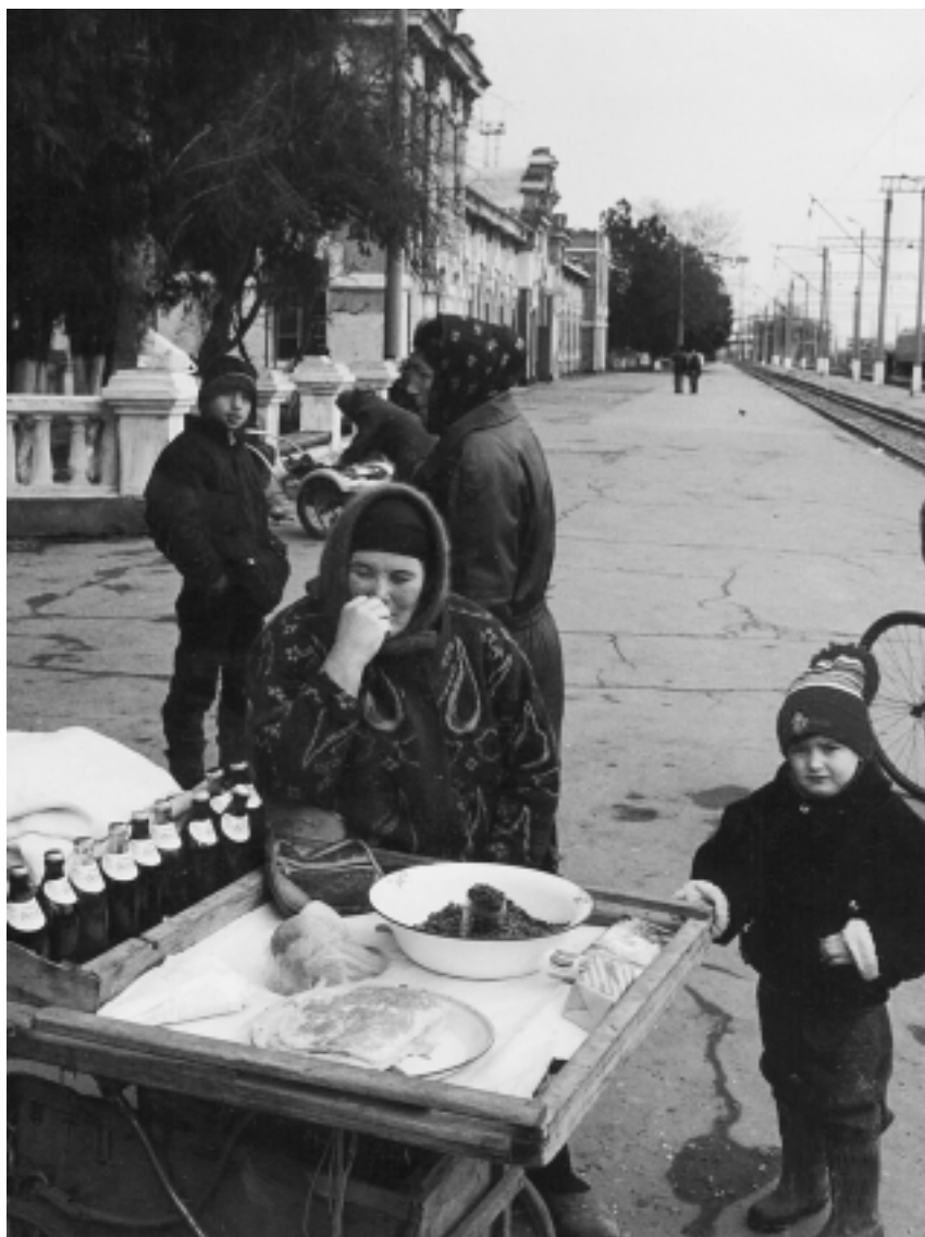
Торгующая женщина на вокзале в Гудермесе

имел 530 га посевов пшеницы и ячменя и получил средний урожай 21 ц. с га. Буквально “сидя на нефти”, сельские хозяйства испытывали недостаток горючего и смазочных материалов, а также сельскохозяйственных машин (тракторов, комбайнов). Крупного рогатого скота и овец в Чечне сохранилось столько, сколько в прошлом было в одном только крупном хозяйстве.