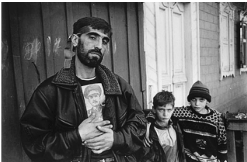
Молодые чеченцы с портретом Джохара Дудаева

“Дудаев для меня был хорош тем, что он, когда в ящик (речь идет о телевизоре. – В.Т.) скажет два слова, сразу ясно, что надо делать. А у других мало что поймешь. Если он вернется, тогда весь Кавказ будет его” (Ахьяд).