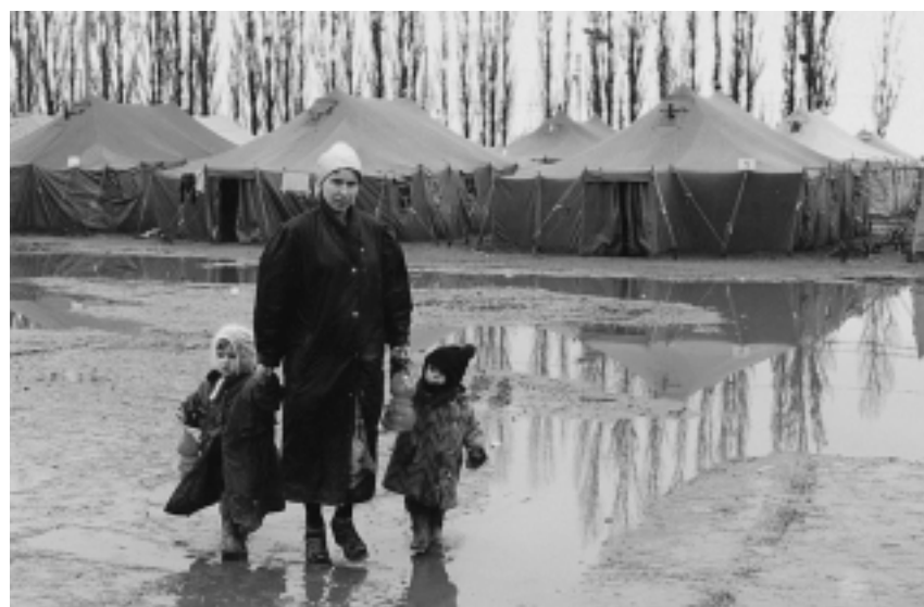
Палаточный городок беженцев в с. Знаменское