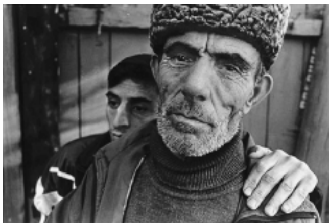
Отец и сын

качь. Сначала пошел средний, воевал. Приходил к нам, сюда домой, когда мы скрывались здесь в подвале. Младшего я поначалу не отпускал. Но, видно, он посмотрел на старшего брата и сам ушел. Когда уходил старший, я не противился. Знал, что люди попрекнут, что он отлынивал, когда всем миром воевали. А младшего не отпускал от себя. Все-таки опора мне – старику. Должно быть, чуял я недоброе. Погиб младший. Я, видишь, и на финской побывал, и в отечественной воевал. После последней войны, видишь, хромой сделался. Я долго в толк не мог взять, с кем теперь воюем. Вроде бы одна страна. Помню, когда на отечественную призывали, колонну нашу провели вот тут же по Первомайской. А теперь по этой же Первомайской двигались российские войска. Вроде бы мир перевернулся” (Вадуд).