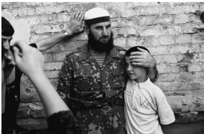
Чеченский боевик с ребенком

Но потом ему удалось выйти из этого состояния. В апреле он приехал в Махачкалу, навестил нас. Решил, что там нам безопаснее. Грозный был еще заминирован, там были федералы.