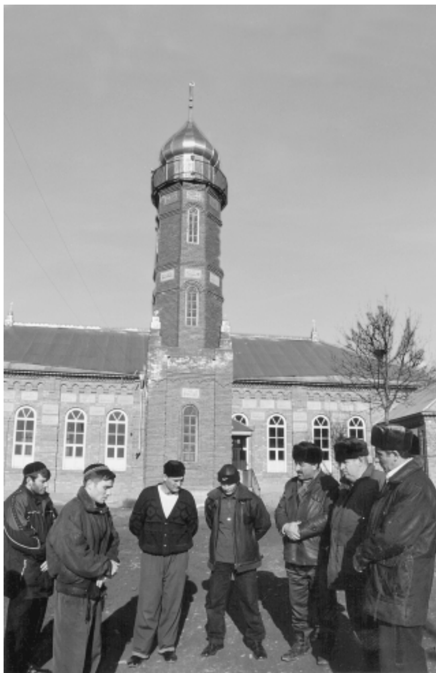
Сельская мечеть