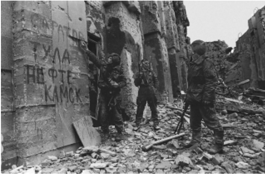
“Федералы” у стен чеченского “рейхстага”

“противник” или “враг“ вовлеченные в конфликт стороны подразумевают смутные категории. Для чеченцев это были “федералы”, “русские”, “оккупанты”, “агрессоры”, “неверные”, “гяуры”. Для федеральных российских солдат в Чечне – “бандиты”, “духи”, “нохчи”, “душманы”, “чечены”, “боевики”, “террористы”, но с самого начала и всегда это были “не наши”, хотя речь шла о согражданах (как выразился один из чеченцев, “я бы мог служить и воевать с этими ребятами в одной армии” ).