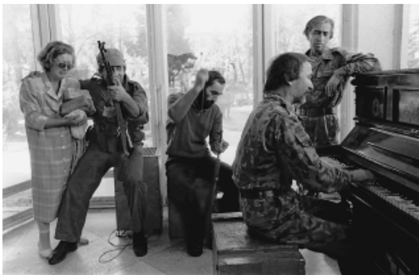
Музыкальный ансамбль боевиков