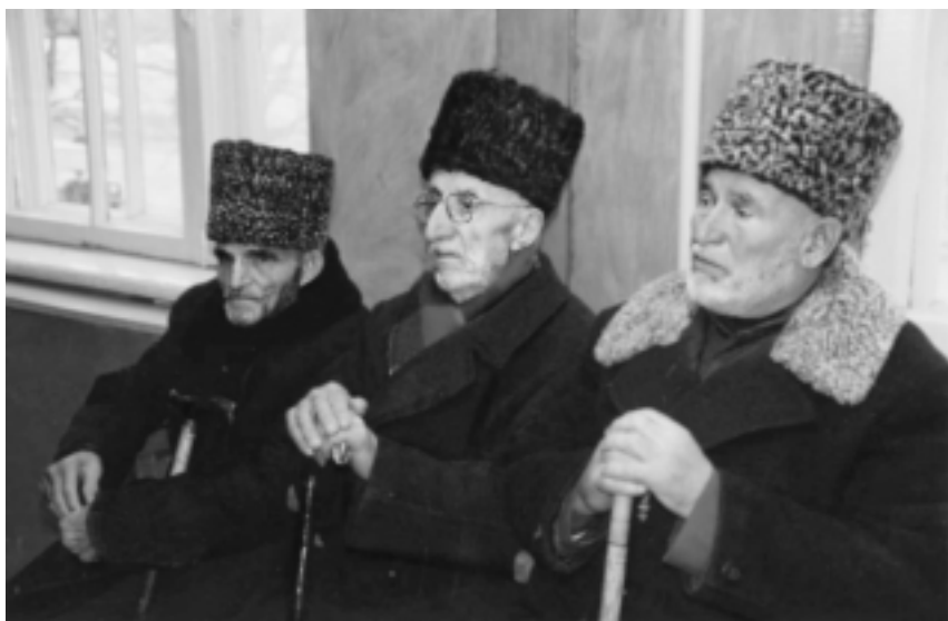
Старейшины с. Толстой-Юрт

сыграл учитель-мулла, который, показывая, прекратив занятия, поощрял действия детей, в том числе деньгами, которые выплачивались за участие в митинге.