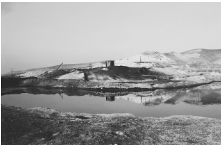
Подпольный нефтяной мини-завод

“По разбитым пыльным дорогам, не давая прохода пешеходам, движутся тысячи приватизированных, ворованных, без госномеров автомашин и большое количество нефтевозов. Столбы пыли вместе с выбрасываемым гаром горючего они оставляют для жителей этих сел, как мука из сита все это оседает на зданиях Курчалойской больницы, на деревьях и жилых постройках. Черные тучи над селами появляются из-за злосчастного нефтеварения. Если сами мы не осознаем, что оно наносит вред нашему здоровью, нашим детям, будем ожидать, пока порядок наведут властные органы, то глотать эту отраву придется долго. Нет секрета для местных жителей, кто и где занимается варкой нефти. Но нет примера, когда жители аулов вышли бы на дорогу и запретили проезд нефтевозов через их аулы и земли” 14 .