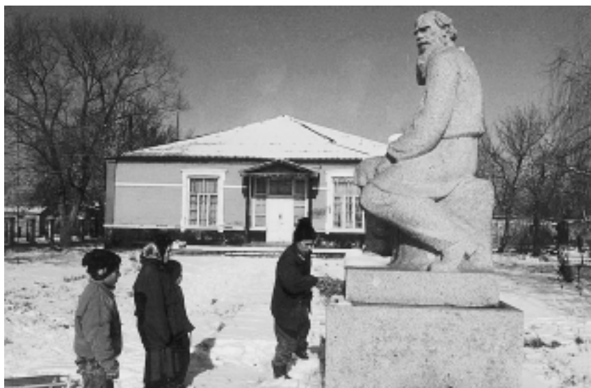
Памятник и дом-музей Л.Н. Толстому в Толстой-Юрте

публики ежедневно получало около 1 млн экземпляров периодических изданий 19 . В республике было несколько профессиональных союзов (писателей, художников, композиторов журналистов и другие).