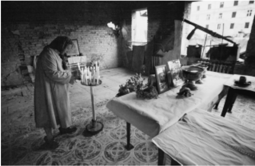
В разрушенной православной церкви Грозного

– Я считаю, что полученное нами образование хорошее. Но вот сегодня традиционному образованию, которое мы получили, навязывается альтернатива. Эта альтернатива связана с какими-то восточными образовательными и культурными ценностями, с арабо-мусульманскими ценностями. Что нам лучше? Все-таки я считаю, что чеченцы и вообще кавказцы – другая цивилизация, чем арабо-бедуинская или западная цивилизация.