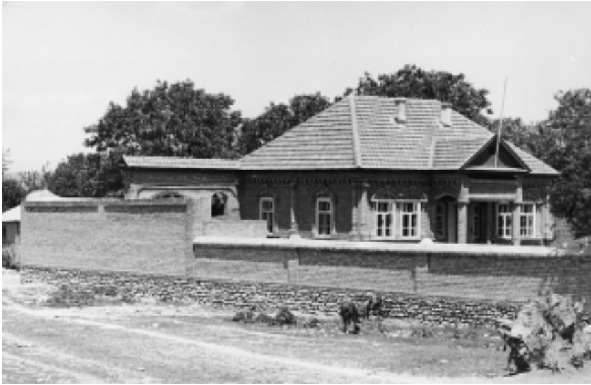
Чечня, дом колхозника в с. Маиртуп. 1969 г.