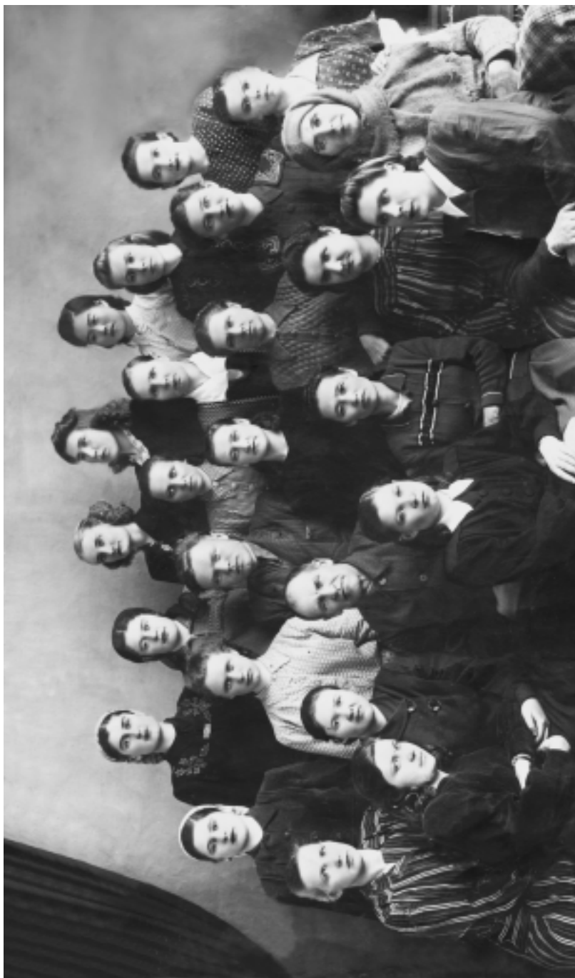
Коллектив швейной фабрики в Павлодаре. 1951 г.