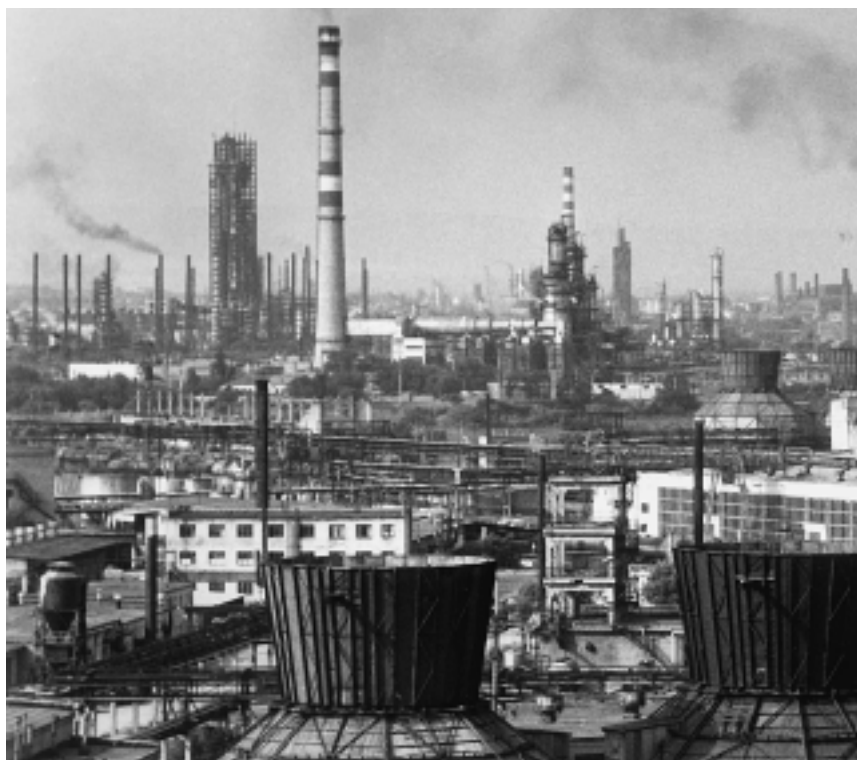
Грозненский нефтехимический комплекс. 1985 г.

разование. Д. Гакаев отмечает еще один важный аспект социальной ситуации: