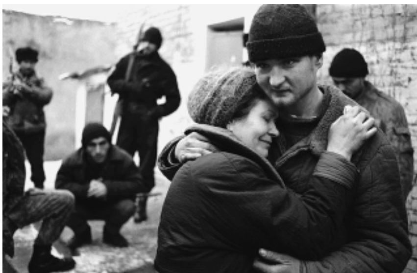
Освобождение заложника

тастазы потянулись в Поволжье, на Урал и в Москву. И практически во всех сводках, информационных сообщениях, показаниях фигурировала Чечня как организатор, исполнитель или соучастник этого опасного и разного вида преступления. К этому времени Чеченская республика не только выпала из-под юрисдикции российских законов и оказалась вне зоны действия российских спецслужб. Чечня под дулами автоматов неуклонно катилась в дикое и кровавое средневековье. Сейчас вряд ли кто сможет сказать, сколько сотен самих чеченцев были унижены похищением родственников и уплатой выкупа за них, но факты свидетельствуют, что в первую очередь от кавказского киднеппинга пострадал чеченский народ. Сказать, что власти неадекватно отреагировали на похищения, а практически на организованную работоторговлю значит выразиться предельно мягко и деликатно. Ситуация развивалась весьма скверно” 1 .