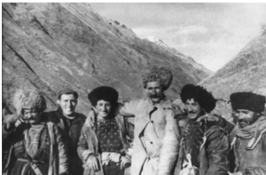
Чечня, жители с. Мелхисты. 1939 г.

территорию между реками Аксаем, Сунжей и Большим Кавказским хребтом, а ныне живущая смешанно с русскими и кумыками в Терской области, между Тереком и южной границей области”. Всех чеченцев, не считая ингушей, числилось на 1887 г. 195 тыс. Свое название они ведут от названия аула Большой Чечен, “служившего некогда центральным пунктом для всех собраний, на которых обсуждались военные планы против России” (?). О древнейших судьбах чеченского племени не имеется никаких данных, кроме фантастических легенд о чужеземцах (арабах), основателях этого народа. До 1840 г. отношение чеченцев к России было более или менее мирное, “но в этом году они изменили своему нейтралитету и, озлобленные требованием со стороны русских о выдаче оружия, перешли на сторону известного Шамиля, под предводительством которого в течение почти 20 лет вели отчаянную борьбу против России, стоившую последней огромных жертв. После войны часть чеченцев эмигрировала в Турцию, а часть переселилась с гор на плоскость”.