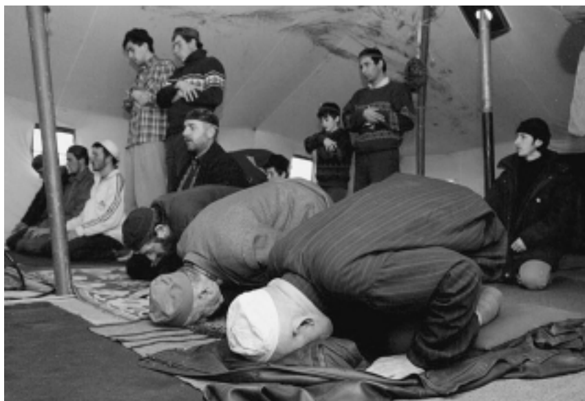
Чеченцы совершают намаз

ни и сторонились политики. До этого они действовали в местах проживания и ограничивались дежурными призывами о необходимости укрепления власти в республике. Деятели таррикатистского ислама вплоть до 1996 г. удавалось сдерживать религиозных экстремистов. Ваххабиты терпели поражение в идеологическом противостоянии с традиционным духовенством Чечни, и к 1996 г. о них почти забыли. Наоборот, тарикатный ислам заметно укрепился и стал на виду, хотя, кроме запрета на алкоголь, чеченское духовенство не стремилось радикально изменить светский образ жизни в республике. Его требования носили умеренный характер и были направлены на создание удобств желающим молиться в любом месте. В учреждениях и организациях стали открываться моленные комнаты. Однако по причине общей разрухи новые мечети фактически не строились.