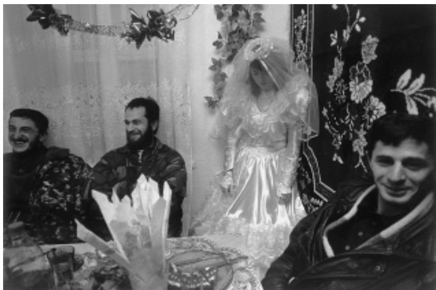
Чеченская свадьба в годы войны