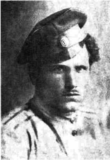
Фото из книги В. А. Шулдякова Гибель Сибирского казачьего войска. Кн. 2. 1920–1922. М., 2004.