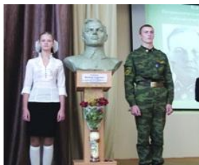
«Глазковцы» в почётном карауле