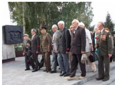
Возложение цветов к мемориалу погибшим землякам. с. Бондари

Благодаря кропотливой работе земляков – поисковиков, учащихся местных школ во вновь отстроенном современном дворце знаний – Бондарской средней школе, – открыт замечательный музей, где несколько стендов и витрин посвящены народному герою.