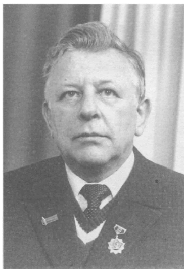
К.Э. Соколовский, помощник министра сельского строительства СССР