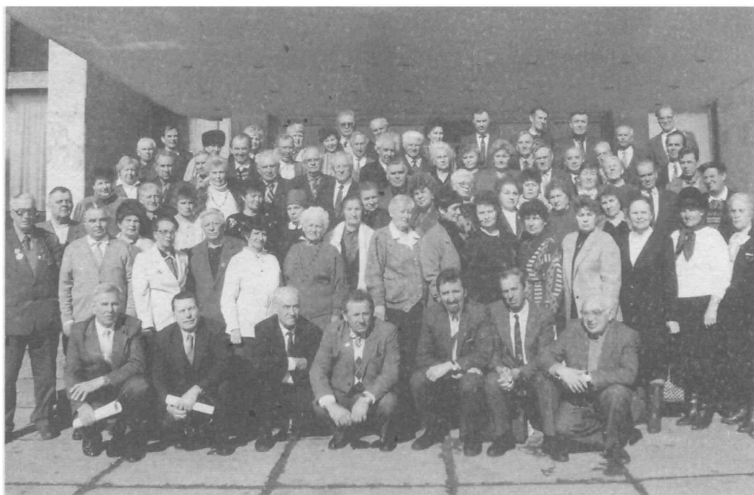
Делегаты и гости I съезда Белорусской ассоциации бывших несовершеннолетних узников фашизма. 1996 г.