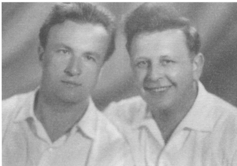
Бывший партизан, заслуженный архитектор БССР, лауреат Государственных премий БССР И.И. Бовт (слева) и К.Э. Соколовский. 1960-е гг.