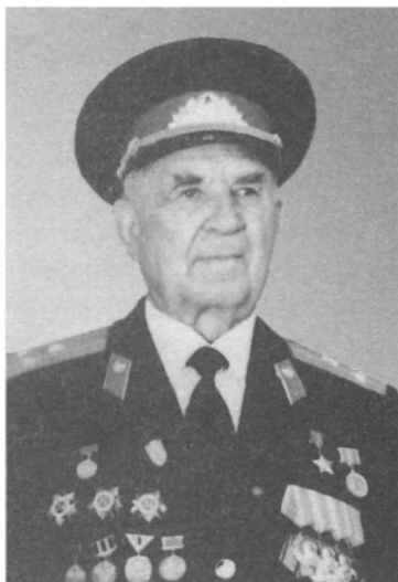
Герой Советского Союза Р.Н. Мачульский. 1987 г.