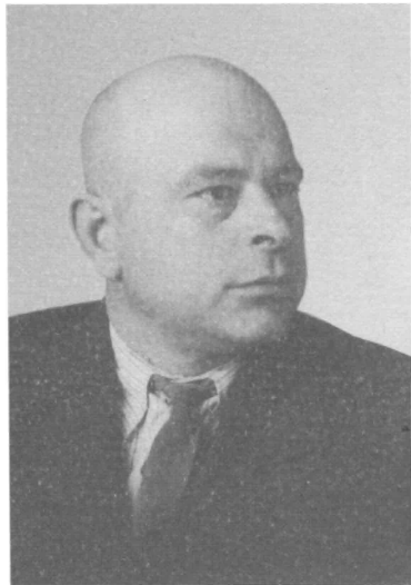
Заместитель министра кинофикации Э.С. Соколовский. 1950-е гг.