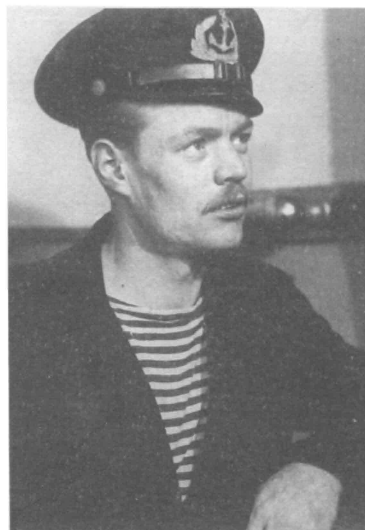
Анатолий Мирасов. 1950-е гг.