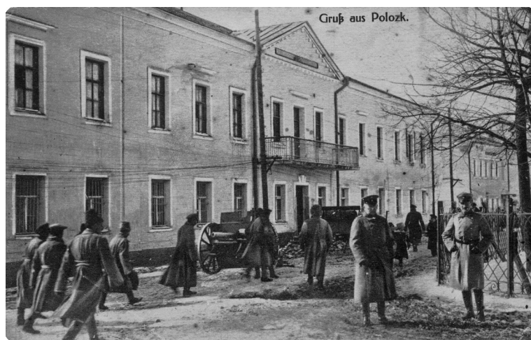
Привет из Полоцка. Немецкая открытка