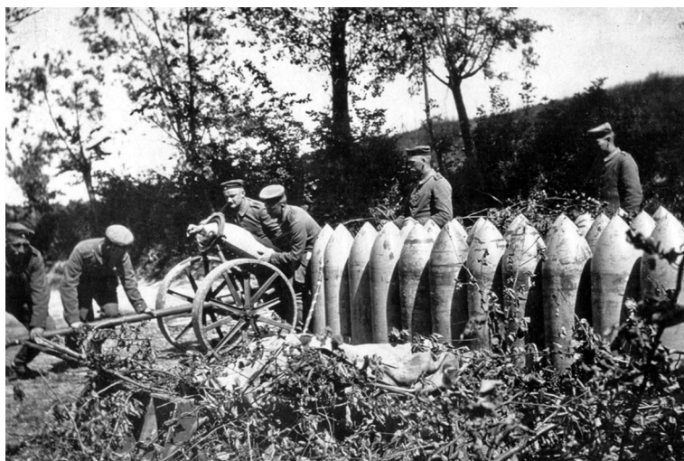
Снаряды для тяжёлого артиллерийского орудия