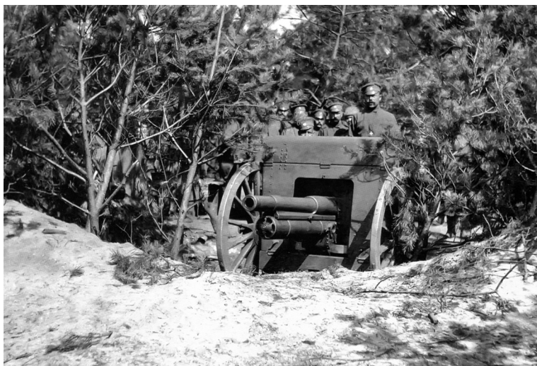
Пушка и артиллерийский расчёт