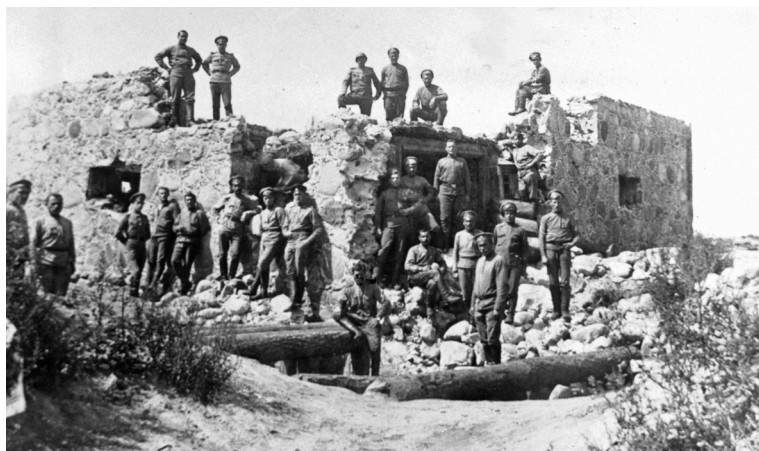
Русские солдаты возле разрушенного здания в д. Замостье Вилейского уезда Виленской губернии. Июль 1917 г.