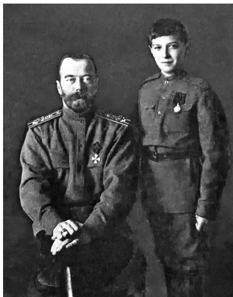
Император Николай II с наследником цесаревичем Алексеем. Ноябрь 1916 г.