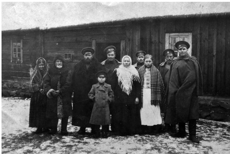
Крестьяне с русскими солдатами. Местечко Любань Вилейского уезда Виленской губернии