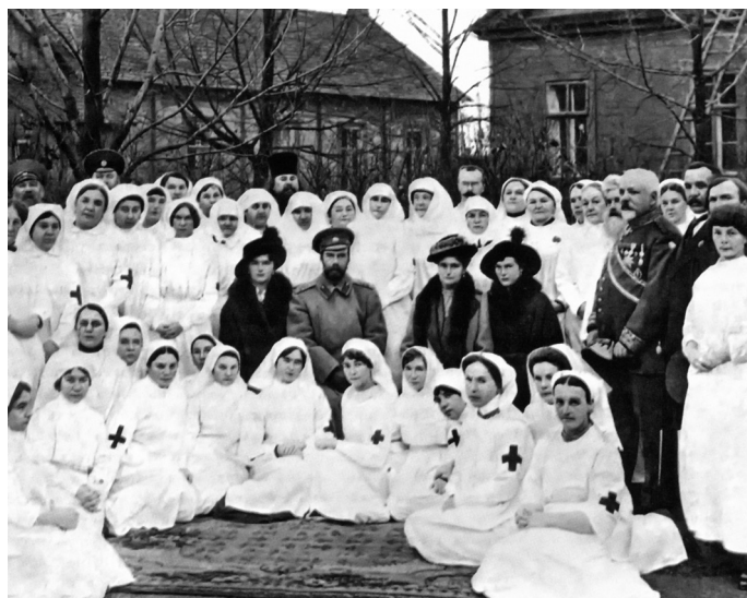
Николай II с императрицей Александрой Фёдоровной и дочерьми Ольгой и Татьяной при посещении земского лазарета. Двинск, 1914 г.