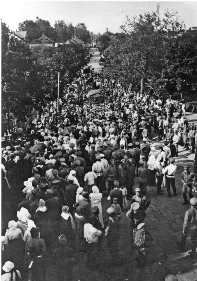
Шествие манифестантов на общий митинг. Несвиж, 18 июня 1917 г.