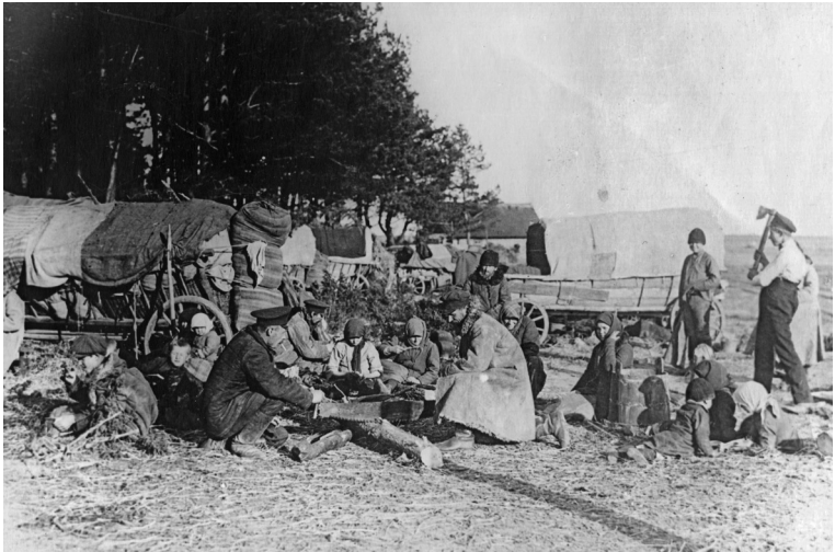
Беженцы в районе станции Барановичи