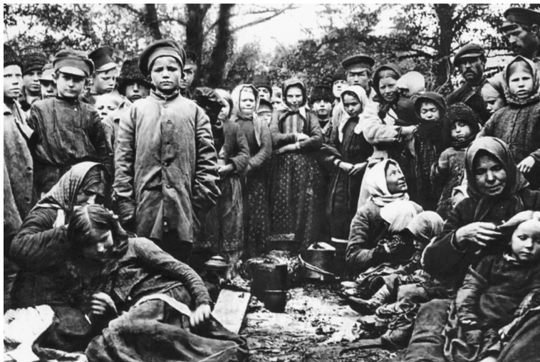
Лагерь беженцев в Слуцке. 1915 г.