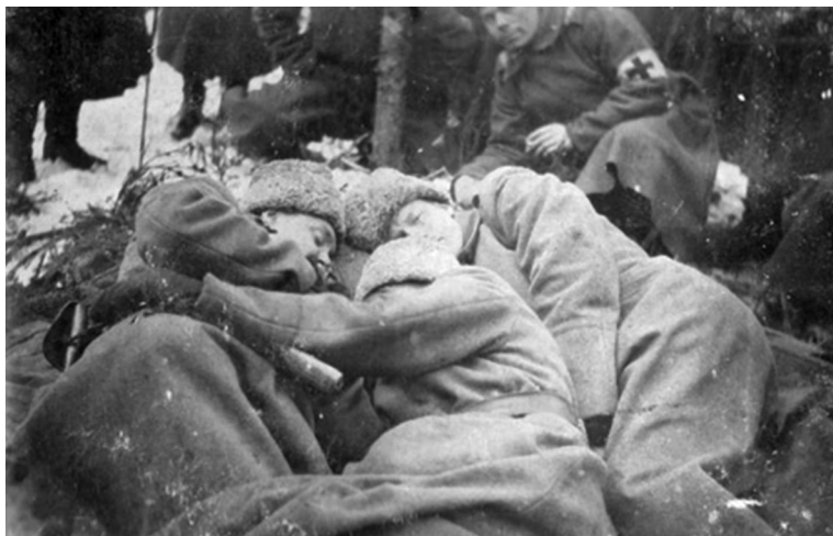
В перерывах между атаками