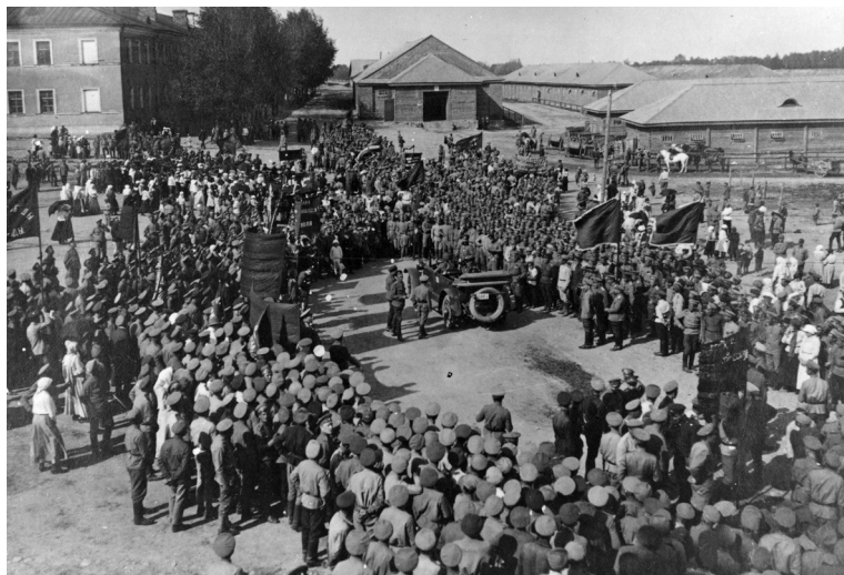
Мирная политическая манифестация в Несвиже (во дворе артиллерийских казарм). 18 июня 1917 г.