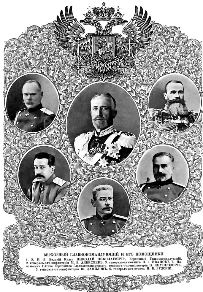
ВЕРХОВНЫЙ ГЛАВНОКОМАНДУЮЩИЙ И ЕГО ПОМОЩНИКИ. 1. Е. П. В. Великий Князь НИКОЛАЙ НИКОЛАЕВИЧ , Верховный Главнокомандующий, 2. генерал-отъ-инфантерій М. В. АЛЕКСЕЕВЪ , 3. генералъ-адъютантъ Н. Г. ИВАНОВЪ , 4. Начальникъ Штаба Верховнаго Главнокомандующаго, генералъ-отъ-инфантерій Н. ЯНУШКЕВИЧЪ , 5. генералъ-отъ-инфантерій Ю. ДАНИЛОВЪ , 6. генералъ-адъютантъ Н. В. РУЗСКИЙ .

Верховный главнокомандующий Великий князь Николай Николаевич и его помощники