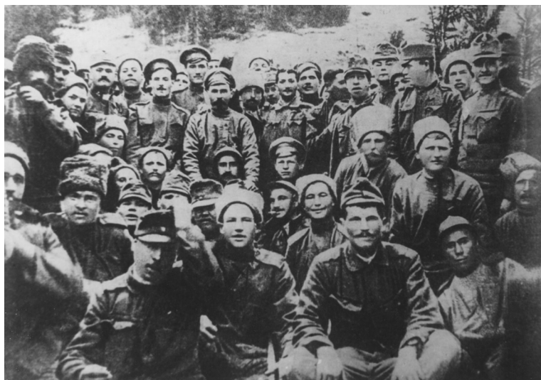
Братание на фронте