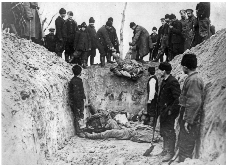
Похороны в братской могиле