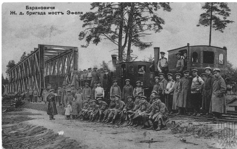
Железнодорожная бригада возле моста Эфеля. Барановичи