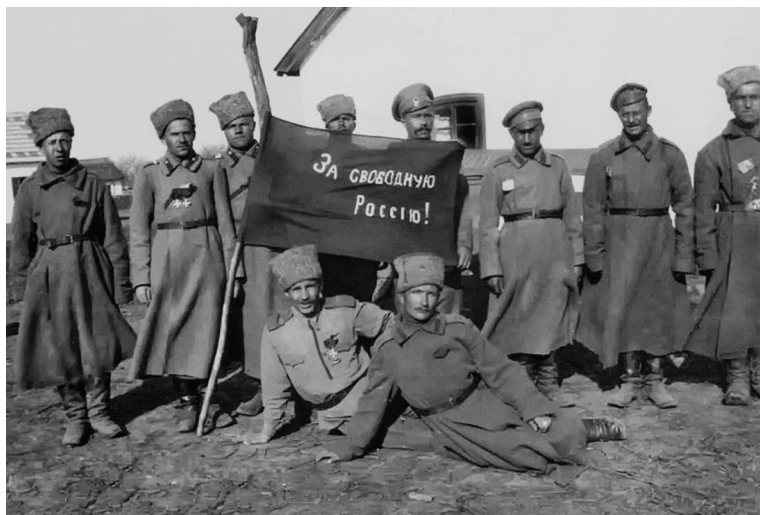
На Западном фронте во время Февральской революции. 1917 г.