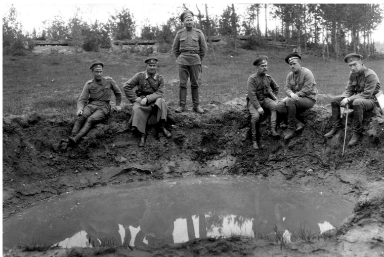
На краю воронки от тяжёлого немецкого снаряда