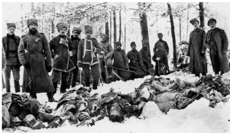
Разорванные динамитом при заложении мин. Зима 1916 г.