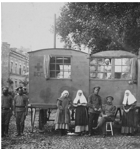
Передвижной военно- санитарный госпиталь в Минске