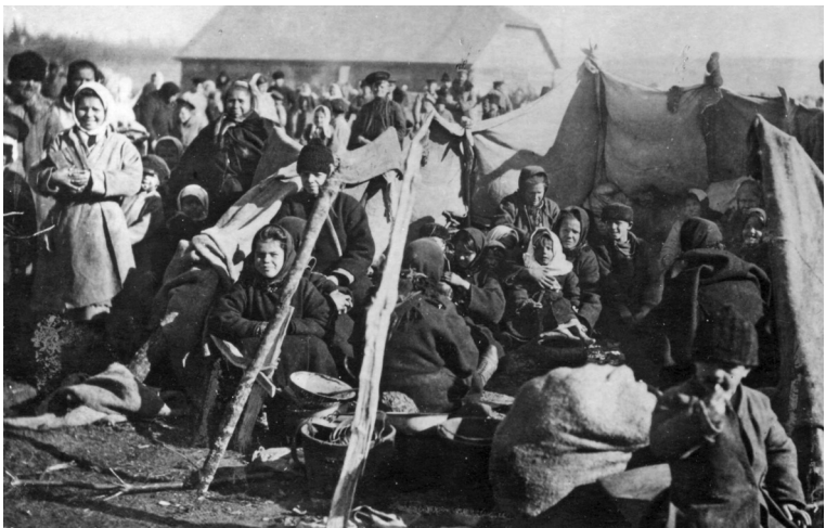
Шатёр беженцев в Бобруйске