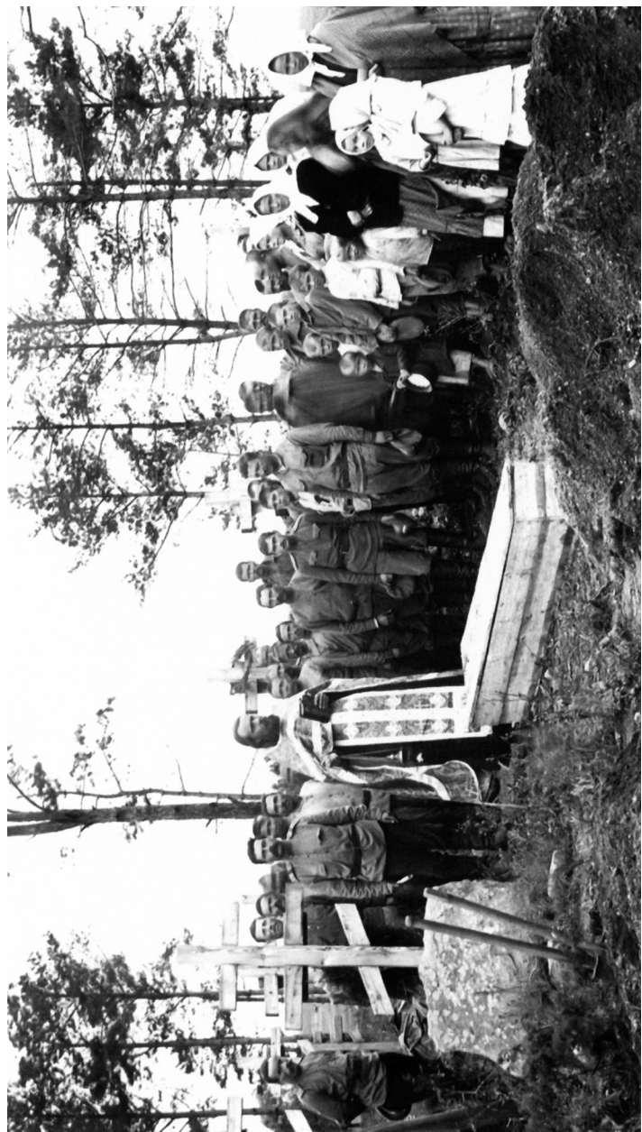
Похороны убитого воина из 530-го Василь-Сурского пехотного полка