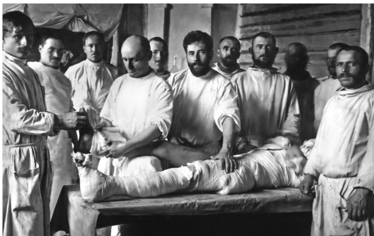
В операционной на передовой