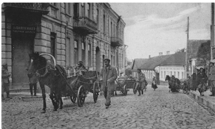
Польские беженцы на улицах Гродно. Немецкая открытка