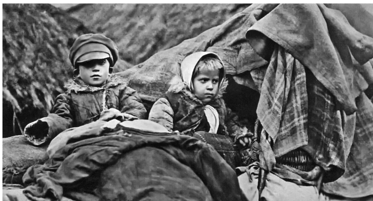
Сироты Первой мировой войны