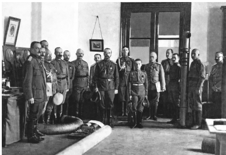
В Царской Ставке в Могилёве. Октябрь 1916 г.