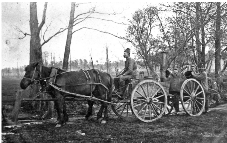
Солдатская походная кухня