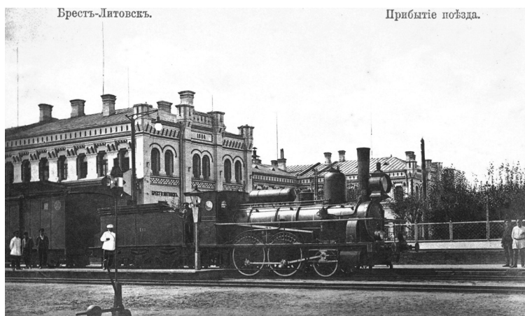
Прибытие поезда в Брест-Литовск в дни эвакуации