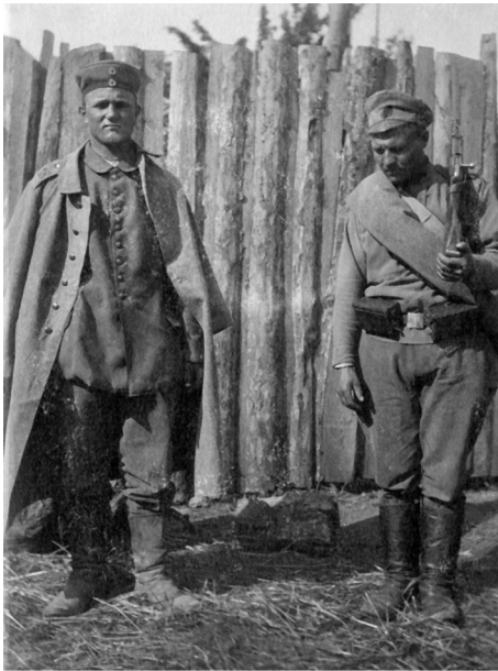
Пленный немецкий солдат. Северо-Западный фронт, июль 1915 г.