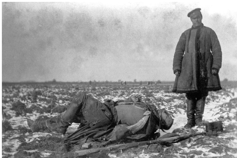
На Северо-Западном фронте. 1915 г.