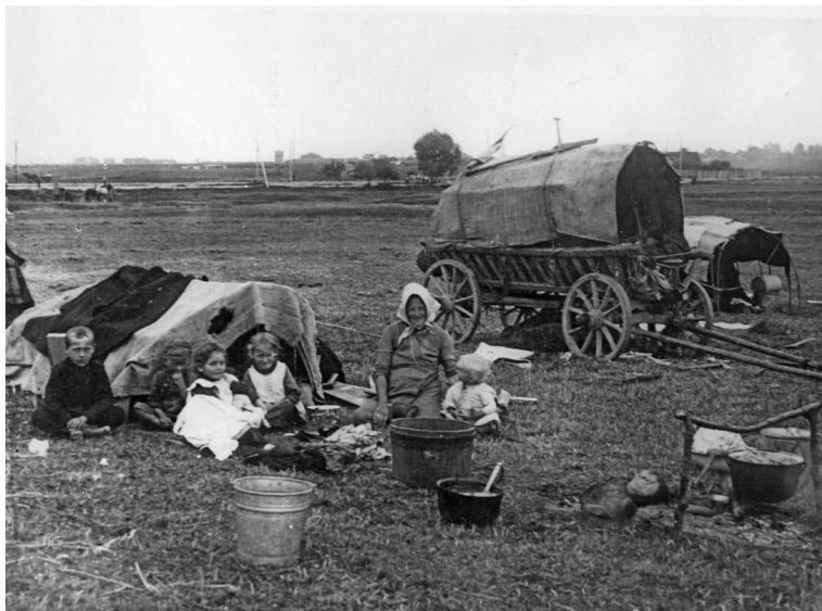
Беженцы около Бобруйска