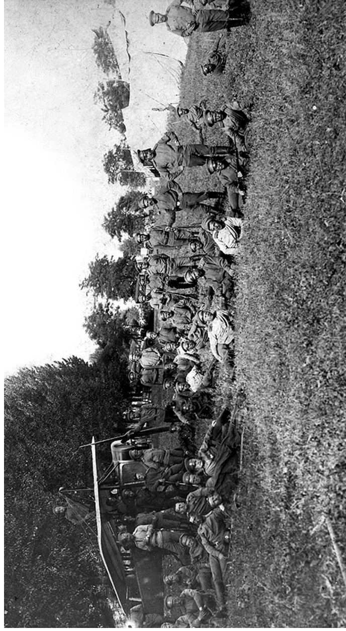
Первый корпусный авиационный отряд. Западный фронт. Фольварок Татарщина Минского уезда (аэродром в Станьково). 1917 г.