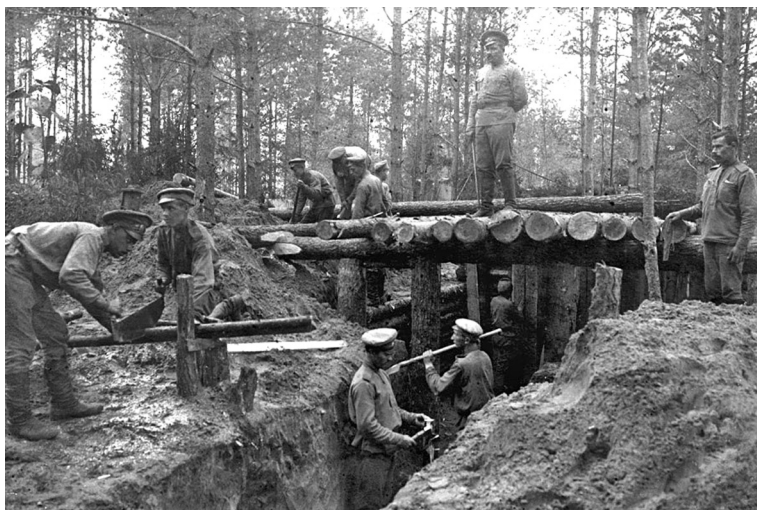
Русские солдаты строят землянку. 1916 г.