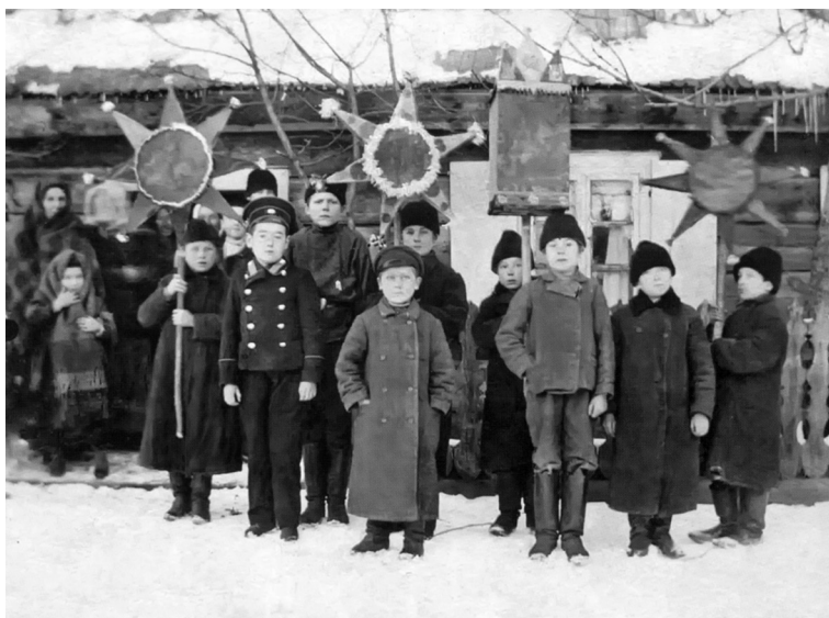
Рождество Христово в прифронтовой полосе