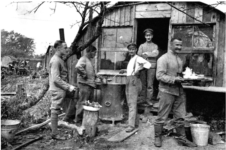
Раздача обеда немецким офицерам. Германский Восточный фронт