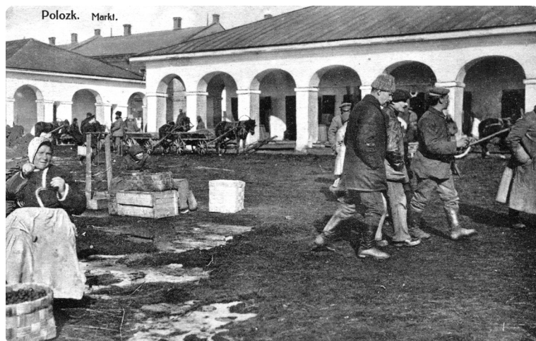
Беженцы на улицах Полоцка