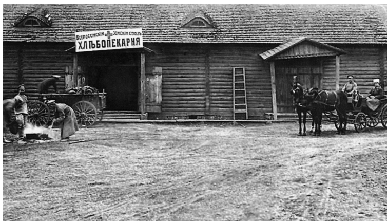
Хлебопекарня, организованная для беженцев Всероссийским земским союзом. Бобруйск