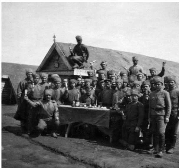
Экзамен в траншейной школе. 1916 г.