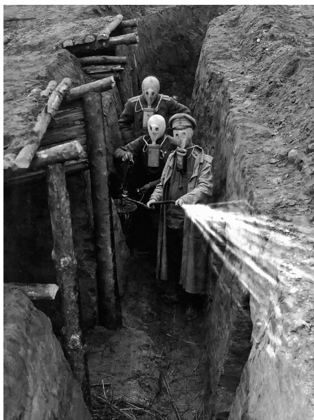
Очистка окопов после газовой атаки