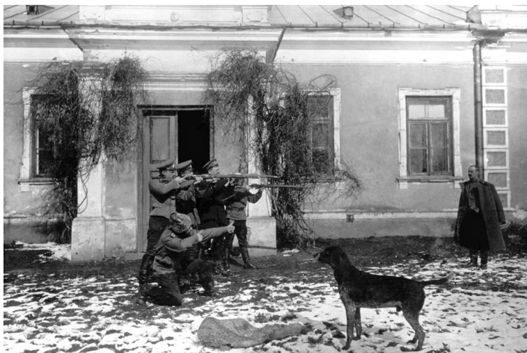
«Расстрел» (войсковая шутка). Северо-Западный фронт. 1915 г.