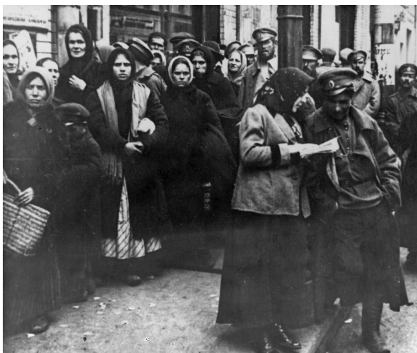
Очередь за продовольствием