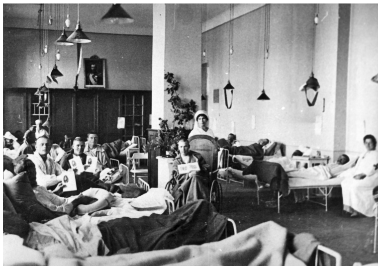
Палата госпиталя. 1914 г.