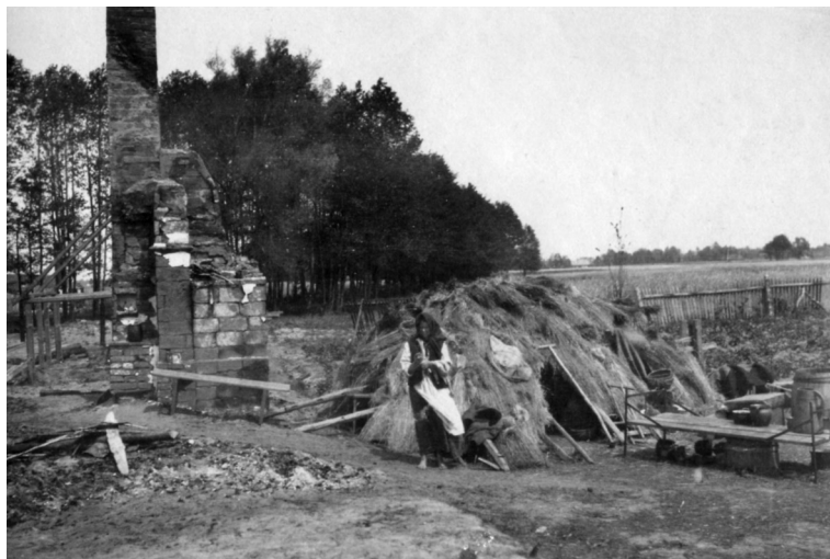
Разрушенная белорусская деревня. 1916 г.