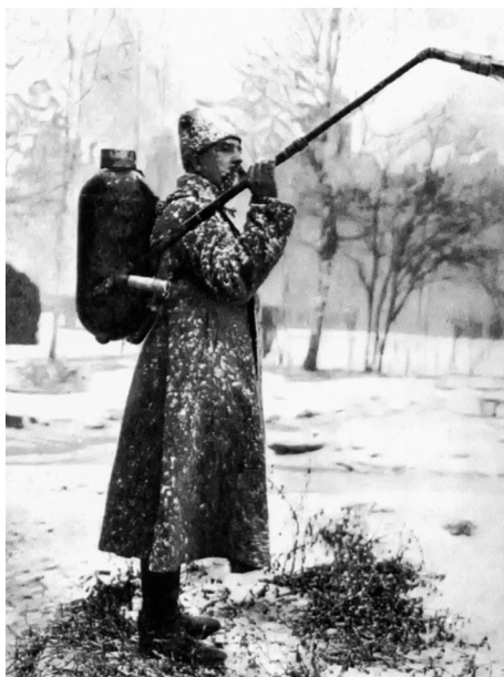
Немецкий аппарат для обливания противника горячей жидкостью. 1915 г.