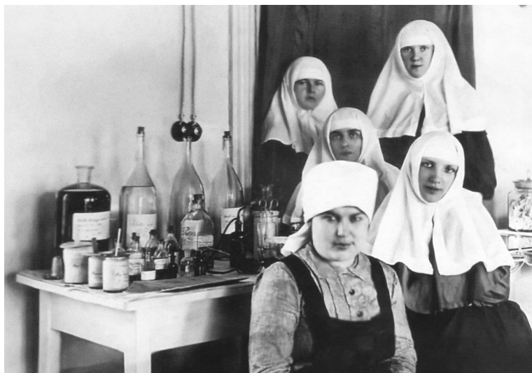
Сёстры милосердия. Барановичи, 1914–1915 гг.