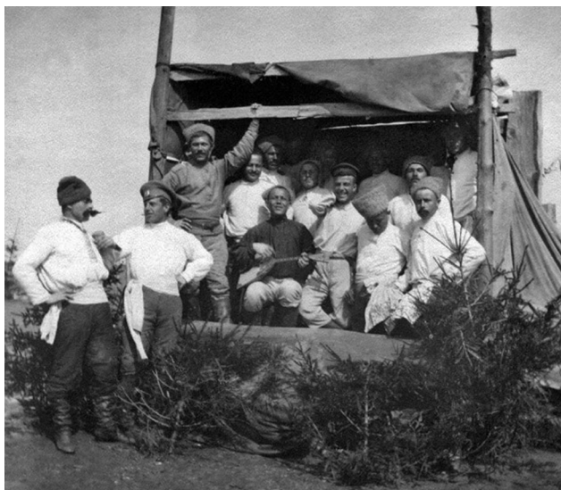
Войсковой театральный кружок 9-й роты 20-го пехотного Галицкого полка. 1915 г.