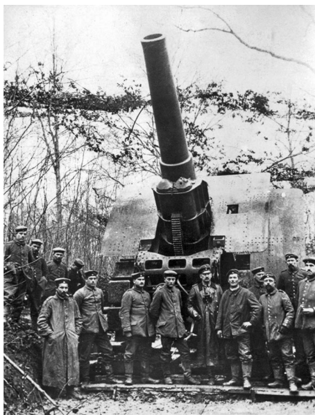
Немецкий гаубичный расчёт около пушки. 1916 г.