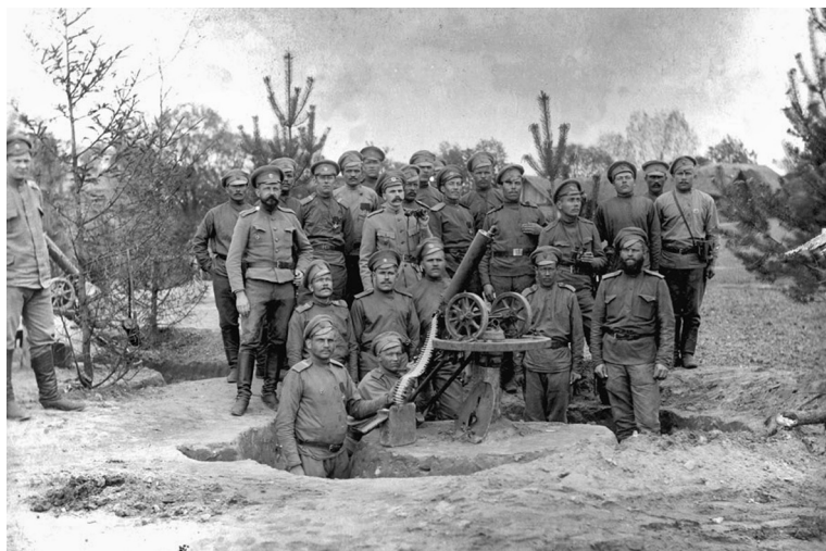
303-й Сенненский пехотный полк в районе Гродно. Осень 1914 г.