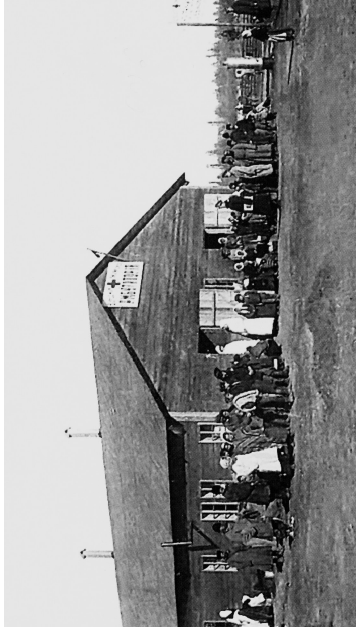
Амбулатория врачебно-питательного пункта, организованная Всероссийским земским союзом. Бобруйск