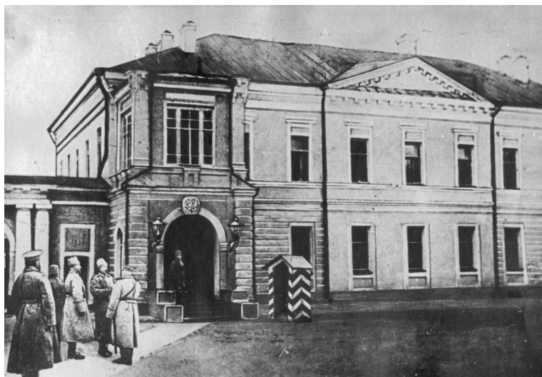
Здание Ставки в Могилёве. 1917 г.