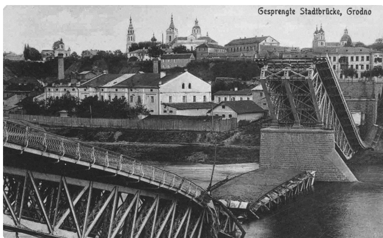
Новый мост в Гродно до и после разрушения во время военных действий