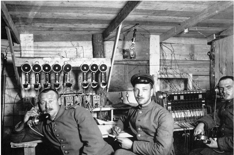
Немецкий военный телеграф