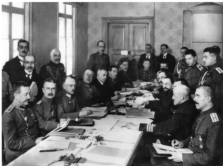
Во время переговоров в Брест-Литовске о мире. 1918 г.