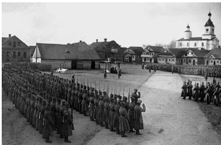
Смотр четырёх полков (девять бригад) перед боями под Молодечно. Ляховичи, 1916 г.