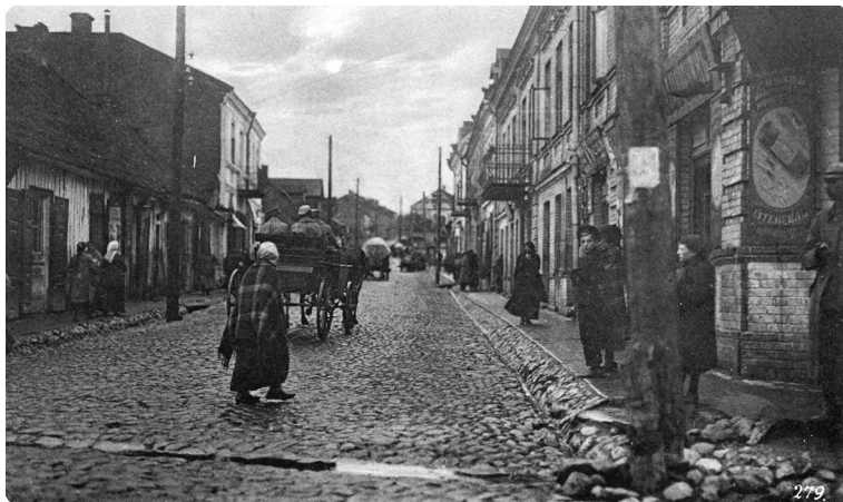
Мещанская улица в Гродно. Немецкая открытка