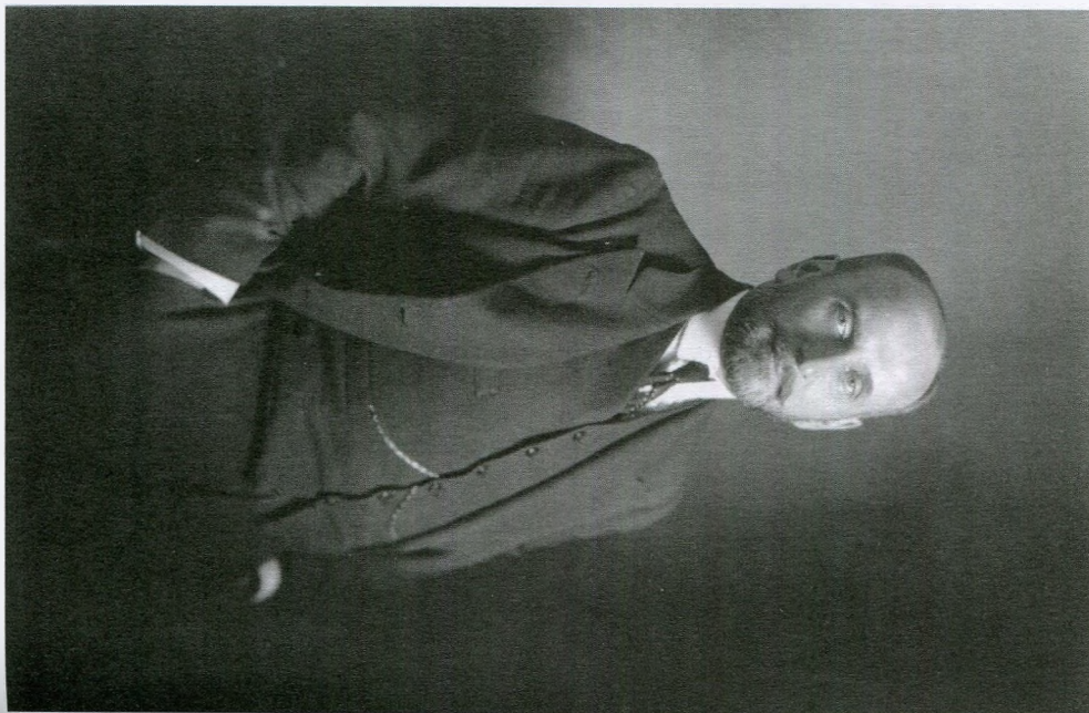
Сергей Дмитриевич Сазонов, 29 июля 1916 г.