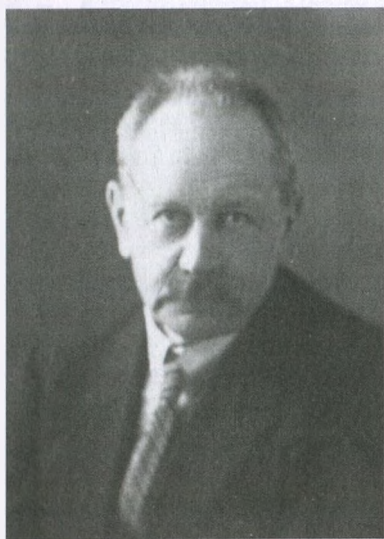
Василий Алексеевич Маклаков, Париж, 1920-е гг.