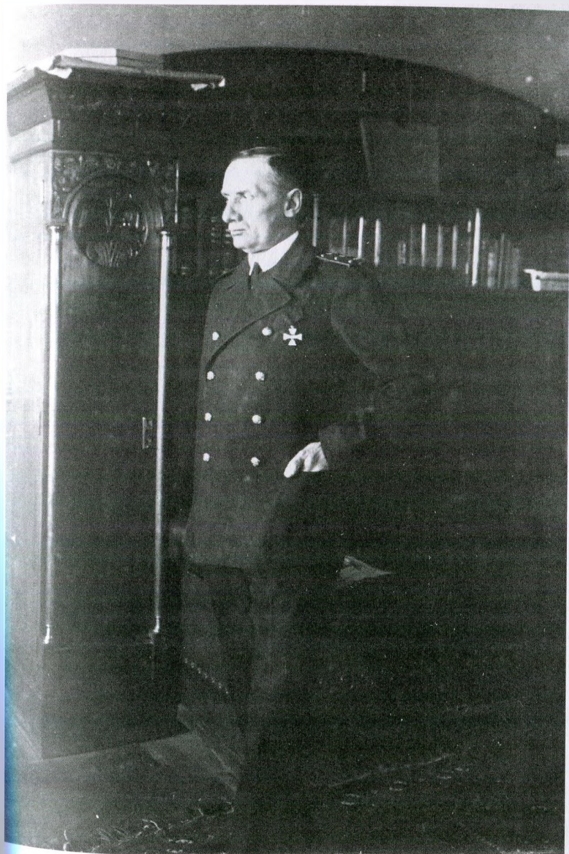
Адмирал Александр Васильевич Колчак, 1919 г.