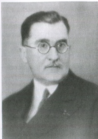
Генерал Николай Николаевич Головин, Париж, 1920-е гг.