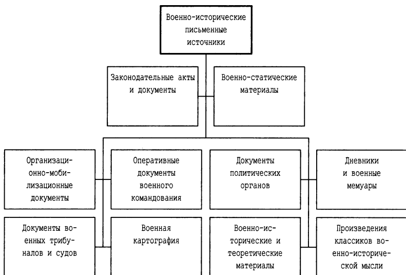
Схема1. Классификация письменных военно-исторических источников

новлено, что фактически убито 613 человек, т.е. в донесении увеличено число убитых против фактического количества по спискам на 103 человека, из которых следовало считать 61 человек в медсанбате, согласно представленным спискам, и 34 человека сданными в госпиталь 1-й армии и 8 человек не установлено 27 .