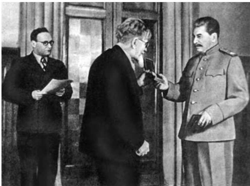
Председатель Президиума Верховного Совета СССР М.И. Калинин вручает И.В. Сталину орден «Победа». 5 ноября 1944 г.