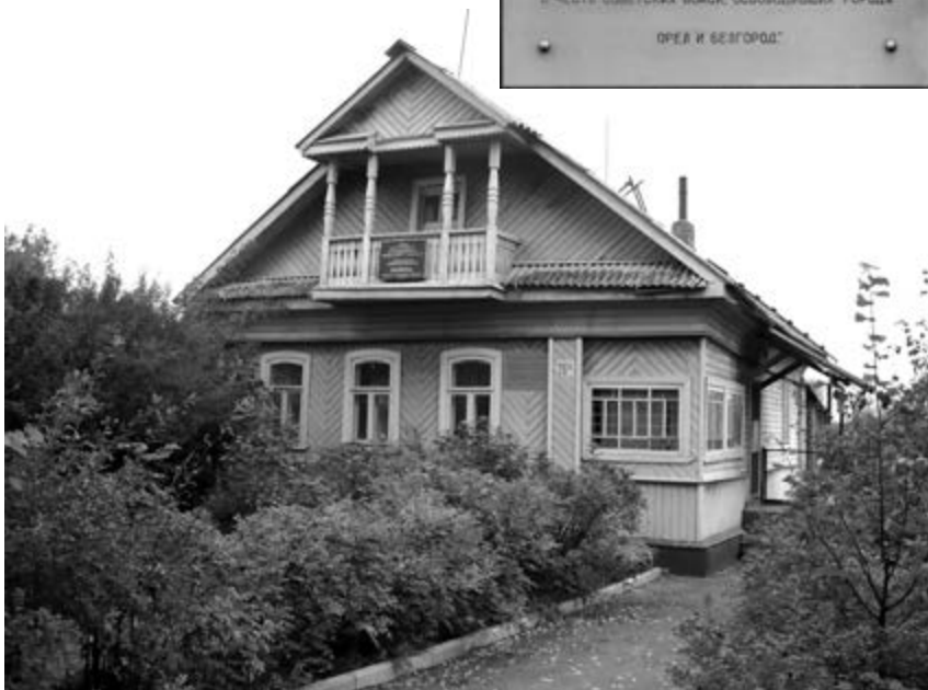
Дом в селе Хорошево, в котором 5 августа 1943 года, останавливался И.В. Сталин. Фото С.Н. Мазниченко, 2010 г. (из личного архива краеведа А.Н. Крупенкова).