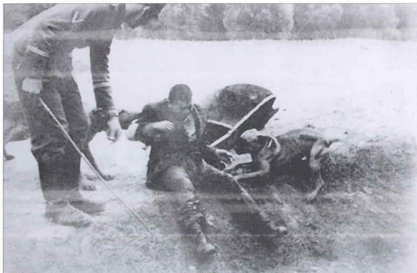
Унтер-офицер СС травит собаками советского военнопленного