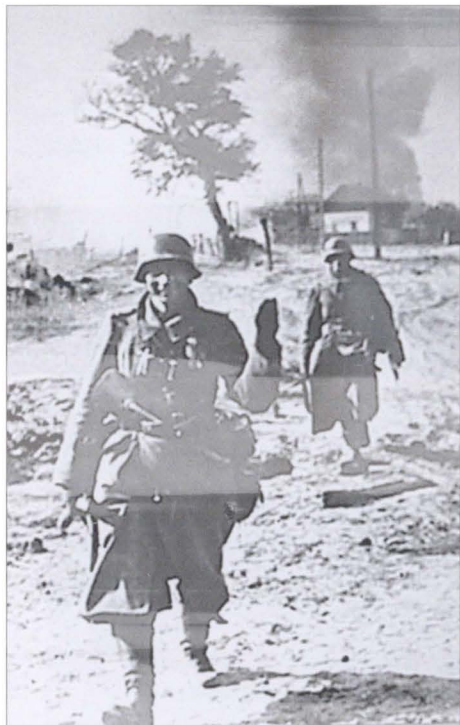
Немецкие факельщики за работой