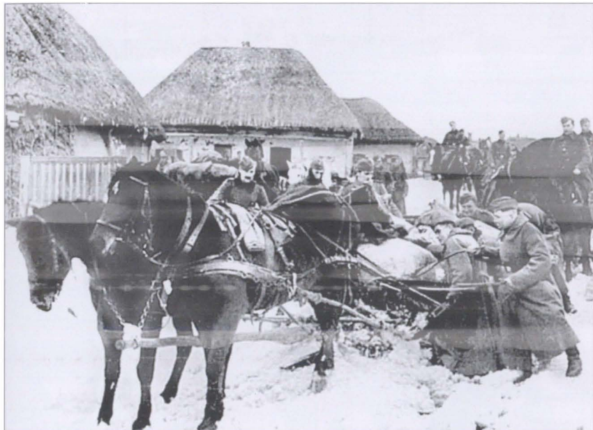
Гитлеровцы вывозят продовольствие, награбленное у местного населения