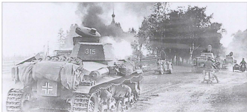
Захват деревни гитлеровской воинской частью