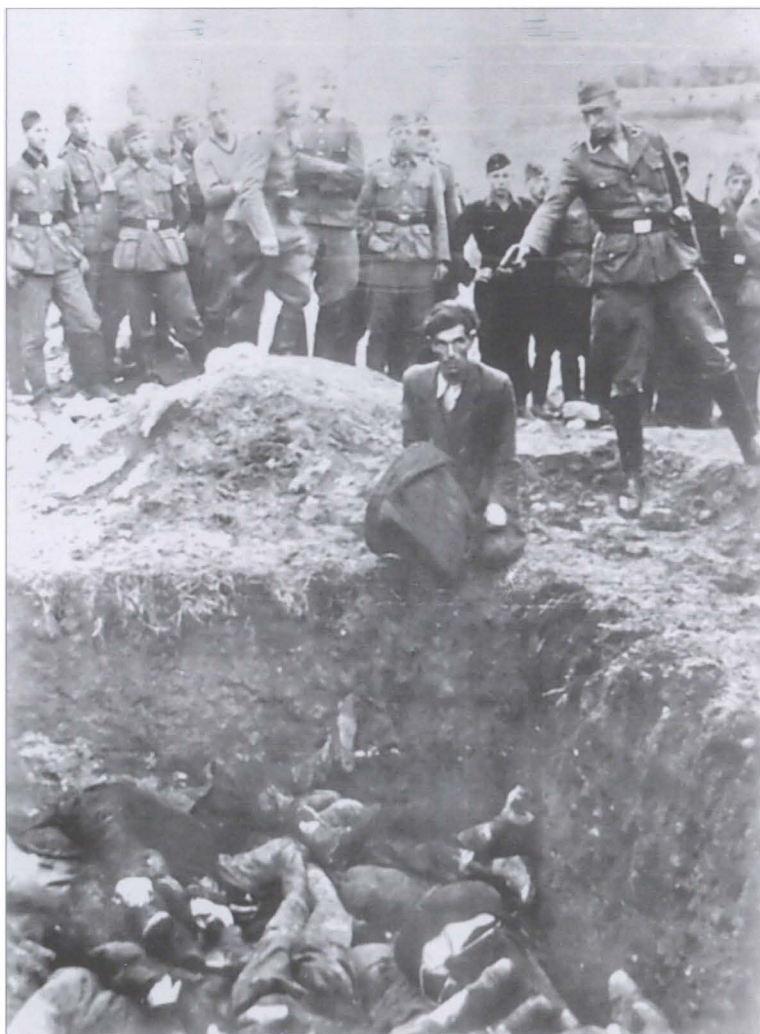
Казнь последнего еврея в Виннице 25 августа 1942 г.