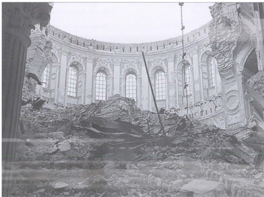
Развалины Новоиерусалимского монастыря, взорванного немецкими войсками 10 декабря 1941 г.