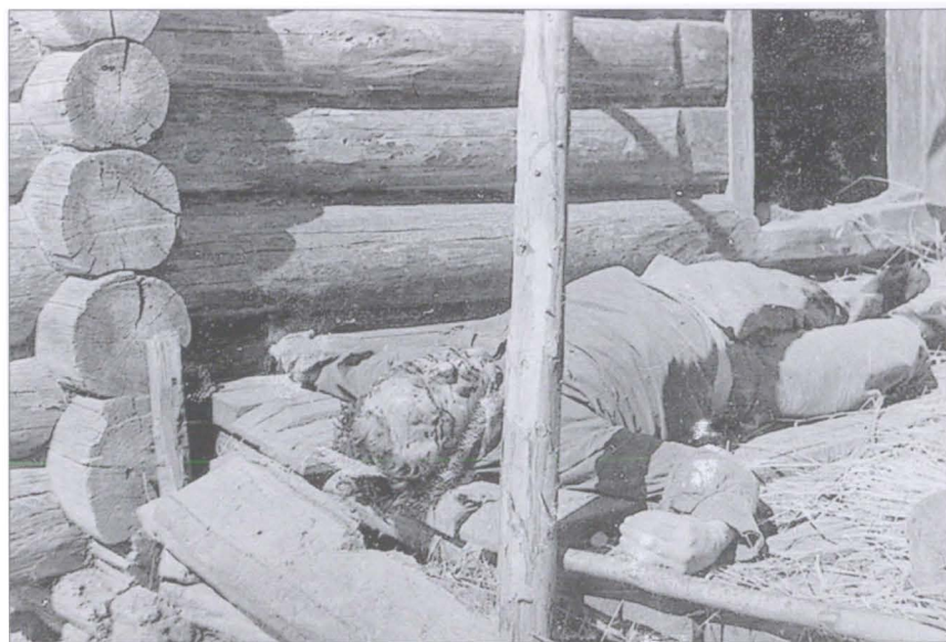
Разведчик-партизан, замученный фашистами. 1943 г.