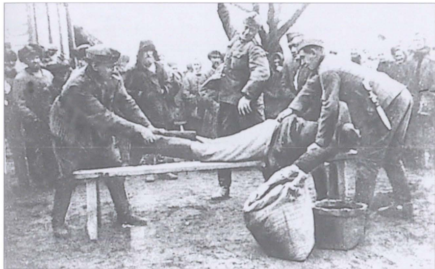
Порка мирных жителей