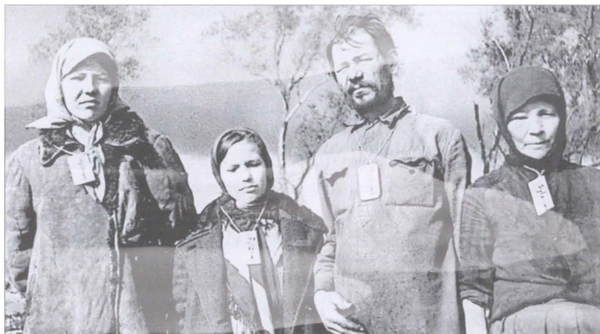
Жители оккупированной деревни Зубцово Калининской области с бирками на шее с названием деревни, как рабы