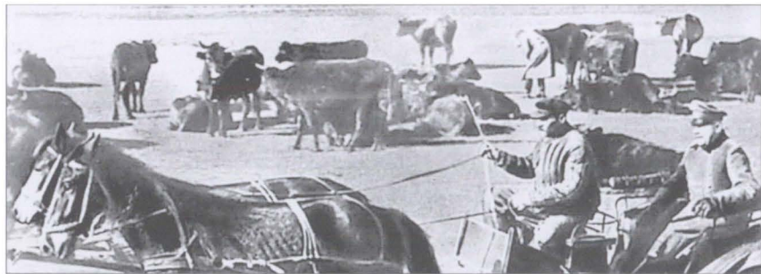
Новоявленный повелитель обьезжает на пароконной пролетке «свои» владения