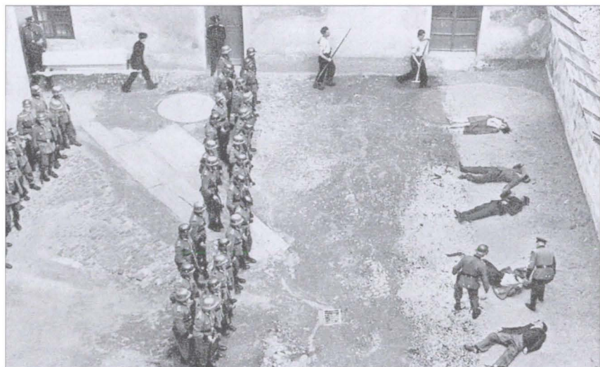
Один из многих расстрелов