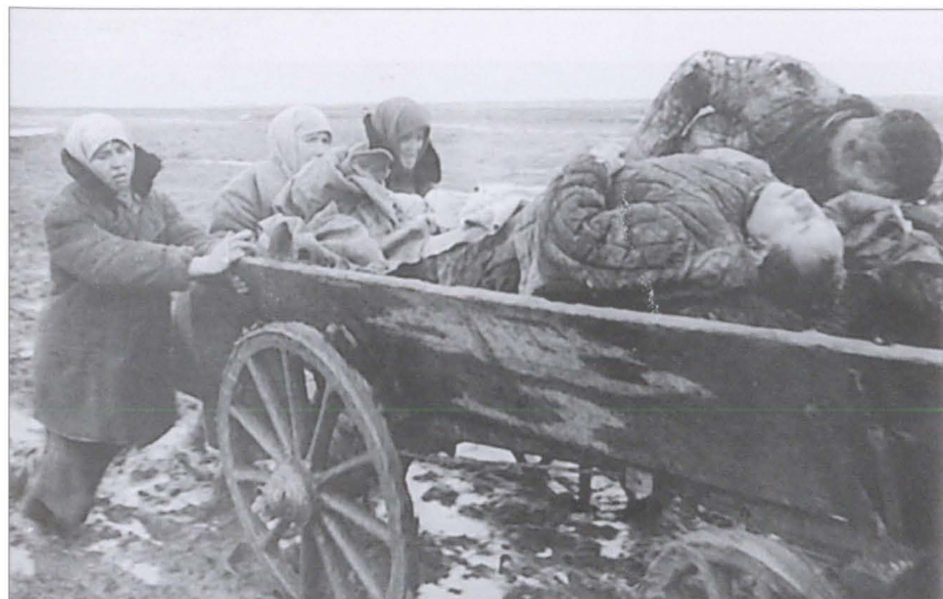
Женщины сопровождают телегу с телами расстрелянных односельчан