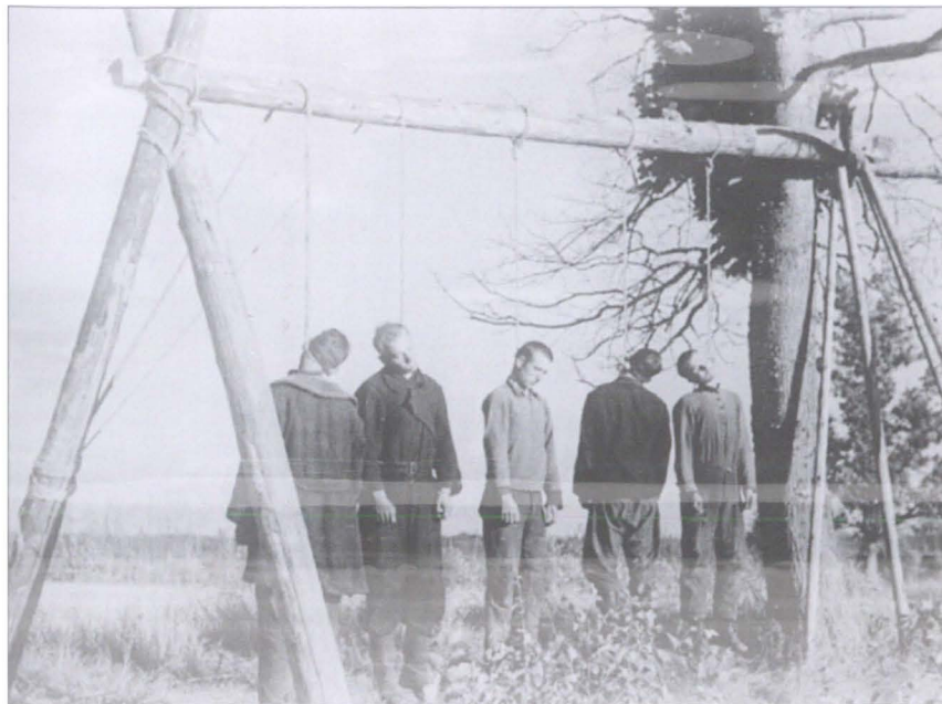
Фашистские технологии. Расправа с партизанами завершена. 1941 г.