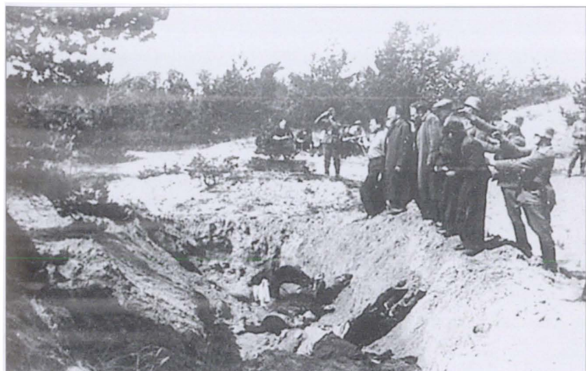
Расстрел гитлеровцами советских граждан