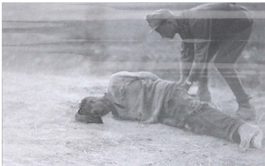
Расправа над пленным командиром Красной Армии