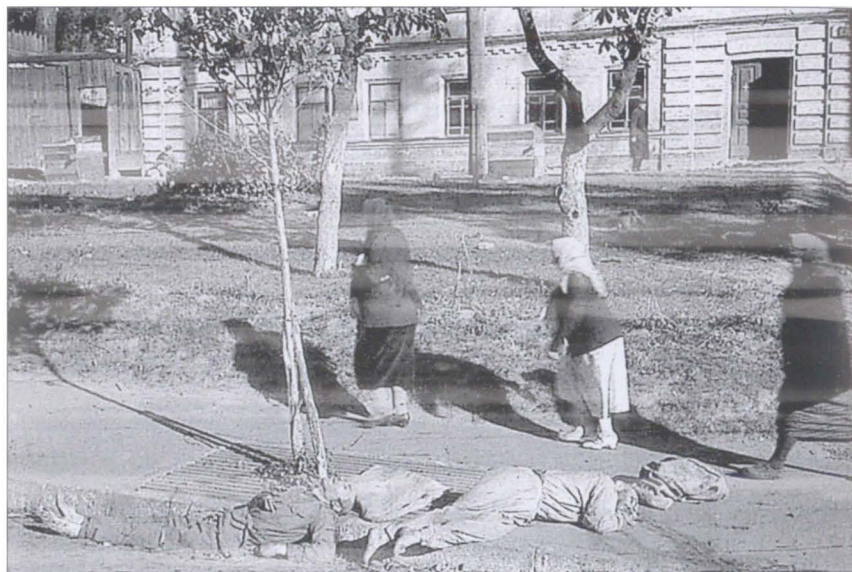
Убитые советские военнопленные на улице оккупированного Киева