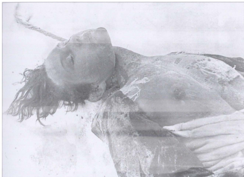
Тело Зои Космодемьянской после казни