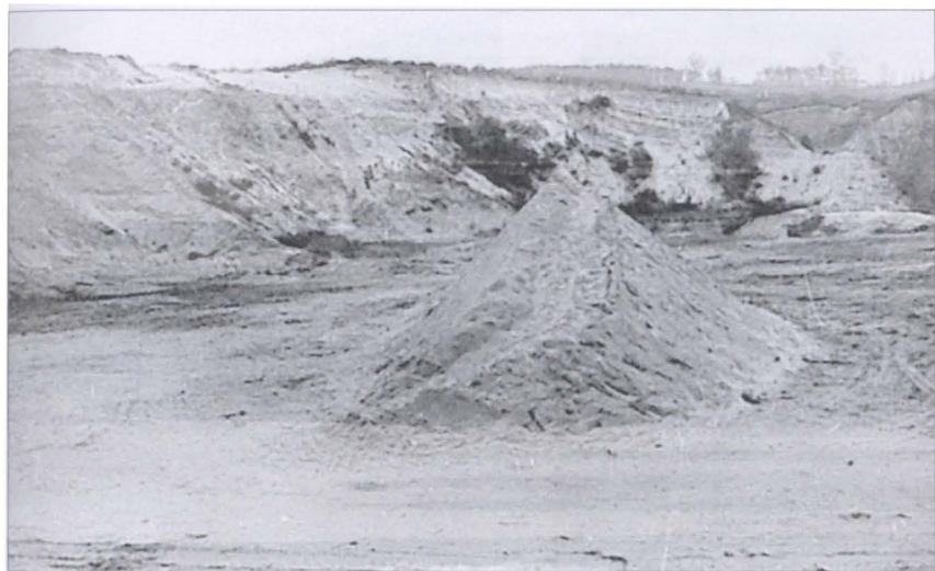
Киев. Бабий Яр — место массовых расстрелов мирных жителей