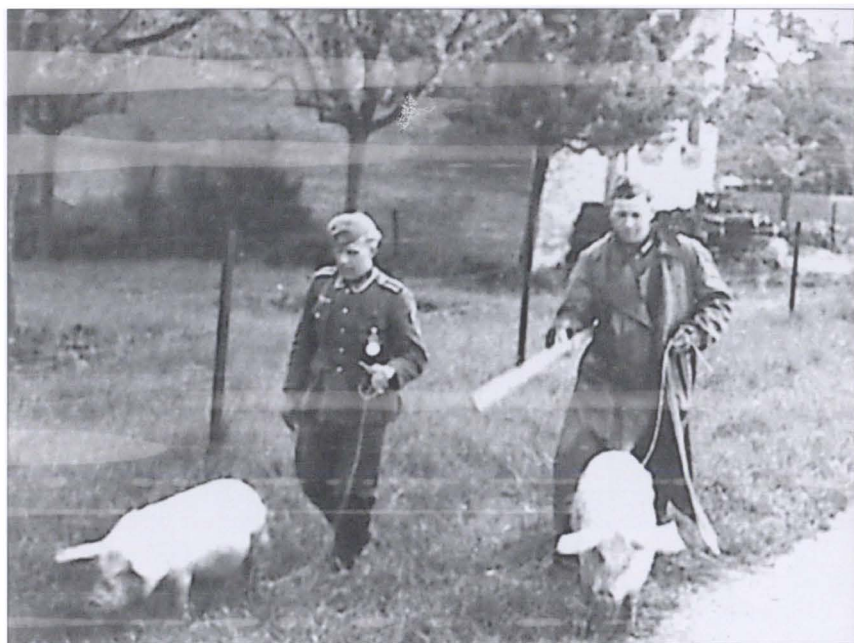
Немецкие солдаты гонят свиней на убой