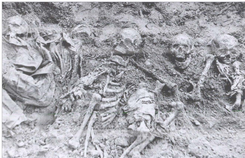
Останки замученных в лагере советских военнопленных. Псков, 1944 г.