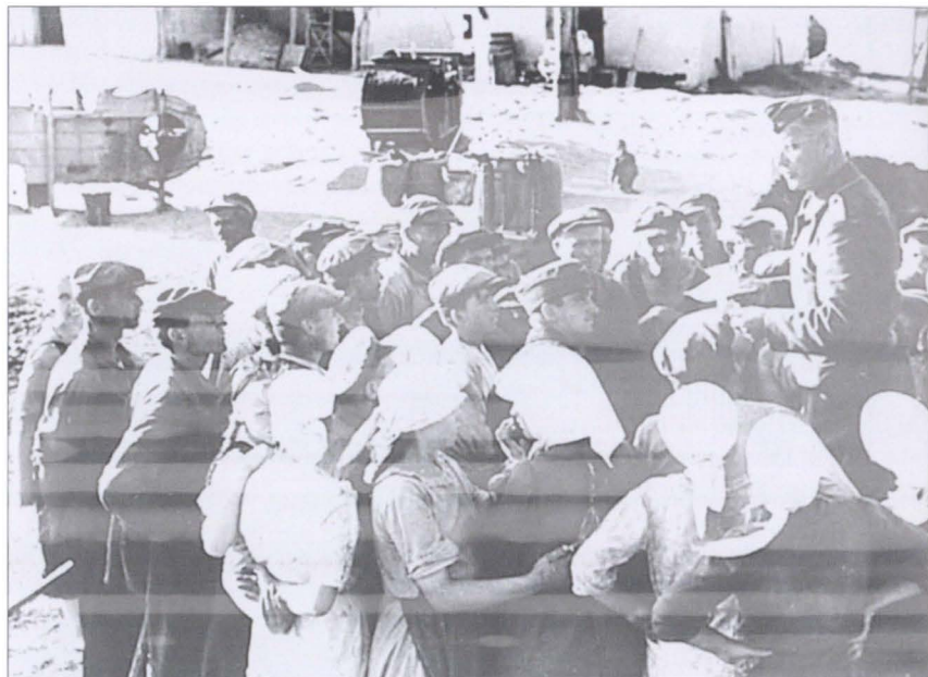
Немецкий комендант разъясняет колхозникам «новый порядок». 1941 г.