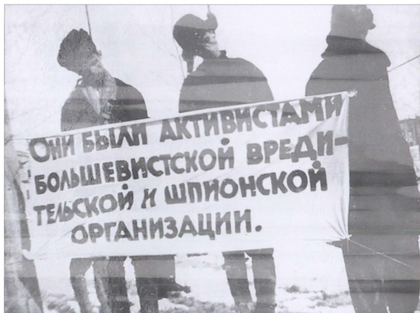
За малейшее подозрение — казнь через повешение. Киев, 1941 г.