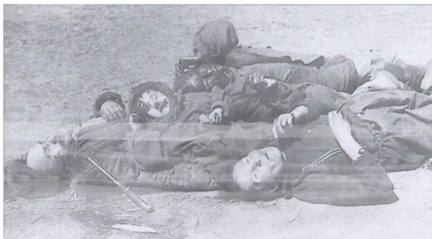
Семья колхозника, зверски убитая в день отступления немецких войск