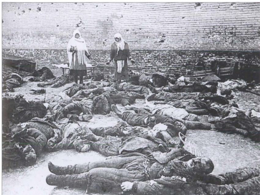
Тюремный двор в Ростове после ухода немцев