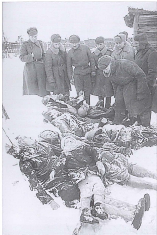
Злодеяния гитлеровцев. Гатчина, январь 1944 г.