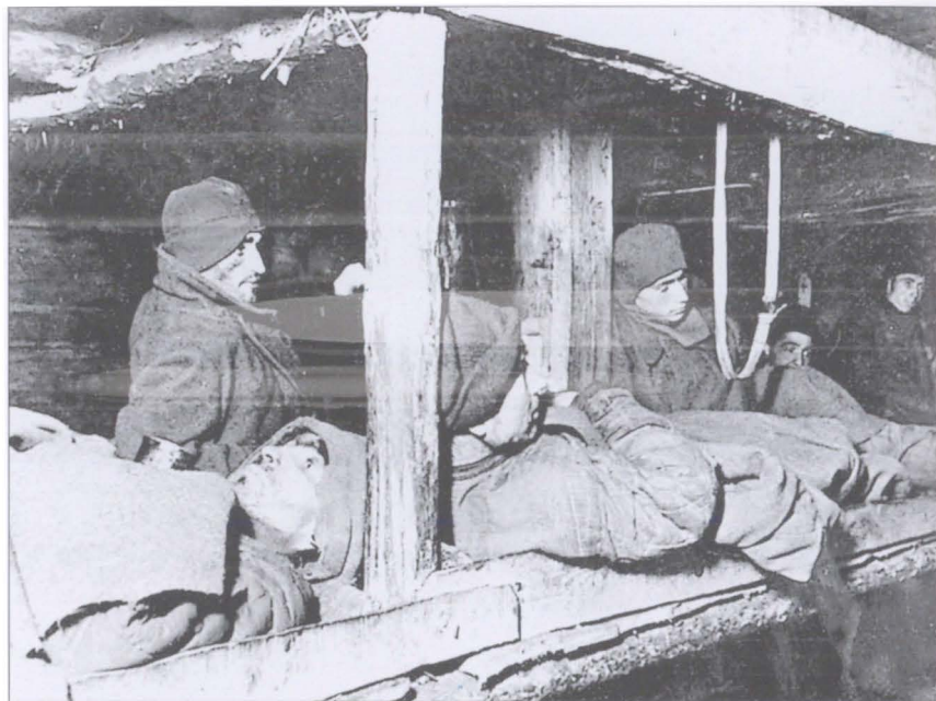
Красноармейцы, освобожденные из фашистского плена. Юхнов, март 1942 г.