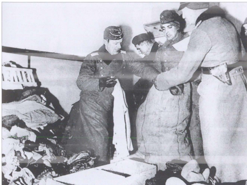
Гитлеровские офицеры пакут награбленные вещи