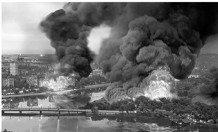
Под массированным обстрелом — мирное население Донецка. Год 2014-й.

Именно поэтому среди предложений, которые высказываются в письмах, есть идея создать музей фашистской оккупации, который