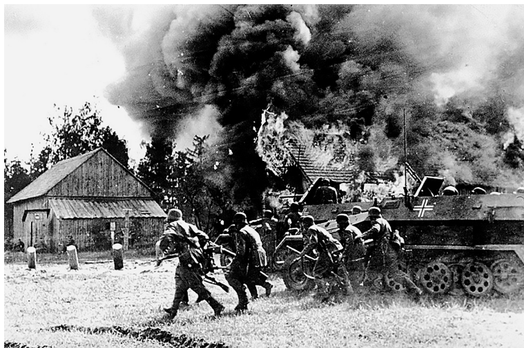
Немецкие солдаты рядом с танками движутся по горячей русской деревне 26 июня 1941 года.