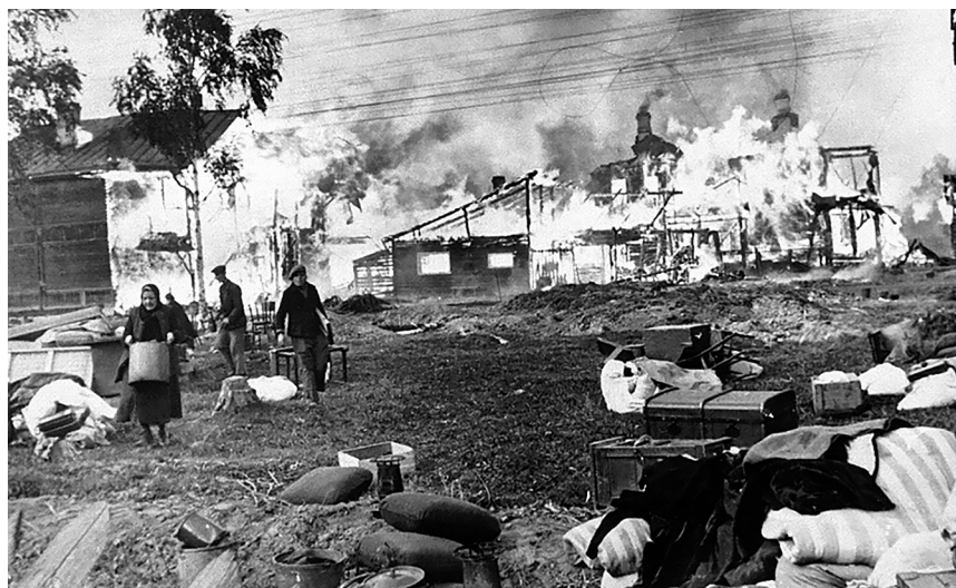
В фашистском огне — дома и жители Ленинградской области. Год 1941-й.

Да, поднятый в преддверии 70-летия Великой Победы на страницах нашей газеты вопрос о достойном увековечении памяти