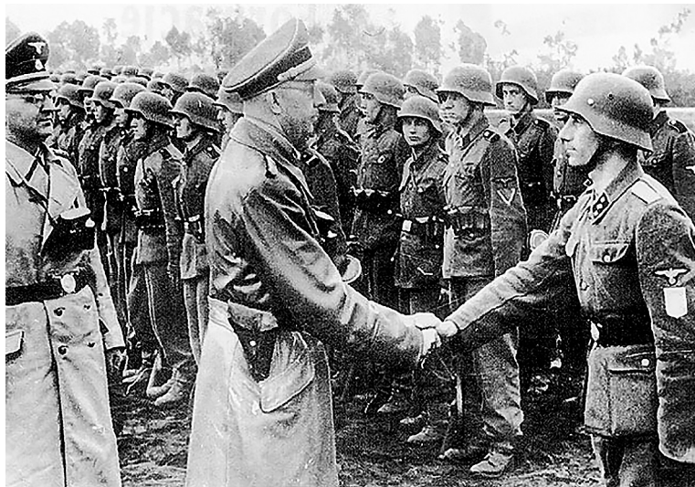
Гитлеровское руководство очень «заботилось» об Украине и особо — о дивизии СС «Галичина».

были уничтожены, не запугивать, а физически уничтожать! Не надо бояться, что люди проклянут нас за жестокость. Пусть из сорока миллионов украинского населения останется половина — ничего страшного в этом нет». Как говорят в таких случаях, комментарии излишни.