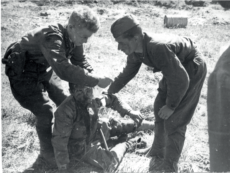
Оказание первой медицинской помощи раненому японскому солдату