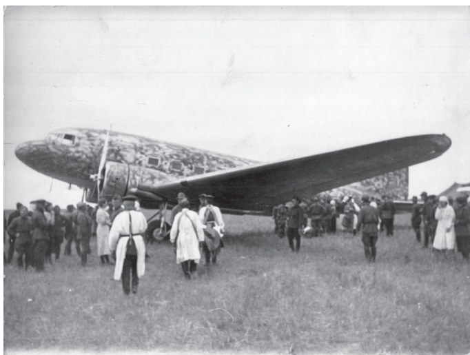
Вывоз раненых с полевого госпиталя на военном-транспортном самолете DC-3 «Дуглас». Раненые в зависимости от степени тяжести вывозились в узловую госпиталь в Баянтумэне, Ундурхане или Читу