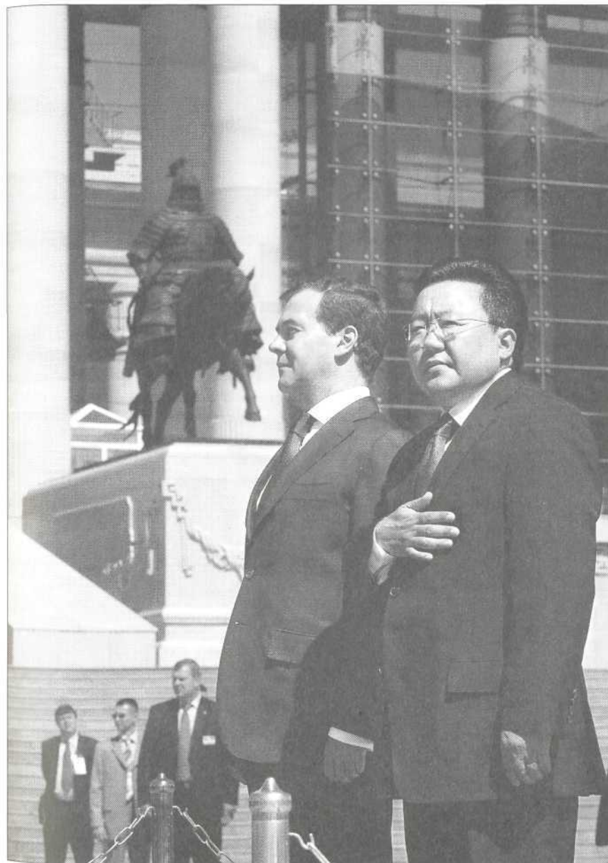
Церемония встречи Д. Медведева в Монголии