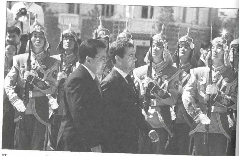
Президенты Дмитрий Медведев и Цахиагийн Элбэгдорж обходят строй почетного караула