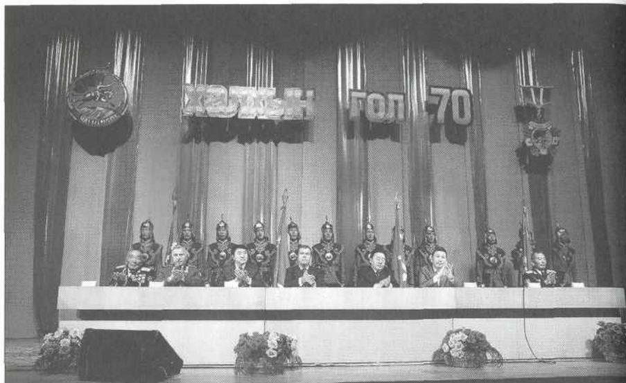
Торжественное заседание по случаю 70-летней годовщины совместной победы советско-монгольской армии на Халхин-Голе