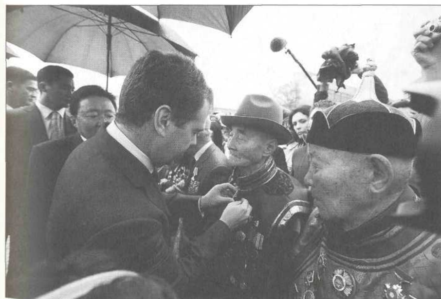
Президент Российской Федерации вручает награды монгольским ветеранам — участникам сражений на реке Халхин-Гол