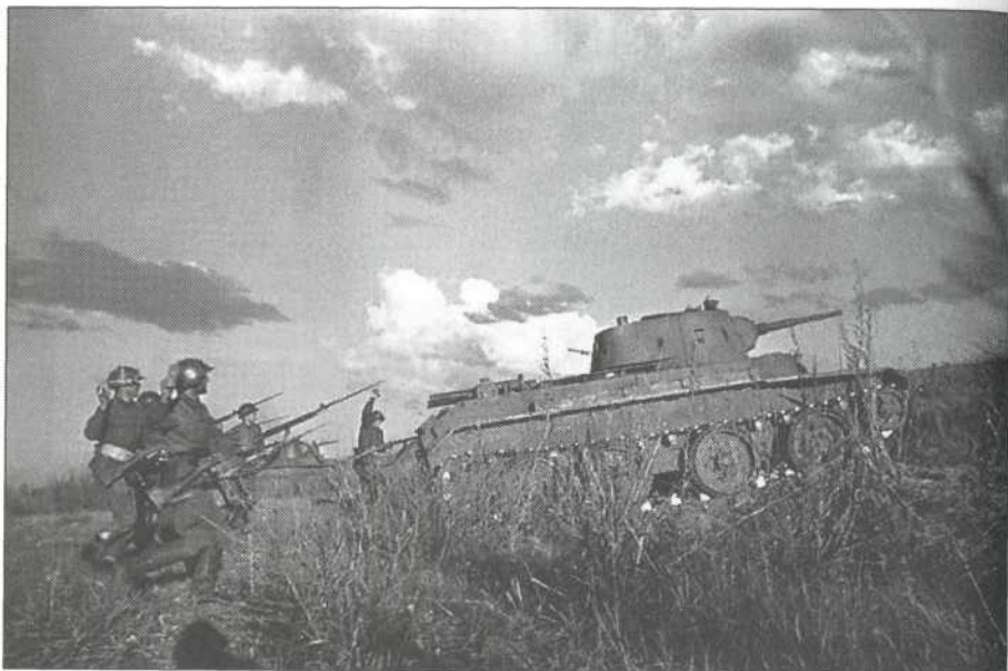
Атака советских частей