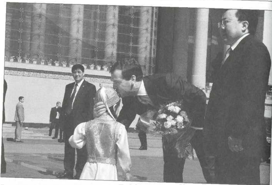
Во время церемонии встречи Д. Медведева в Улан-Баторе