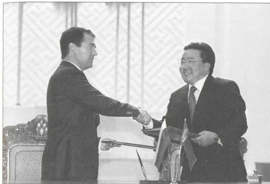
Дмитрий Медведев и Цахиагийн Элбэгдорж после подписания документов

Материалы о награжденных и фотографии о визите Д. Медведева в Монголию предоставлены Комиссией по государственным наградам при Президенте Российской Федерации и Управлением пресс-службы Президента Российской Федерации.