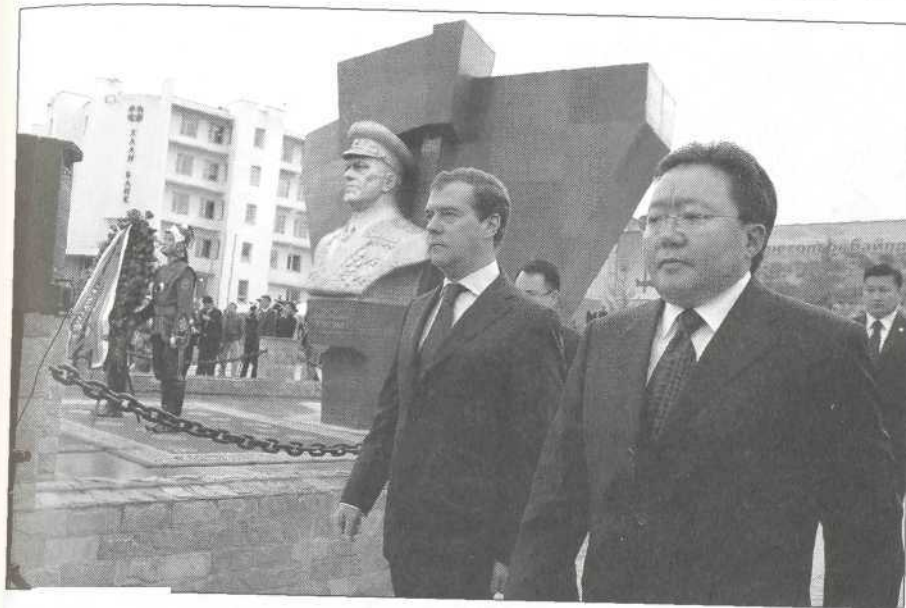
Российский и монгольский президенты у памятника маршалу Г.К. Жукову в Улан-Баторе