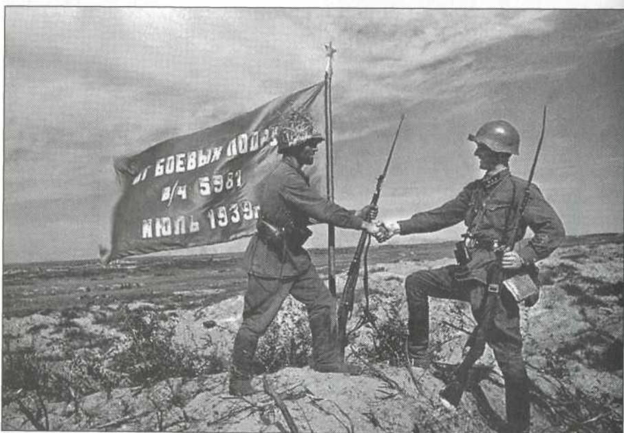
Водружение знамени над р. Халхин-Гол