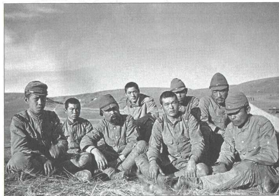
Пленные солдаты 6-й японской армии на отдыхе