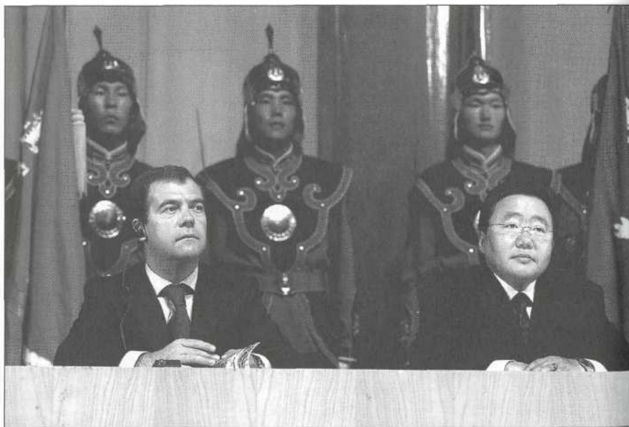
Дмитрий Медведев и Цахиагийн Элбэгдорж на торжественном заседании, посвященном 70-летию победы на Халхин-Голе