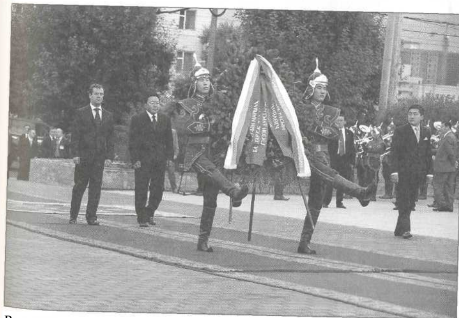
Возложение венка к памятнику маршалу Жукову