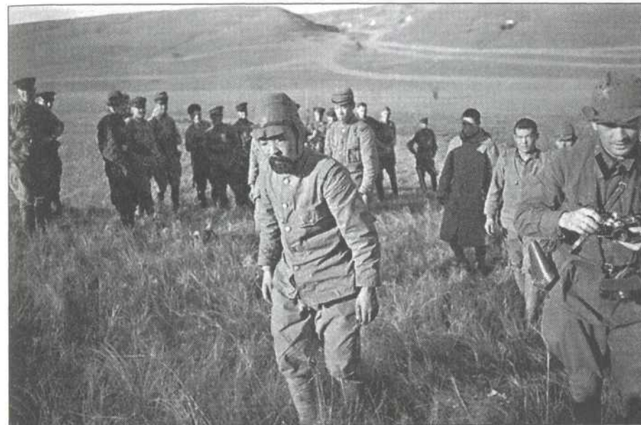
Пленные солдаты 6-й японской армии