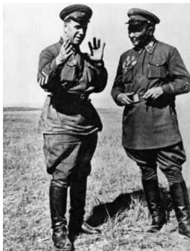
1- ( - ),