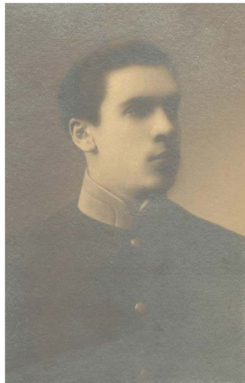
Николай Капитонович Батюшкин (1895–[после 1969] гг.)