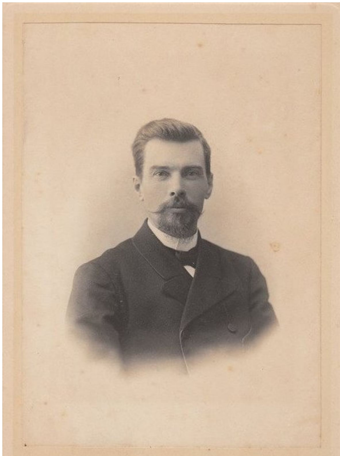
Капитон Алексеевич Батюшкин (1859–1927 гг.)