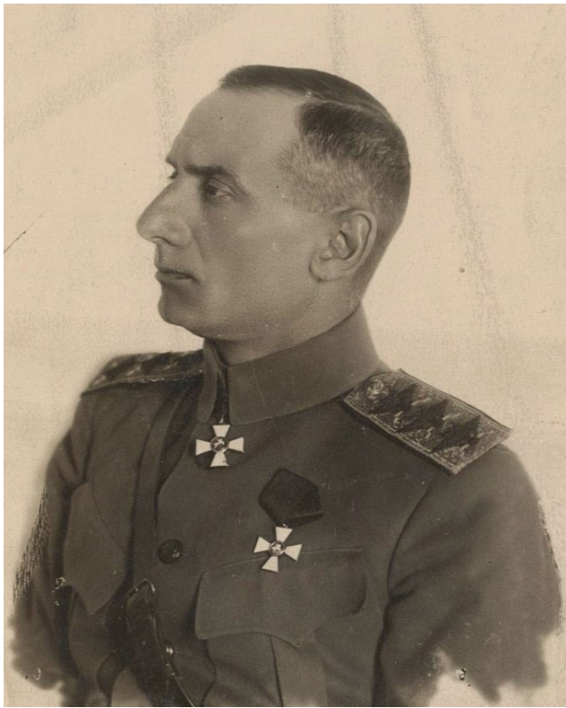
Верховный правитель и Верховный главнокомандующий адмирал А. В. Колчак