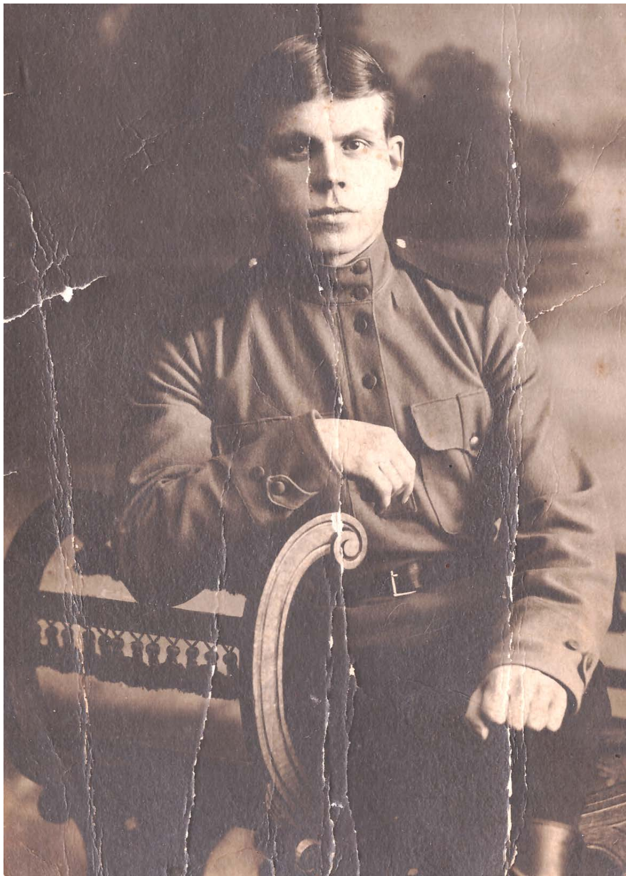
Петр Ефимович Казанцев (1894–1946 гг.)