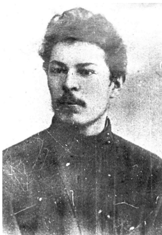
Константин Андреевич Попов (1876–1949 гг.)