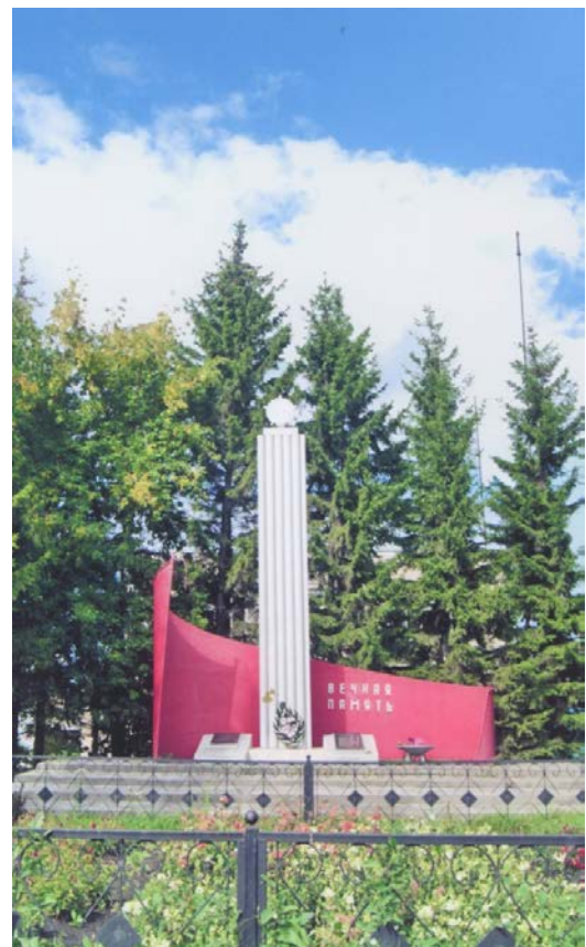
Памятники борцам за советскую власть, установленные в Муромцево: в 1930-е гг. (вверху) и в 1977 г. (внизу)