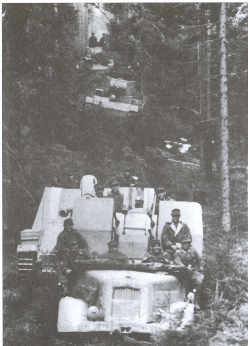
Антипартизанская операция в белорусских лесах