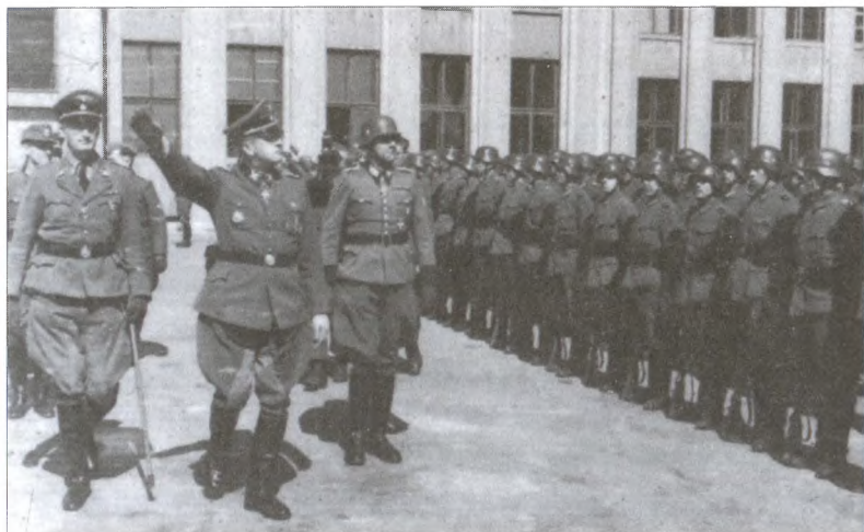
Высший фюрер СС и полиции в Центральной России Э. фон дем Бах-Зелевский (второй слева), его заместитель К. фон Готтберг и командующий полицией порядка генерального комиссариата Белорусь В. Клепи (третий слева). Минск, 1943 г.