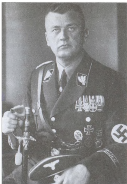
Командующий 2-й танковой армии вермахта генерал-полковник Р. Шмидт