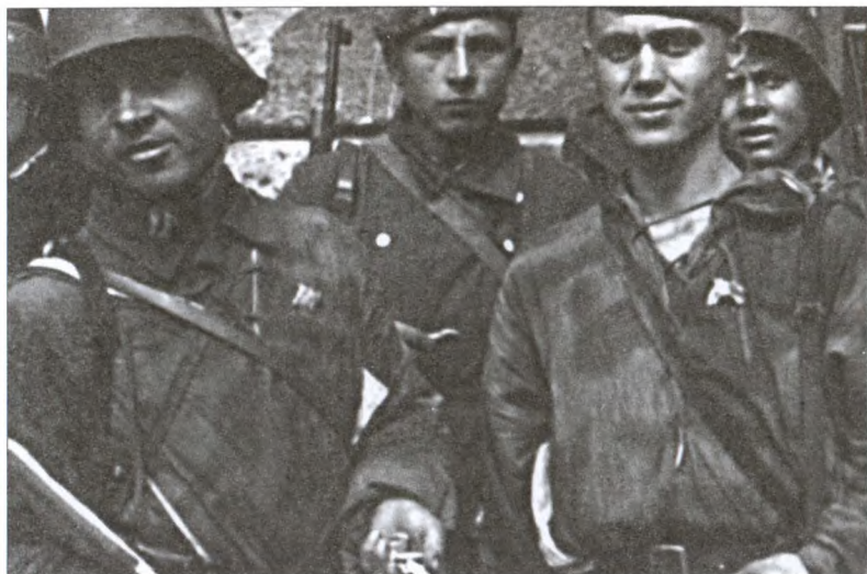
Солдаты РОНА. Август 1944 г.