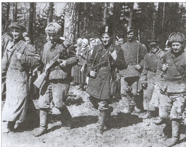
Партизаны-емлютинцы после очередной операции