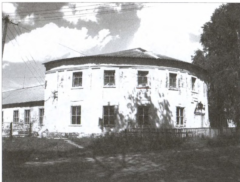
Локотская тюрьма (конезавод № 17). Современный снимок