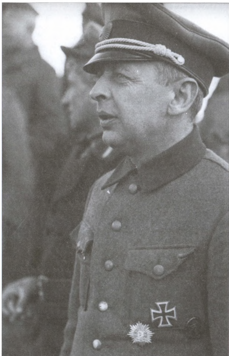
Б.В. Каминский – обербургомистр Локотского округа и командир РОНА