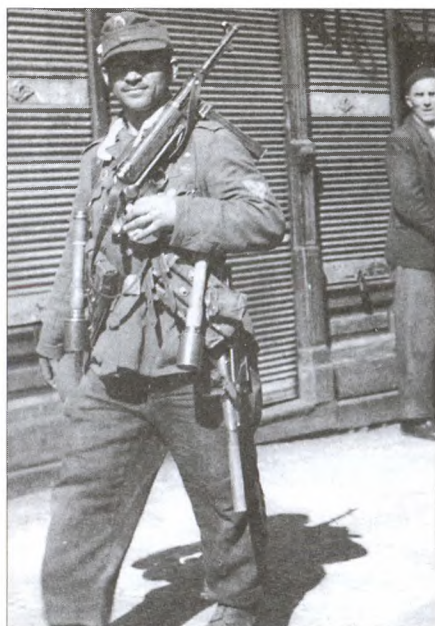
Боец РОНА. Варшава, август 1944 г.