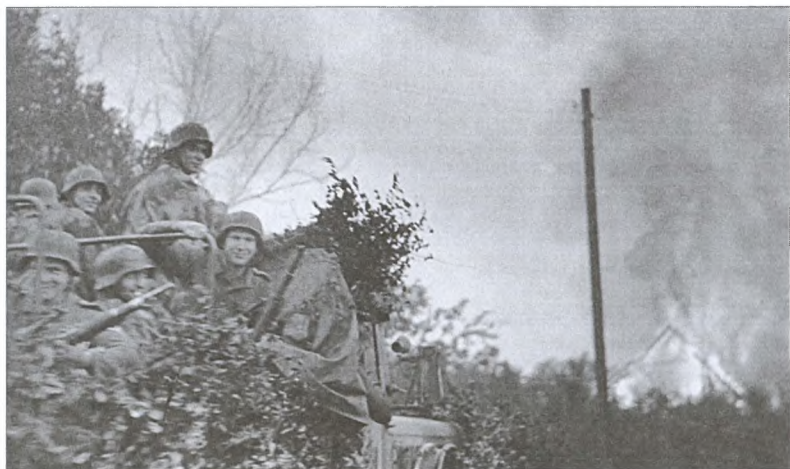
Каминцы в Варшаве. Август 1944 г.