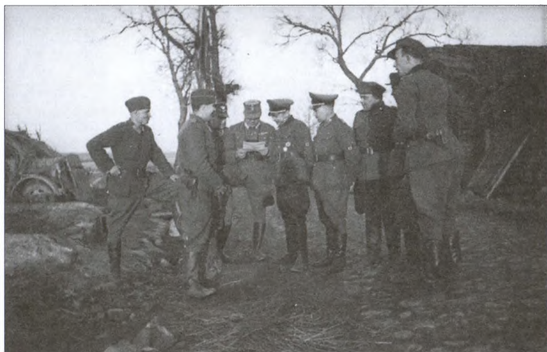
Командиры РОНА и сотрудники германской полиции. Весна 1944 г.