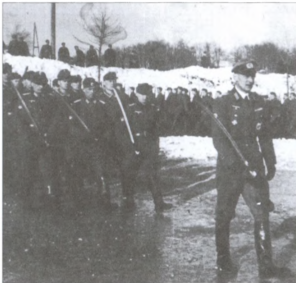
Бывший начальник разведки РОНА Б.А. Костенко в Мюнзингене 10 февраля 1945 г.