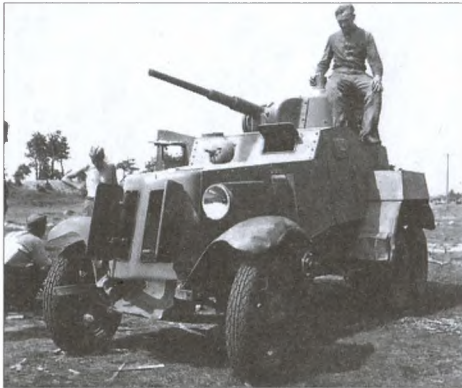
Трофейные советские автомобили активно использовались оккупантами и коллаборационистами при проведении антипартизанских операций