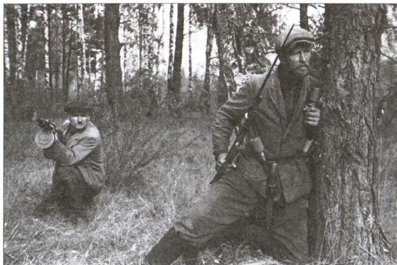
Партизаны Брянщины. Советский пропагандистский снимок 1943 г.