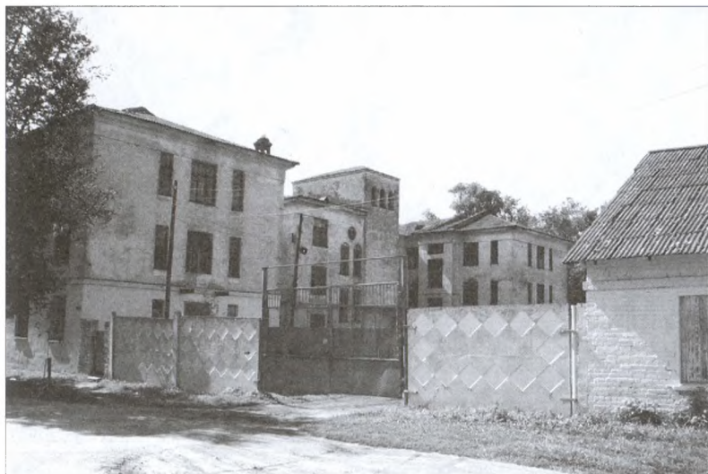
Казармы «народной милиции» (здание бывшего Лесохимического техникума). Современный снимок