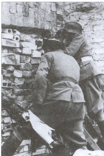
Военнослужащие РОНА в Варшаве