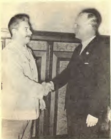
Сталин и Риббентроп после подписания пакта о ненападении