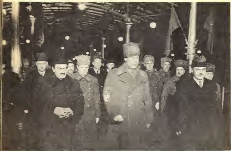
Возвращение В.М. Молотова в Москву после переговоров 12–13 ноября 1940 г. в Берлине