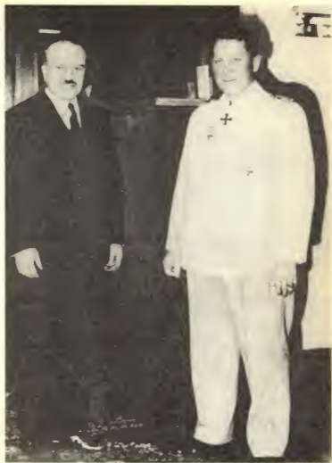
Берлин, 13 ноября 1940 г. Встреча В.М. Молотова с Гитлером