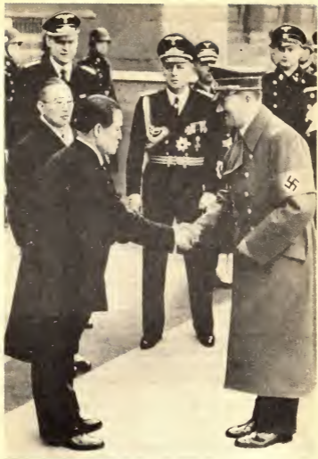
Берлин, март 1941 г. Гитлер и Риббентроп приветствуют министра иностранных дел Японии Мatsuоку