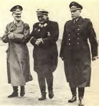
Август 1939 г. Геринг готов отправиться в Англию