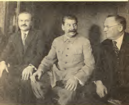
1938 г. И.В. Сталин, В.М. Молотов и М.М. Литвинов