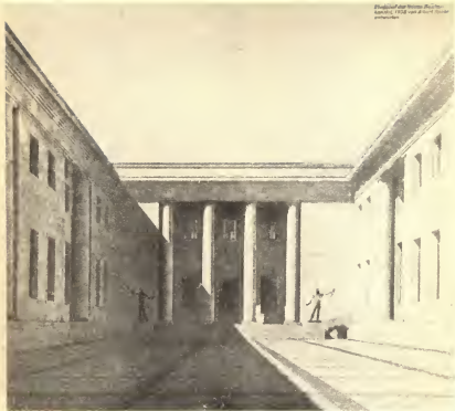
Берлин. Внутренний двор новой имперской канцелярии