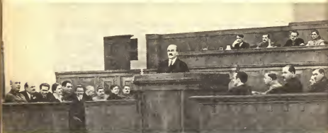
В.М. Молотов выступает на сессии Верховного Совета с докладом о ратификации советско-германского договора о дружбе и границе