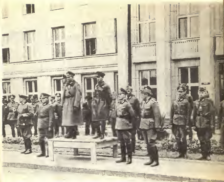
22 сентября 1939 г. Генерал Гудериан и комбриг Кривошеин принимают совместный военный парад при передаче вермахтом Бреста частям Красной Армии