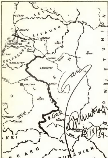
Подписанная Сталиным и Риббентропом карта с обозначением советско-германской границы