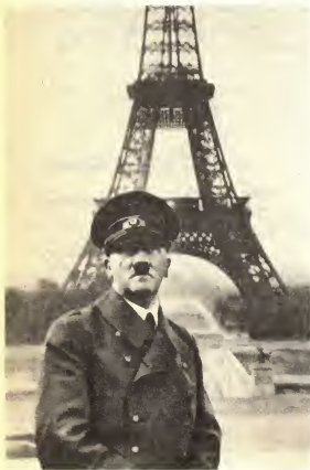
25 июня 1940 г. Гитлер в захваченном фашистами Париже