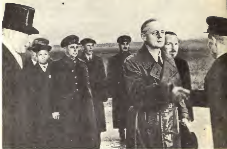
Москва, 27 сентября 1939 г. Встреча Риббентропа на Центральном аэродроме. Слева — немецкий посол в СССР Ф. Шуленбург