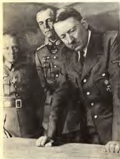
18 декабря 1940 г. Генерал Паулос докладывает Гитлеру о плане "Барбаросса"