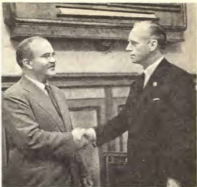
Молотов и Риббентроп обмениваются рукопожатием после подписания договора о дружбе и границе

Москва, Кремль, утро 29 сентября 1939 г.