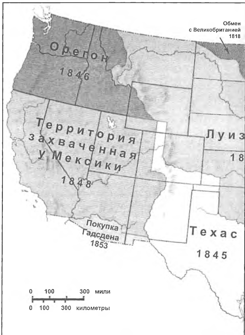
Схема 2. Территориальная экспансия США