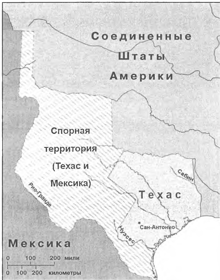
Схема 1. Территория Техасской республики в 1836-1845 годах