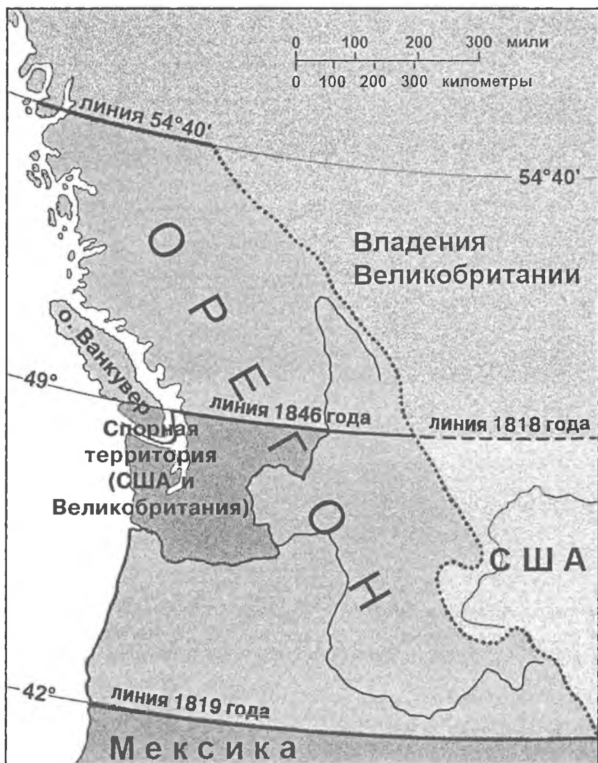
Схема 3. Территориальные споры и разграничение в Орегоне между США и Великобританией в середине 1840-х годов