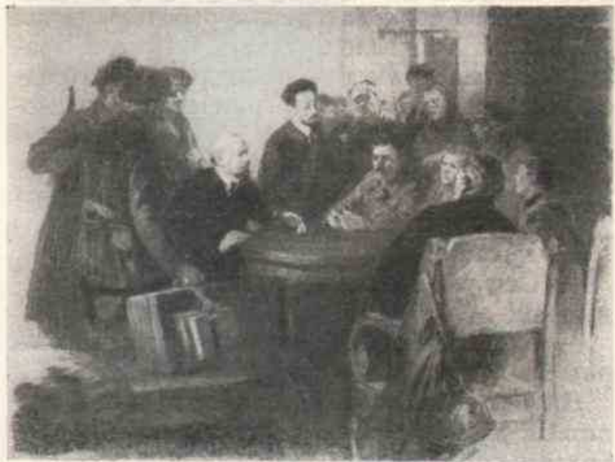
В. И. Ленин и Я. М. Свердлов беседуют с членами Первого Выборгского продотряда.

«Получаете ценнейших работников — таков общий отзыв», — телеграфировал А. Д. Цюрупа казанскому уполномоченному Наркомпрода 1 . Однако сторонники Зиновьева не унимались. Они заявили, что массовый отъезд рабочих в деревню мешает сохранить завоеванное большевиками положение в Петроградском Совете. (Большевиков там было 98 процентов.)