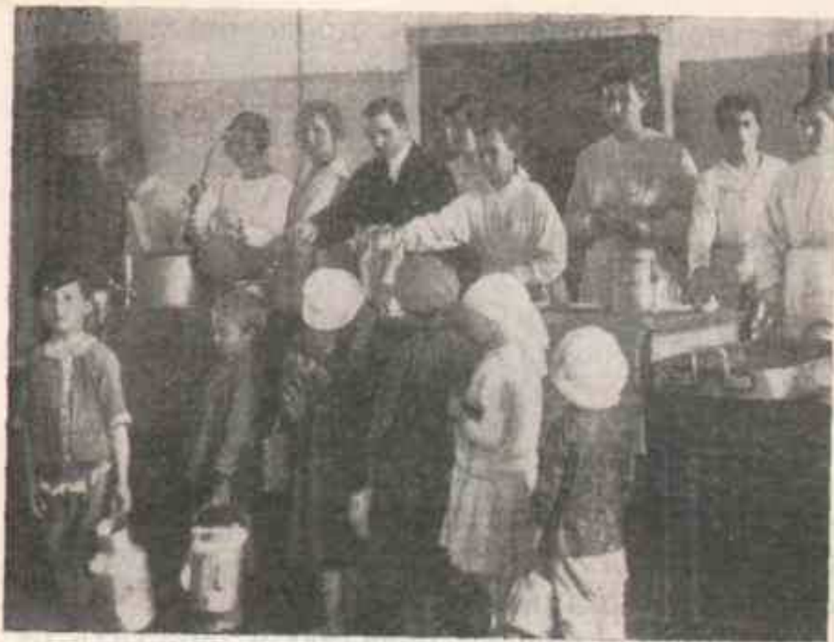
Детский питательный пункт.

Большое значение для дальнейшего улучшения работы продорганов Петрограда сыграли решения VII общегородской партийной конференции, состоявшейся в сентябре 1918 года. Выполняя их, партийные организации Петрограда направили в компрод сотни беззаветно преданных делу революции коммунистов. К концу октября все