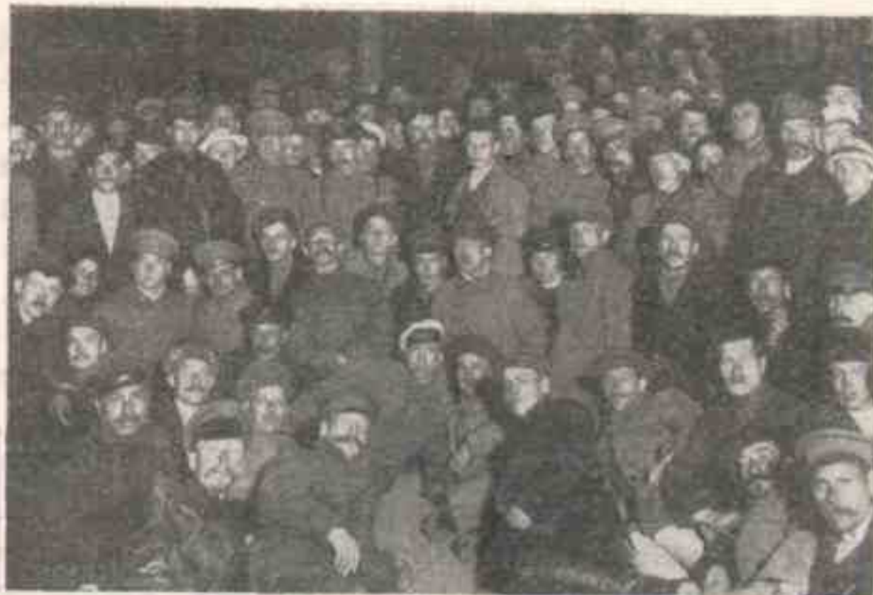
Группа продотрядников, отправляющихся на Урал.

И. Э. Якир. Часть петроградских рабочих была захвачена петлюровцами и приговорена к четырем годам каторжной тюрьмы, созданной в Каменец-Подольске. Попал в руки петлюровцев и А. К. Скороходов с несколькими товарищами. Они были расстреляны петлюровцами.