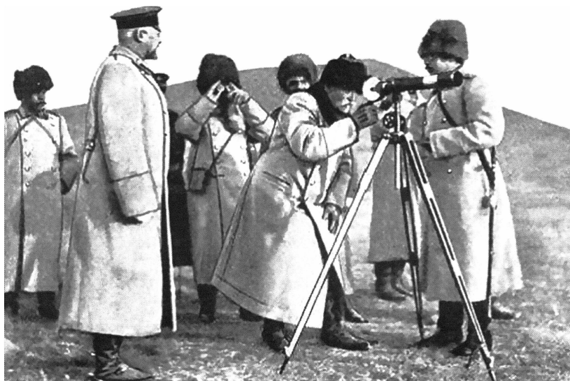
Главнокомандующий генерал от инфантерии Линевиц Н. П. и его начальник штаба генерал-лейтенант Харкевич В. И. (справа от ген. Линевица) на передовых позициях.