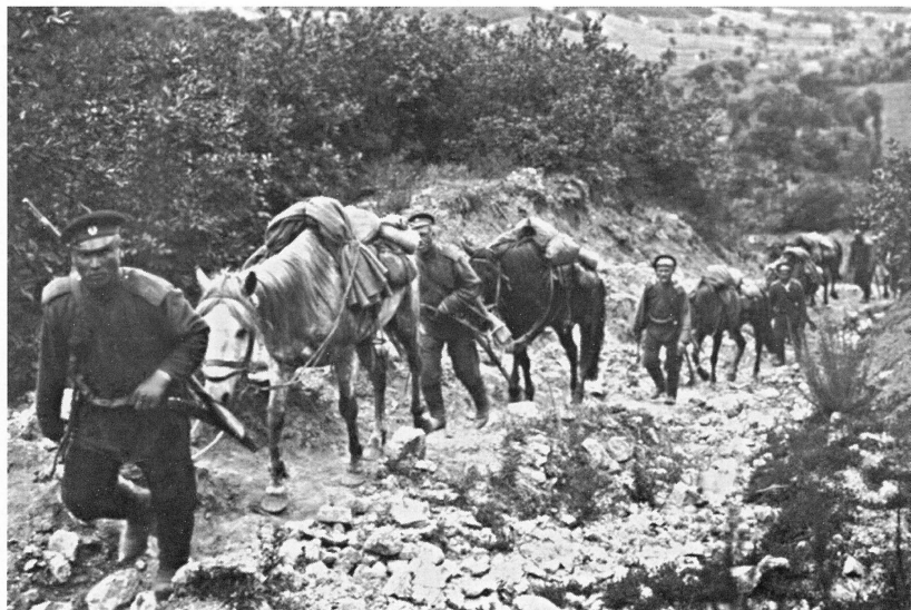
Усиленная рекогносцировка 3-го и 4-го июля 1904 г. отряда Князя Трубецкого близ деревни Ланафан. Фото В. Булла