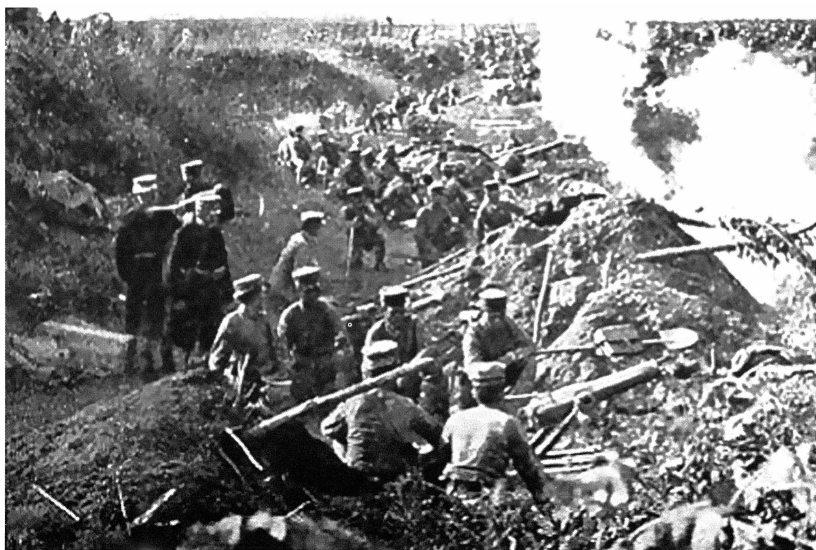
Японцы под Ляояном 18(31) августа 1904 г. на Северном фронте.