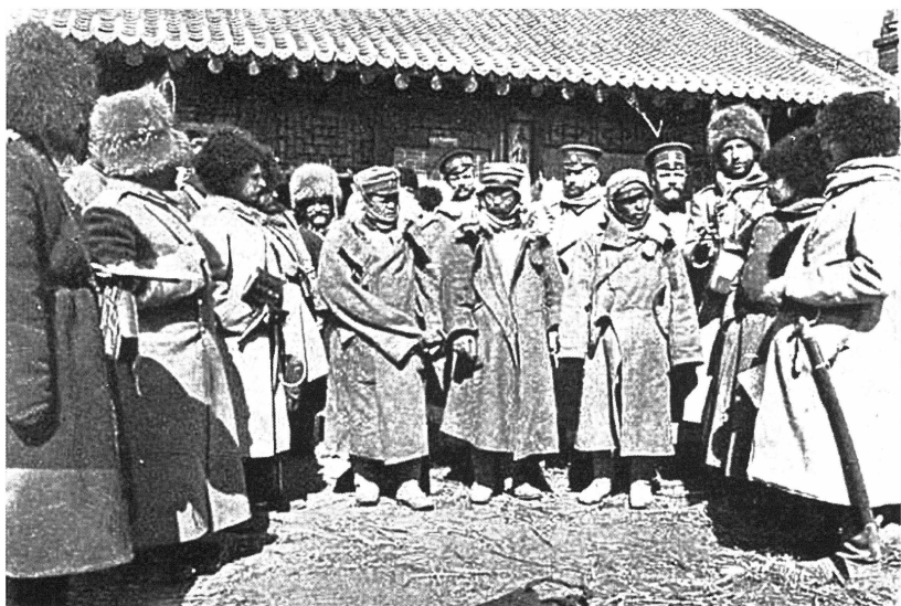
Допрос пленных японцев в штабе 2-й армии.