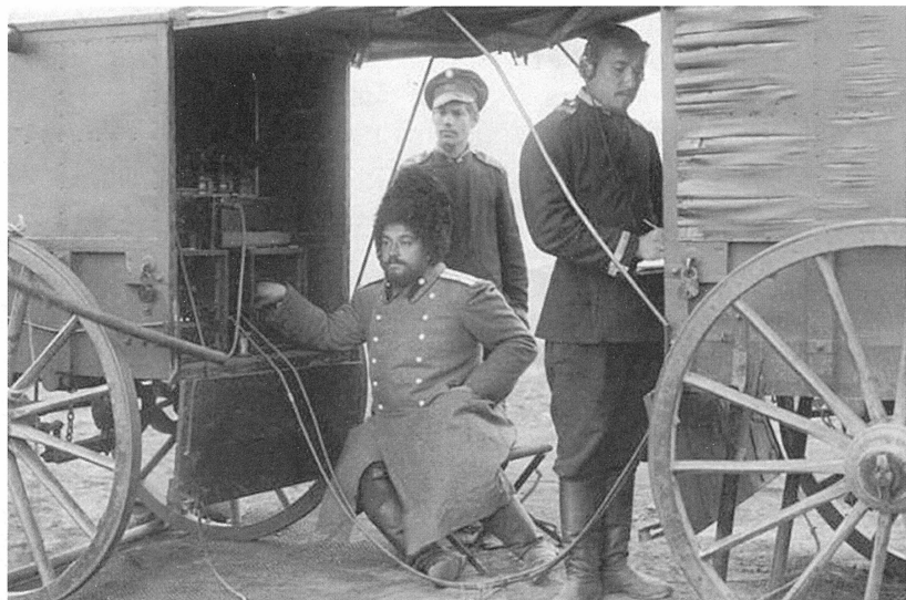
Беспроволочный телеграф, действующий между штабом Главного командующего и штабом Командующего 1-й Маньчжурской армии. 1904–1905.