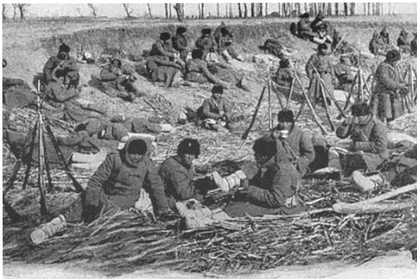
Восточно-сибирский осадный полк под Сандепу.