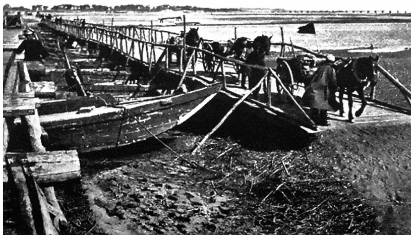
Мост № 3 через р. Хунь-Хэ («ни верхом, ни на козлах ездить не позволяется»)