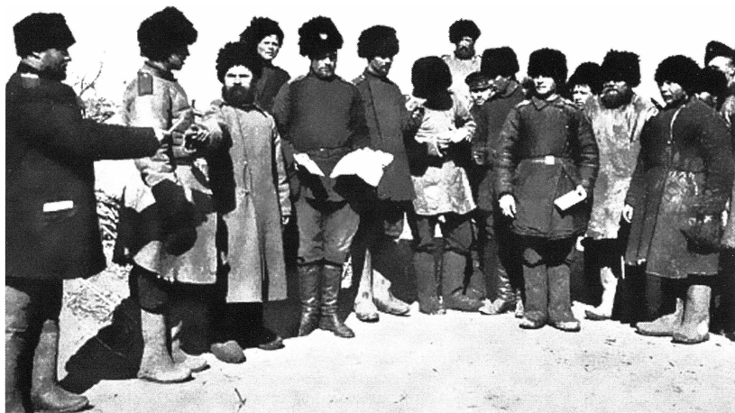
Раздача писем нижним чинам 4-го Сибирского корпуса.