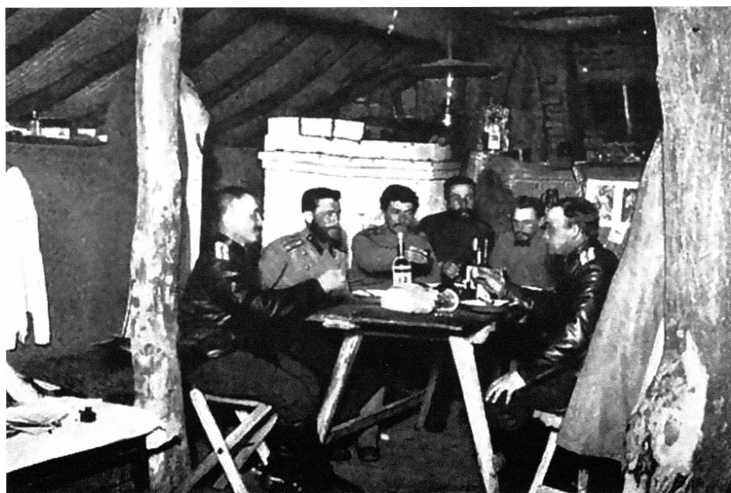
Внутренний вид землянки офицеров Барнаульского полка. Фотограф неизвестен