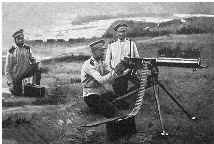
Вьючный (горный) пулемет. Фотограф неизвестен