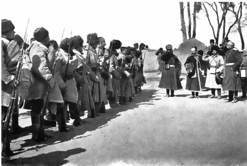
Командующий 2-й армией генерал Каульбарс А. В. здоровается со стрелками.