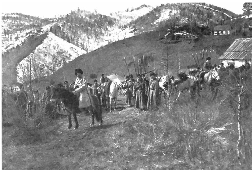
В Маньчжурии. Казачья сотня на привале.