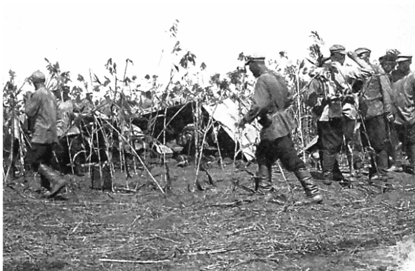
Бивак Томского полка в Гаоляне.