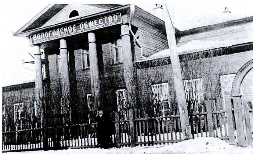
Здание посольства США в Вологде, март 1918. (Бывший клуб приказчиков)