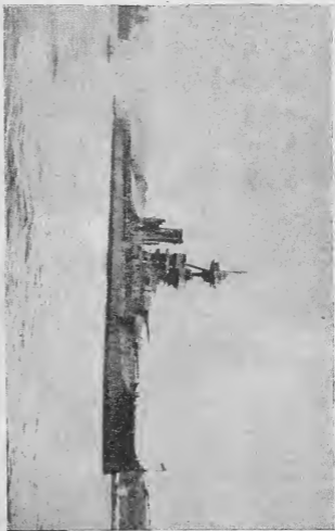
Английский дредноут „Королева Елизавета“, на орудиях которого был произведен обстрел советских войск Севастополя в марте 1919 г.

была достигнута. Казалось, что вопрос разрешен. Но нет,—союзники помогали присоединять Украину совсем не потому, чтобы дать хлеба Крыму: их этот вопрос меньше всего интересовал. Они шли в Россию для захвата юга, объединение всех частей нужно было для того, чтобы облегчить