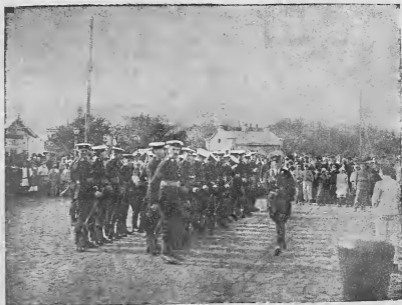
Отряд английских солдат в Феодосии в 1920 г.

В ответ на требование об освобождении политических заключенных правительство и командование решило перевести всех арестованных из Севастополя в Симферополь.