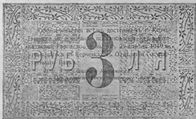
Денежный знак, предполож. к выпуску Керченским городским самоуправлением в 1919 году.

разве могли пойти на такую меру те, кто и к власти-то пришел только потому, чтобы спасти веками награбленное добро.