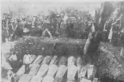
Похороны 24 красноармейцев, убитых снарядами английских дредноутов в боях 23—25 апреля 1919 года под Ак-Монаем и Камышами. (Могилы в г. Феодосии у фонтана Айвазовского).

сохранить под властью Деникина с тем, чтобы при улучшении положения на юго-востоке можно было из Керчи повести наступление на Красную армию, а до этого времени ежедневно мешать мирной жизни окрестных деревень, да и всего Крыма, ибо угроза со стороны Керчи вызывала сосредоточения против нее значительных сил армии. Коммунистическая организация была поставлена в невероятно тяжелые условия. Работать среди рабочих мелкобуржуазно настроенных было весьма трудно. Кроме социальных причин, которые сводились к тому, что, слабо организованный