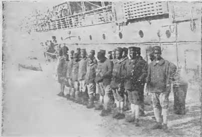
Сенегальский конвой при пленных русских солдатах, доставленных из Солоник на русском пароходе „Император Александр III“, зафрахтованном французским правительством.