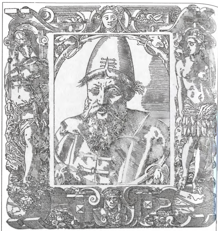
Василий III. Изображение на гравюре в книге П. Иовия «Elogia virorum... illustrium» (1575 г.)