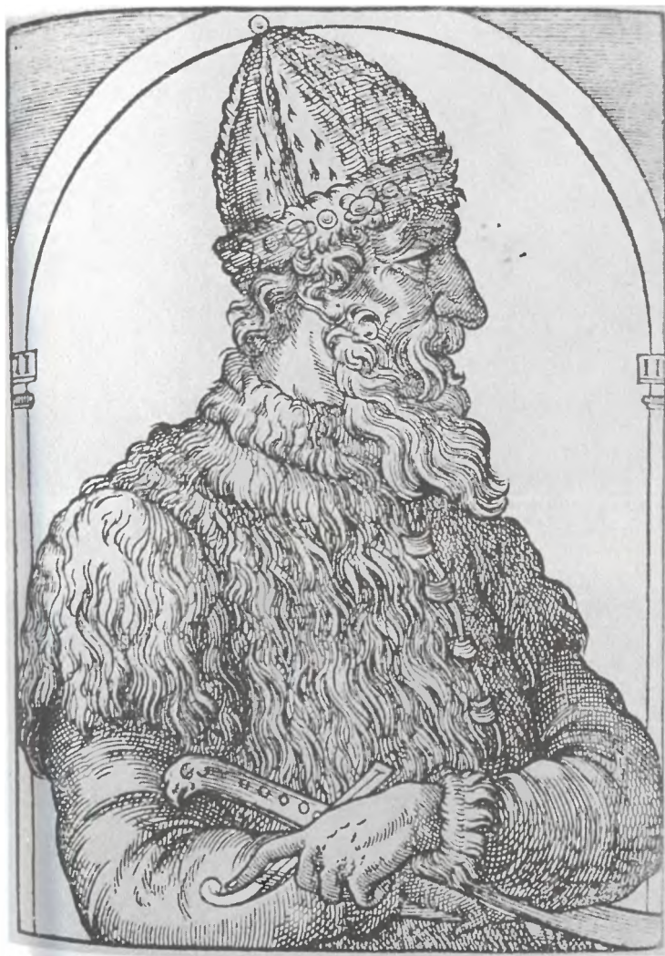
Иван III. Изображение на гравюре А. Теве. 1584 г.