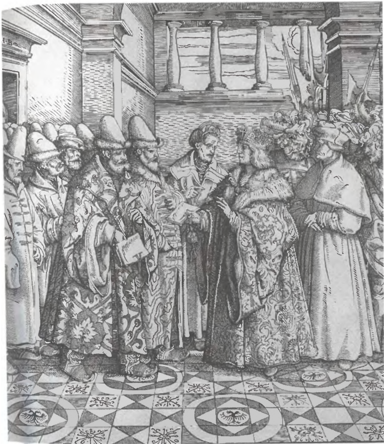
Московское посольство при дворе императора Максимилиана. 1518 г. Гравюра Г. Бургмайера