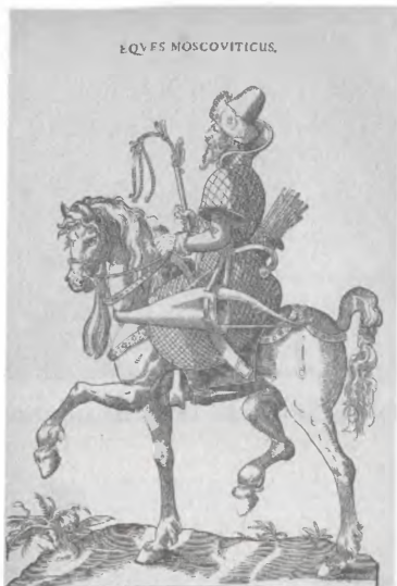
Московский конный воин. Гравюра из книги Г. Вайгеля « Habitus praecipuorum populorum » (1577 г.)