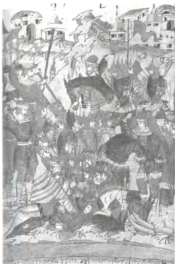
Сражение с царевичем Мустафой под Рязанью. 1443 г.