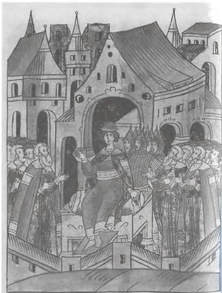
Восшествие на престол Ивана III. Миниатюра Лицевого летописного свода. XVI в.