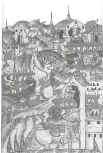
Поход Василия Темного против хана Улуг-Мухаммеда. 1445 г.