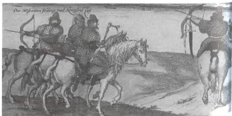
Московские конные воины. Гравюра из книги С. Герберштейна «Записки о Московии» (1549 г.)