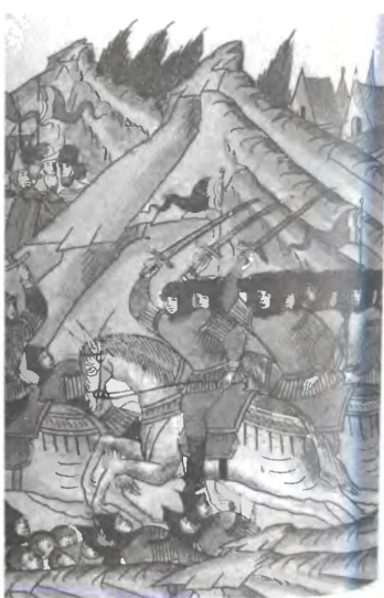
Сражение с ливонцами. 1502 г.