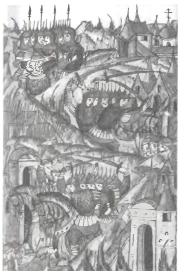
Поход татарских царевичей на «литовские города». 1445 г.