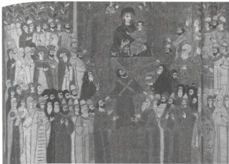
Изображение семьи Ивана III и его ближайшего окружения на шитой пелене. Конец XV в.