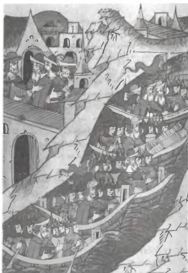
Судовая рать в Казань. 1505 г. Миниатюра Лицевого летописного свода. XVI в.