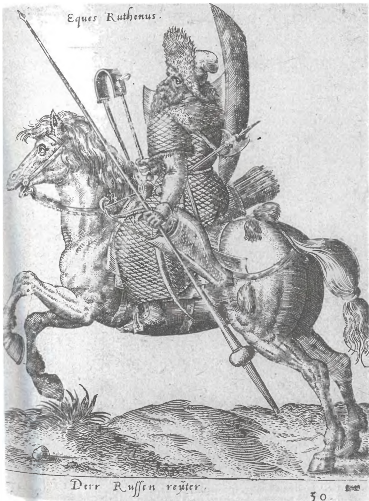
Русский (западнорусский) конный воин. Гравюра А. де Брюна. 1577 г.