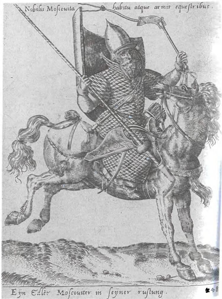
Московский знатный воин. Гравюра А. де Брюна. 1577 г.