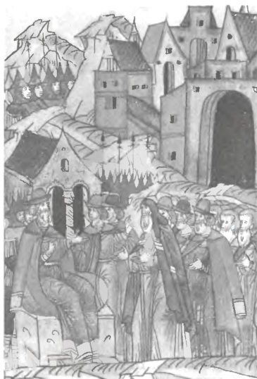
Сдача Твери Ивану III. 1485 г.