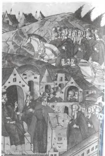
Взятие Пскова. 1510 г. Миниатюра Лицевого летописного свода. XVI в.