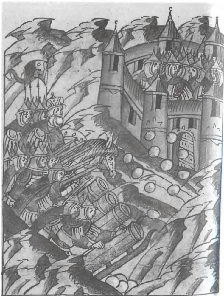
Осада Смоленска. 1514 г. Миниатюра Лицевого летописного свода. XVI в.