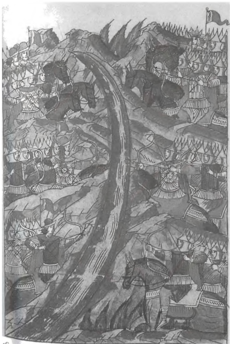
«Стояние на Угре». 1480 г. Миниатюра Лицевого летописного свода. XVI в.