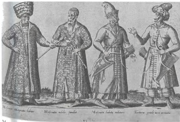
Московиты (вельможа, дворянин, воин) и татарин. Гравюра А. де Брюна. 1581 г.