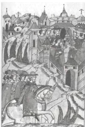
Поход Василия Темного на Новгород «миром». 1460 г.