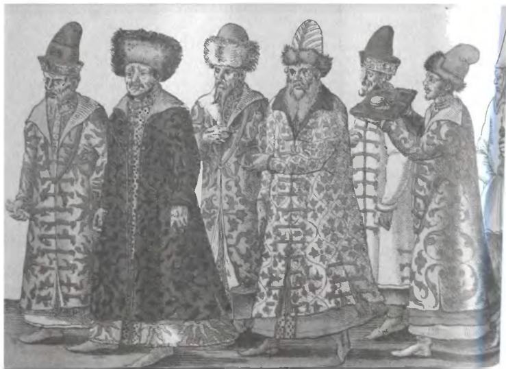
Московское посольство к императору Максимилиану II. 1576 г. Фрагмент гравюры последней трети XVI в.