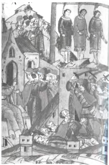
Казнь новгородских изменников, 1488 г.