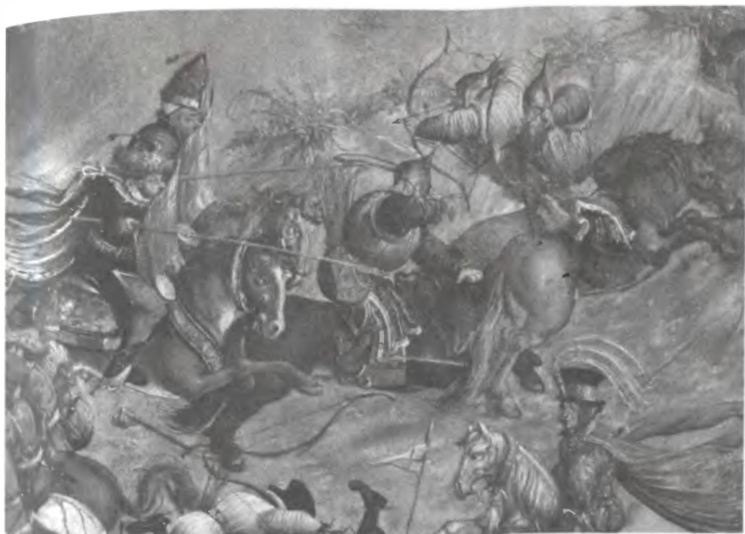
Сражение под Оршей. 1514 г. Фрагмент картины первой половины XVI в.