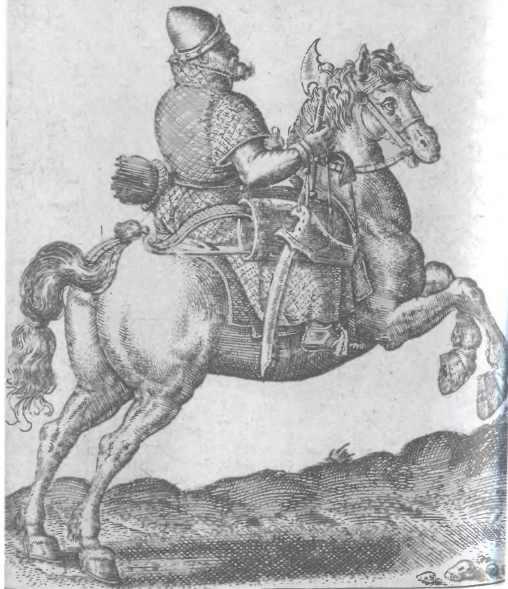
Московский конный воин. Гравюра А. де Брюна. 1577 г.