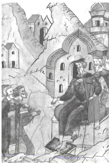
Раздача поместий новгородцам. 1488 г.