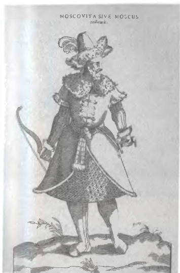
Московский воин. Гравюра из книги Г. Вайгеля « Habitus praecipuorum populorum » (1577 г.)