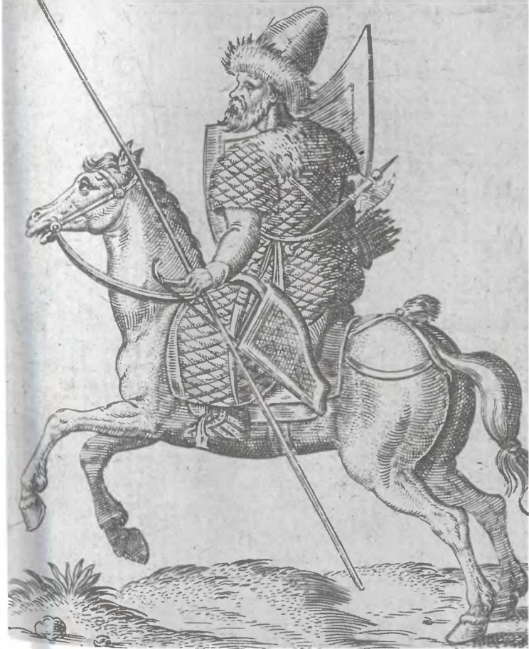
Русский (западнорусский) конный воин. Гравюра А. де Брюна. 1577 г.