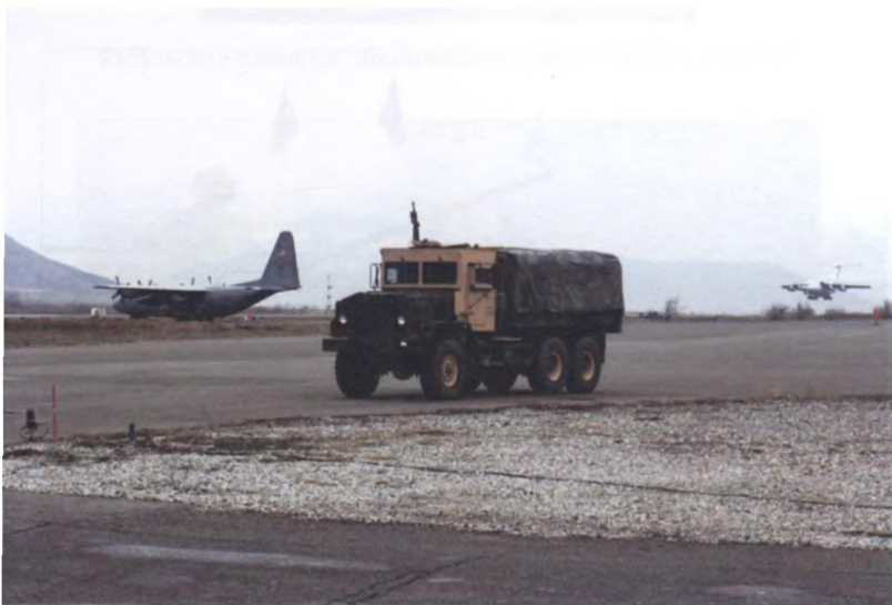
Посадка Ил-76 в аэропорту Кабула