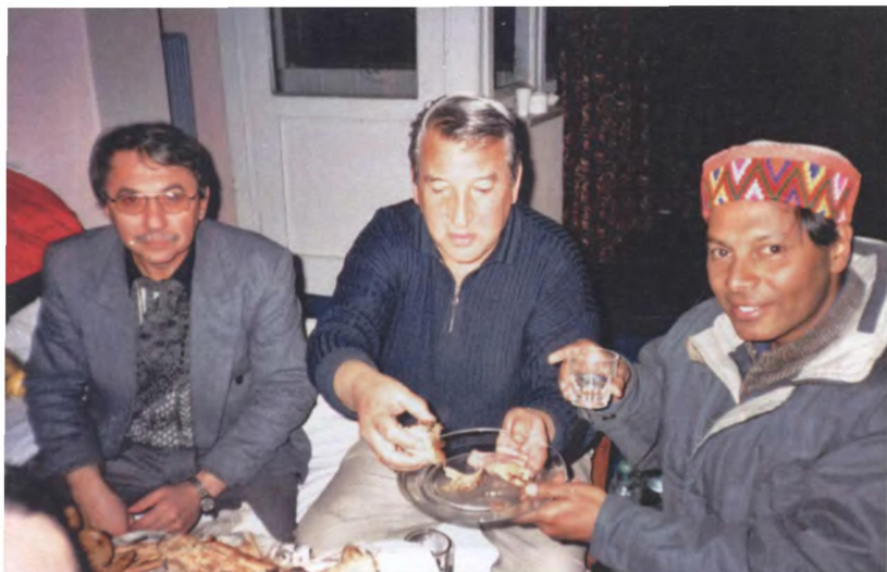
Сотрудники передовых групп России и Индии в Афганистане делят хлеб в отеле "Кабул" (декабрь 2001 г.)