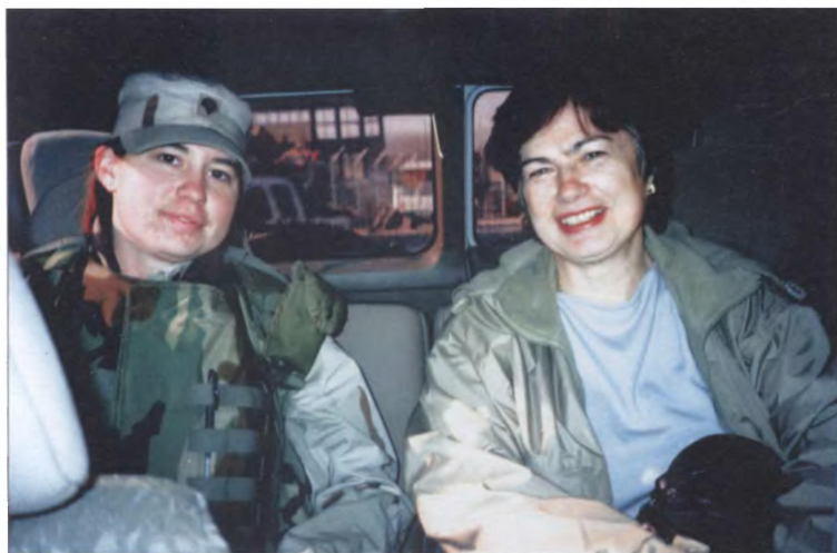
Женщинам всегда есть о чём поговорить... Сотрудница российского посольства и военнослужащая армии США на базе в Баграме