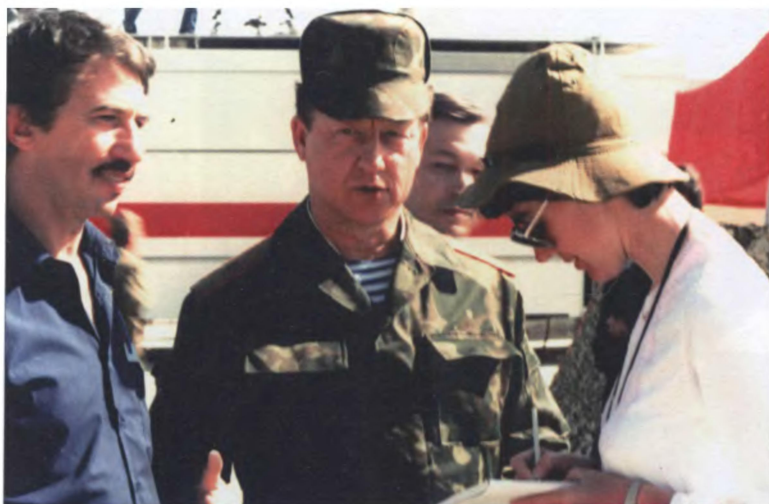
Вывод войск из Афганистана. Посольство и политотдел 40-й армии работают с западными журналистами