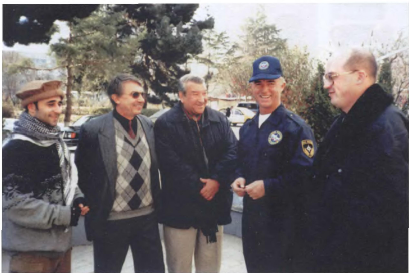
Сотрудники Посольства России и МЧС в Кабуле (февраль 2002 г.)