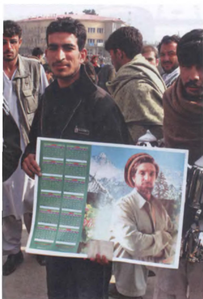
Жива память об Ахмад Шахе Масуде