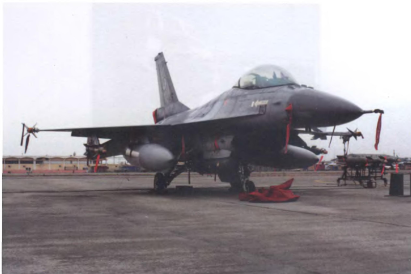
Американский истребитель F-16 в аэропорту Кабула