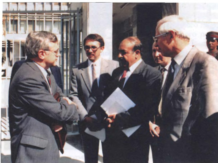
Посол СССР Б. Н. Пастухов с афганскими и советскими дипломатами и журналистами