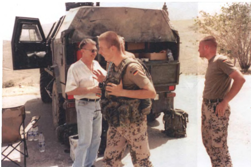
На блок-посту немецкого контингента МССБ