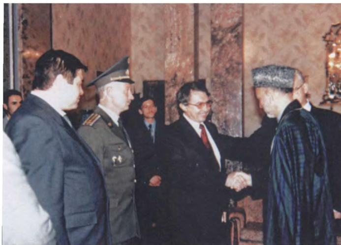
Представление сотрудников Посольства России президенту Афганистана Х. Карзаю (2002 г.)