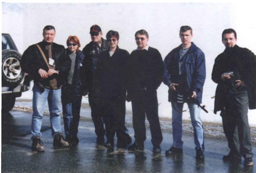
На дороге в Баграм (февраль 2003 г.)