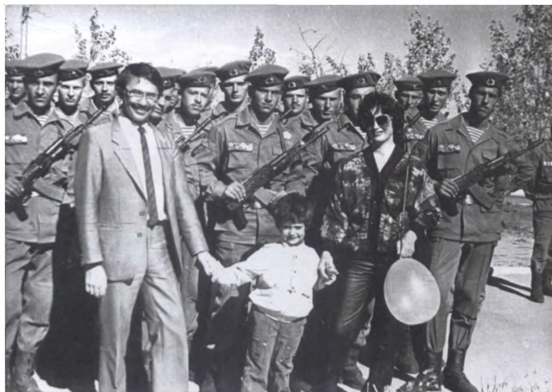
Десантники и сотрудники посольства на параде 40-й армии 7 ноября 1987 г.