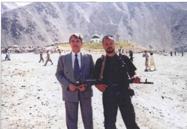
Российское посольство в Паджшире на могиле Ахмад Шаха Масуда