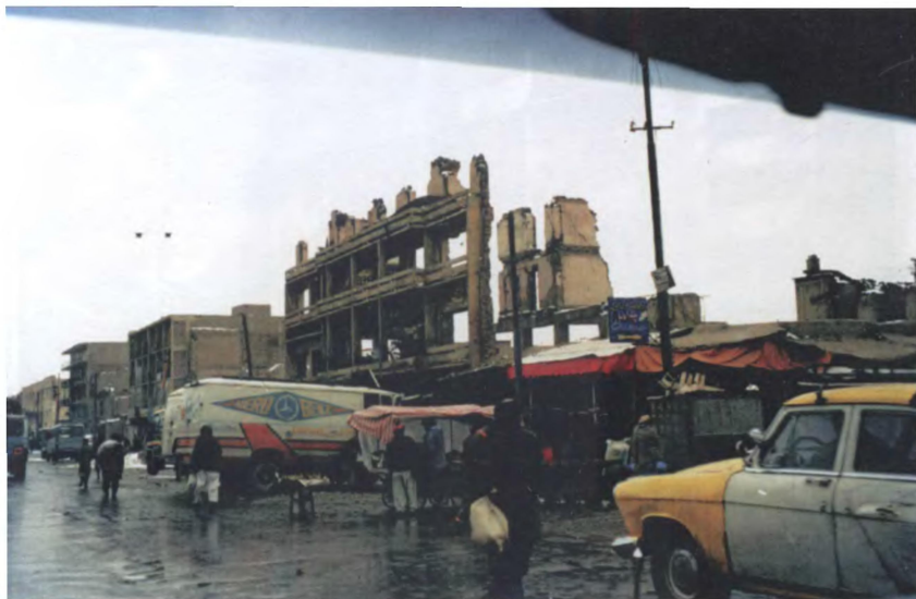
Кабул после талибов