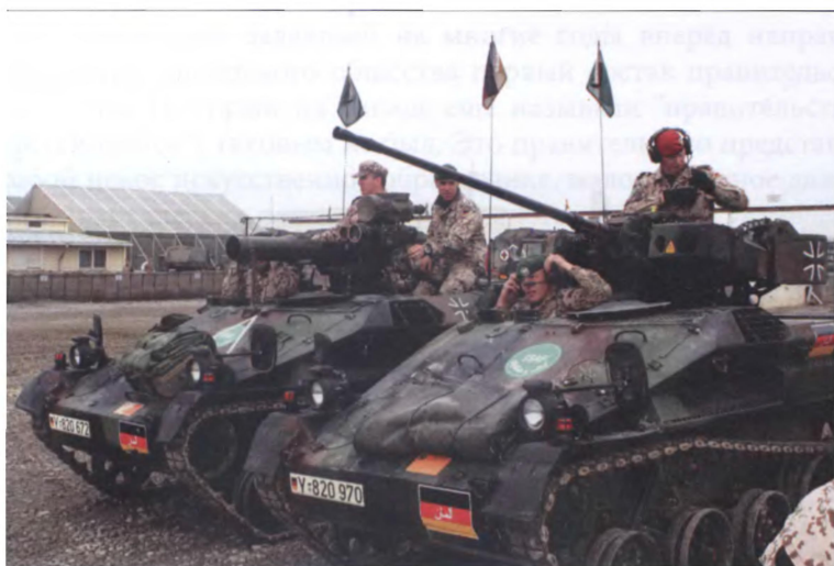
Немцы в Кабуле