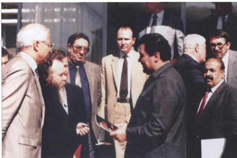
Президент ДРА Наджибулла встречается с советскими журналистами