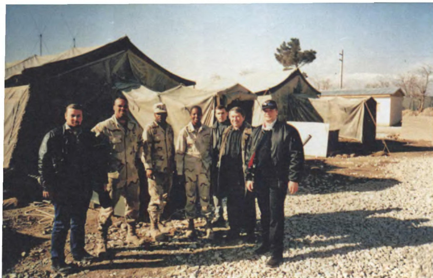
Сотрудники Посольства России на натовской базе в Баграме