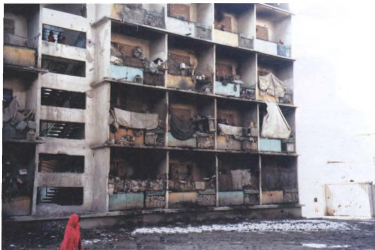
Беженцы на территории бывшего советского посольства