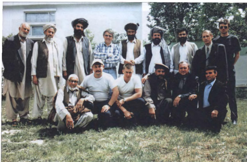
Старейшины пуштунских племён во временном расположении Посольства России