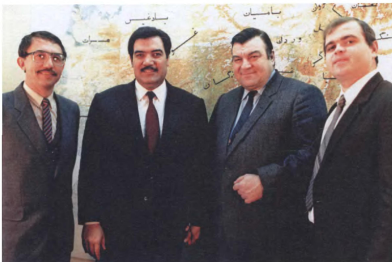
Президент ДРА Наджибулла с советскими дипломатами и партийными советниками