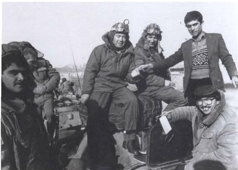
Афганцы и русские. Везём гуманитарную помощь в зону, подконтрольную моджахедам ИПА (1987 г.)