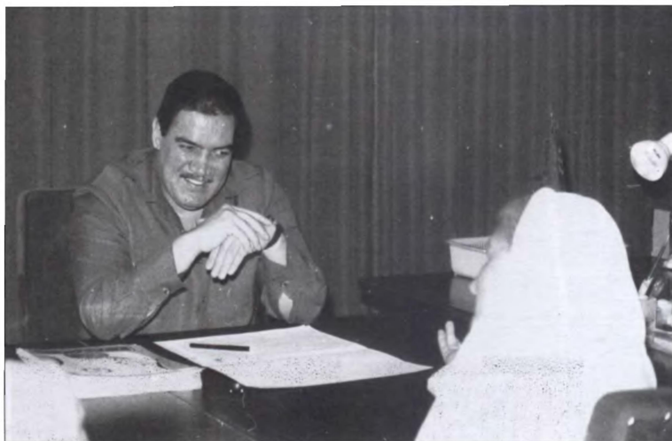
Президент ДРА Наджибулла встречается с представителями населения Кабула