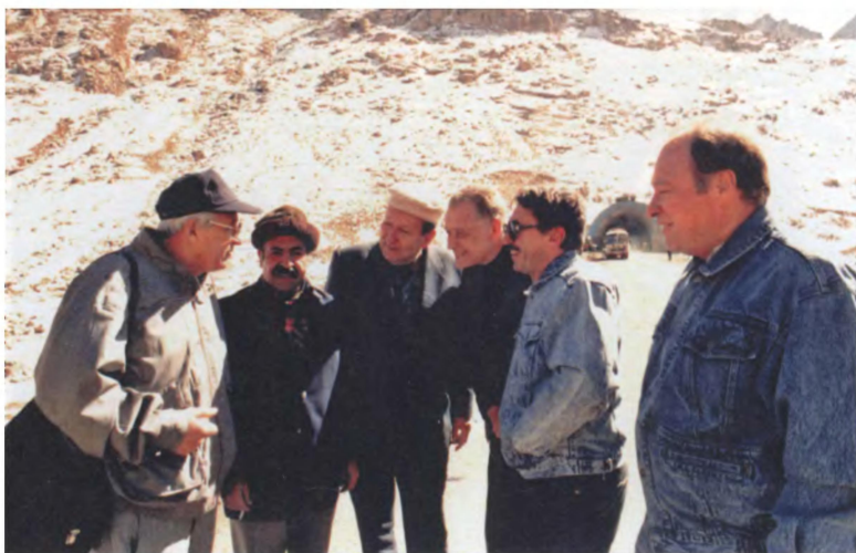
Вывод войск из Афганистана. Советские дипломаты и журналисты на перевале Саланг, через который должна была пройти колонна 40-й армии