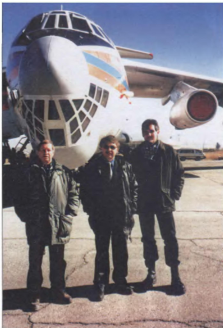
Кабульский аэропорт. Долгожданный борт с Родины (2002 г.)