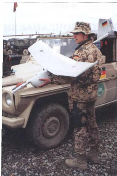
Немецкий военнослужащий с дроном