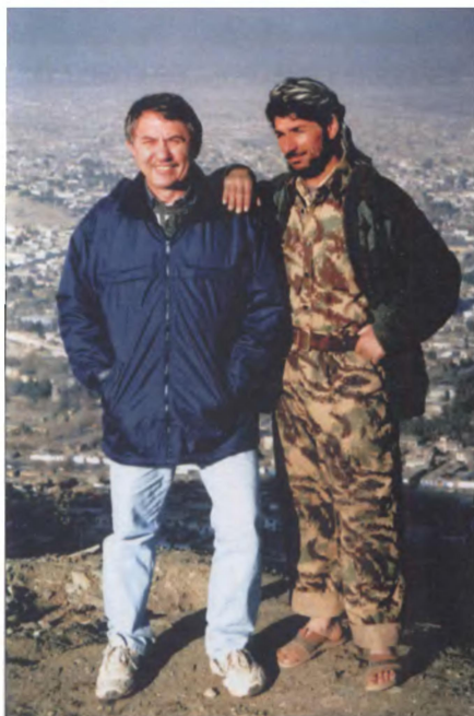
Афганский моджахед: "Не с теми воевали..."