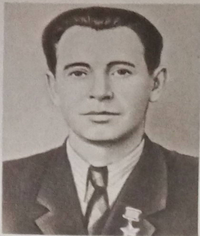
П. М. Машеров