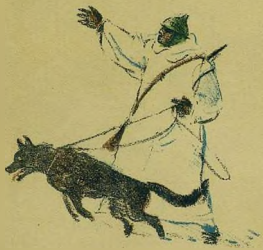
Рисунки Г. Шевякова