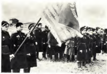
Полк получил гвардейское знамя. Ивановская, июль 1943 года.