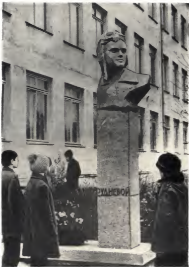
У памятника Жене Рудневой. Памятник установлен 25 декабря 1975 года на средства пионеров и школьников в г. Керчи возле средней школы № 15.