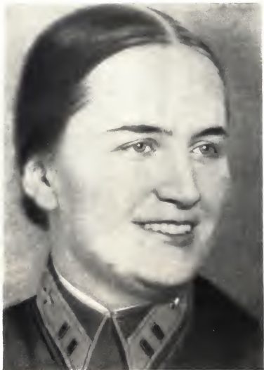
Организатор женских авиационных полков Герой Советского Союза Марина Михайловна Раскова.