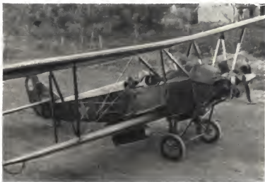
«Старшина фронта» — ПО-2.