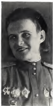
Командир 46-го гвардейского Таманского полка Евдокия Да- видовна Бершанская.