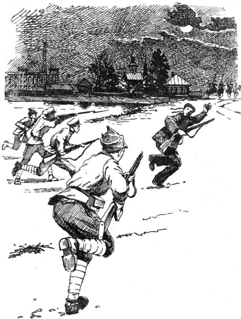
С пустыря выскочила кучка красноармейцев.