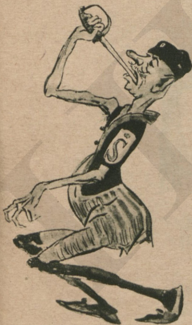
Маннергейм — — шпагоглотатель.