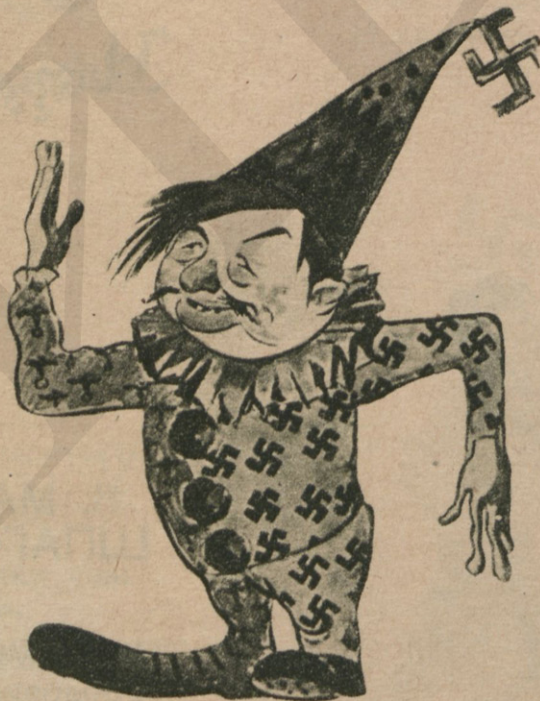
Рыжий у ковра.

Вот стоит премьер Виши Грязный и всклокоченный И хохочет от души, Получив пощечины.