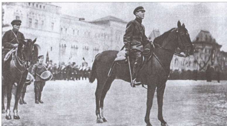
Командующий войсками Московского военного округа Б.М. Шапошников на военном параде в Москве. Май 1928 года