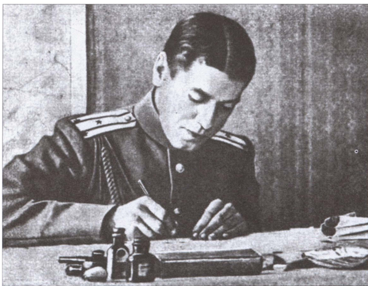
Подполковник Б.М. Шапошников в оперативном отделе Юго-Западного фронта в годы Первой мировой войны