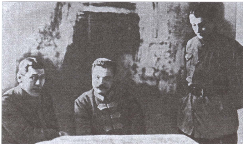
Б.М. Шапошников. М.В. Фрунзе, М.Н. Тухачевский. 1922 г.