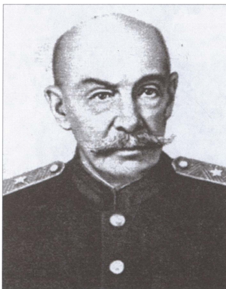
М.Д. Бонч-Бруевич. 1940 г.