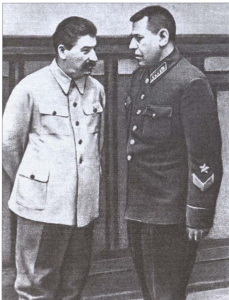
Б.М. Шапошников на докладе у И.В. Сталина. 1938 г.