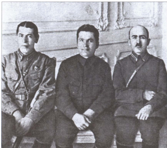
Б.М. Шапошников, С.М. Киров, О.А. Сааков. 1925 г.