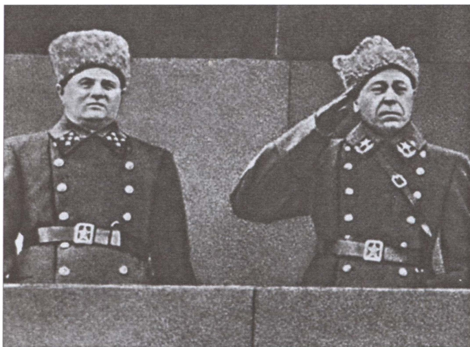
Маршал Советского Союза Б.М. Шапошников и генерал армии К.А. Мерецков на трибуне Мавзолея В.И. Ленина на Красной площади в Москве 7 ноября 1940 года