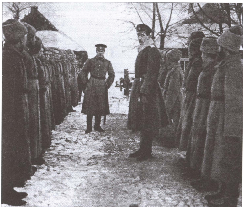
Б.М. Шапошников среди солдат. 1914 г.