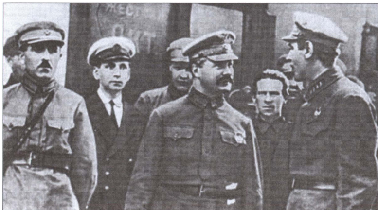
Приезд председателя РВС СССР М.В. Фрунзе в Ленинград. Слева направо в первом ряду: начальник Политуправления округа О.А. Сааков, М.В. Фрунзе, помощник командующего войсками Ленинградского округа Б.М. Шапошников. 1925 г.