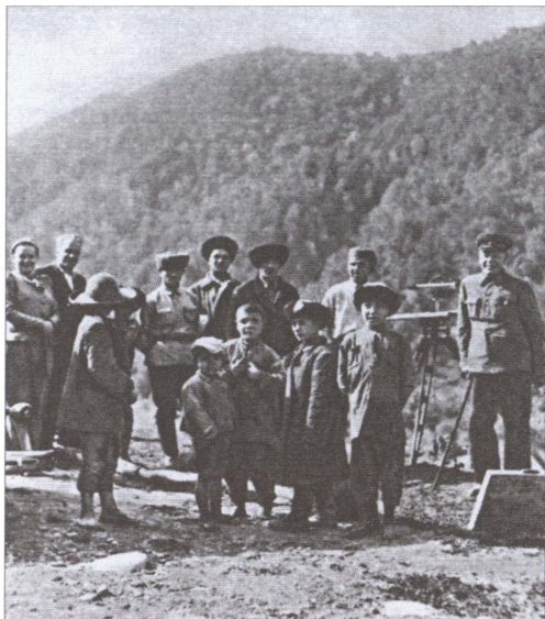
Б.М. Шапошников на отдыхе. Кисловодск, 1940 г.