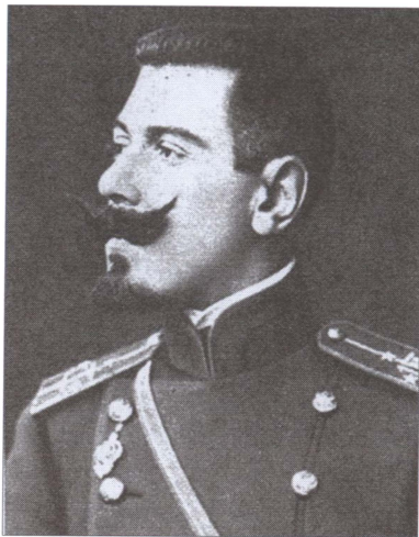
Поручик Б.М. Шапошников. 1907 г.