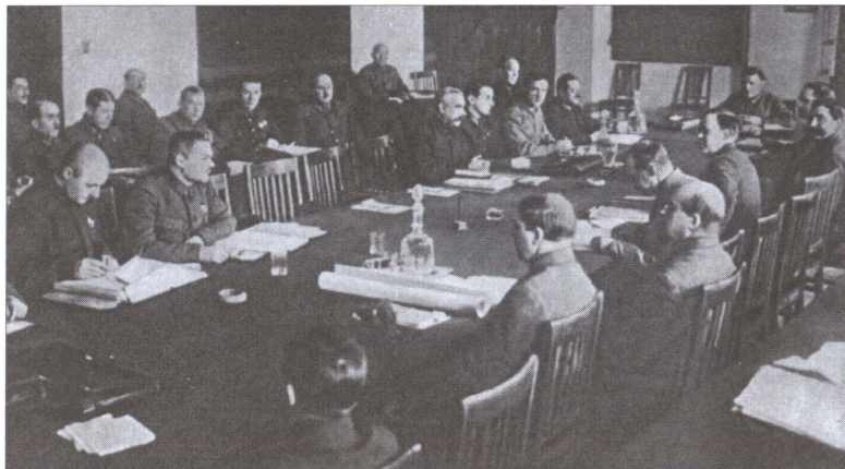
Заседание РВС СССР под председательством К.Е. Ворошилова