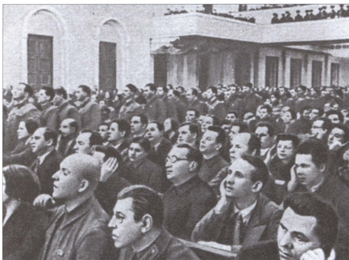
Б.М. Шапошников среди делегатов XVIII съезда ВКП(б). Март 1938 года