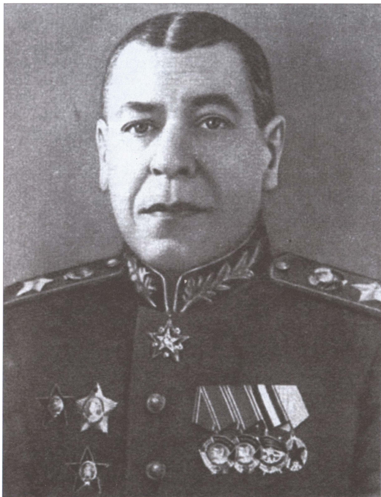
Маршал Советского Союза Борис Михайлович Шапошников