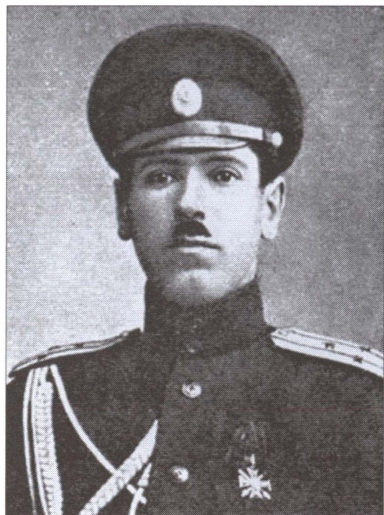
Б.М. Шапошников. 1914 г.