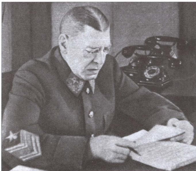
Заместитель наркома обороны СССР Б.М. Шапошников в рабочем кабинете. 1942 г.