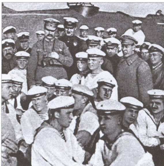
М.В. Фрунзе, А.К. Векман (стоит за ним) и Б.М. Шапошников среди краснофлотцев эсминца «Карл Маркс». 1925 г.