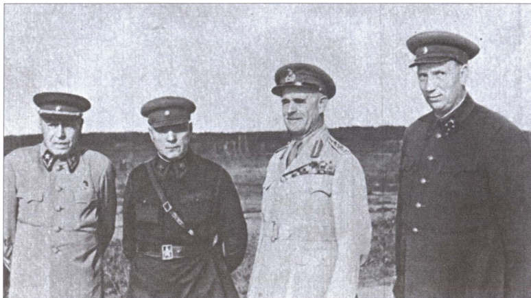
Б.М. Шапошников, К.Е. Ворошилов, Н.Н. Воронов и представитель английской военной миссии (третий слева) на осмотре боевой техники Красной Армии. Подмосковье, 1942 г.