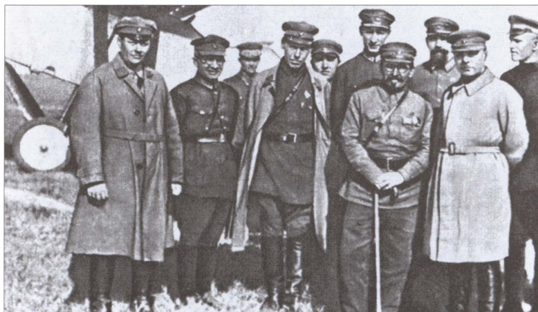
Первый ряд: К.Е. Ворошилов (первый справа), П.П. Лебедев (второй справа), Б.М. Шапошников (третий справа). Второй ряд: П.Е. Дыбенко (второй справа), П.И. Баранов (третий справа) и другие. На учениях Киевского военного округа. 1930 г.