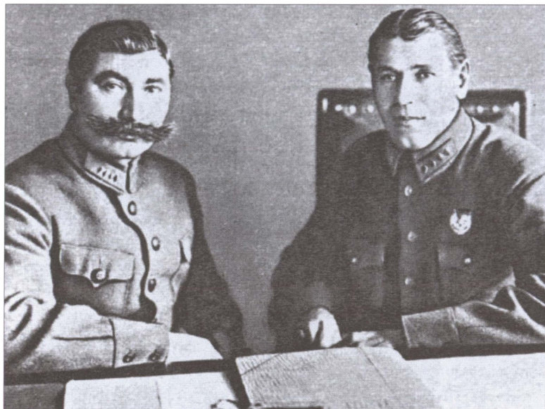
С.М. Буденный и Б.М. Шапошников