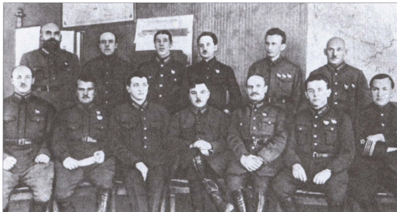
Участники совещания командующих войсками округов. Сидят (слева направо): Г.Д. Базилевич, М.К. Левандовский, М.Н. Тухачевский, К.Е. Ворошилов, Н.Н. Петин, А.И. Корк, В.М. Орлов. Стоят (слева направо): А.В. Павлов, М.В. Викторов, Б.М. Шапошников, А.К. Векман, И.П. Уборевич, К.А. Авксентьевский. 1927 г.