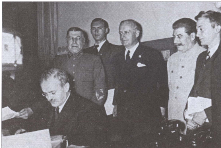
Подписание пакта о ненападении между СССР и Германией (пакт Молотова — Риббентропа) 23 августа 1939 года