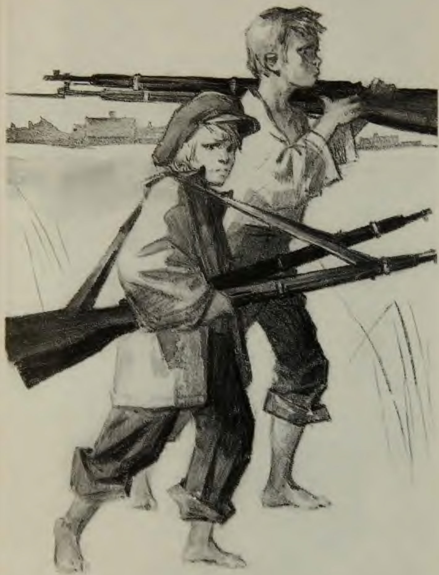
«Мать и сын»