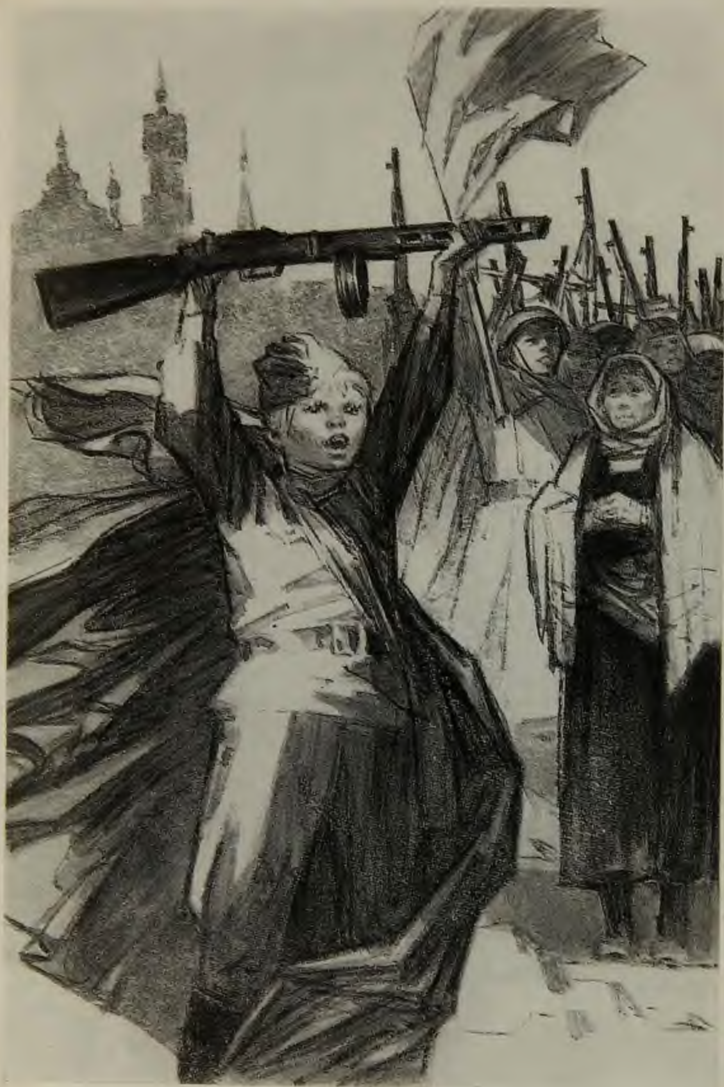
«Как я стал гвардейцем»