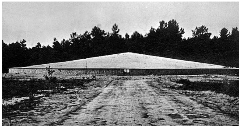
«Курган из пепла» (фрагмент Мемориального комплекса лагеря смерти Собибор).