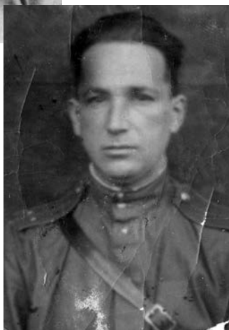
А. Печерский. На обороте нижней фотографии сделанная его рукой надпись: «1943».