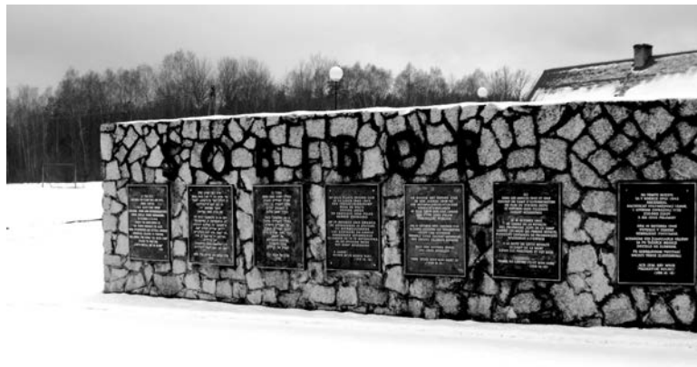
Плиты на памятнике у входа в Мемориальный комплекс «Собибор». На плитах надписи на английском, идиш, иврите, голландском, немецком, французском, словацком и польском языках. Ни упоминания об А. Печерском, ни плиты с надписью по-русски нет.