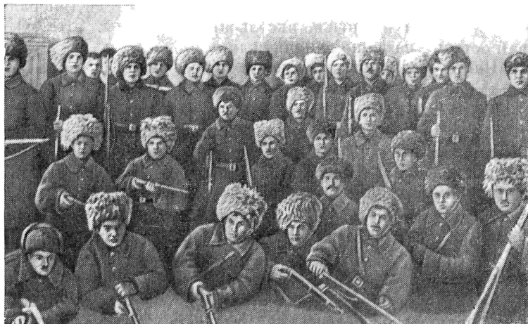
Матросы, занявшие ставку

— Это буржуйское отродье нас чернит, — возмущенно сказал Круг.