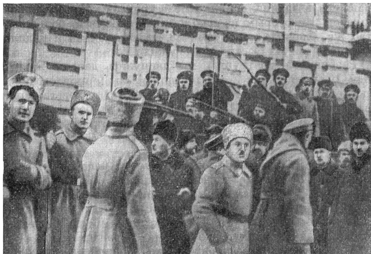
Матросы «Авроры» на улицах Петрограда в дни Февральской революции

Этот февральский день на всю жизнь остался в памяти. На улицах и площадях Петрограда слышались песни и звуки оркестров. Над головами людей реяли красные знамена, поблескивали трехгранные штыки солдат и матросов.