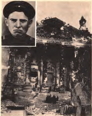
Здесь, на первых ступенях рейхстага, был сражен Петр Николаевич Пятницкий. 1945.