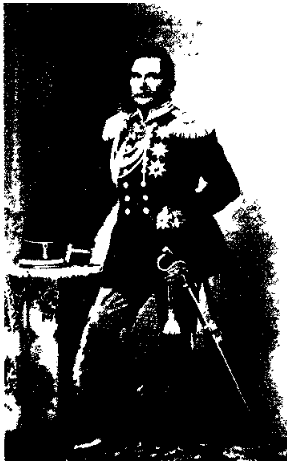
В. А. Долгоруков

против предпринятых нововведений, в особенности же против посягательства на права дворян-помещиков. Некоторые из самых ярых представителей барства цинично заявляли, что они сумеют опровергнуть все выдумки «красных», «демагогов» и повернуть дело на другой путь. Были примеры, что государевы флигель-адъютанты и генерал-адъютанты, в своем раздражении, покидали службу и уезжали за границу.