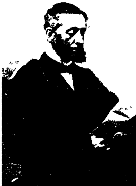
П. А. Валуев

ему много задушевного сочувствия, много лестного для минувшей его деятельности. Конечно, ему грустно было расстаться с делом, которому посвятил столько трудов и забот, еще грустнее было видеть, в чьи руки оно перешло и какое направление может быть ему дано при дальнейшем практическом осуществлении, но с другой стороны, после нескольких лет непрерывной работы, с постоянною борьбою против встречаемого противодействия, против интриги и клеветы, — ему необходим был некоторый отдых для восстановления утомленных сил физических и душевных. 27 Он рад был на некоторое время вырваться из душной атмосферы петербургской бюрократии и подышать свободным воздухом Западной Европы. Кроме того пребывание за границей могло принести пользу и для здоровья его жены и детей.