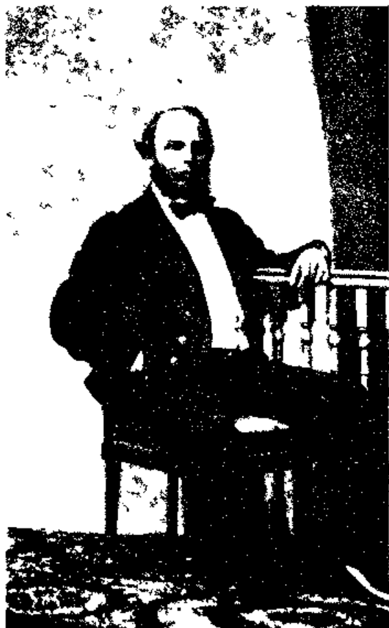
М. X. Рейтерн