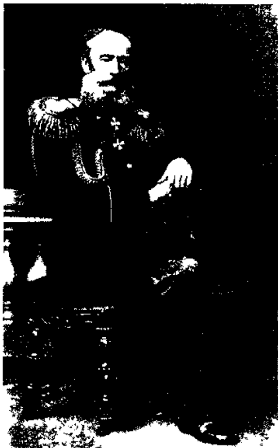
П. Х. Граббе

мышленности, к сближению административного устройства с общими учреждениями государственными, — встречало на Дону оппозицию. Начальник штаба вместо разъяснения настоящих целей нововведений, вместо содействия приведению их в исполнение, сам громче всех порицал получаемые из Петербурга распоряжения и возбуждал между казаками превратные толки о вообразяемых намерениях правительства вести к уничтожению казачества.