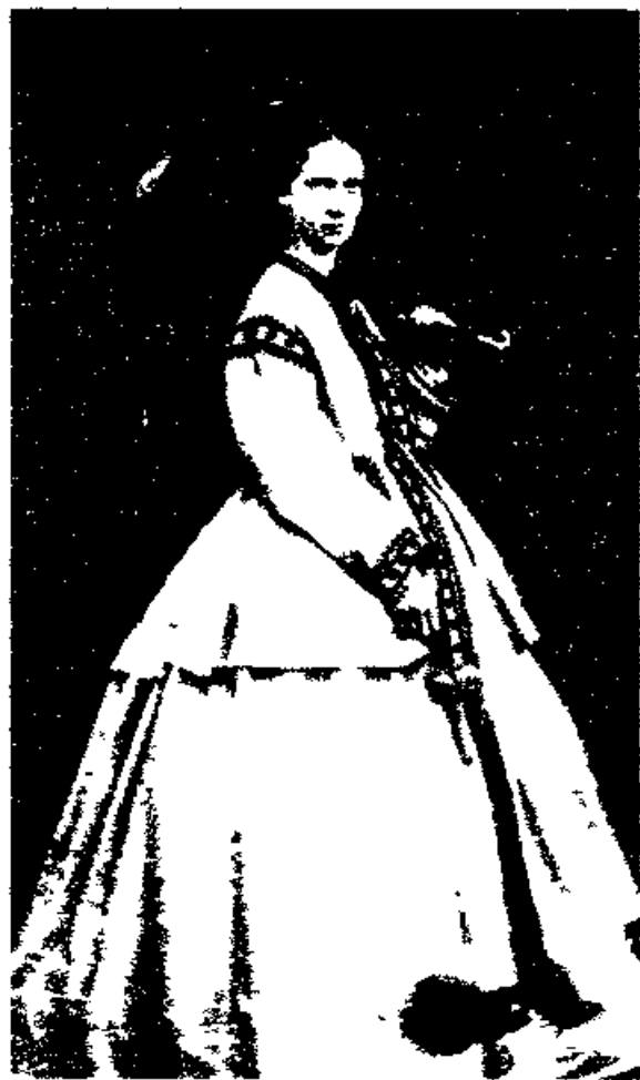
Императрица Мария Александровна