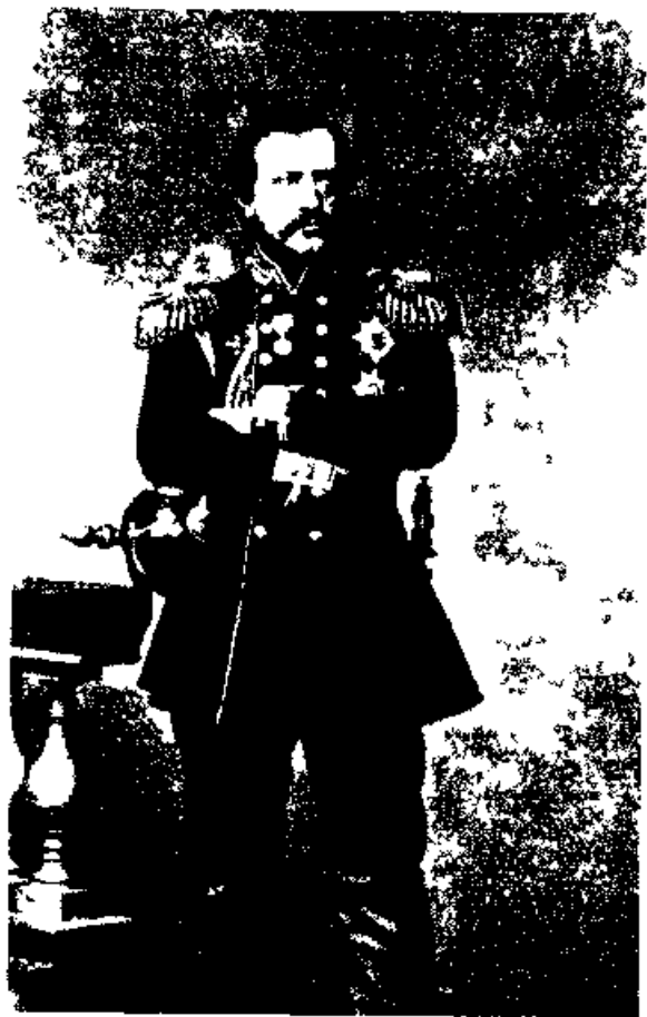
Н П Игнатъев

правителя или наместника богдыхана, брат его Гун-цин-ван обратился к генералу Игнатъеву, прося его совета и заступничества пред беспощадным врагом. Русскому генералу удалось склонить обе стороны к примирению, и при участии его подписан 12 (24)-го октября между союзниками и Китаем мирный договор.