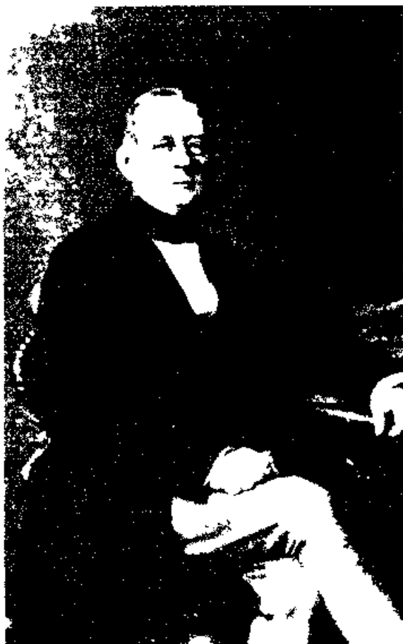
А М Горчаков

личества вывел заключение, что для возвращения брата к служебной деятельности время еще не наступило. В таком смысле Головнин написал моему брату, который на этом основании и решился провести еще одну зиму в Париже, к великому удовольствию дяди графа Киселева. Приехав со всей семьей в Париж в конце сентября, брат поселился в уютном домике в Champs-Élyses, rue Goujon*