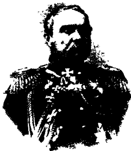
Н И Евдокимов

никами графа Евдокимова были по Кубанской области – генерал-майор свиты князь Дмитрий Иванович Святополк-Мирский, а по Терской – генерал-майор Павел Иванович Кемферт. Сам граф Евдокимов был тогда занят преимущественно Кубанскою областью и жил то в Ставрополе, то в Екатеринодаре или в отряде за Кубанью. Терскою же областью (во Владикавказе) управлял Кемферт – храбрый, боевой генерал, но плохой администратор и к тому же не чуждый слабости к крепким напиткам. Ему не по силам было справиться с такою нелегкою задачей, как приведение в благоустройство и в прочный порядок страны, только что покоренной и дотоле не знавшей никакой почти гражданственности. Чеченцы и ичкеринцы никогда не имели над собою прочно организованной власти и всегда отличались своим духом независимости, своеволия и хищничества. Вынужденные наконец подчиниться русской власти, они присмирели и домогались только