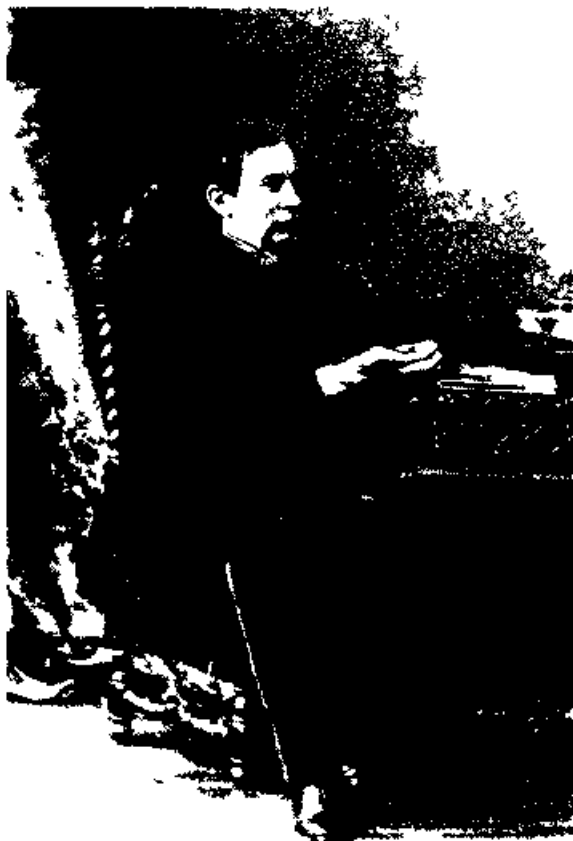
А В Головнин