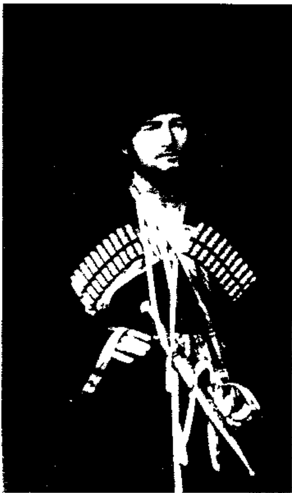
Кази Магома сын Шамиля

Таково было положение дел на Кавказе, когда фельдмаршал князь Барятинский покинул этот край, не дождавшись последнего финала, которым должен был вскоре завершиться достопамятный исторический акт — умиротворение Кавказа. С первых же дней января он подвергся сильнейшему приступу обычного его недуга — подагры, но на этот раз болезнь развилась до такой степени, какой никогда еще не достигала. Больной должен был лежать в постели почти неподвижно, в страшных страданиях, никого не принимал и передал исправление своей должности генерал-адъ-