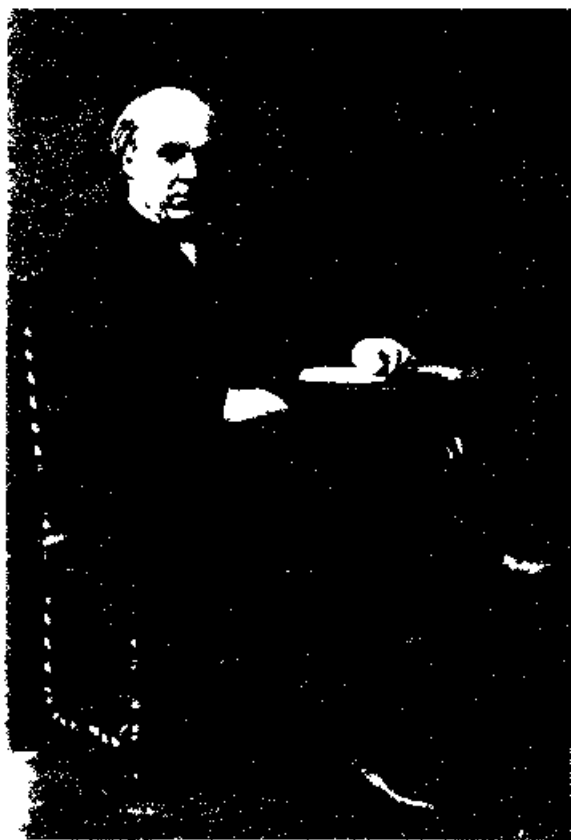
Н. А. Милютин

государственной мерой. Для этого самое приведение в исполнение нового закона должно было быть вырвано из рук тех, которые навлекли на себя ненависть помещичьего сословия, и вверено таким личностям, которых нельзя было ни в каком случае заподозрить во враждебности к дворянству.