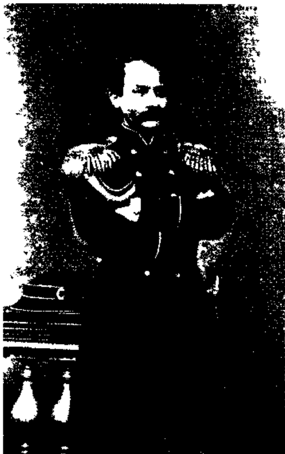
А. Е. Тимашев