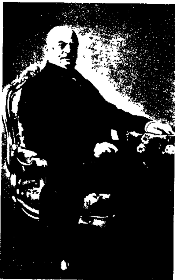
П. Д. Киселев

другими государями , настаивал однако же на необходимости увеличения вооруженных сил королевства, а также преобразования общей военной организации Германского Союза, на случай могущих возникнуть политических усложнений. Но палата, в прениях об ответном адресе, положительно высказалась в пользу объединения Италии и против солидарности Пруссии с Австрией.