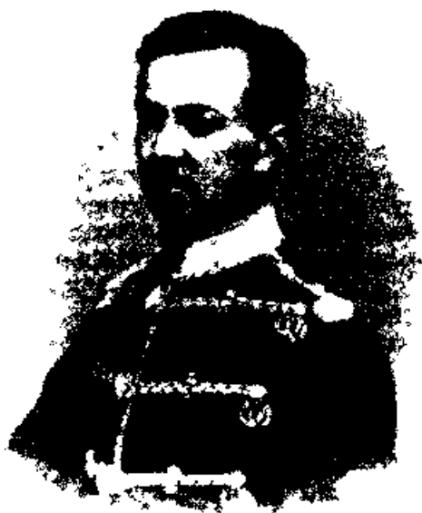
Цесаревич Николай Александрович