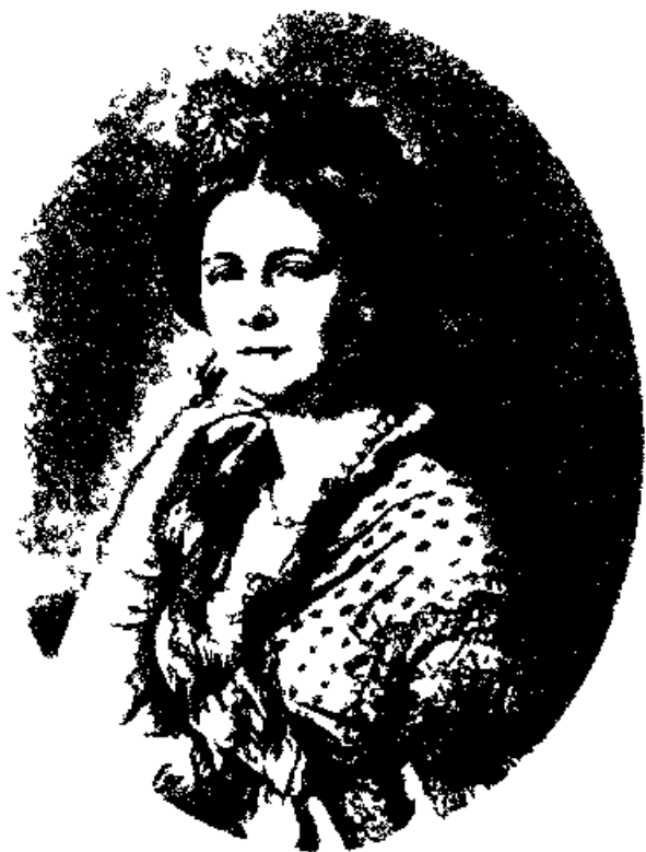
Большая Княгиня Елена Павловна