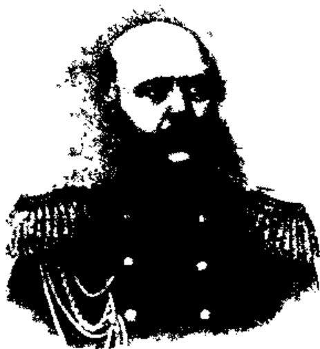
А. П. Ахматов

чакову, граф Нессельрод с тех пор не принимал участия в делах, хотя за ним и оставалось звание государственного канцлера. Он скончался на 82-м году жизни.