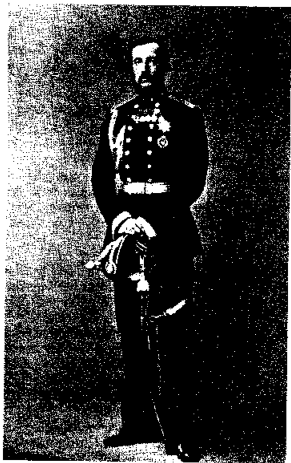
Великий Князь Николай Николаевич