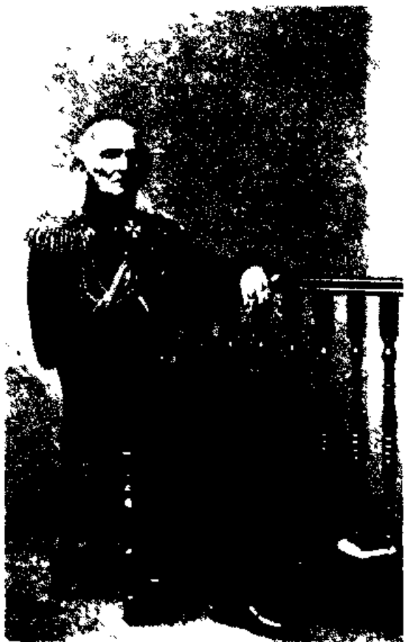
Н. О. Сухозанет

дороги в квартиру дежурного генерала, в здании Главного Штаба, где ожидали его некоторые из директоров департаментов и другие лица, имевшие надобность видеть министра, в числе их — и я Старика, еле живого, вводили под руки в кабинет генерала Герстенцвейга, где ожидал его камердинер с переменею платья. Я был несколько раз свидетелем его разоблачения: с него буквально стаскивали всю наружную меховую оболочку, и, после нескольких минут отдыха, он передавал по принадлежности доложенные бумаги для дальнейшего канцелярского исполнения.