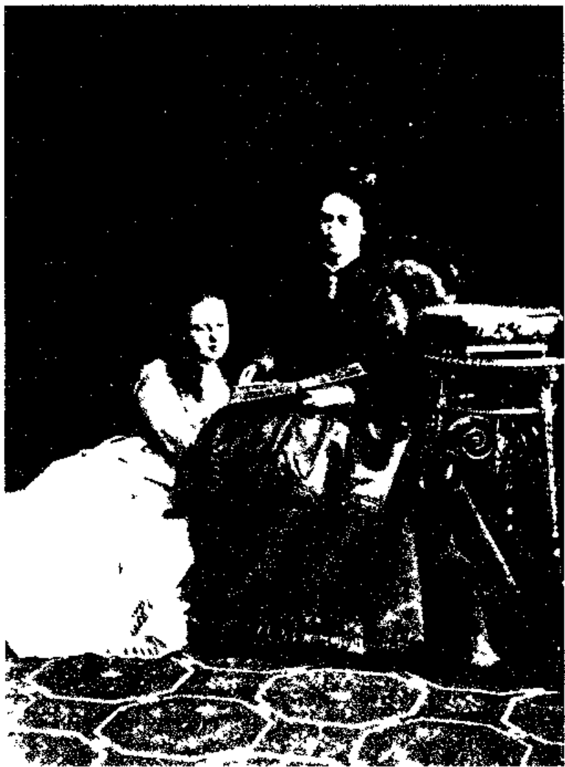
Великая Княгиня Мария Александровна и Императрица Мария Александровна