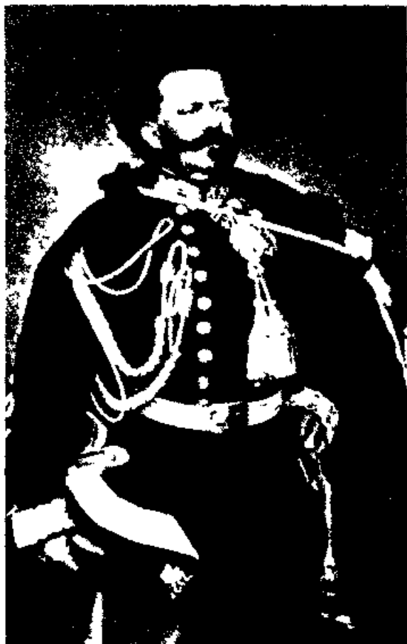
Король Виктор Эммануил

состоянии своими затеями и чрез то вынуждал все государства быть всегда на военном положении. В конце 1860 года и в начале 1861-го французские войска занимали Рим, эскадра французская стояла пред Гаэтой, осажденной сардинскими войсками, морские и сухопутные силы Франции действовали в Сирии, Кохинхине, Китае, и затевались еще новые экспедиции.