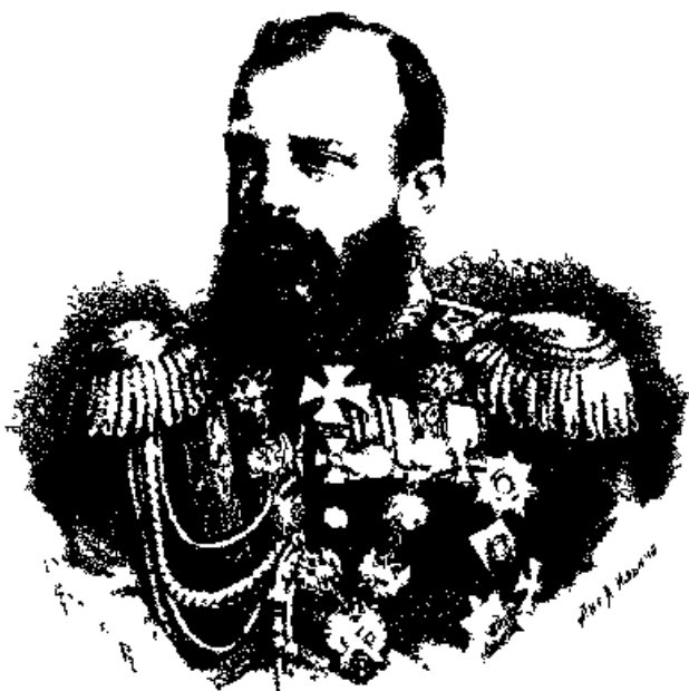
Великий Князь Михаил Николаевич