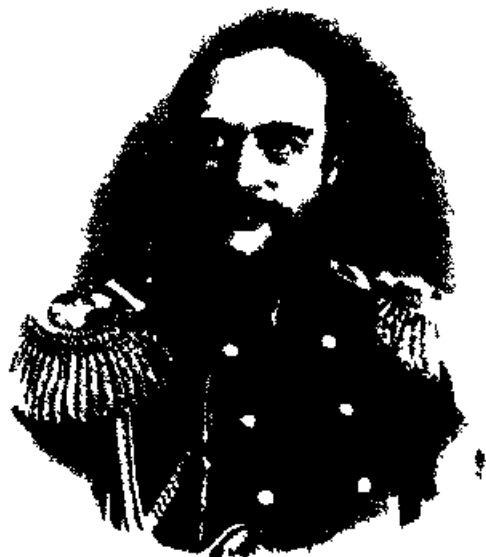
Г Мекленбург- Стрелицкий

ний директора департамента и начальника штаба, по части же артиллерийской решению вопроса много помогло новое назначение Великого Князя Михаила Николаевича и предстоявший отъезд его на Кавказ. Прежние опасения его окончательно успокоились, когда решено было поставить во главе нового Управления артиллерийского человека, вполне преданного Его Высочеству – генерала Баранцова. Щекотливый вопрос о личных отношениях Великих Князей к министру также разрешился к общему удовольствию присвоением начальникам обоих управлений звания товарищей генерал-фельдцейхмейстера и генерал-инспектора инженерной части. Но должность товарища генерал-фельдцейхмейстера уже существовала, и звание это имел старый генерал барон Николай Иванович Корф. Пришлось сложить с него это звание, с оставлением лишь членом Государственного Совета, о чем объявлено в приказе на 6-е декабря, а 24-го числа того же