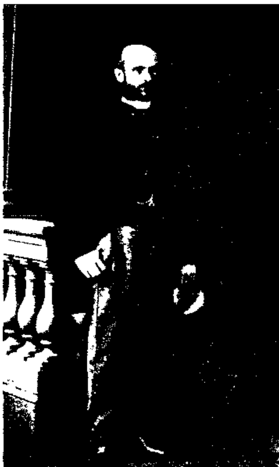
К К Ламберт

формах в управлении Царства Польского 50 . Реформы эти заключались в учреждении Государственного Совета Царства с упразднением существовавшего Общего Собрания варшавских департаментов Сената; в учреждении советов губернских, уездных и городских (муниципальных), образуемых на избирательном начале; наконец, в учреждении особой Правительственной комиссии для заведования делами духовными и народного просвещения. В циркуляре министра иностранных дел было заявлено, что даруемые Царству новые учреждения составляют лишь первый шаг в