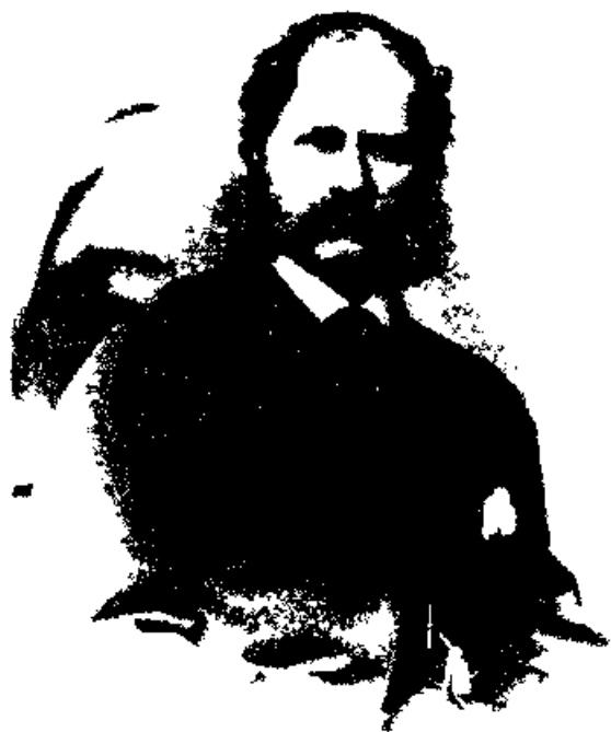
А И Бяратинский