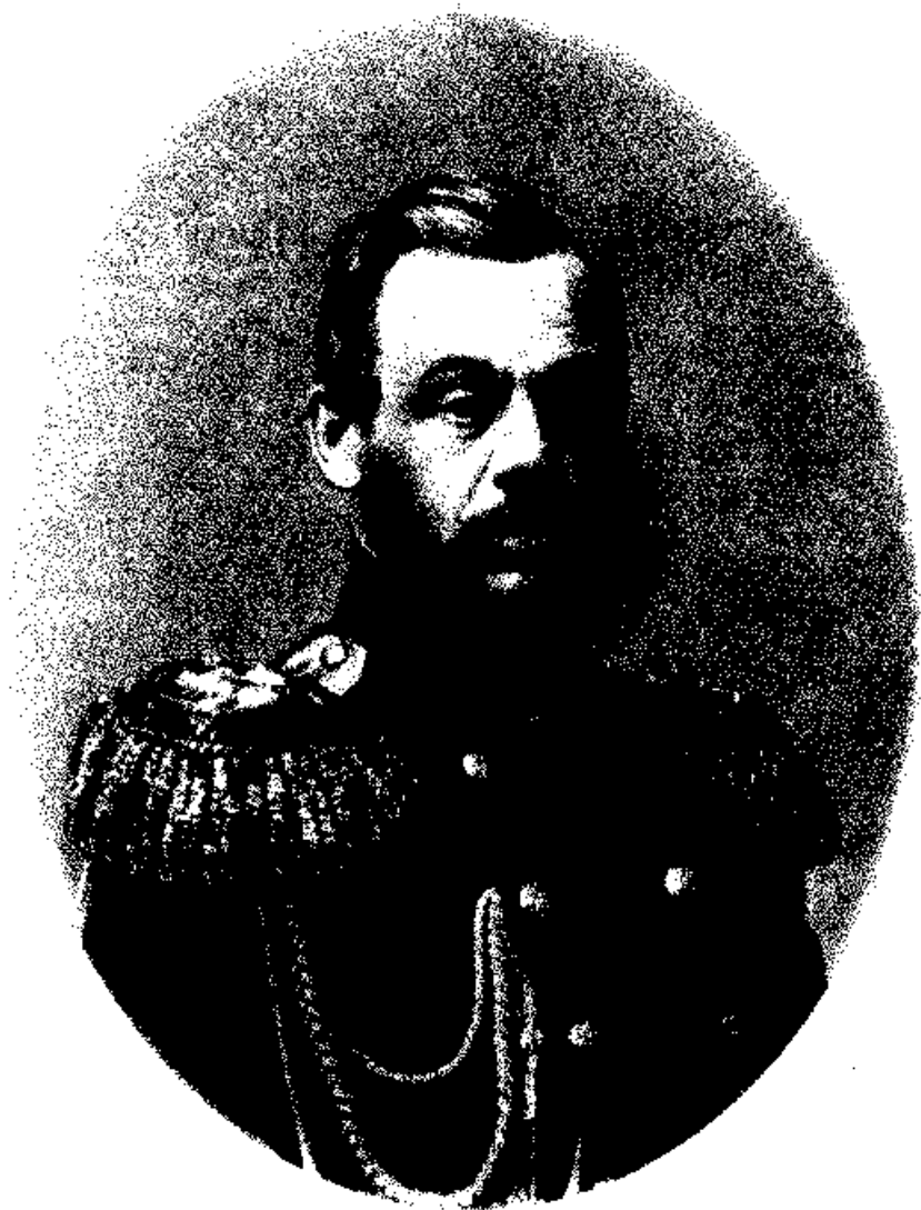
Д. А. Милютин