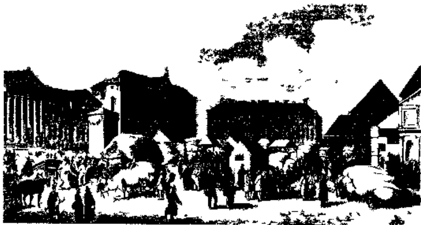
Шерстяная ярмарка в Варшаве

тора Александра I и, как известно, имевший на него большое влияние в начале его царствования. Не успев достигнуть своих целей относительно восстановления Королевства Польского в прежних его границах, князь Чарторыйский однако ж оставил по себе в России глубокие следы, ополчив значительно молодежь в Литовском крае, в продолжение двадцатилетнего его кураторства в Виленском университете. В 1823 году он был уволен и от этой должности и с тех пор, сохранив звание сенатора, проживал за границей до 1830 года, когда он явился в Варшаву и стал во главе революционного правительства. Только накануне взятия Варшавы русскими войсками (1831 г.) князь Чарторыйский сложил с себя звание президента и уехал в Париж, где с тех пор непрерывно вел козни против России. Он принял на себя роль претендента на корону будущего короля польского «Hôtel Lambert» – жилище князя Чарторыйского в Париже – служило как бы главным штабом партии «белых».