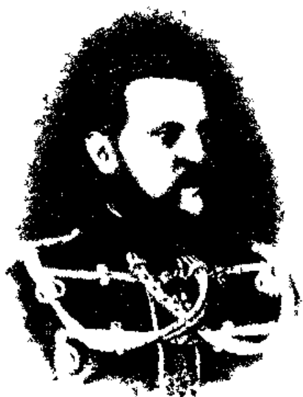
Великий Князь Константин Николаевич