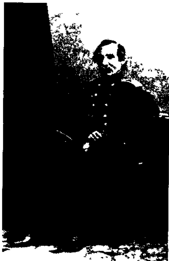
Е. В. Путятин

служить студентам не только инструкцией, но и документом, удостоверяющим как зачисление их в число слушателей университета, так и принятие ими на себя обязательства строго соблюдать означенные правила 90