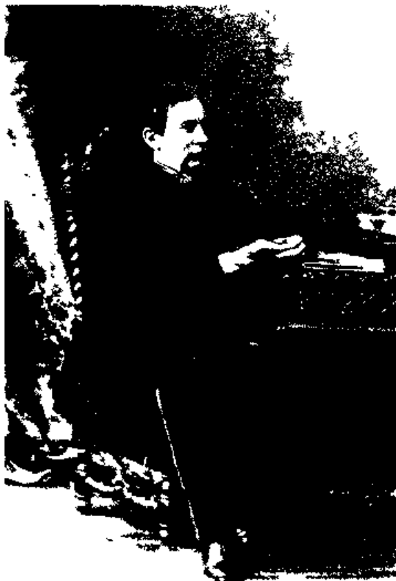
А В Головин