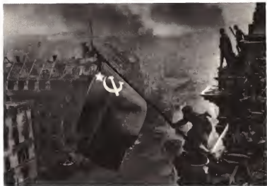
У одного из входов в рейхстаг.