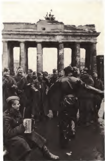
«Русская» у Бранденбургских ворот.