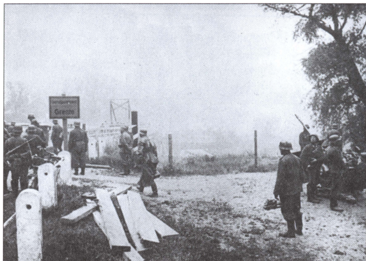
Группа немецких солдат у моста на границе с СССР. 1941 г.