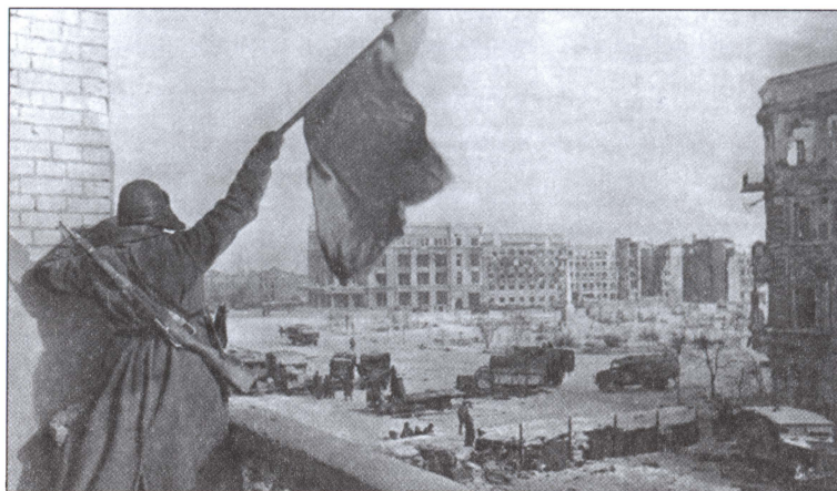
Водружение красного флага над площадью Павших Борцов в Сталинграде. 1943 г.