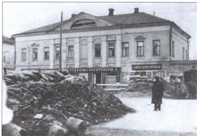
Баррикады на улице Коммунаров в Туле