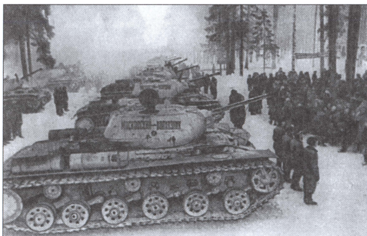
Танковая колонна «Московский колхозник». 1943 г.