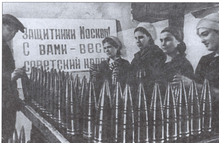
Изготовление снарядов на одном из московских оборонных заводов. 1941 г.