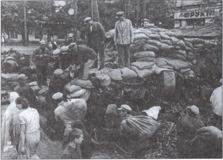
Одесса. Подготовка к обороне города