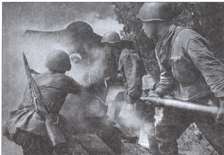
Артиллеристы. Воронежская операция