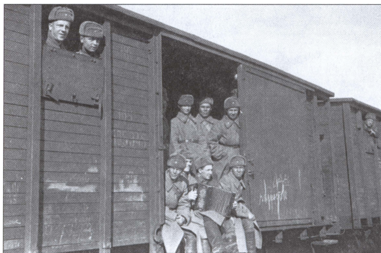
Солдаты-сибиряки едут на защиту Москвы