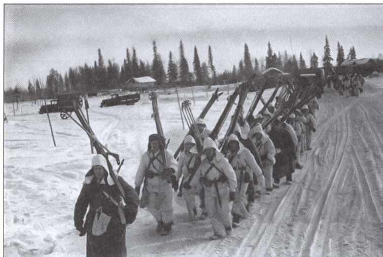
Батальон советских лыжников выдвигается на позиции. 1940 г.