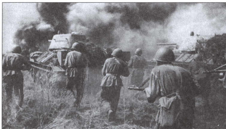
Курская битва. Пехота и танки в районе Прохоровки