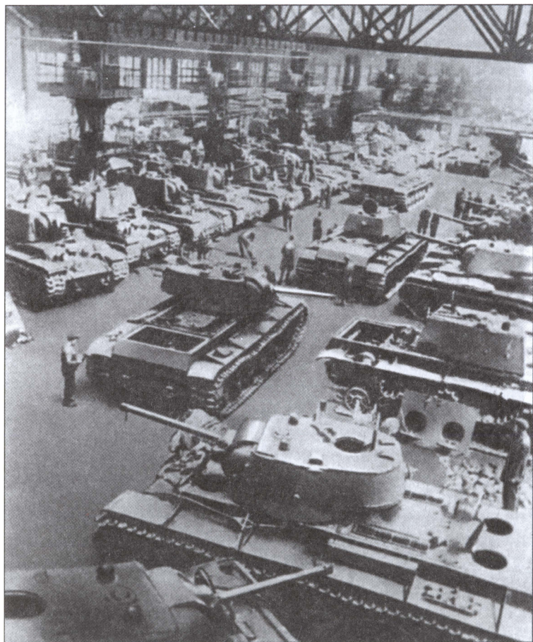
Сборка советских танков в годы Великой Отечественной войны