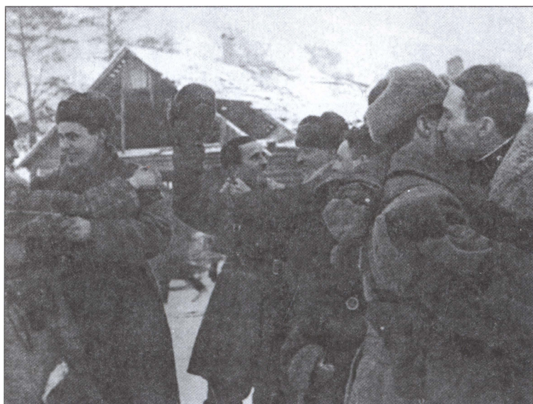
Прорыв блокады Ленинграда