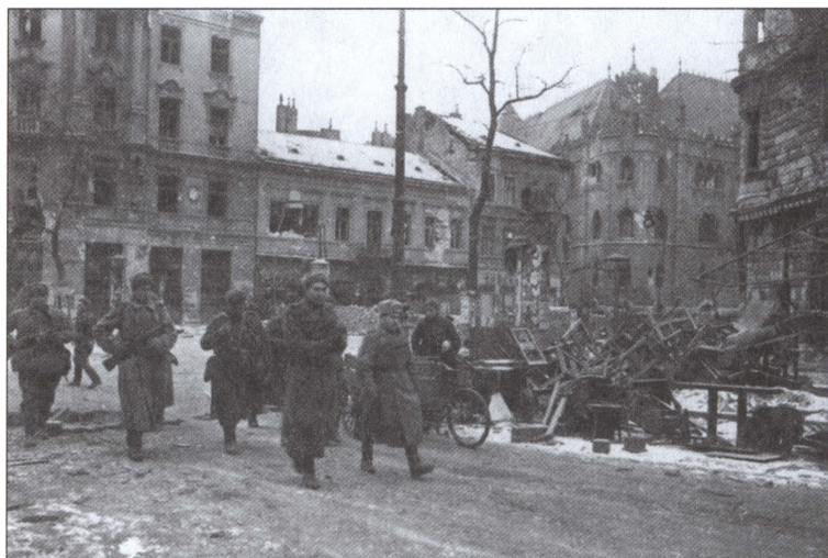
Советские бойцы в Будапеште. 1945 г.