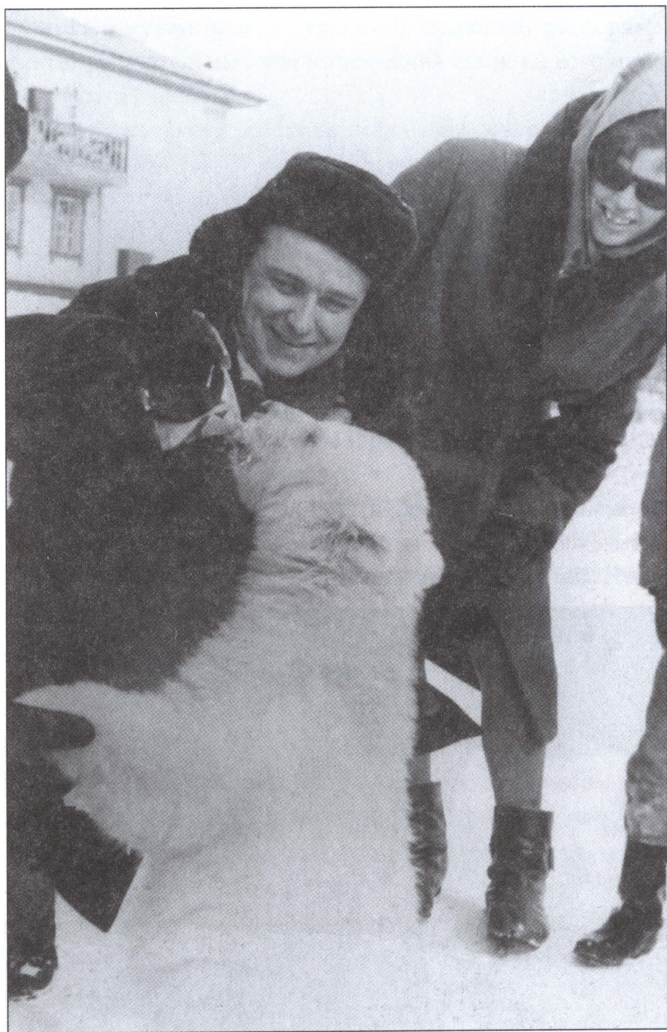
И.А. Либерман в Арктике. 1958 г.