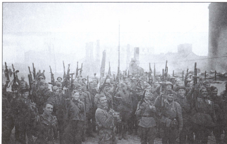
Победа. Май 1945 г.