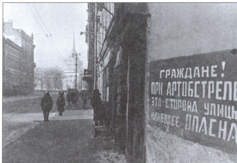
Надпись, предупреждающая об артобстрелах, на стене ленинградского дома