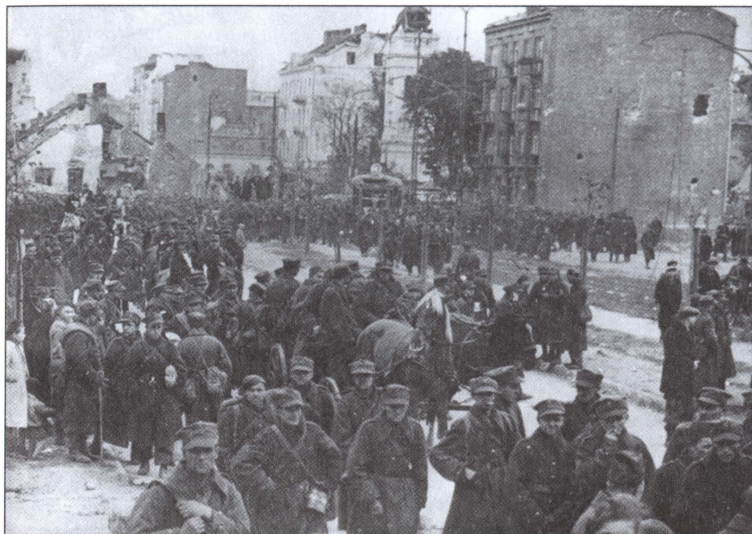
Польские солдаты гарнизона Варшавы идут по улице после капитуляции