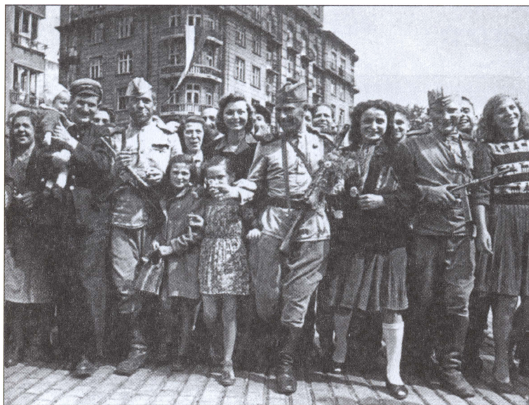
Жители Софии с советскими воинами-освободителями