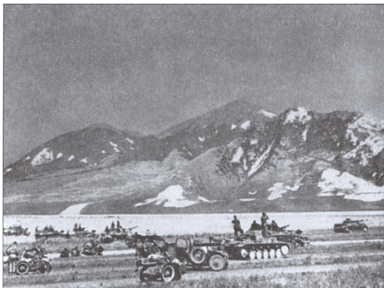
Немецкие танковые соединения в предгорьях Кавказа. 1942 г.