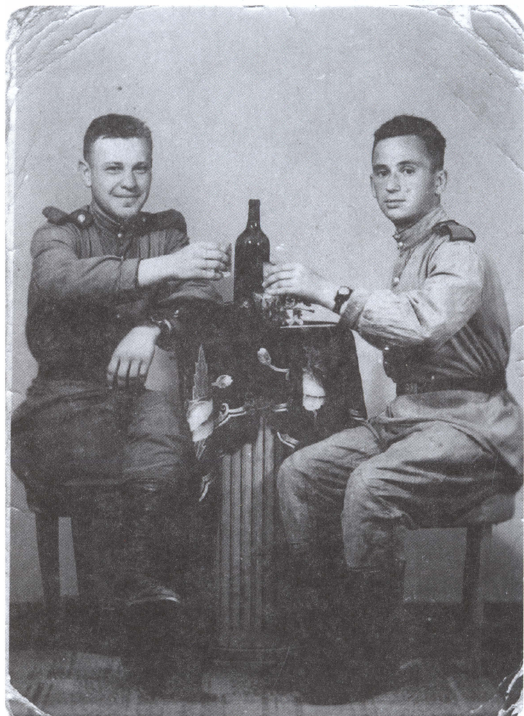
«За победу!» 1945 г.