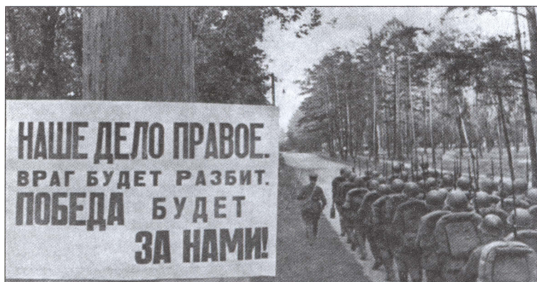
Советские войска уходят на фронт. 1941 г.