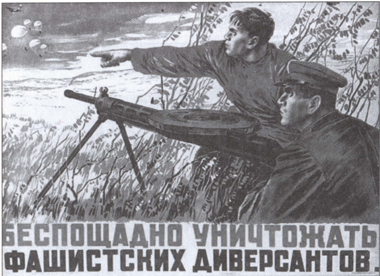
«Беспощадно уничтожать фашистских диверсантов!» Плакат Великой Отечественной войны