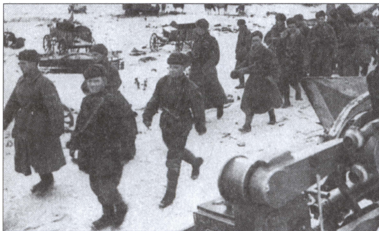
Советские войска. Корсунь-Шевченковская операция. 1944 г.