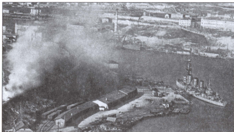
В Севастополе осенью 1941 г.