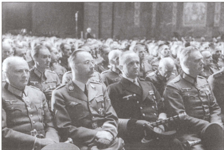
Вильгельм Кейтель, командующий военно-морским флотом гросс-адмирал Дёниц, рейхсфюрер СС Генрих Гиммлер, фельдмаршал Ганс Клюге на траурном собрании, посвященном памяти генерал-полковника Ганса Хубе. Берлин. 26 апреля 1944 г.