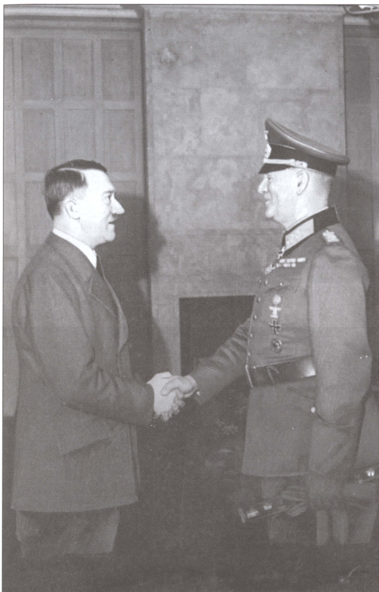
Гитлер поздравляет Вильгельма Кейтеля с 40-летием его военной службы. 9 марта 1941 г.