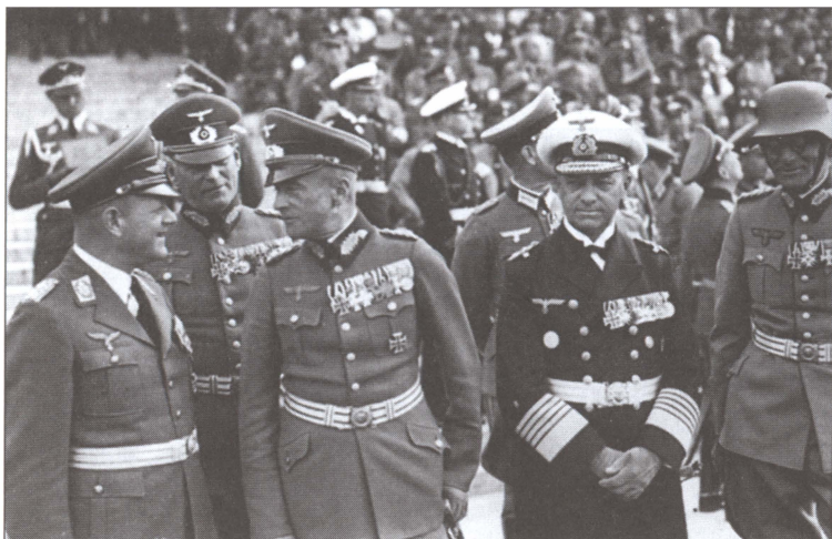
Военный парад в честь Дня вермахта. На переднем плане генерал-полковник люфтваффе Эрхард Мильх, генерал-полковник Вальтер фон Браухич, адмирал Эрих Редер, генерал кавалерии Максимилиан фон Вейхс. На заднем плане Кейтель. Нюрнберг. Сентябрь 1938 г.