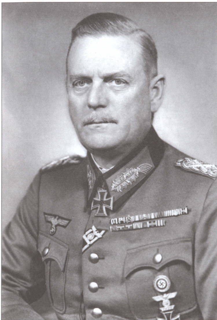
Фельдмаршал Вильгельм Бодевин Йоханн Густав Кейтель