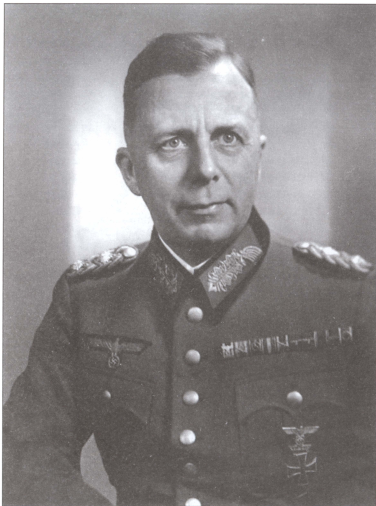
Бодвин Кейтель, младший брат Вильгельма, в звании генерал-майора. 1939 г.