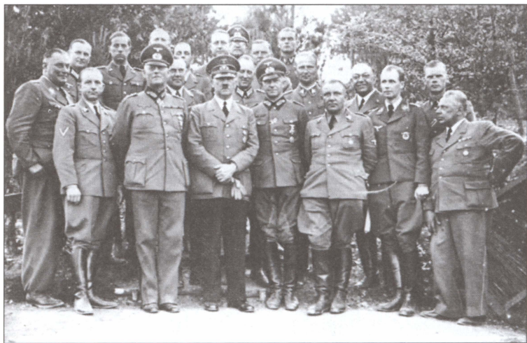
Гитлер со своим штабом. Слева от него Вильгельм Кейтель, справа генерал артиллерии Альфред Йодль и начальник Партийной канцелярии НСДАП Мартин Борман. «Фольфшанце», Восточная Пруссия. 1940—1942 гг.