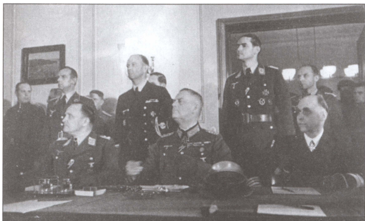
День подписания Акта о безоговорочной капитуляции. Слева от Кейтеля адмирал Ганс Георг фон Фридебург, справа генерал-полковник люфтваффе Ганс Юрген Штумпф. Карлсхорст, Берлин. 8 мая 1948 г.