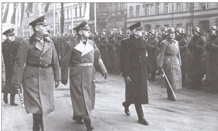
Смотр войск во время официального визита премьер-министра Словакии Войтеха Туки. Рядом с Кейтелем министр иностранных дел Германии Иоахим фон Риббентроп. Берлин. Ноябрь 1940 г.