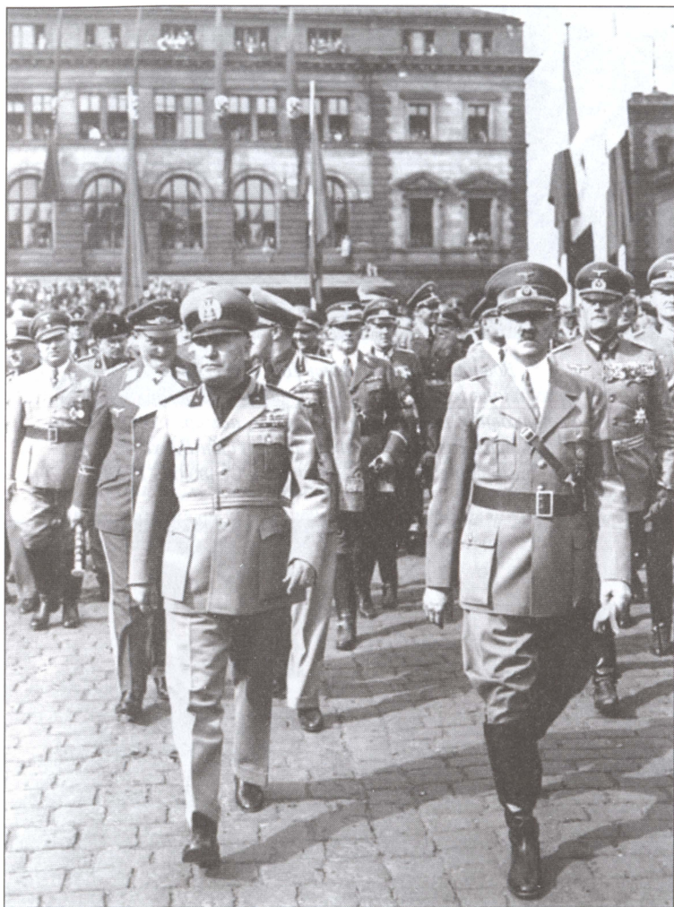
Бенито Муссолини и Адольф Гитлер в Мюнхене в дни подписания Мюнхенского соглашения. На втором плане справа генерал артиллерии начальник ОКВ Вильгельм Кейтель. Сентябрь 1938 г.