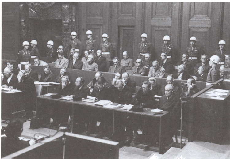
Заседание Нюрнбергского трибунала. Нюрнберг. 1945—1946 гг.