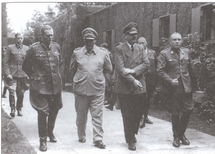
Гитлер со своим ближайшим руководством. Он придерживает руку, поврежденную взрывом во время неудавшегося покушения 20 июля 1944 г. С ним Кейтель, рейхсминистр Министерства авиации Герман Геринг, начальник Партийной канцелярии НСДАП Мартин Борман