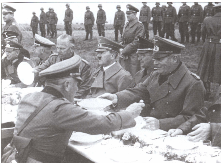
Гитлер в поездке по Судетской области после присоединения ее к Германии. Праздничный обед на природе. Слева от Гитлера рейхскомиссар Судетской области Конрад Гелейн и Кейтель. Справа командующий 4-й группой войск Вальтер фон Рейхенау и рейхсфюрер СС Генрих Гиммлер. 3 октября 1938 г.