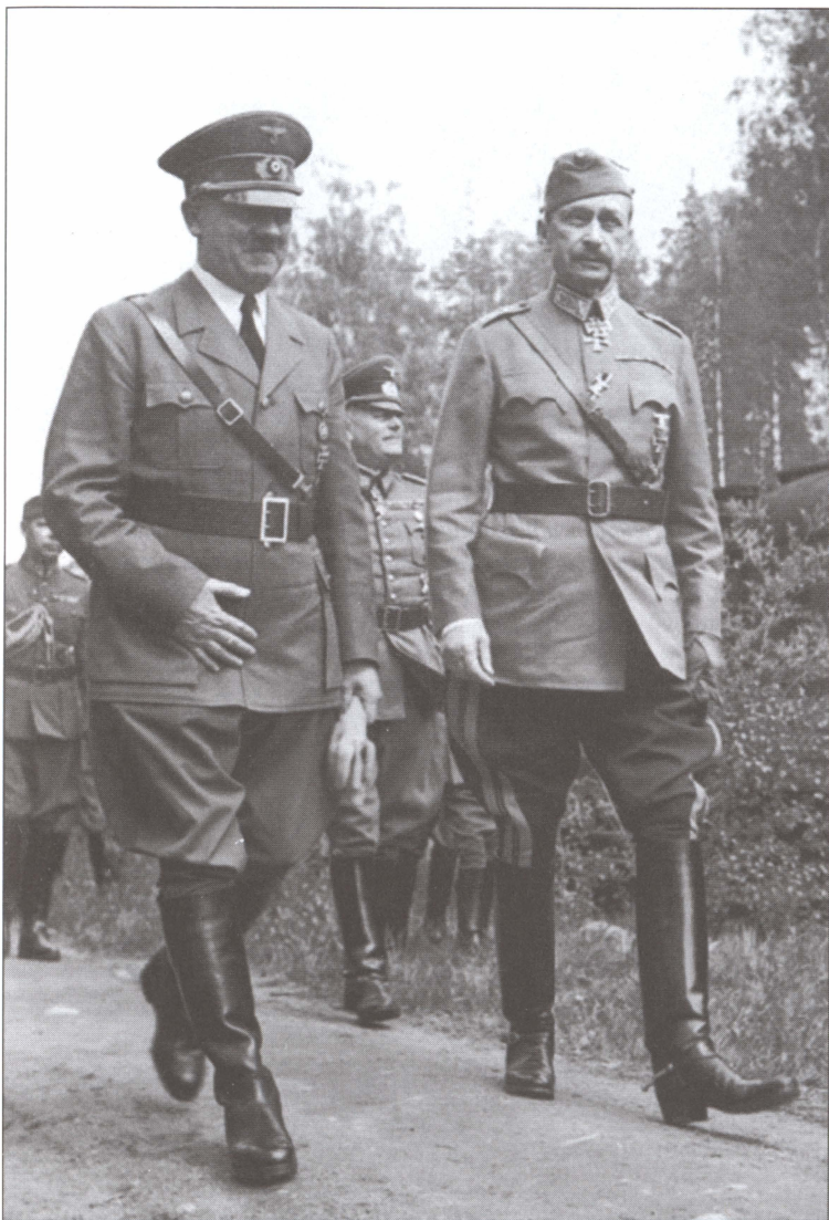
Гитлер у Карла Маннергейма в день его 75-летия. Позади Кейтель. Финляндия. 4 июня 1942 г.