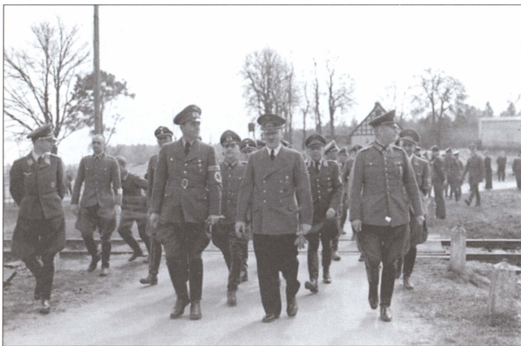
Гитлер, Кейтель и рейхсминистр вооружений и боеприпасов Альберт Шпеер в сопровождении генералов и офицеров штаба на прогулке. 20 марта 1942 г.