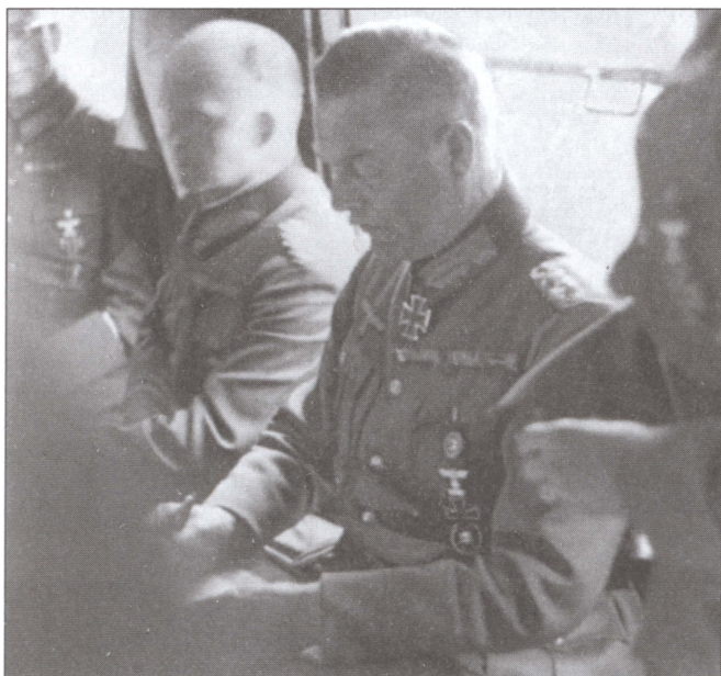
Кейтель подписывает один из документов Перемирия в знаменитом железнодорожном вагоне маршала Фоша. Компьенский лес. 22 июня 1940 г.