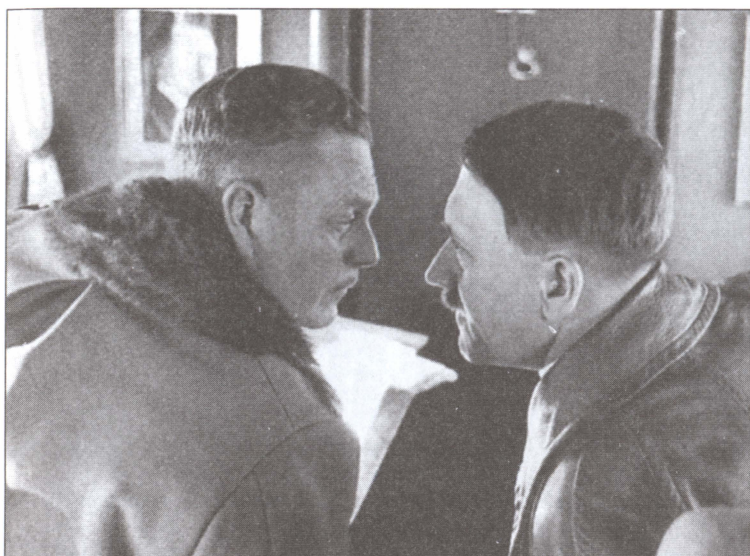
Кейтель и Гитлер. Разговор с глазу на глаз