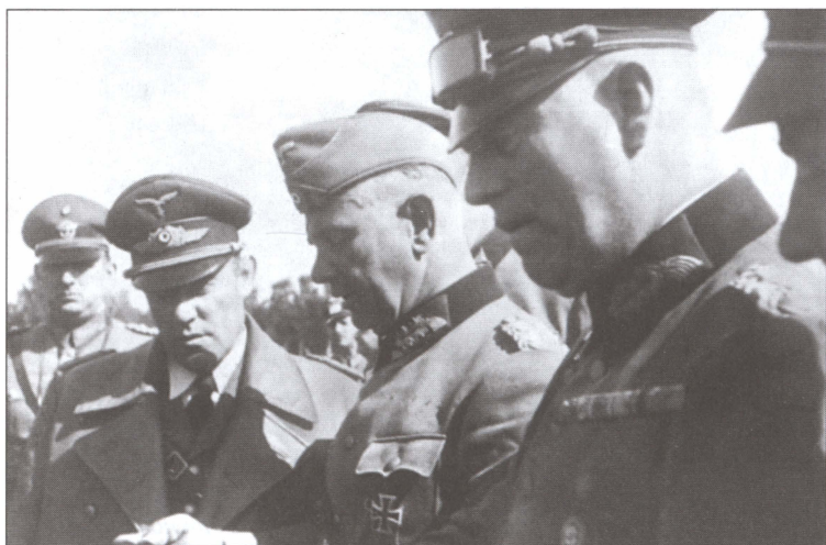
Изучение карт в ходе одной из операций вторжения в Польшу. Справа от генерал-полковника, начальника ОКВ Вильгельма Кейтеля, командующий 10-й армией Вальтер фон Рейхенау и личный адъютант Гитлера Карл Боденшатц. Сентябрь 1939 г.