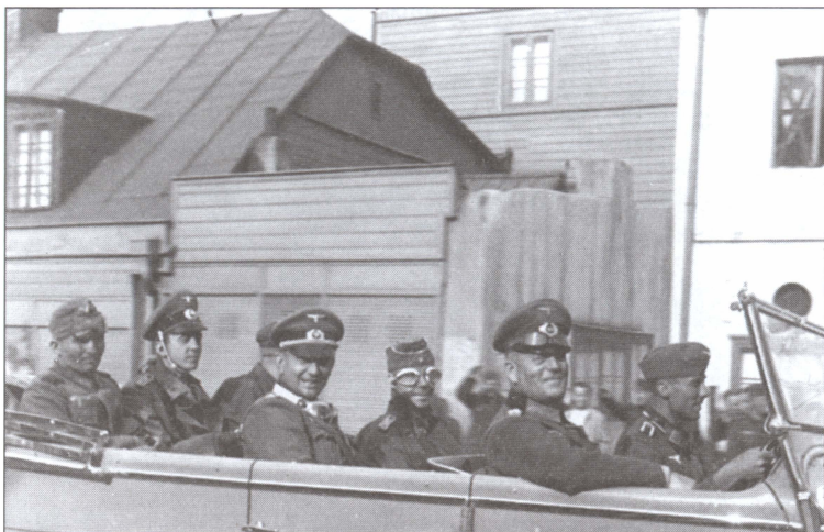
Кейтель с офицерами штаба проезжает по улицам оккупированной Лодзи. Сентябрь 1939 г.