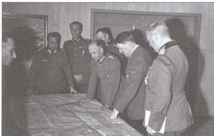
На оперативном совещании. Слева от Гитлера Кейтель, справа фельдмаршал Вальтер фон Браухич, у стены генерал-лейтенант Фридрих Паулюс. Октябрь 1941 г.