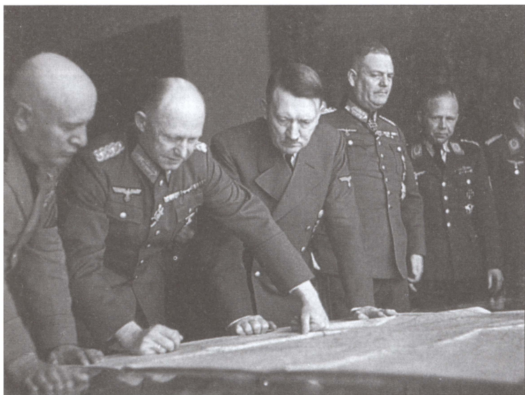
На одном из военных совещаний. Гитлер, Муссолини, генерал артиллерии Альфред Йодль и Кейтель. 1940 г.