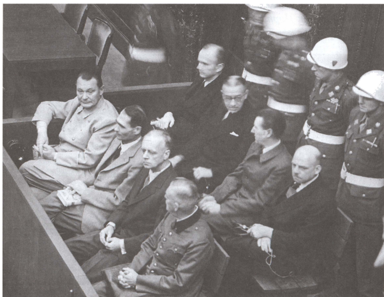
Обвиняемые на скамье подсудимых. Справа от Кейтеля — Иоахим фон Риббентроп, Герман Гесс, Герман Геринг. Нюрнбергский процесс. 1945—1946 гг.