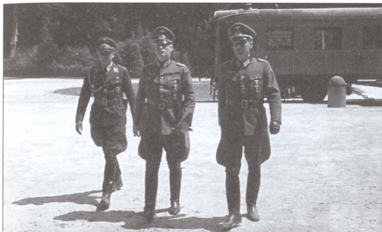
Кейтель с представителями германского командования в Компьенском лесу в день заключения Второго компьенского перемирия. 22 июня 1940 г.