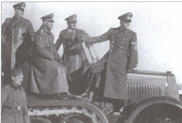
Гитлер, Кейтель и рейхсминистр вооружений и боеприпасов Альберт Шпеер на полигоне во время показа новой техники. Апрель 1943 г.