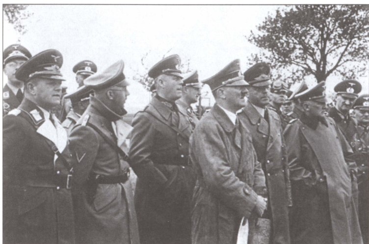
Гитлер и его генералы осматривают линию Зигфрида. Май 1939 г.