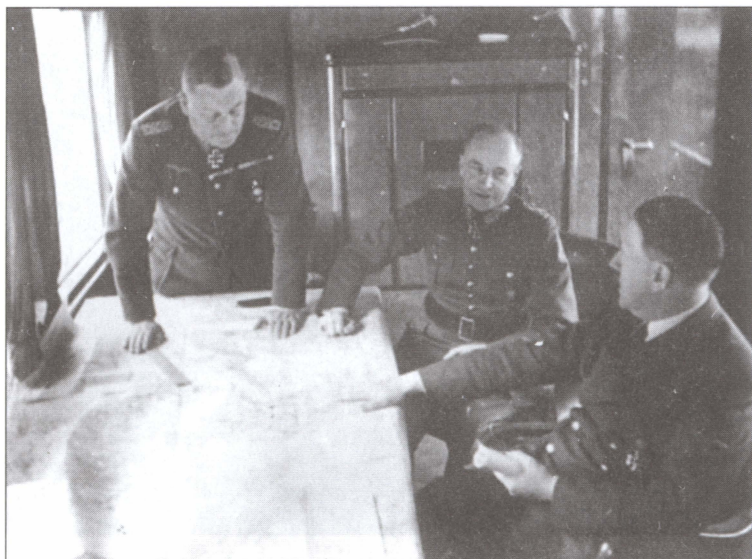
Кейтель и фельдмаршал Вальтер фон Браухич на совещании у Гитлера в штабном вагоне. Апрель 1941 г.