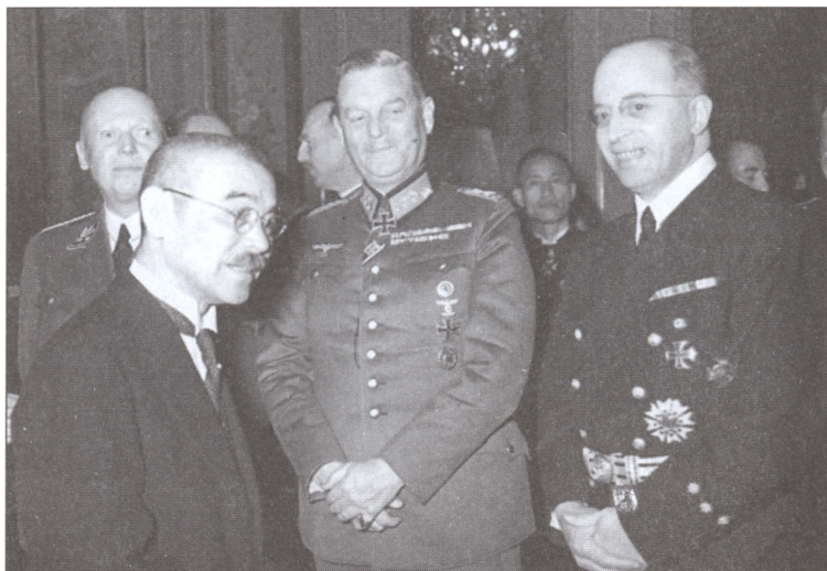
Министр иностранных дел Японии Ёсукэ Матсуока беседует с Вильгельмом Кейтелем и немецким посланником в Токио Генрихом Штамером. 28 марта 1941 г.