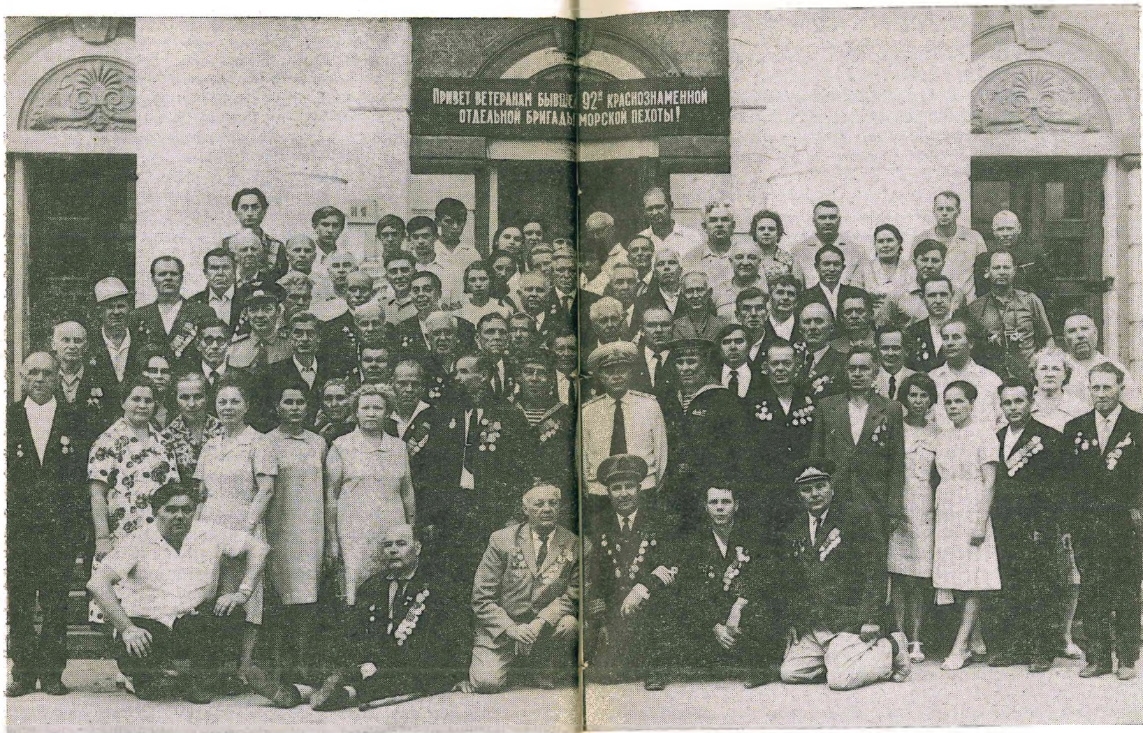
Ветераны бригады и их гости на встрече в 1972 году