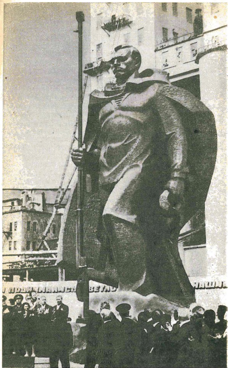
Памятник отважным воинам, в том числе морякам 92-й отдельной стрелковой бригады, героически сражавшимся в районе элеватора