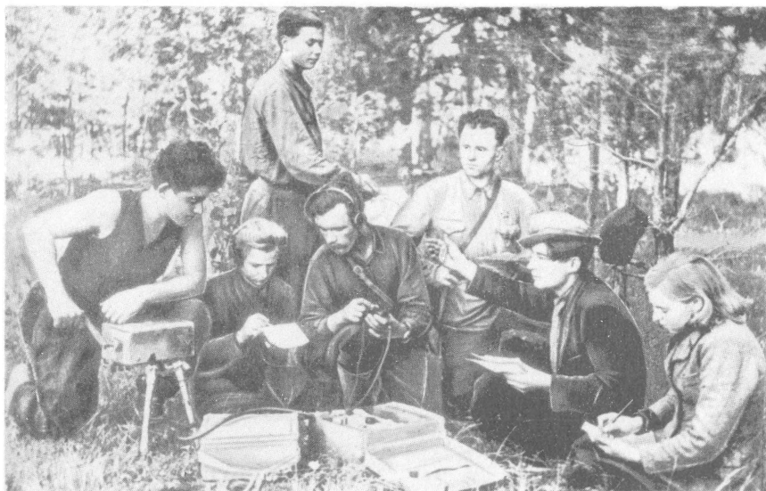
Радиоузел за работой