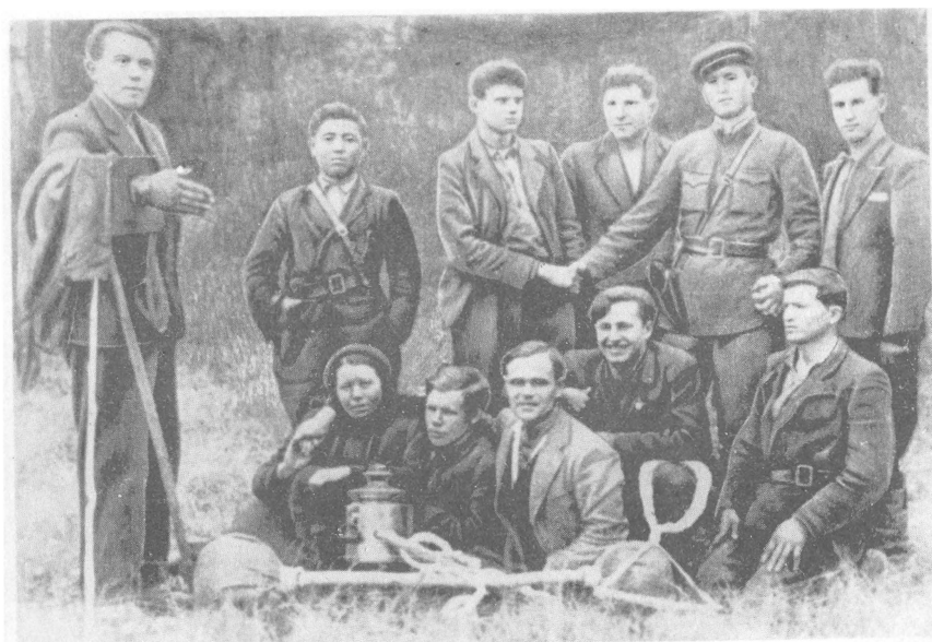
«Общество веселых чудаков»