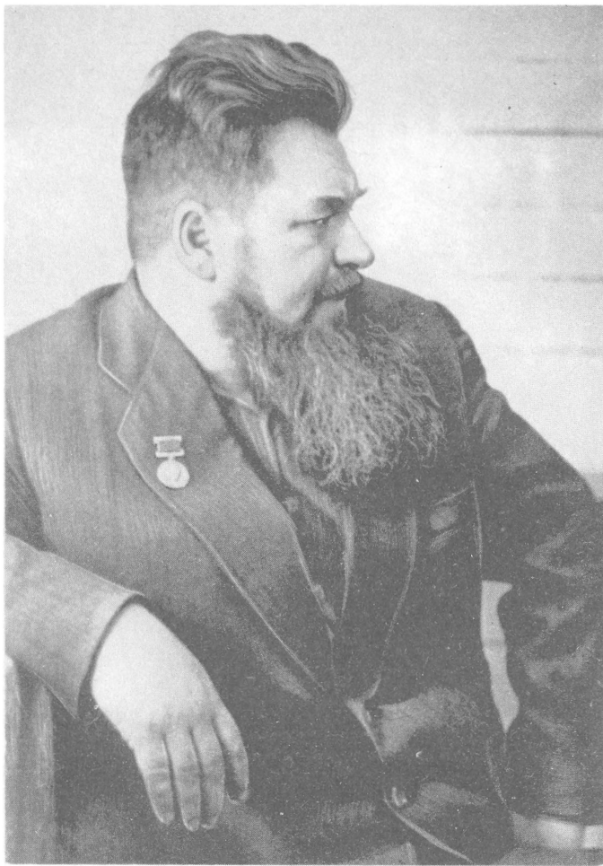
Командир 1-й Украинской партизанской дивизии имени С. А. Ковпака П. П. Вершигора