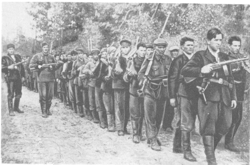
Первый батальон на марше