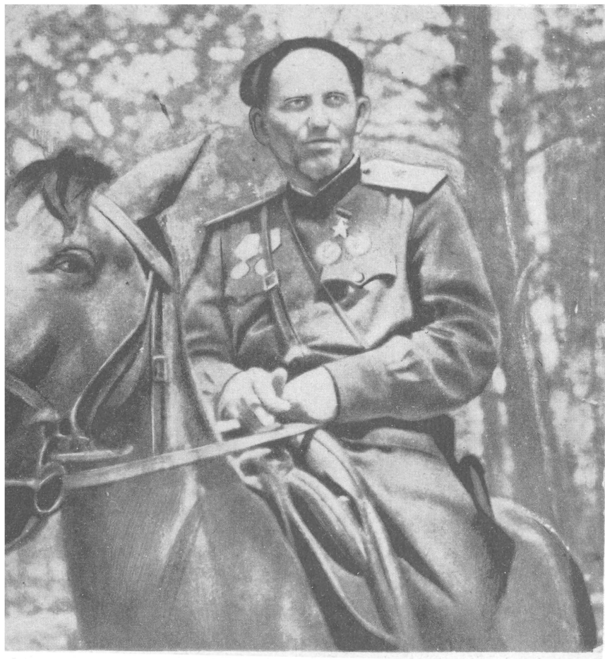
Дважды Герой Советского Союза С. А. Ковпак