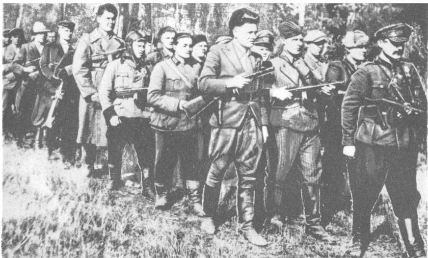
Конный по-пешему (кавалерийский эскадрон)