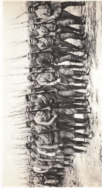
Один из первых полков Красной Армии перед отправкой на фронт