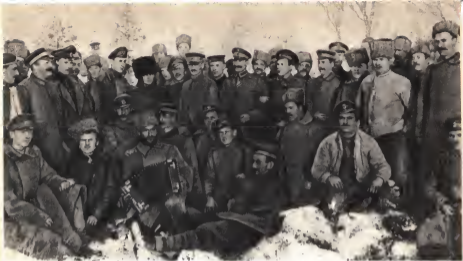
Братание русских и немецких солдат