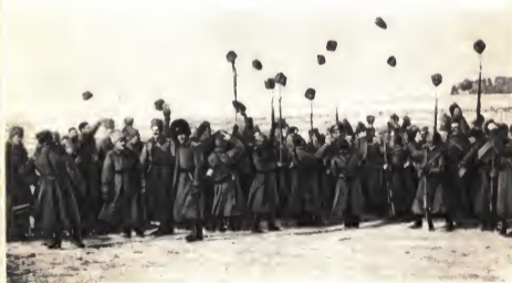
Солдаты приветствуют заключение перемирия