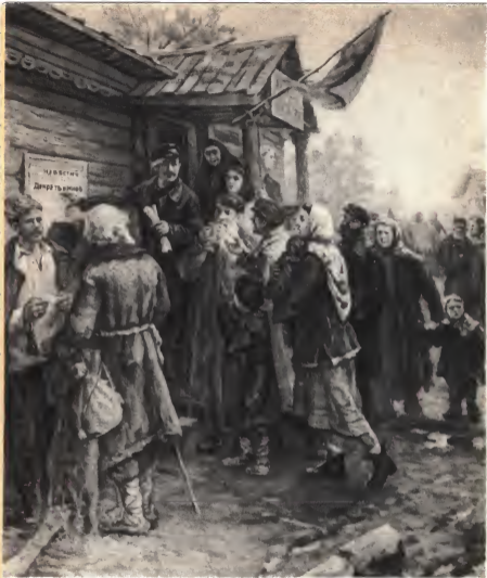
Первый декрет Советской власти в деревне (Карг. худ. В. Иванова)