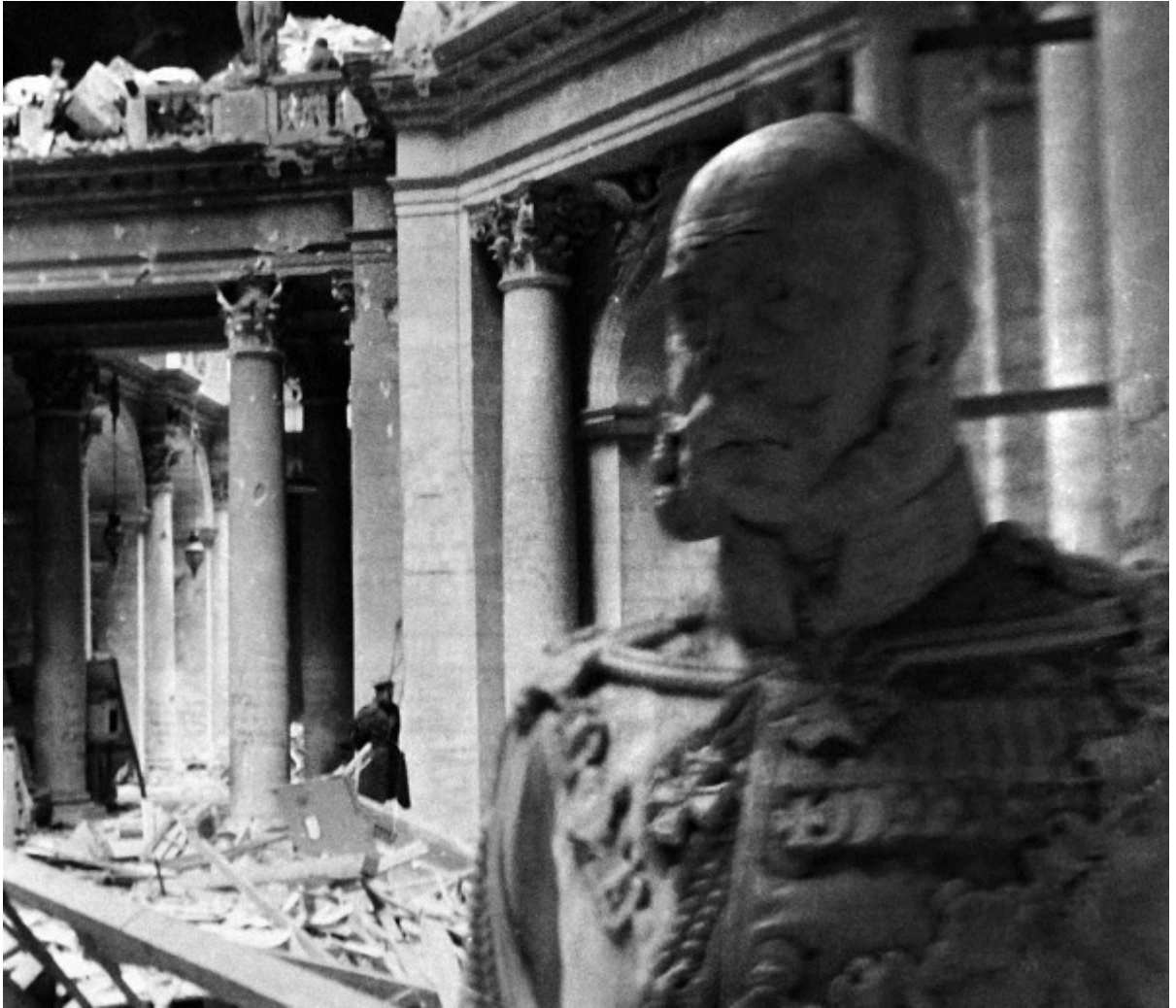
Рейхстаг, разрушенный советскими войсками во время штурма