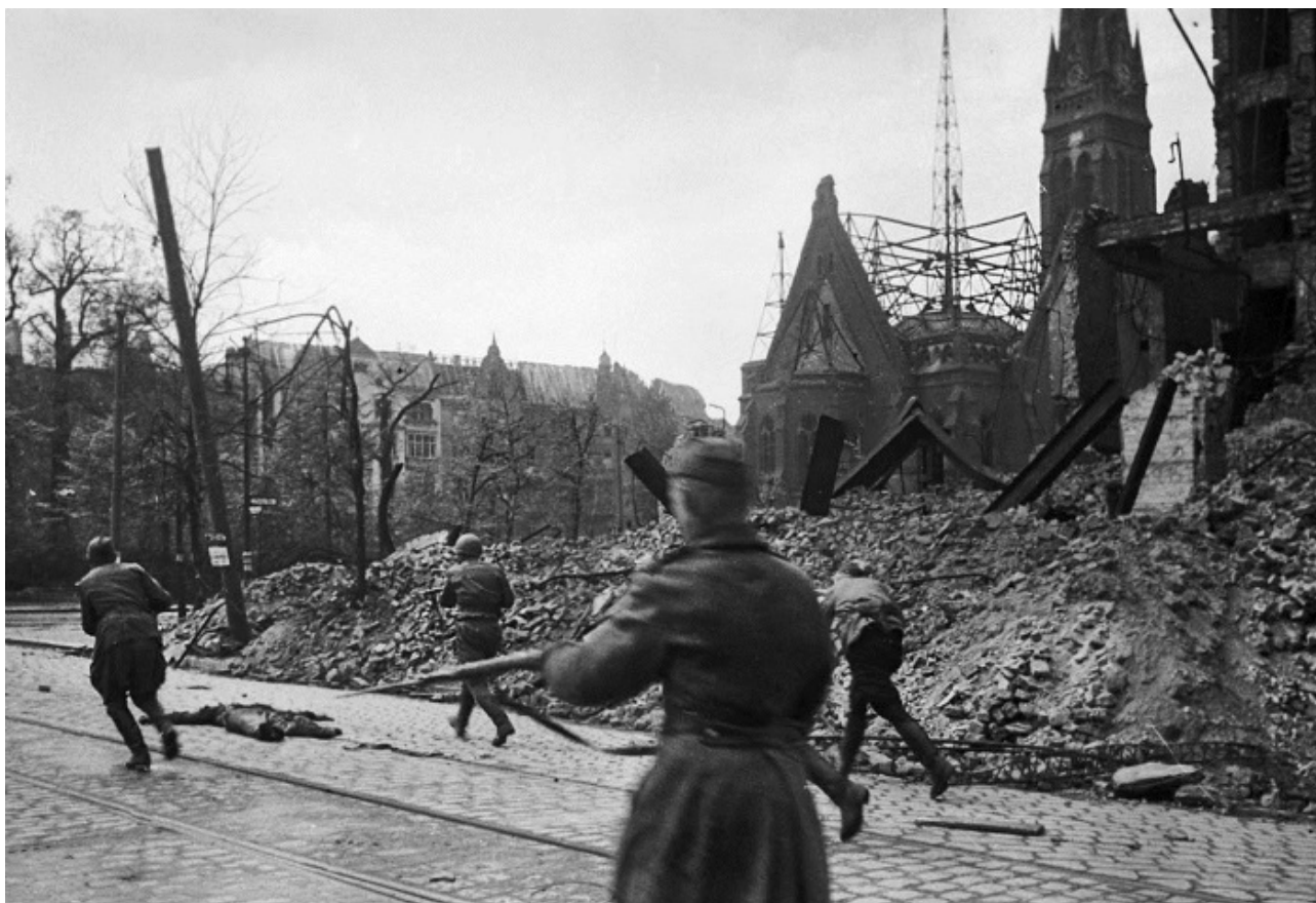
Советские войска ведут бои на улицах Берлина