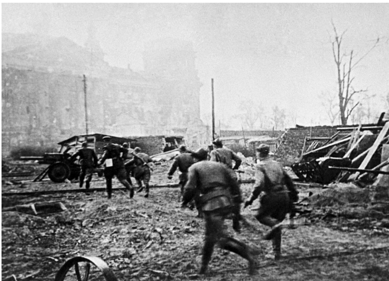
Штурм Рейхстага, 30 апреля 1945 г.

Пока еще везде происходило прогрызание вражеской обороны. Сил для решительного рывка вперед было еще слишком мало на наших плацдармах. Это чувствовал противник и напрягал все усилия, чтобы сбросить советские войска в реку. Но наши доблестные солдаты не отступали ни на шаг, а наоборот, использовали любую возможность, чтобы расширить уже захваченные участки.