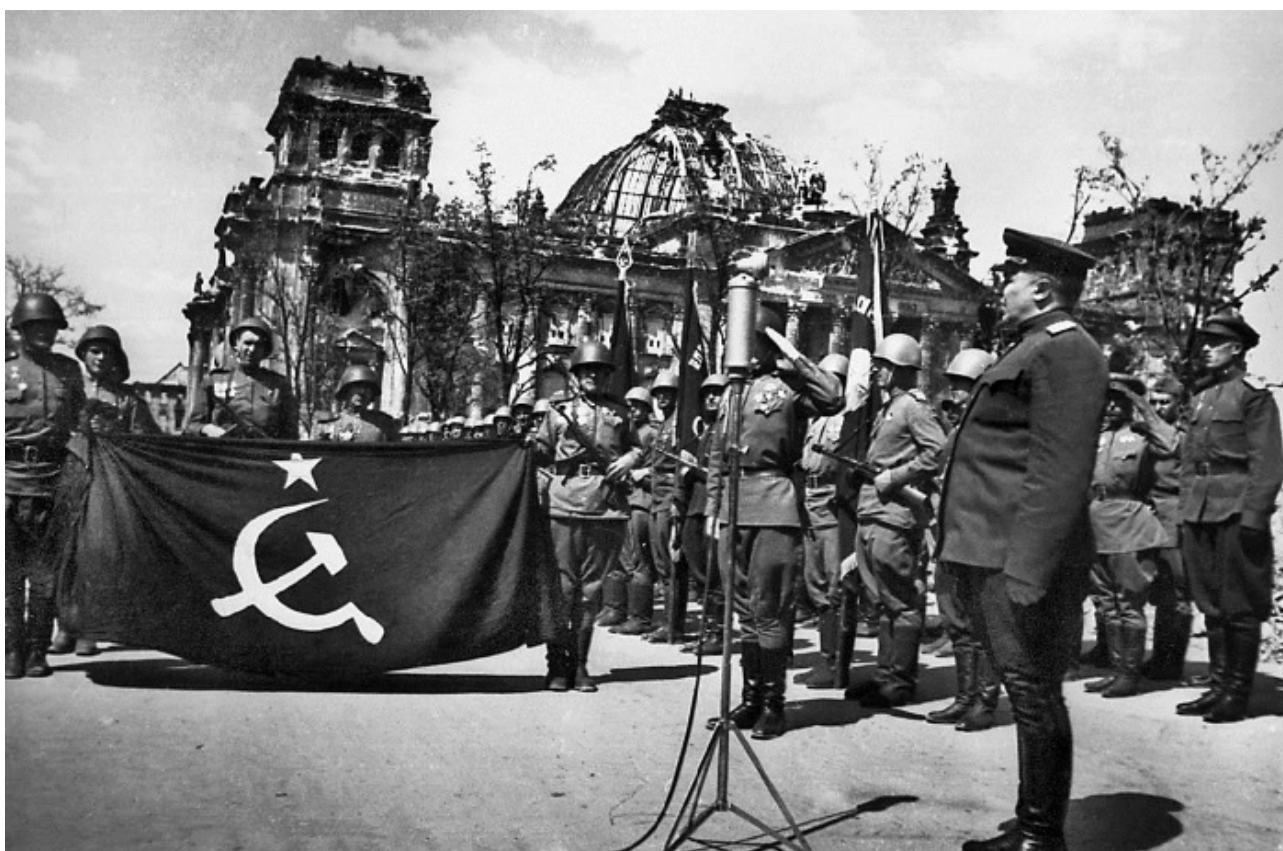
Торжественные проводы Знамени Победы в Москву. Первый комендант Берлина генерал-полковник Н.Э. Берзарин (справа)

В Берлине подписана Декларация о поражении Германии и о принятии на себя верховной власти в отношении Германии правительствами СССР, США, Великобритании и Временным правительством Франции. Декларация констатировала полное поражение во Второй мировой войне германских вооруженных сил и безоговорочную капитуляцию Германии. Лица, служившие в германских вооруженных силах и организациях, имевших оружие, объявлялись военнопленными. Вооружение и имущество передавалось союзным военным властям. Нацистские лидеры, а также лица, виновные в совершении военных или аналогичных преступлений, подлежали аресту. Управление Германией рассредоточивалось в руках советского, британского, американского и французского главнокомандующих оккупационными войсками. Для согласования их действий в Германии создан Контрольный совет.