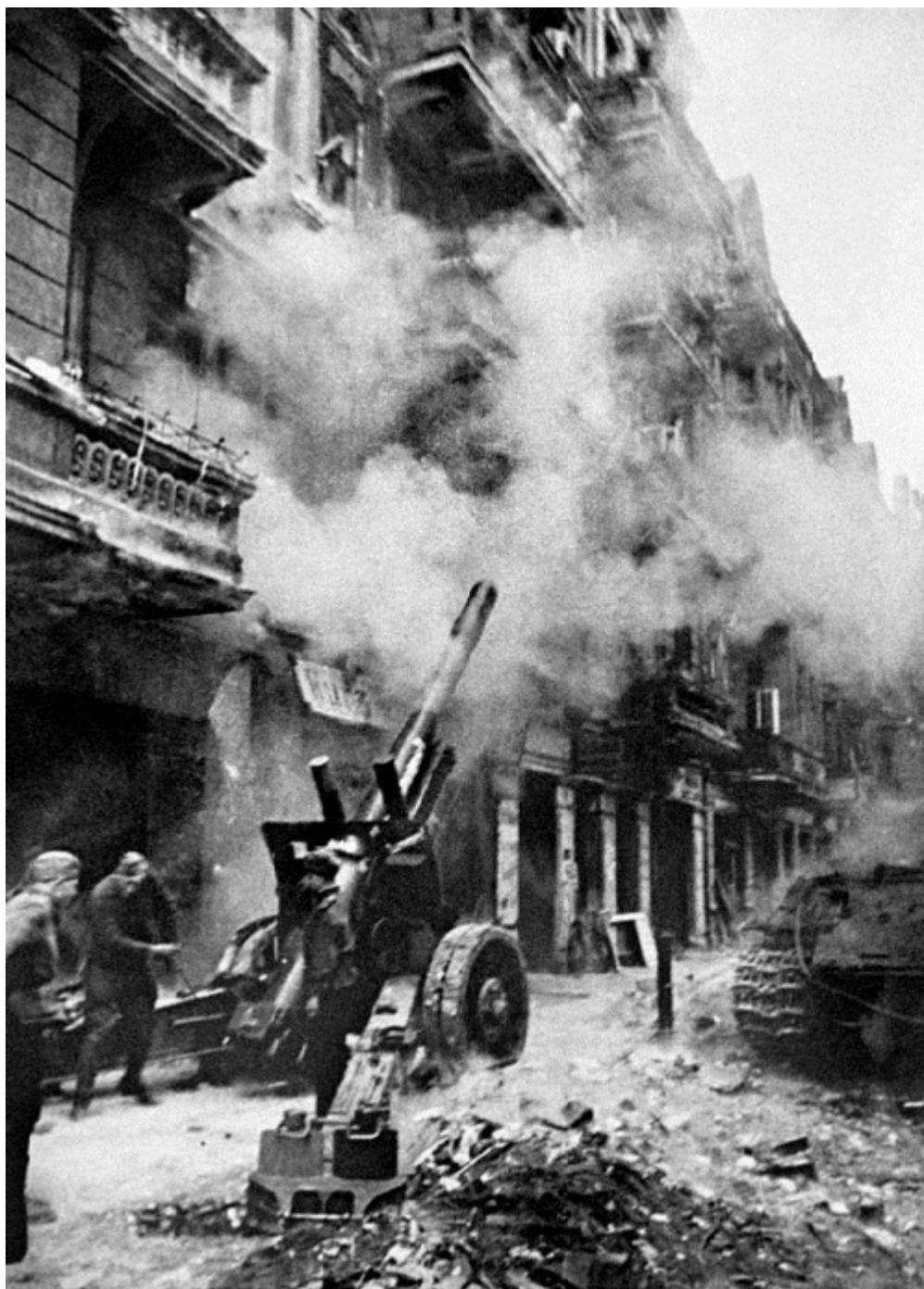
Бои на улицах Берлина