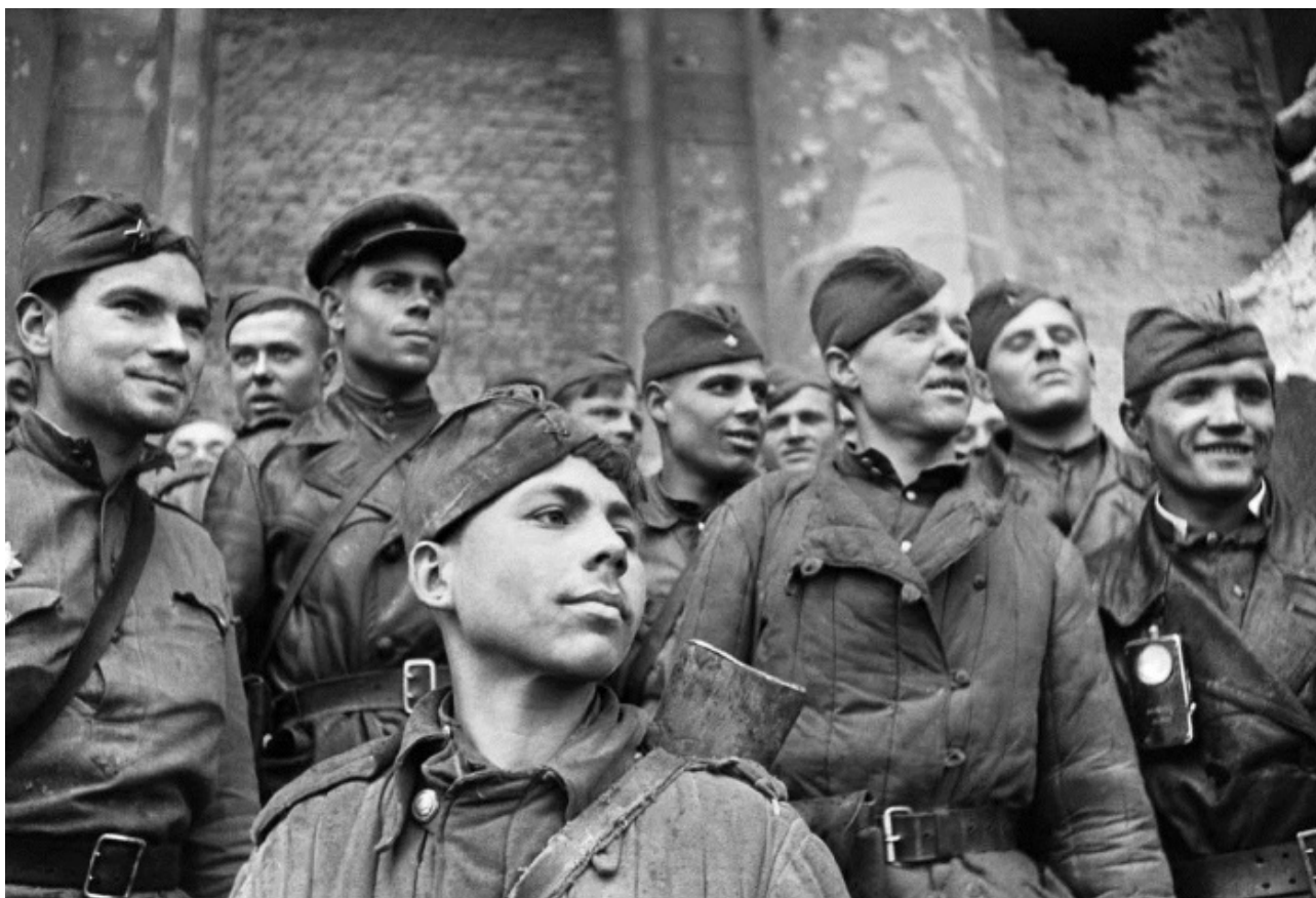
Бойцы, штурмовавшие рейхстаг, стоят у стены здания

В этот период (что единодушно подтверждается десятками и сотнями показаний пленных) эсэсовцы и гестаповцы действовали с особой беспощадностью, расстреливали и вешали всякого, кто оставлял позиции или был по каким бы то ни было причинам заподозрен в этом. Кого только не было там, на Тельтов-канале, особенно в батальонах фольксштурма, состоявших из кадровых солдат, стариков и подростков, которые плакали, но дрались и поджигали фаустпатронами наши танки».