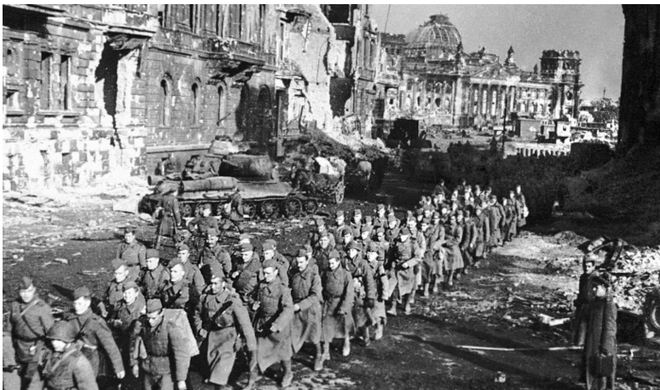
Советские солдаты уходят от захваченного в бою Рейхстага