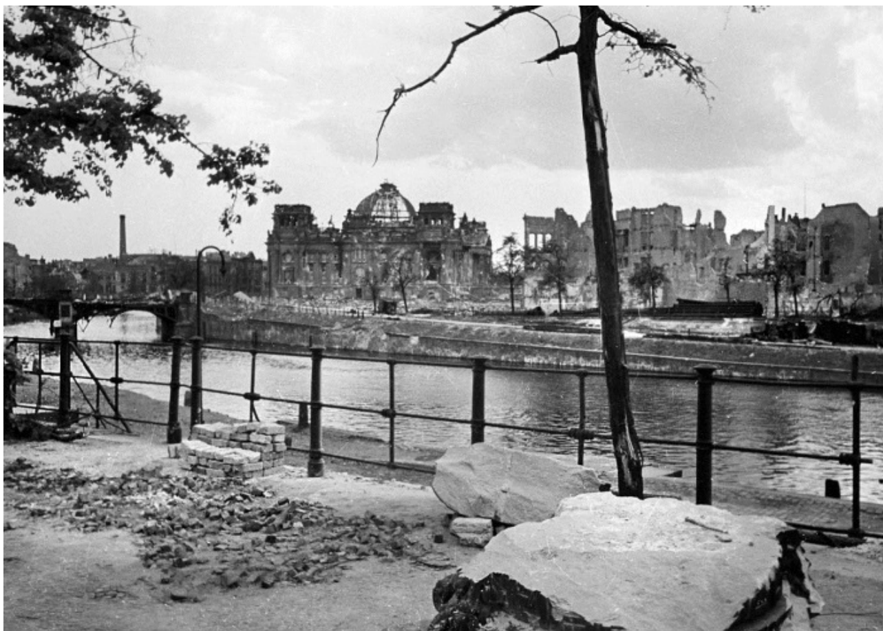
Разрушенный Рейхстаг и улицы Берлина после штурма советских войск