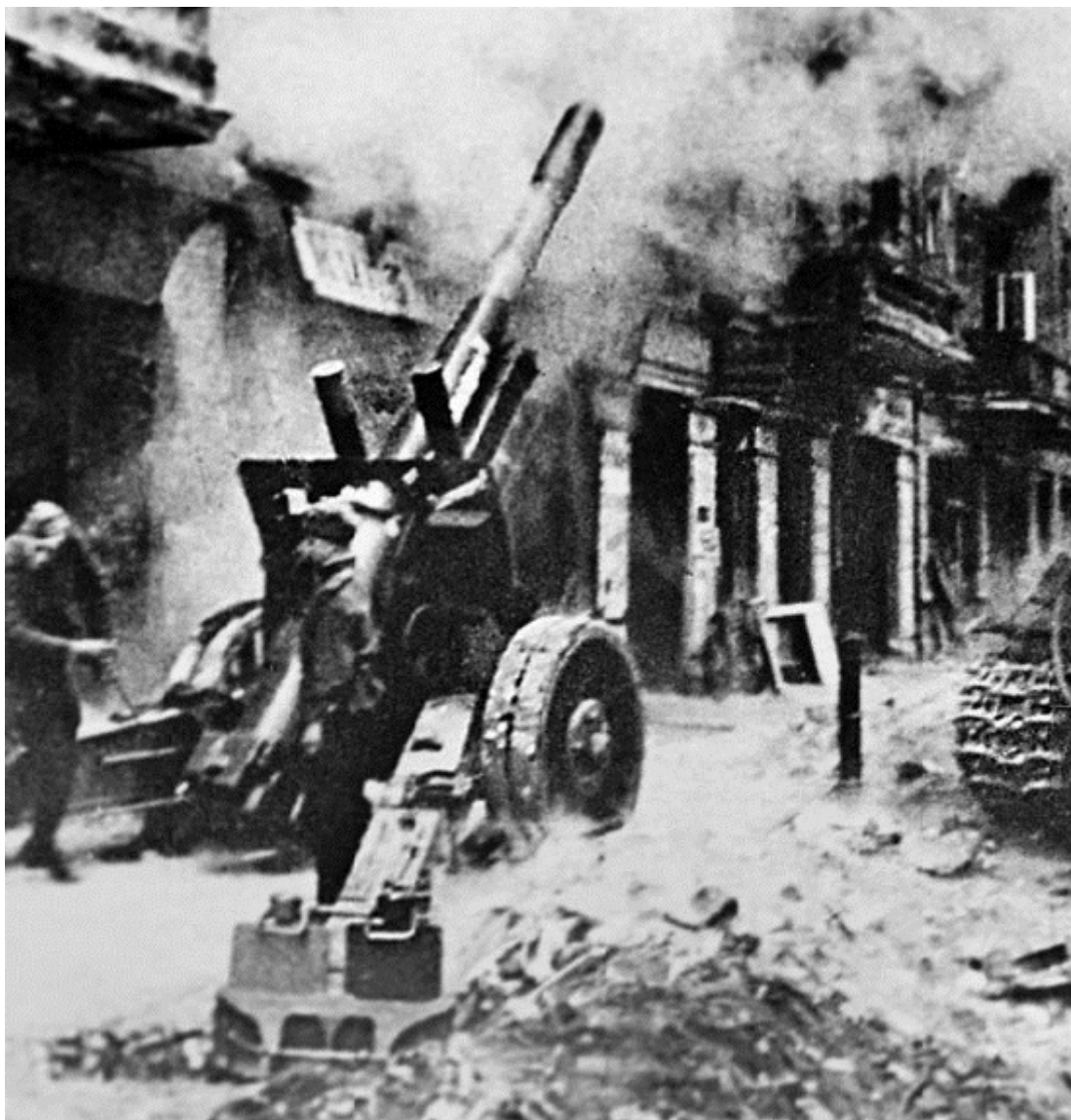
Выстрел из артиллерийского орудия