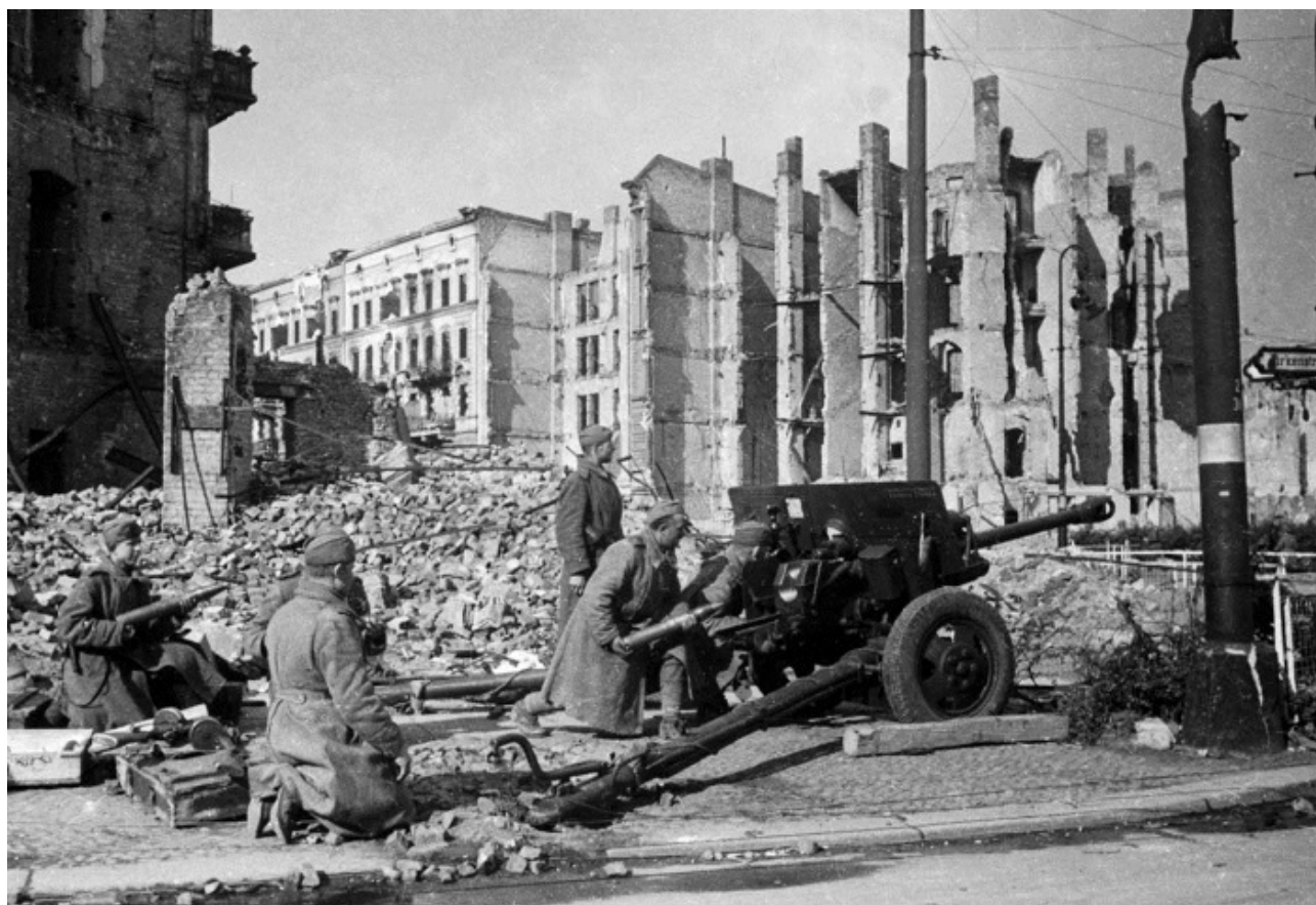
Советские артиллеристы ведут бой на одной из улиц столицы Германии

Первый пункт акта гласил: «1. Мы, нижеподписавшиеся, действуя от имени германского верховного командования, соглашаемся на безоговорочную капитуляцию всех наших вооруженных сил на суше, на море и в воздухе, а также всех сил, находящихся в настоящее время под немецким командованием, Верховному Главнокомандованию Красной Армии и одновременно Верховному Командованию союзных экспедиционных сил».