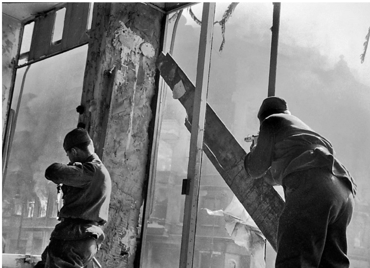
Солдат прицеливается из укрытия

Бранденбургской провинции и мощным опорным пунктом противника, взяли в плен более 14 тысяч солдат и офицеров противника.