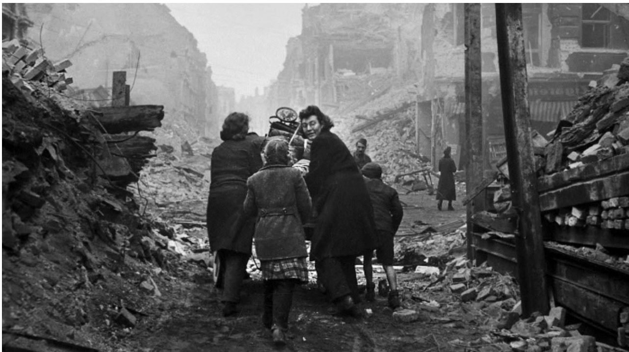
Жители Берлина возвращаются домой по заваленной обломками улице. Бои закончились