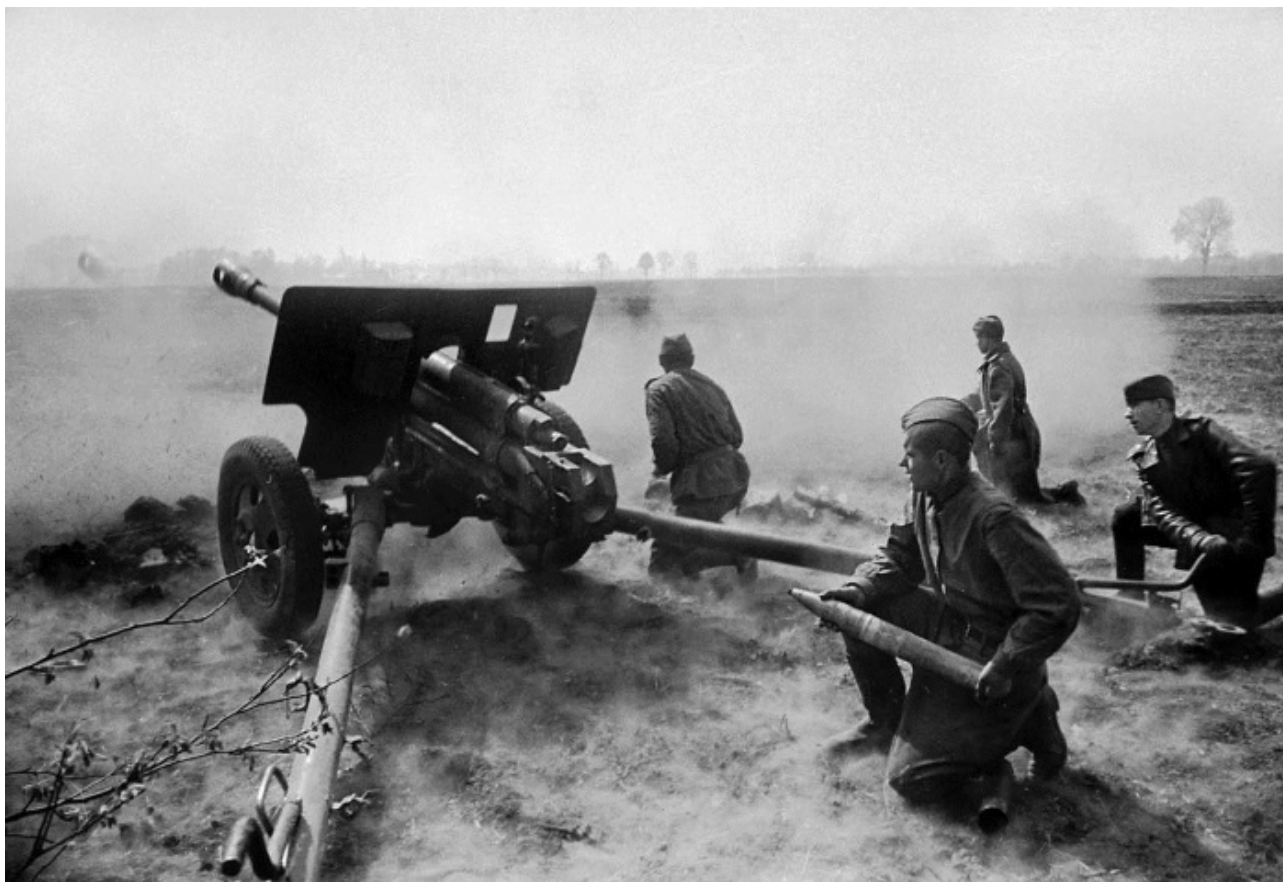
Орудийный расчет ведет бой на окраине города. 1-й Белорусский фронт

В этот день на всех фронтах подбито и уничтожено 50 немецких танков и самоходных орудий. В воздушных боях и огнем зенитной артиллерии сбито 42 самолета противника.