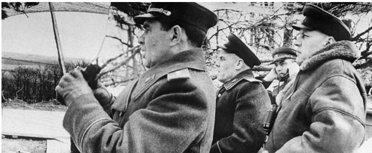
Командующий 8-й гвардейской армией Василий Иванович Чуйков (слева) с группой генералов на командном пункте под Берлином