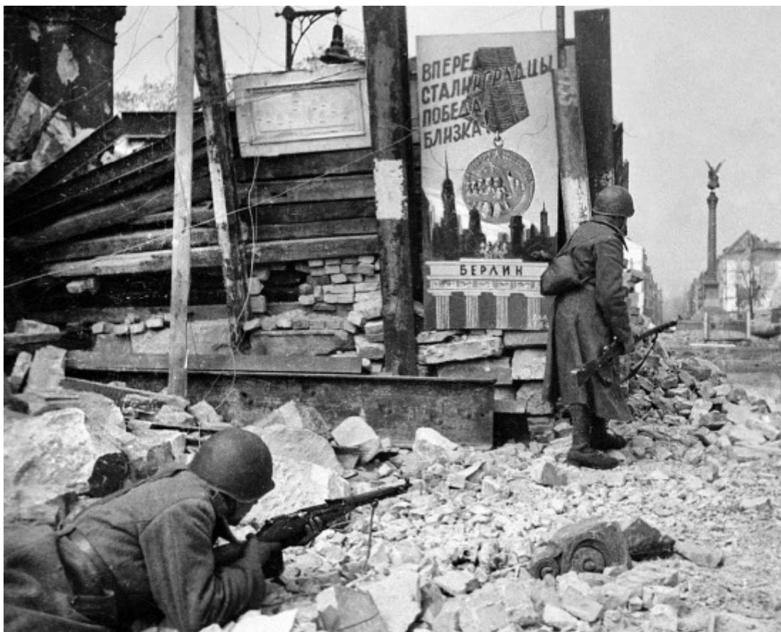
Советские войска ведут бой на улицах Берлина