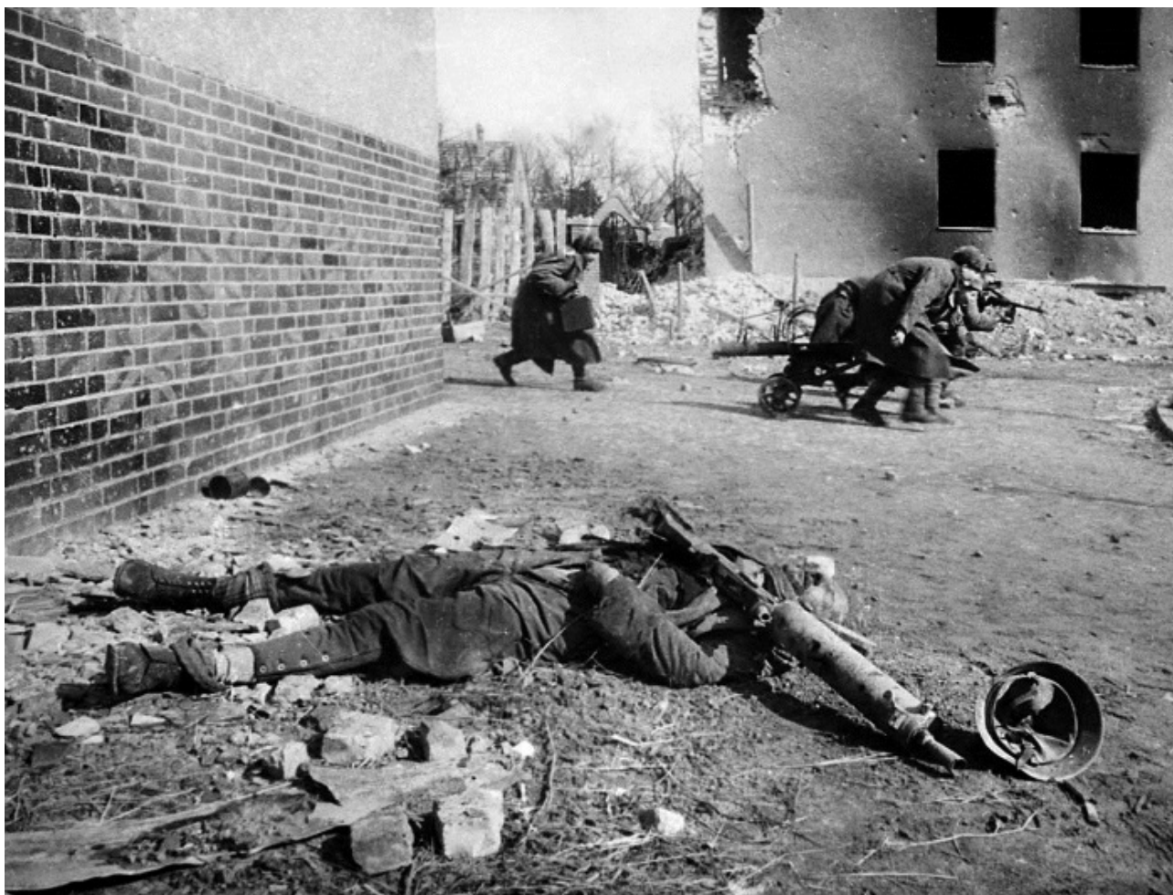
Советские бойцы с боем продвигаются по одной из берлинских улиц

Сущность стратегического плана верховного главнокомандования вермахта состояла в том, чтобы любой ценой удержать оборону на востоке, сдержать наступление советской Армии, а тем временем попытаться заключить сепаратный мир с США и Англией. Гитлеровское руководство выдвинуло лозунг: «Лучше сдать Берлин ангlosаксам, чем пустить в него русских». В специальных указаниях национал-социалистской партии от 3 апреля говорилось: «Война решается не на Западе, а на Востоке... Наш взор должен быть обращен только на Восток, независимо от того, что будет происходить на Западе. Удержание Восточного фронта является предпосылкой к перелому в ходе войны».