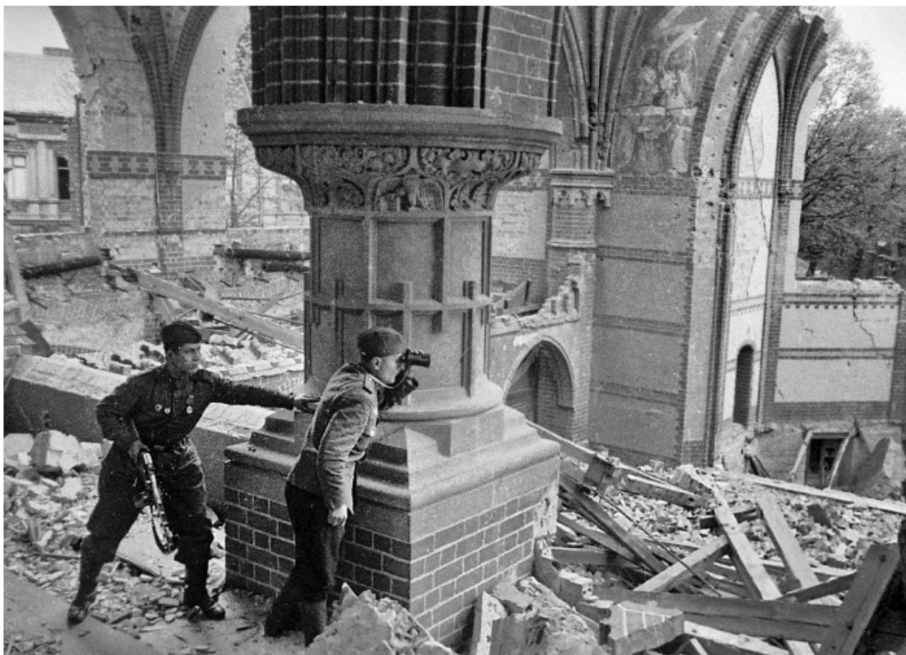
Советский офицер ведет корректировку артиллерийского огня на разрушенных улицах Берлина