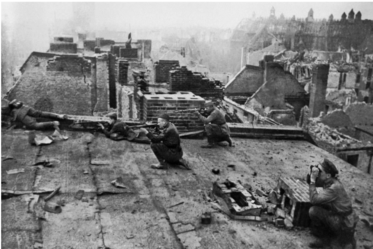
Советские бойцы ведут бой в одном из районов Берлина