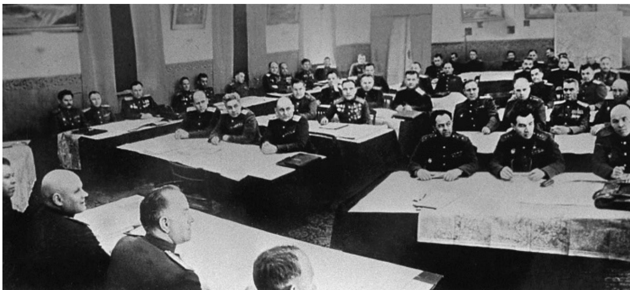
Совещание командующих армиями перед штурмом Берлина. I-й Белорусский фронт, апрель 1945 г.

3-я ударная армия захватила мост Мольтке, овладела домом юго-восточнее моста Мольтке, захватила здание министерства внутренних дел и приступила к штурму Рейхстага, овладение которым было возложено на 79-й стрелковый корпус. Перед штурмом рейхстага Военный совет армии вручил своим дивизиям девять Красных знамен, специально изготовленных по типу Государственного флага СССР. Одно из этих Красных знамен, известное под № 5 как Знамя Победы, было передано 150-й стрелковой дивизии. Подобные, но самодельные красные знамена, флаги и флажки имелись во всех передовых частях, соединениях и подразделениях. Они, как правило, вручались штурмовым группам, которые комплектовались из числа добровольцев и шли в бой с главной задачей – прорваться в рейхстаг и установить на нем красный стяг.