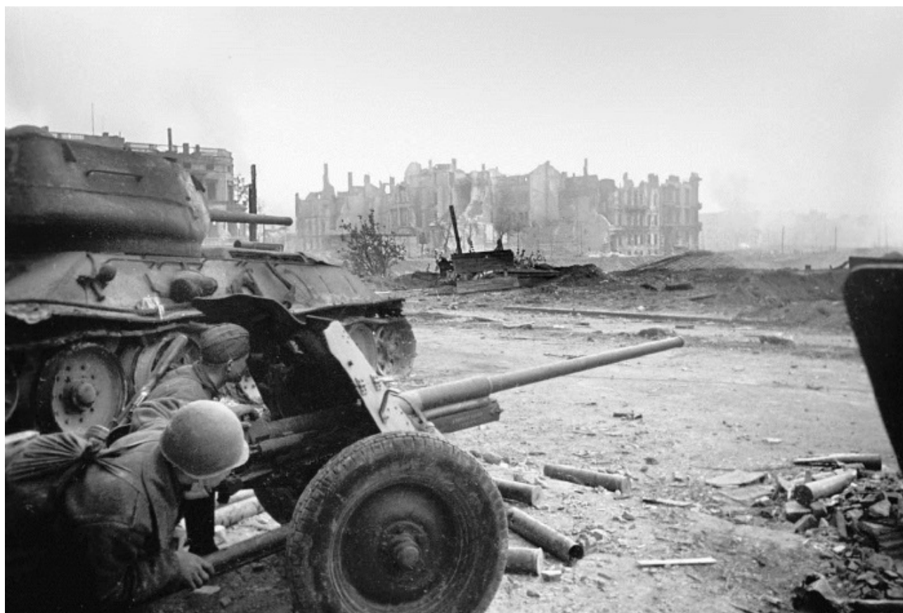
Бой на подступах к Рейхстагу. Берлин

В этот день на всех фронтах подбито и уничтожено 50 немецких танков и самоходных орудий. В воздушных боях и огнем зенитной артиллерии сбито 40 самолетов противника.