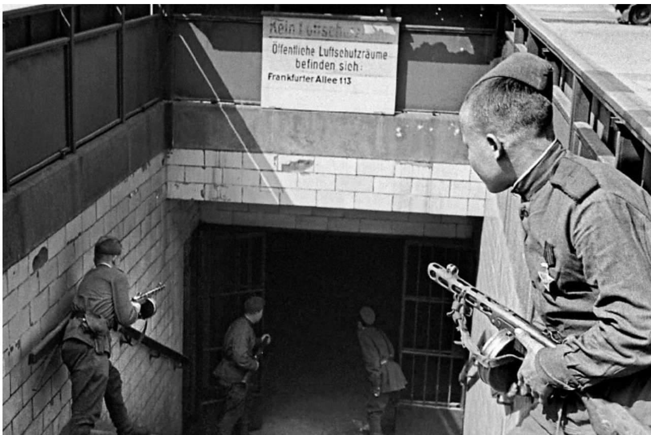
Советские солдаты ведут бой у одного из входов в Берлинское метро