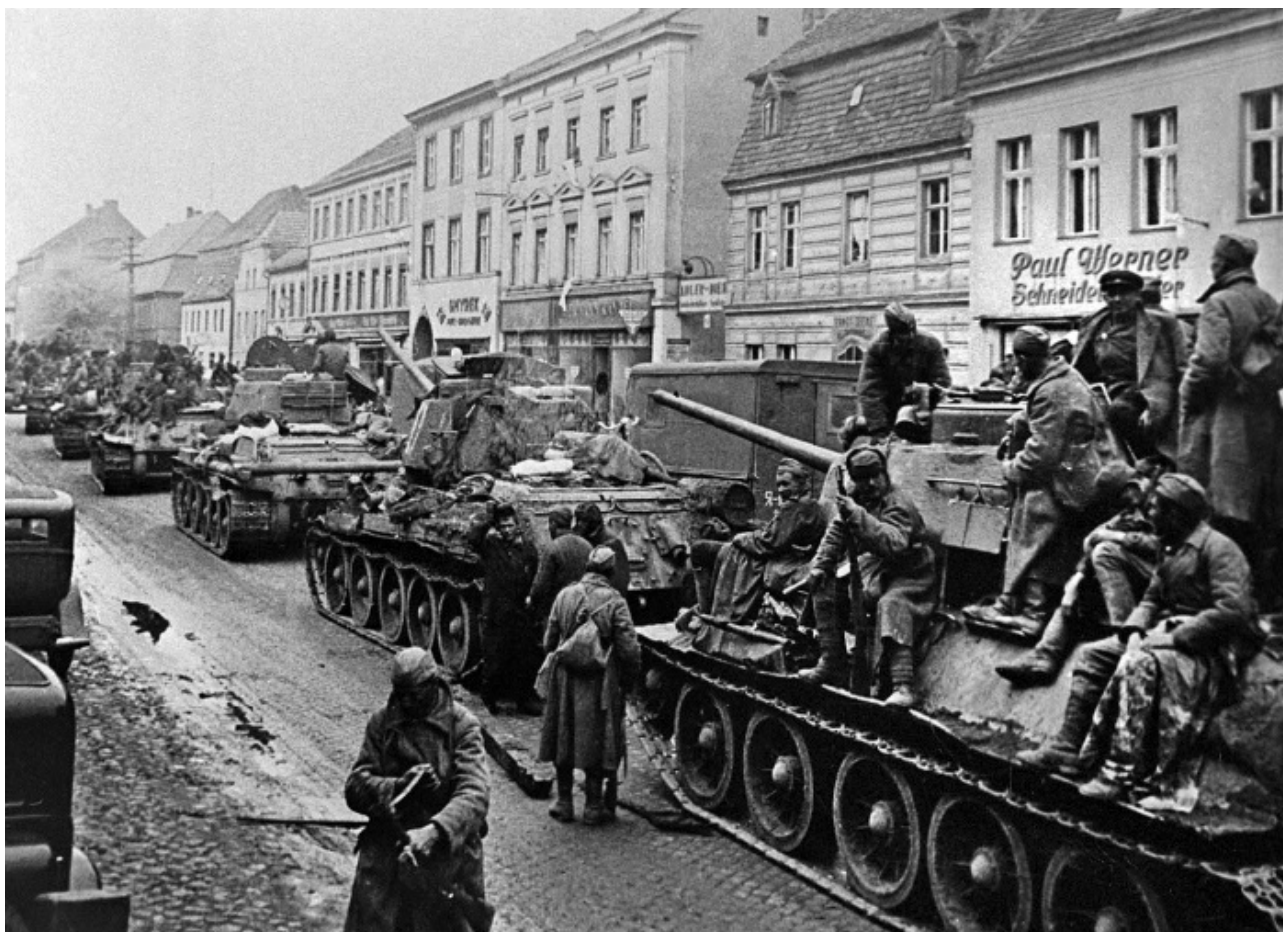
Советские танки стоят на городской улице во время подготовки к штурму Берлина