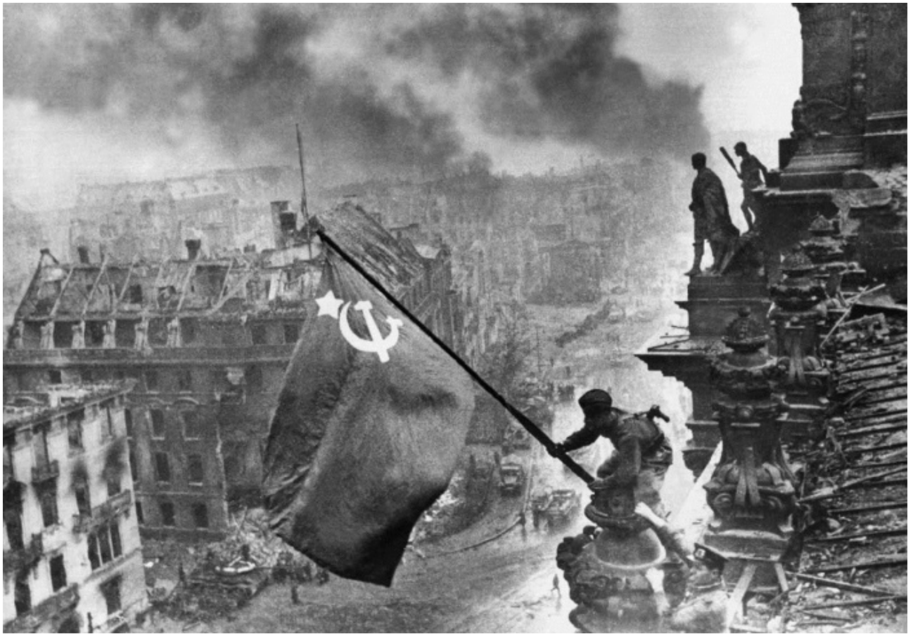
Знамя Победы над Берлином