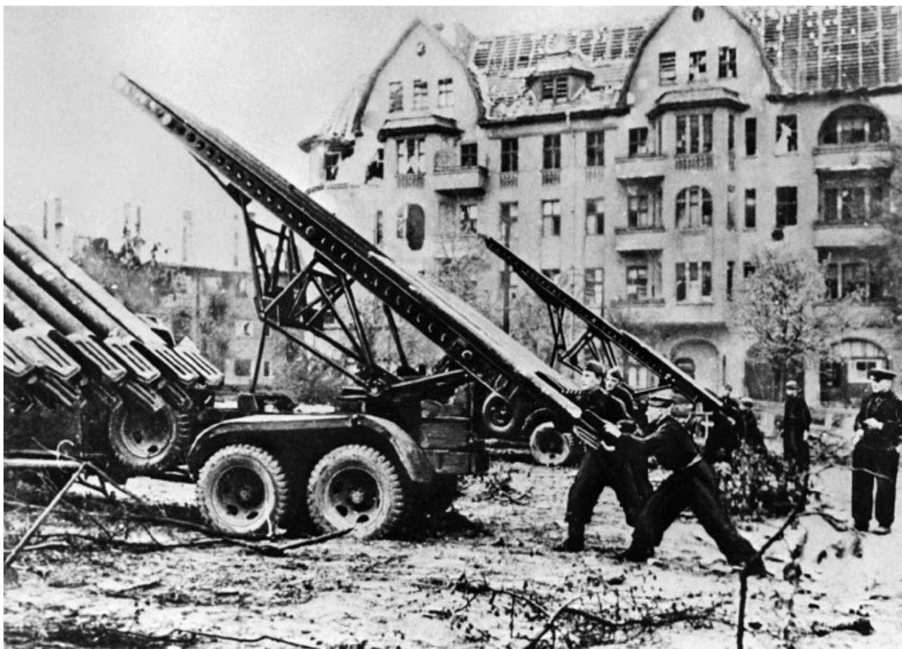
Советские артиллеристы во время боев на улицах Берлина

В Данцигской бухте потоплены два немецких транспорта.