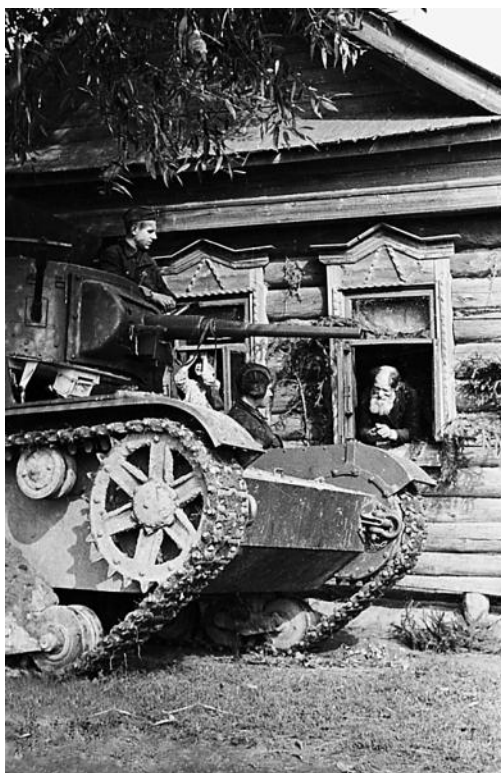
Жители деревни беседуют с танкистами во время военных учений. 1940 г.

2-я танковая армия Гудериана возобновила из района Мценска наступление на Тулу. Началась Тульская оборонительная операция, продолжавшаяся до 5 декабря. В Туле еще в начале октября войск, способных оборонять город, не было. Во второй половине октября сюда вышли из окружения под Брянском три сильно пострадавшие стрелковые дивизии 3-й армии Брянского фронта – от 500 до 1500 бойцов в каждой, у которых было всего 4 орудия. Жители Тулы организовали срочный ремонт оружия, пошив обмундирования, подкормили их. 29 октября к городу подошла отступавшая с боями 50-я армия – единственная армия Брянского фронта, не попавшая в окружение, а вслед за ней – войска противника. 7-дневные попытки немцев захватить город в лоб были отбиты этими частями, а также местным гарнизоном (156-й полк НКВД, 732-й зенитный артиллерийский полк ПВО и ополченцы). Тогда командующий 2-й танковой армией Гудериан решил обойти город с юго-востока на Сталиногорск – Каширу, но 7 ноября был остановлен в 10 километрах южнее железной дороги Тула – Узловая. Тула оказалась в клещах с востока и с запада, но немцы так и не овладели ею.