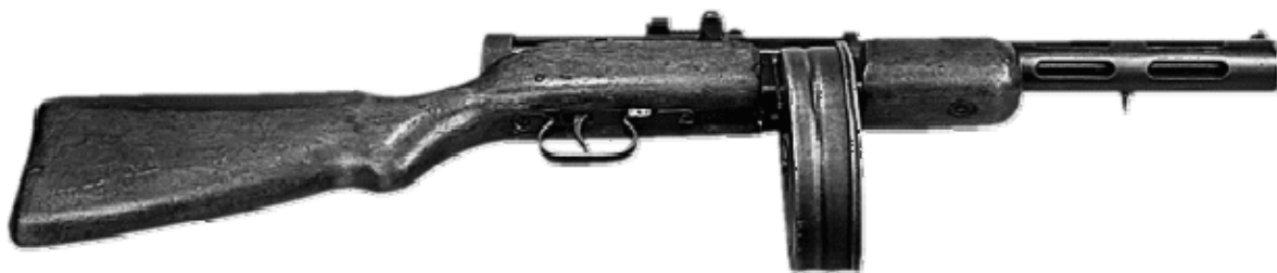
Пистолет-пулемет Шпагина калибром 7,62 мм. 1941 г.