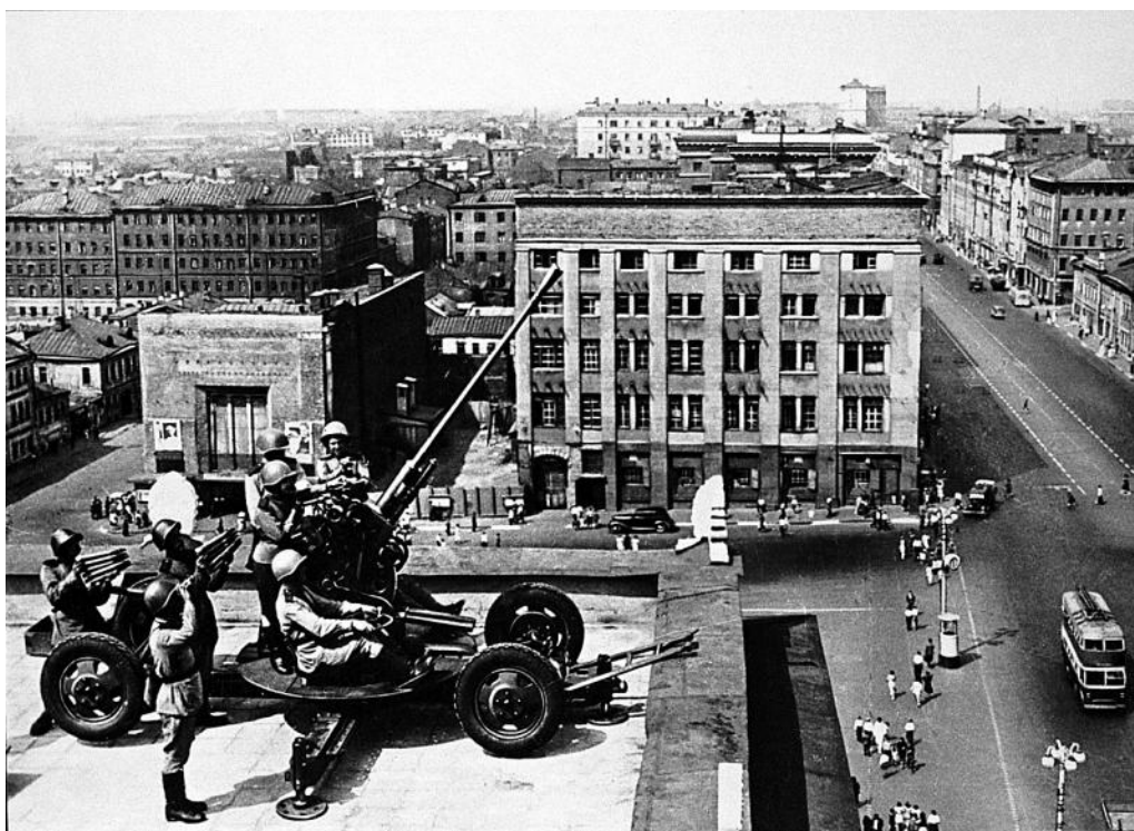
Зенитчики обороняют небо столицы.

Битва за Москву (Московская битва, Битва под Москвой; 30 сентября 1941-го – 20 апреля 1942 года) делится на 2 периода: оборонительный (30 сентября – 4 декабря 1941-го) и наступательный, который состоит из 2 этапов: контрнступления (5–6 декабря 1941-го – 7–8 января 1942-го) и общего наступления советских войск (7–10 января – 20 апреля 1942-го). В ходе Московской оборонительной операции были проведены Орловско-Брянская, Вяземская, Можайско-Малоярославецкая, Калининская, Тульская, Клинско-Солнечногорская и Наро-Фоминская фронтовые оборонительные операции.