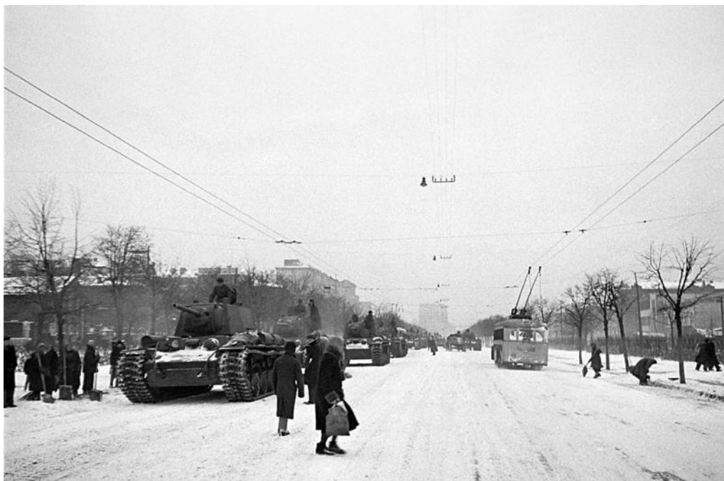
На улицах Москвы. Ноябрь 1941 г.

Противник силами 112-й и 167-й пехотных дивизий вновь оттеснил части 3-й армии к востоку от линии Алексеевка, Волчья Дубрава и, развивая наступление далее, создал непосредственную угрозу обхода левого фланга 50-й армии.