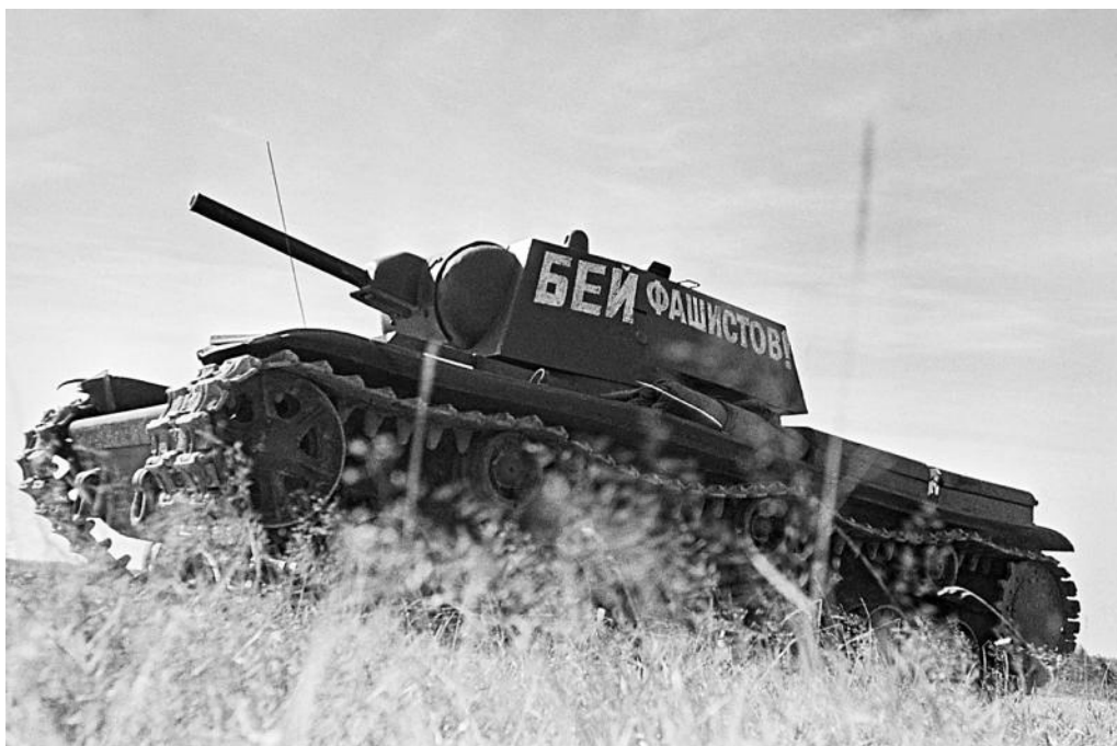
Танковый полк при Военной Академии механизации и моторизации им. Сталина. Колонна танков на марше. Москва, июнь 1941 года.

Вячеслав Молотов позвонил назначенному 10 октября командующему обороной Москвы Георгию Жукову и провизжал в трубку, что тот будет расстрелян, если наступление немцев не будет остановлено.