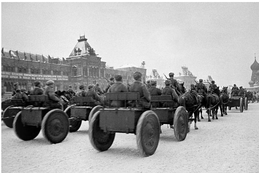
После военного парада 7 ноября 1941 года – на фронт.

Потом прошли пушки весьма почтенного возраста (новые были на фронте) и не менее 200 танков: на фронт через Москву следовали 2 танковые бригады, их выгрузили на окружной дороге и завернули на Красную площадь. Танки повернули у Лобного места на Ильинку и через площадь Дзержинского направились на северо-западные окраины города – к фронту. Войска на рубеж обороны в районе Озерецкого и Красной Поляны с парада отправили в трамвайных вагонах. На взлетных полосах дожидались 300 самолетов, но в воздух они не поднялись: погода была облачной, сыпал снег, что, впрочем, никого не огорчило: немцы по этой же причине над Москвой не появились.