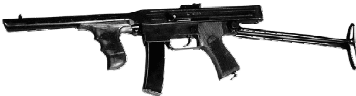
Пистолет-пулемет системы Калашникова.

В воздушном бою под Подольском погиб 23-летний летчик-истребитель, младший лейтенант ВВС РККА, Герой Советского Союза Виктор Васильевич Талалихин (1918–1941), участник советско-финляндской и Отечественной войн. Заместитель командира эскадрильи 177-го истребительно-авиационного полка ПВО, младший лейтенант Талалихин в ночь на 7 августа 1941 года в воздушном бою над Москвой одним из первых совершивший воздушный таран вражеского самолета и сбивший таким образом на подступах к Москве вражеский бомбардировщик Хейнкель-111. За что на следующий день получил звание Героя Советского Союза. Он провоевал еще два с половиной месяца, сбил 6 самолетов и погиб в воздушном бою 27 октября 1941 года над Подольском в возрасте 23 лет.