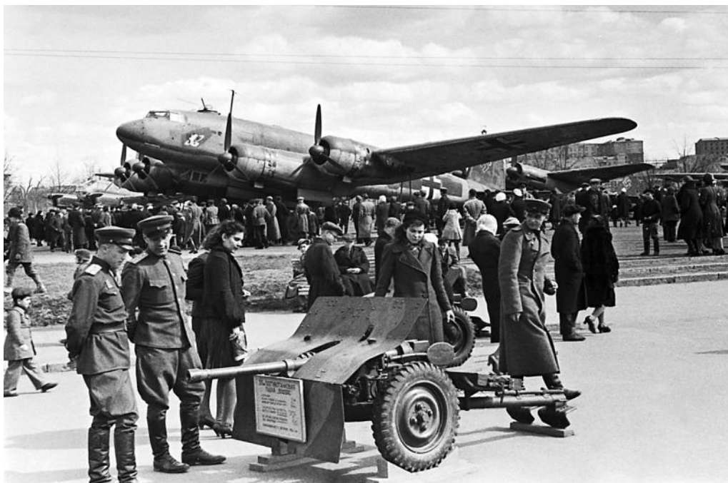
Москвичи на выставке трофейной военной техники, открытой в парке им. Горького.