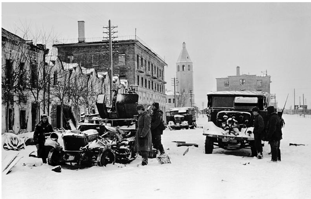
Советские солдаты рассматривают разбитую немецкую военную технику в г. Клин.