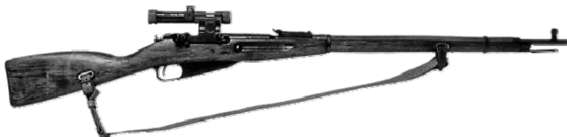
Снайперская винтовка Мосина-Нагана калибром 7,62 мм.

В Ульяновске умер изобретатель в области радиотехники, телеграфии и звуковой кинематографии Александр Фёдорович Шорин (1890–1941), директор Института автоматики и телемеханики АН СССР (1934–41). Создатель отечественного звукового кино.