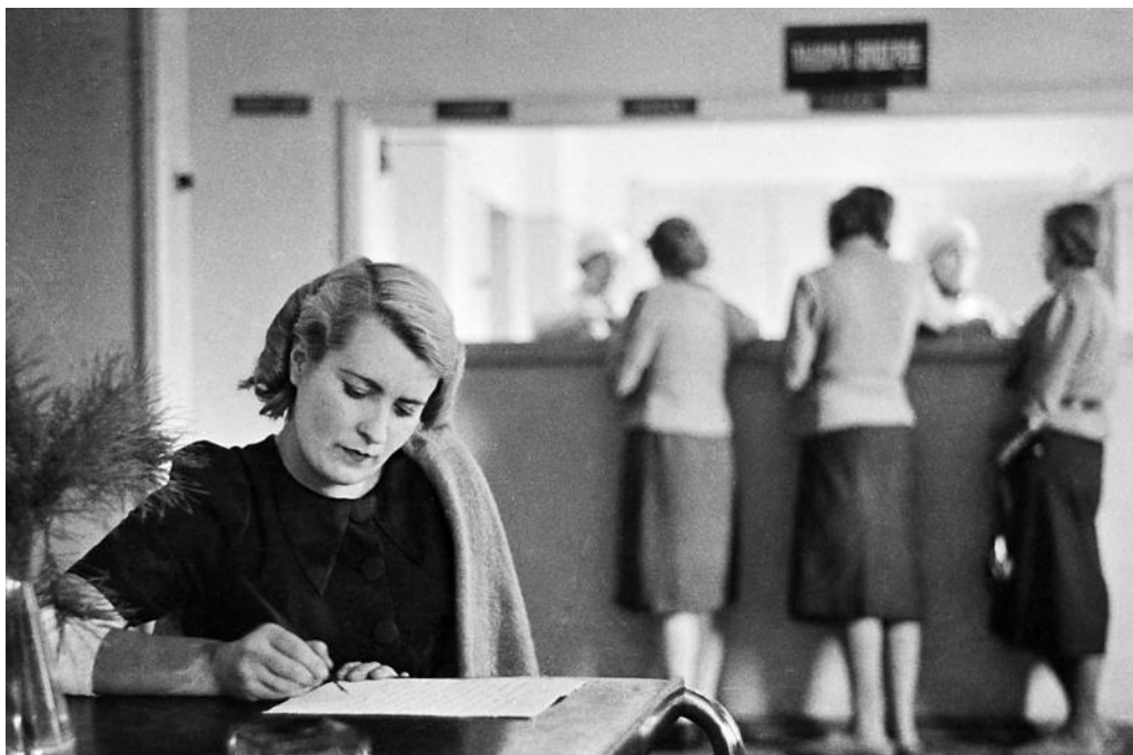
Мирная жизнь в Москве восстанавливается. 1942 г.

25-летие встретил самый известный советский военный фотокорреспондент, фотохудожник и фотожурналист Евгений Ананьевич Халдей (1917–1997), летописец Отечественной войны, чьи фотографии висят на почетных местах во всех фото-музеях мира.