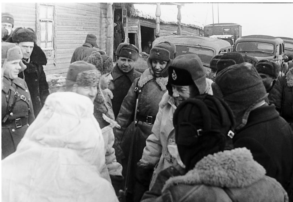
Глава английской военной миссии в Москве Макферлан общается с солдатами.

Завершилась Калужская операция. Войска левого крыла Западного фронта продвинулись на 120–130 километров на запад, вышли на рубеж восточнее Лобаново – Плетневка – Zubovo – Сухиничи, освободили сотни населенных пунктов.