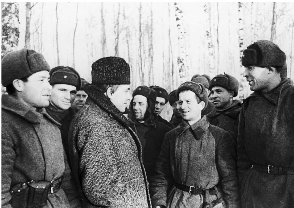
Писатель Илья Эренбург среди солдат.

удержаться, говорил, что Сталина предупреждали много раз о готовящемся нападении, что он не знает, как живет страна, а его обманывают... Я писал статьи в коридоре здания, где разместились Наркомат иностранных дел и Совинформбюро – машинку ставил на ящик... Иностранные корреспонденты изводили меня жалобами: почему их не пускают на фронт, почему привезли в Куйбышев и говорят, что нужно помечать телеграммы Москвой?..»