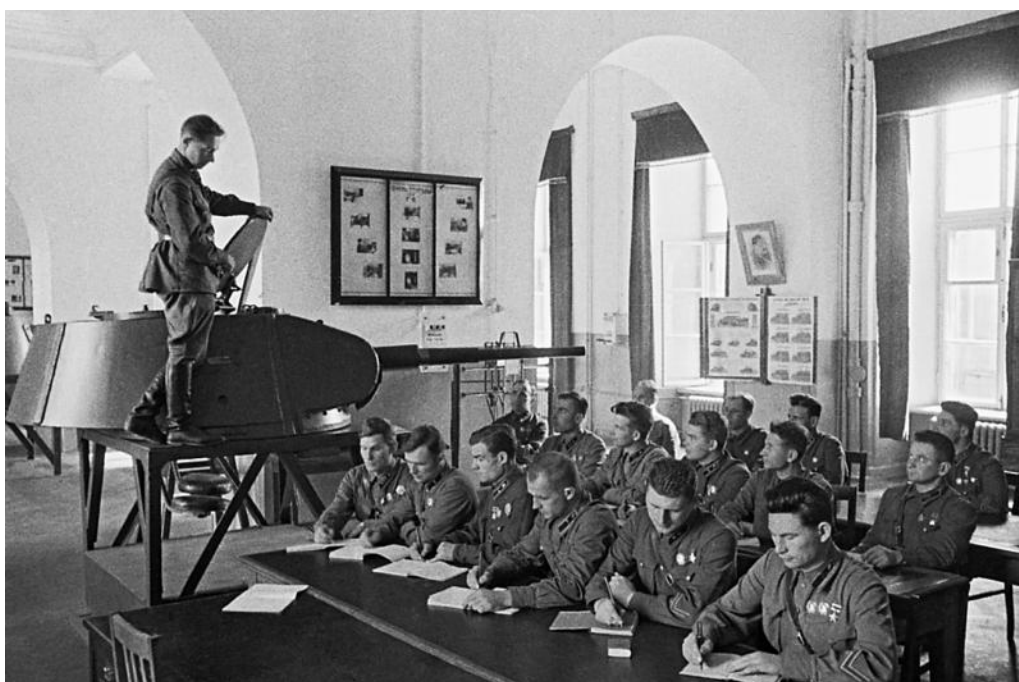
Занятия в Военной Академии им. Сталина. Москва, июнь 1941 года.

Катастрофическое поражение советских войск на первом этапе Московской битвы было вызвано тем, что советское командование почему-то не заметило концентрации немецких войск в кулак, направленный на Москву, а также еще и тем, что немецкая разведка выяснила, где находятся штабы, пункты связи и управления Западного и Резервного фронтов. Сделать это было нетрудно: не менее месяца они располагались в одних и тех же местах, – периодически переносить их на новое место почему-то никому в голову не пришло.