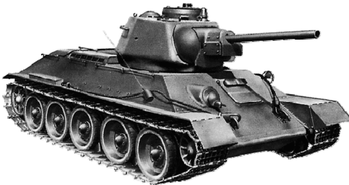
Легендарный советский танк Т-34

СССР, главный государственный арбитр при СНК СССР Филипп (Шая) Исаевич Голощекин (1876–1941).