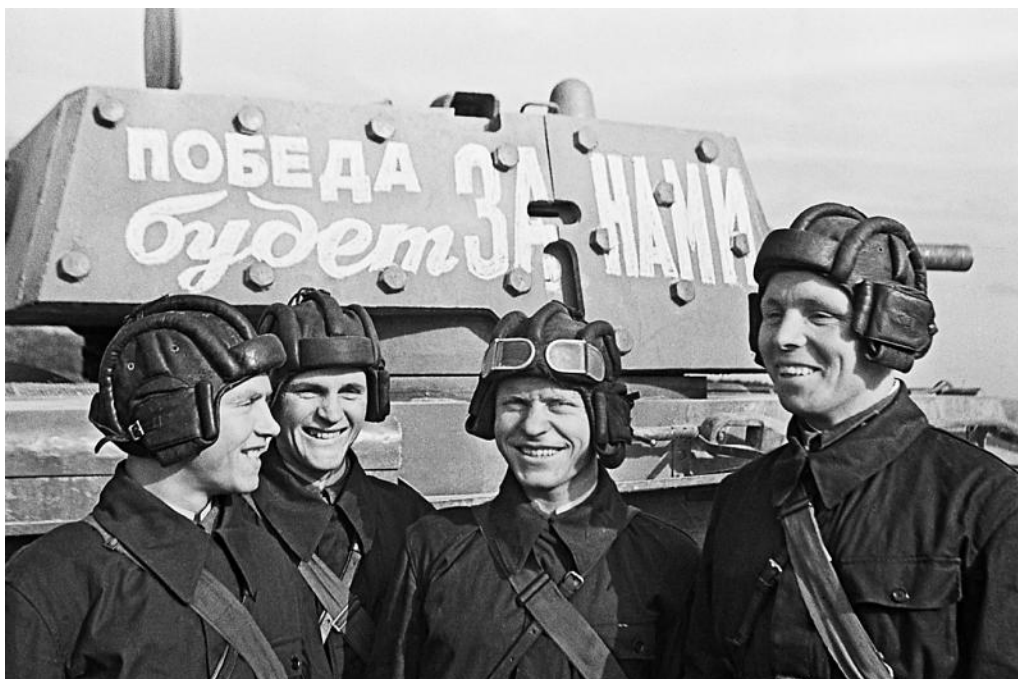
Танковый полк при Военной Академии механизации и моторизации им. Сталина. Перед отправкой на фронт.