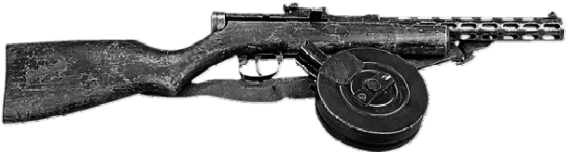
Пистолет-пулемет Дегтярева калибром 7,62 мм образца 1934–38 г.

Части 2-й немецкой танковой армии (командующий генерал-полковник Гейнц Вильгельм Гудериан) продолжали атаковать город Тулу с юга и одновременно сделали попытку обойти город с востока. Противнику удалось занять поселок Деделово (35 километров юго-восточнее города Тулы), но контратакой 413-й стрелковой дивизии генерал-майора Алексея Дмитриевича Терешкова был выбит из него. Неприятель отошел в поселок Панино (5 километров западнее поселка Деделово) и там занял оборону.