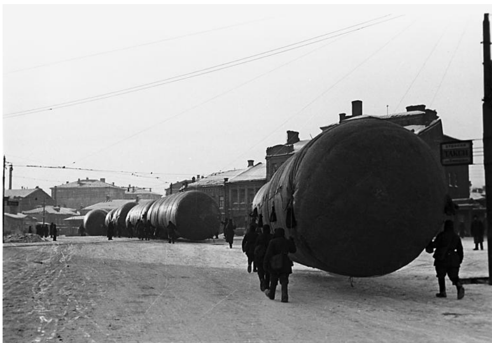
Военные несут баллоны с газом для аэростатов заграждения. 1941 г.

для обороны Соединенных Штатов», – сказал Рузвельт. Предполагалось, что свой долг в сумме 1 миллиарда долларов СССР начнет выплачивать сырьем через 5 лет после окончания войны. Ранее Рузвельт весьма образно объяснил идею ленд-лиза: «Представьте себе, что загорелся дом моего соседа, а у меня на расстоянии 400–500 футов от него есть садовый шланг. Если он сможет взять у меня шланг и присоединить к своему насосу, то я смогу помочь ему потушить пожар. Что же я делаю? Я не говорю ему перед этой операцией: «Сосед, этот шланг стоил мне 15 долларов». Нет! Какая же сделка совершается? Мне не нужны 15 долларов, мне нужно, чтобы он возвратил мой шланг после того, как закончится пожар».