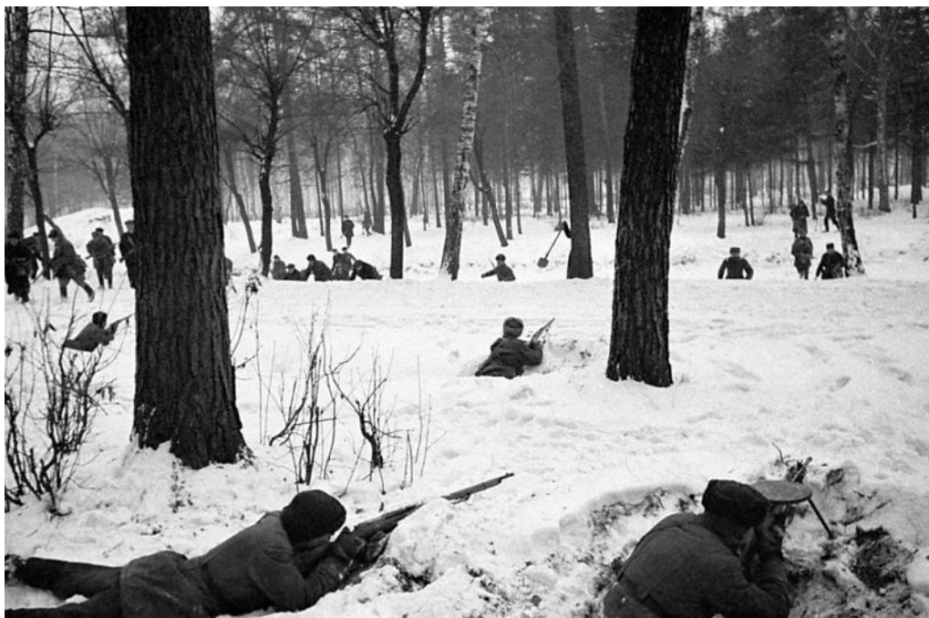
Оборона Москвы. Всеобщее военное обучение (Всевобуч) ополченцев Москвы. Октябрь – декабрь 1941 года.

По сообщениям управлений НКВД, после начала войны, а особенно в октябре участились случаи проявления антисоветизма и антисемитизма, полная несостоятельность руководства и растерянность обывателей, панические настроения на всех уровнях. Многие говорили: «Гитлер русским ничего не сделает, будет бить только евреев»; «скоро всех коммунистов перевешают, Советской власти будет конец»; в Москве надо поступить, как в Париже, – открыть ворота и впустить немцев; «правительству будет плохо, пусть оно и спасается», «немцы не так жестоки, как говорят об этом». Говорили также об измене военачальников – Дмитрия Павлова, Семена Тимошенко и даже самого Сталина.