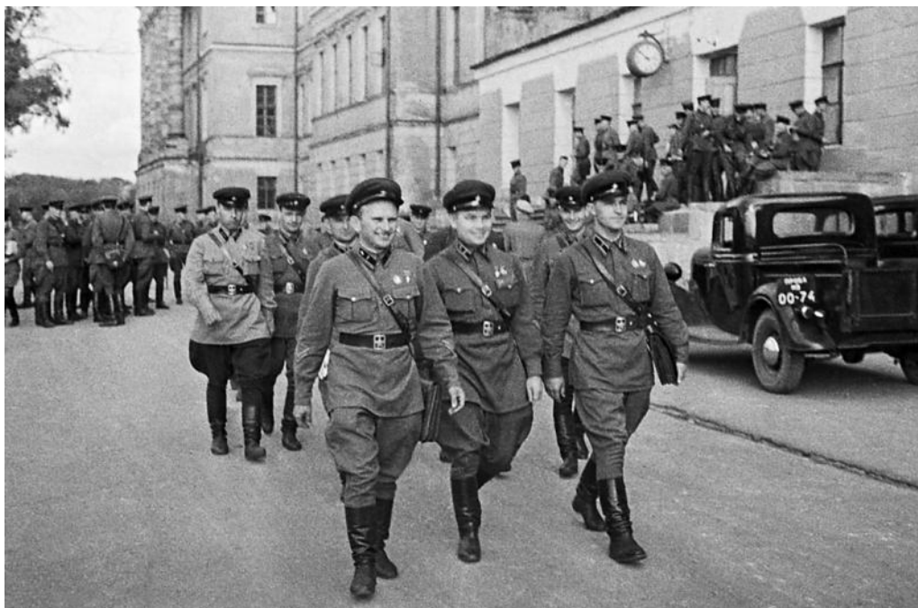
Выпускники Военной Академии им. Сталина. Москва, июнь 1941 года.

материальной части наших танковых сил, имевшее место до сих пор, было отныне потеряно и теперь перешло к противнику. Тем самым исчезли перспективы на быстрый и непрерывный успех... Намеченное быстрое наступление на Тулу пришлось отложить». Однако Брянский фронт оказался рассеченным, и его войска, неся потери, с боями отступали на восток.