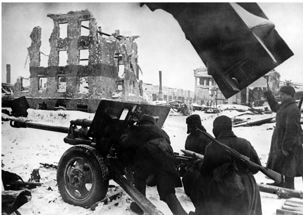
Советские артиллеристы ведут огонь по врагу. 1942 г.