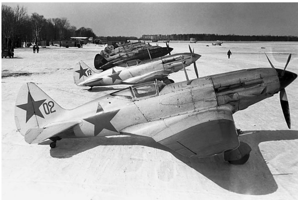
Истребители на подмосковном аэродроме. Зима 1941 г.

хлебные крошки разгуливающим по перрону голубям. Идиллия!.. В «купе», где царские жандармы возили пятерых заключенных, стража с красными звездами на фуражках набивала по 20–25 человек. Сидеть приходилось по очереди. От духоты и усталости люди теряли сознание...» Среди этих стоявших на четвереньках людей, а затем забитых в состав на Саратов был и Николай Вавилов. Всех же остальных политических заключенных расстреляли перед отъездом в Москве. Среди расстрелянных были и арестованные перед самой войной за «антигерманскую пропаганду», и за распространение «ложных слухов о якобы неизбежной войне с Германией», а также 300 военных, некоторые из которых были арестованы уже после начала войны. Расстрелы продолжались и 16 октября.