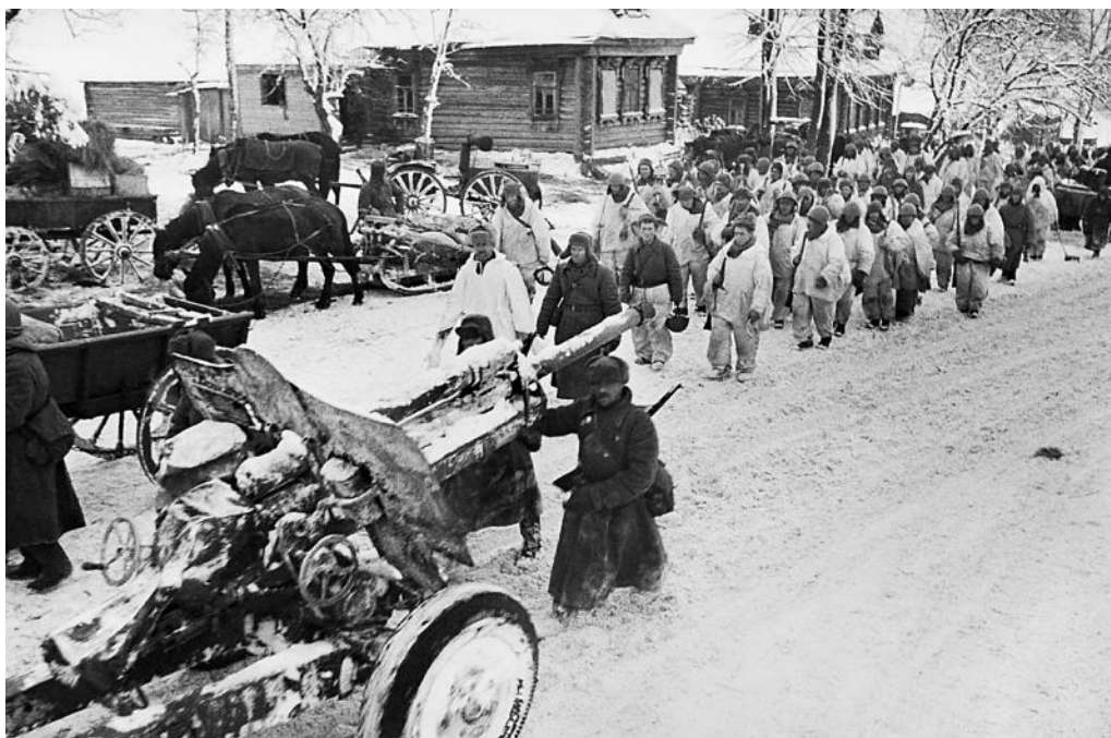
Советские войска идут по улице освобожденной деревни. Зима 1941 г.