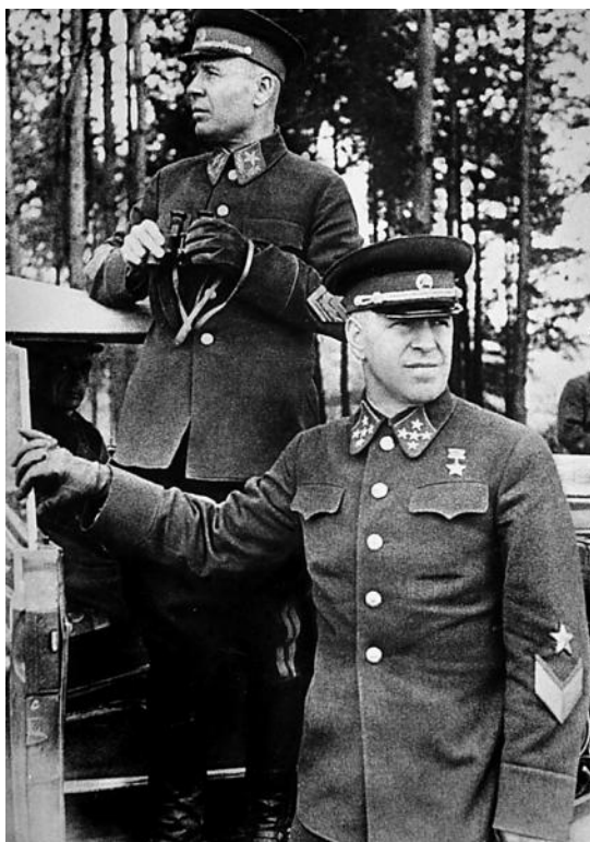
Маршал Советского Союза Семен Тимошенко (слева) и генерал Георгий Жуков (справа) на учениях войск Киевского особого военного округа. 1940 г.