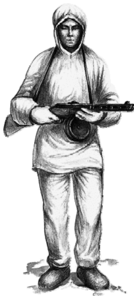
Красноармеец в маскировочном халате с автоматом ППШ.

6. ...В первую очередь обучить команды умению распознавать танки врага, их уязвимые места, метко поражать их бутылками с горючим и гранатами, уметь окапываться, маскироваться, делать завалы и ловушки. Занятия проводить 2–3 раза в неделю по три часа в условиях, приближенных к боевой обстановке. Макеты танков, учебные гранаты, бутылки с окрашенной жидкостью изготовить в необходимом для обучения количестве силами комсомольцев и молодежи».