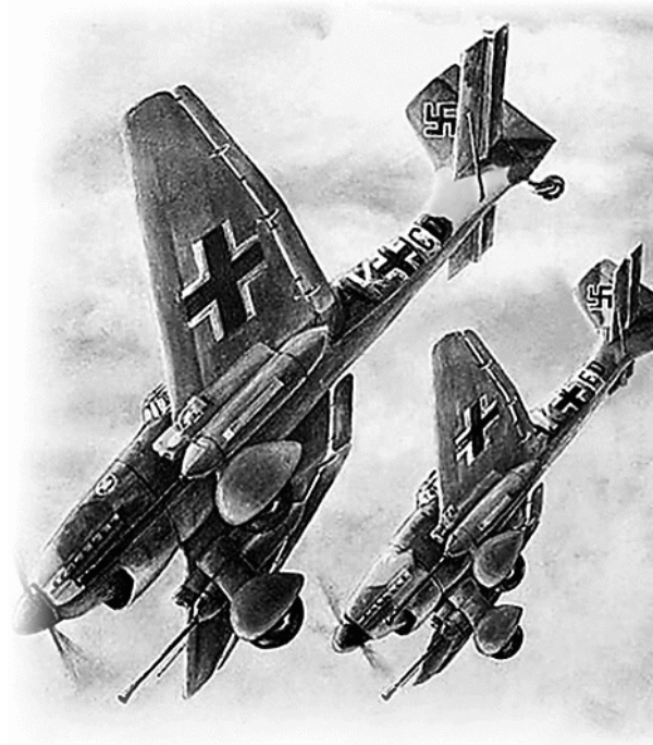
Атака фашистской авиации.