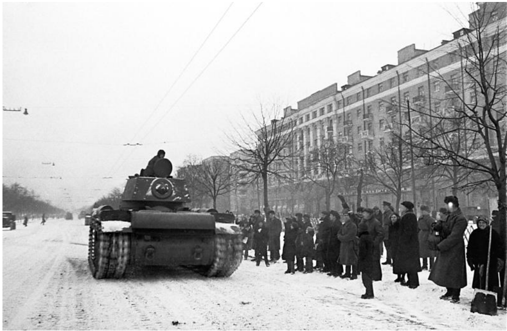
Танки на улицах Москвы. Ноябрь 1941 г.

Сам факт парада на Красной площади, в осажденной Москве, и выступление на нем Сталина произвели сильное впечатление и в стране, и за рубежом. Прославление России, притом России не только Ленина, обращение к именам «великих предков» – Александра Невского, Дмитрия Донского, Кузьмы Минина, Дмитрия Пожарского, Александра Суворова, Михаила Кутузова, многие из которых еще недавно числились в «царских слугах», – вызвало в стране моральный подъем.