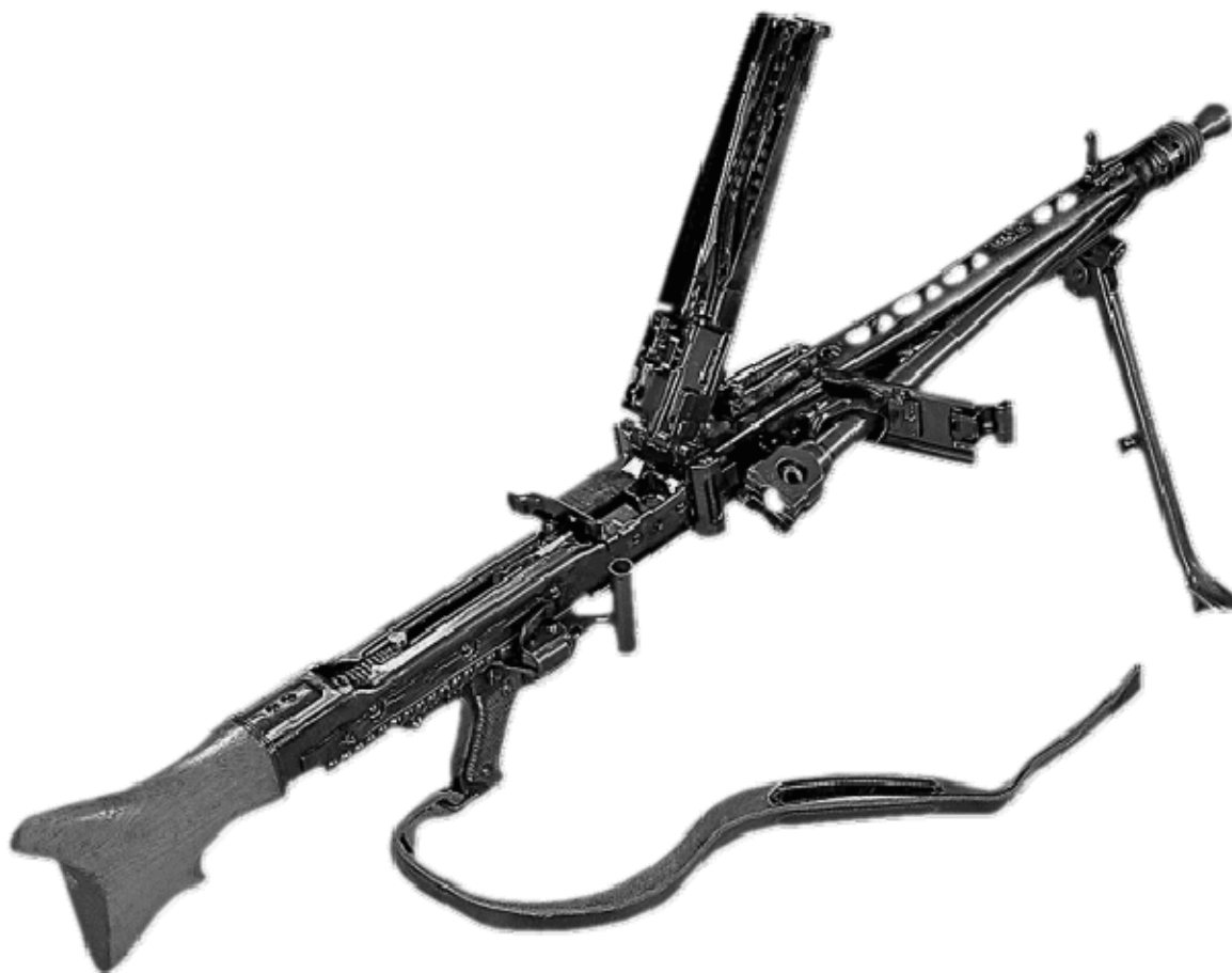
Германский пулемет MG-42.

Академик Владимир Вернадский записал в дневнике: «Отвратительно бездарное радио явно рисует отрыв власти от населения. Нам сообщают пустяки, анекдоты. Московские газеты мы имеем только от 3 ноября. Как ни плохи они и как ни бездарны – из них все-таки обыватель, с огромным опозданием, узнает кое-что».