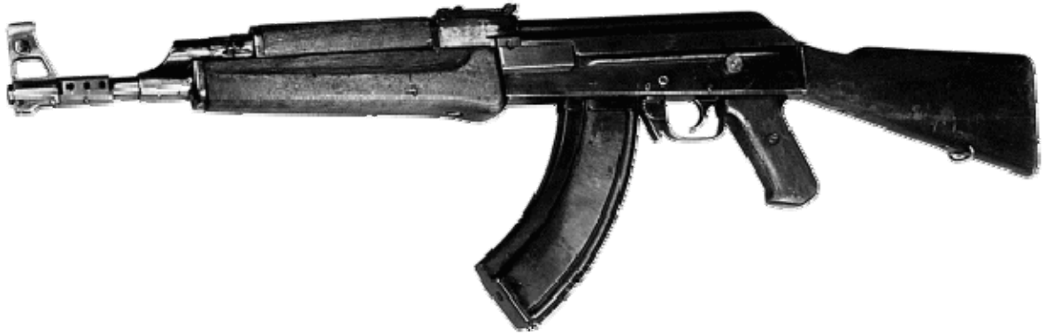
Опытный автомат АК-47.