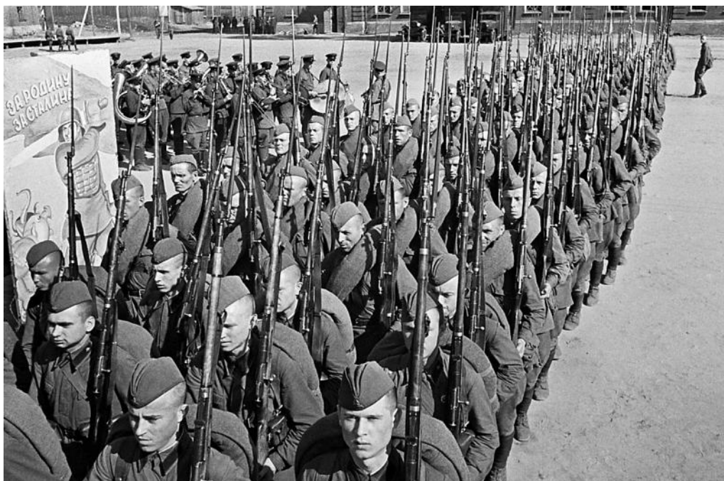
Мобилизация. Колонны бойцов движутся на фронт. Москва, 23 июня 1941 года.