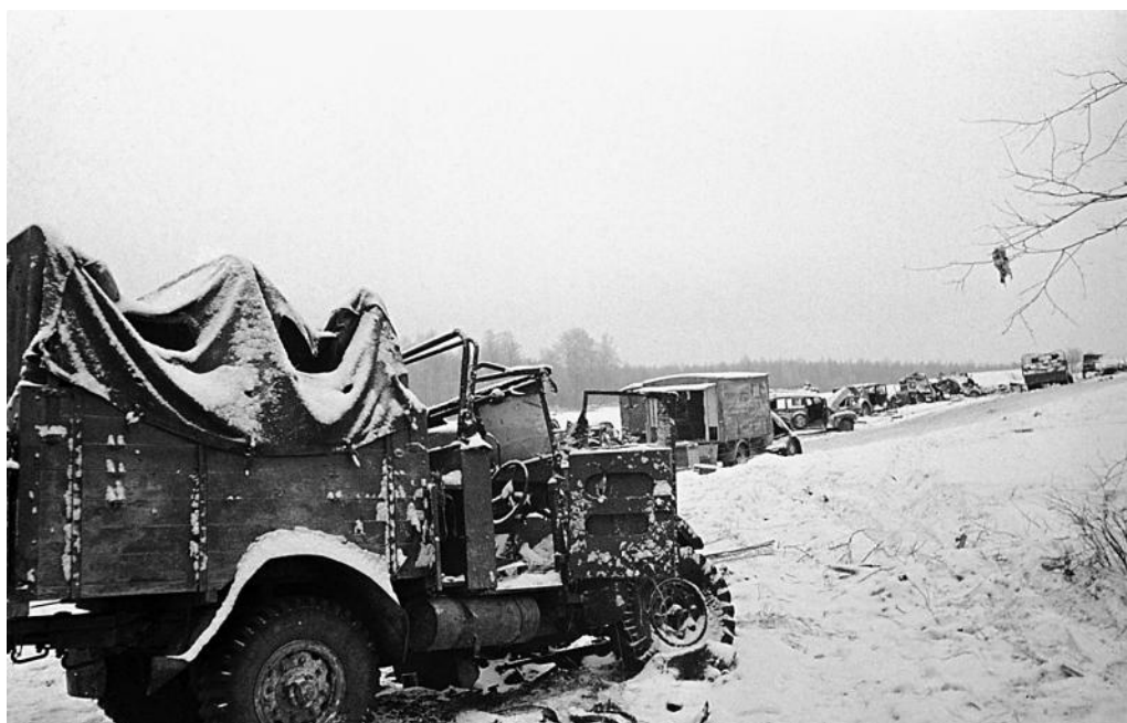
Военная техника, брошенная фашистами при отступлении на Волоколамском шоссе под Москвой. 5 декабря 1941 г.

В пригороде оккупированной Риги убит фашистами 81-летний русский историк, публицист, общественный деятель Семён Маркович (Шимон Меерович) Дубов (1860–1941). После оккупации города оказался в гетто, и был включен в колонну смертников, убитых в пригороде.