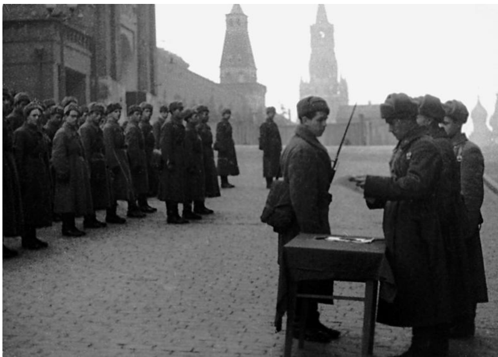
Бойцы принимают присягу на Красной площади. Июль 1941 г.