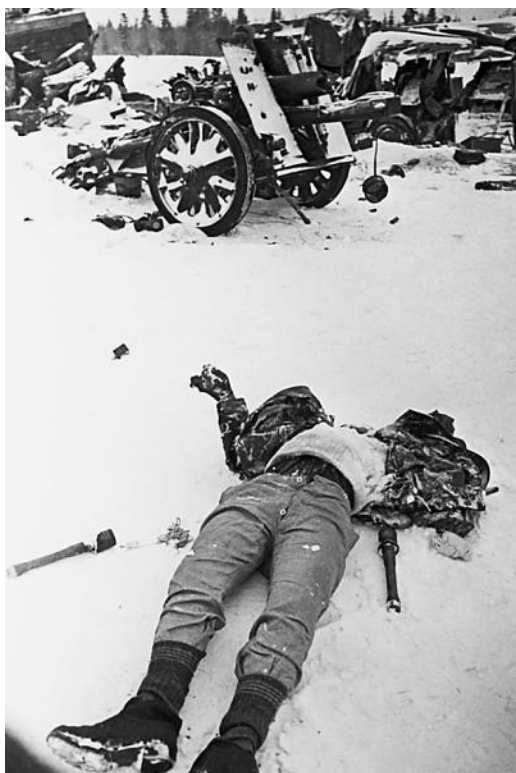
Труп немецкого солдата. 1 декабря 1941 г.

операция, цель которой: наступать в районах городов Клина и Солнечногорска, в результате чего советские войска продвинулись на 30–40 км.