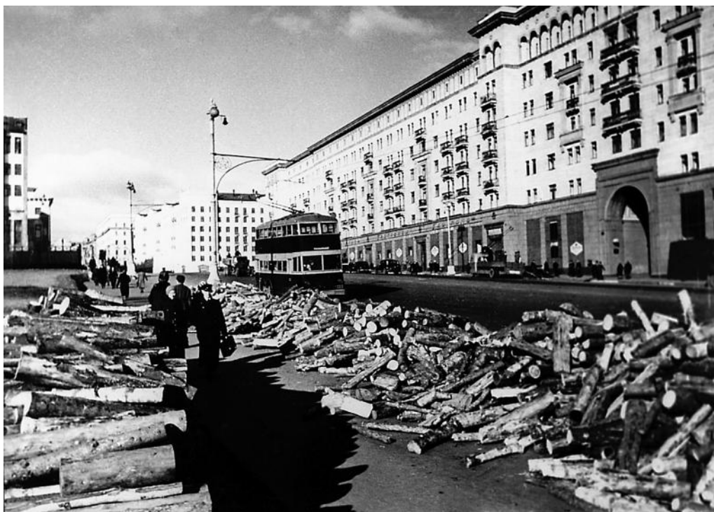
Прифронтовая Москва готовится к зиме. На улице Горького сложены дрова.

Литератор Мария Белкина, уезжавшая в этот день в эвакуацию с Казанского вокзала, вспоминала: «Уезжали актеры, писатели, киношники: Эйзенштейн, Пудовкин, Любовь Орлова... Все пробегали мимо, торопились, кто-то плакал, то кого-то искал, кого-то окликал... Подкатывали шикарные лаковые лимузины с иностранными флажками – дипломатический корпус покидал Москву. И кто-то из знакомых на ходу успел мне шепнуть: правительство эвакуируется, Калинина видели в вагоне!.. А я стояла под мокрым, липким