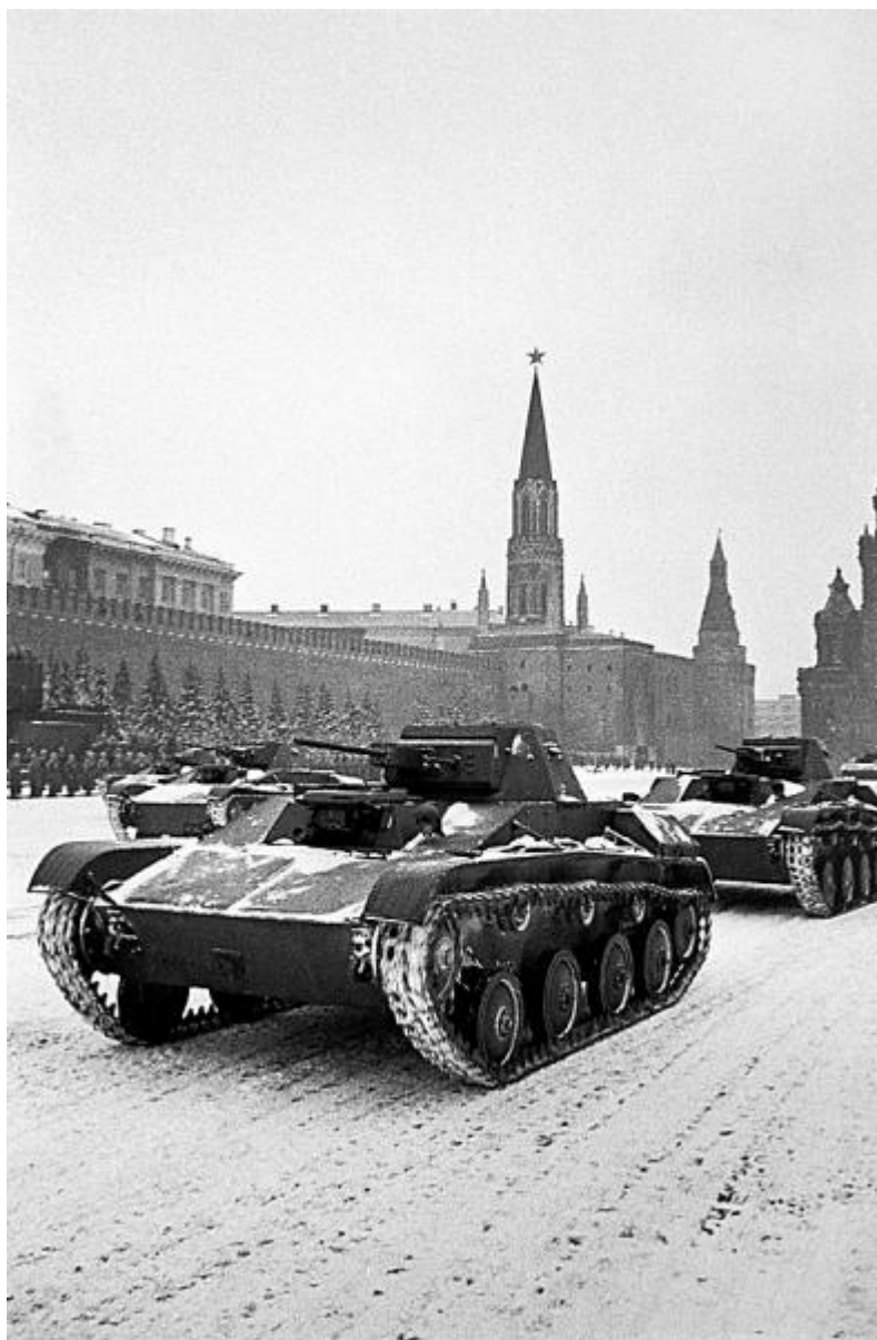
После военного парада – на фронт. Москва.