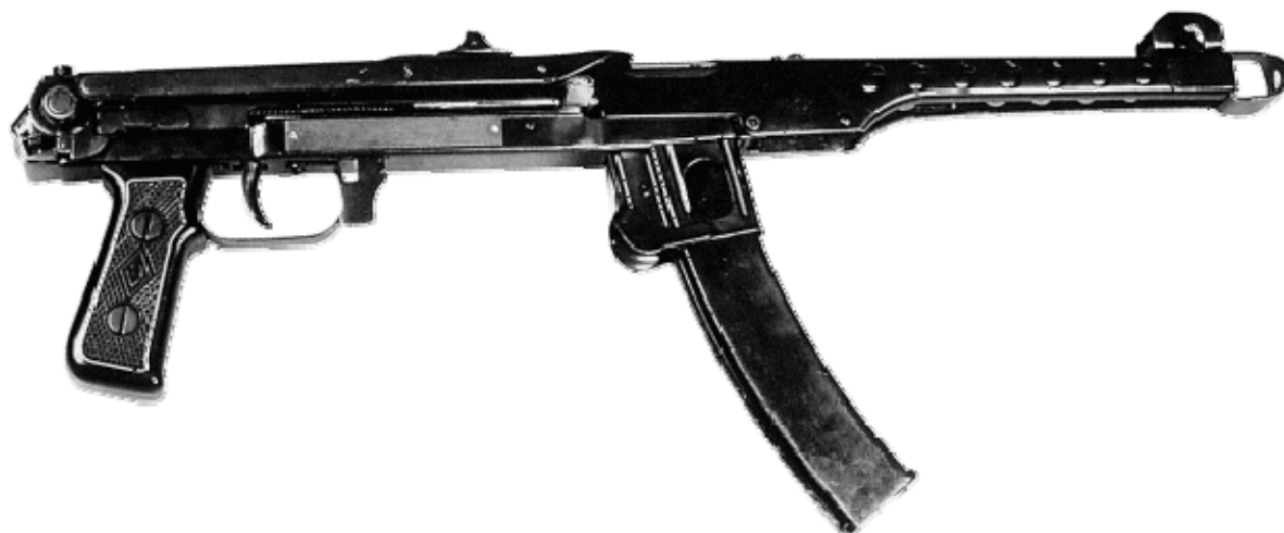
Пистолет-пулемет системы Судаева.

До конца года было произведено 18 152 противотанковых ружья. Их серийный выпуск начался во второй половине 1941 года; до войны они вообще не производились.