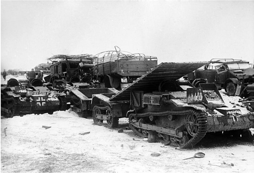
Разбитая фашистская техника в районе города Солнечногорска в Московской области.