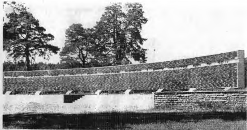
НА СНИМКЕ: мемориал в Роцце Пятисот в память о кингисеппцах, не вернувшихся с войны.