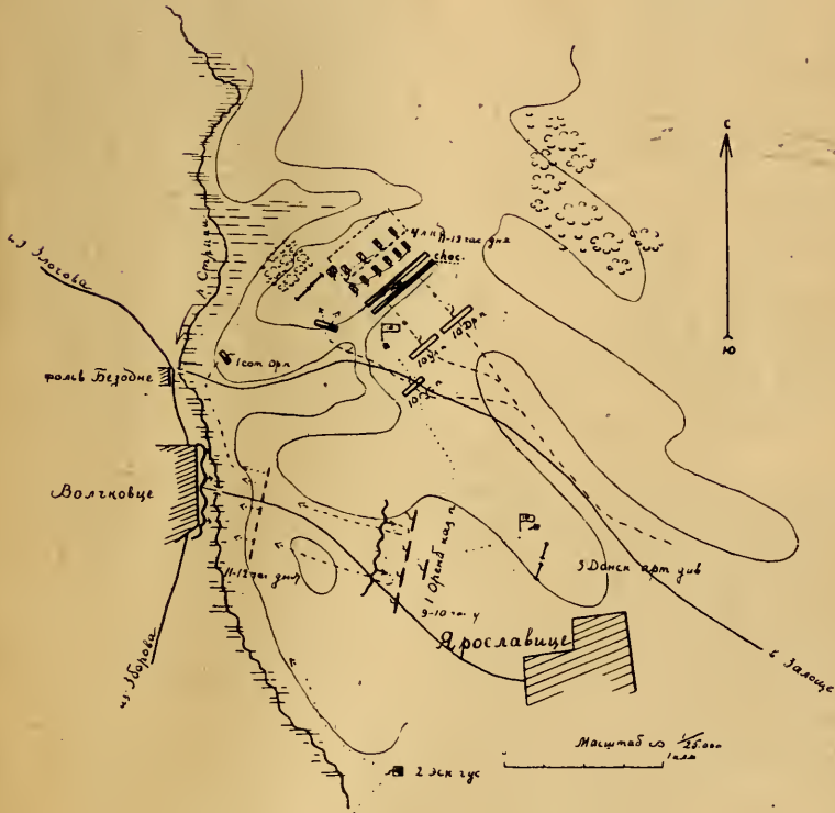
Схема N. 2.