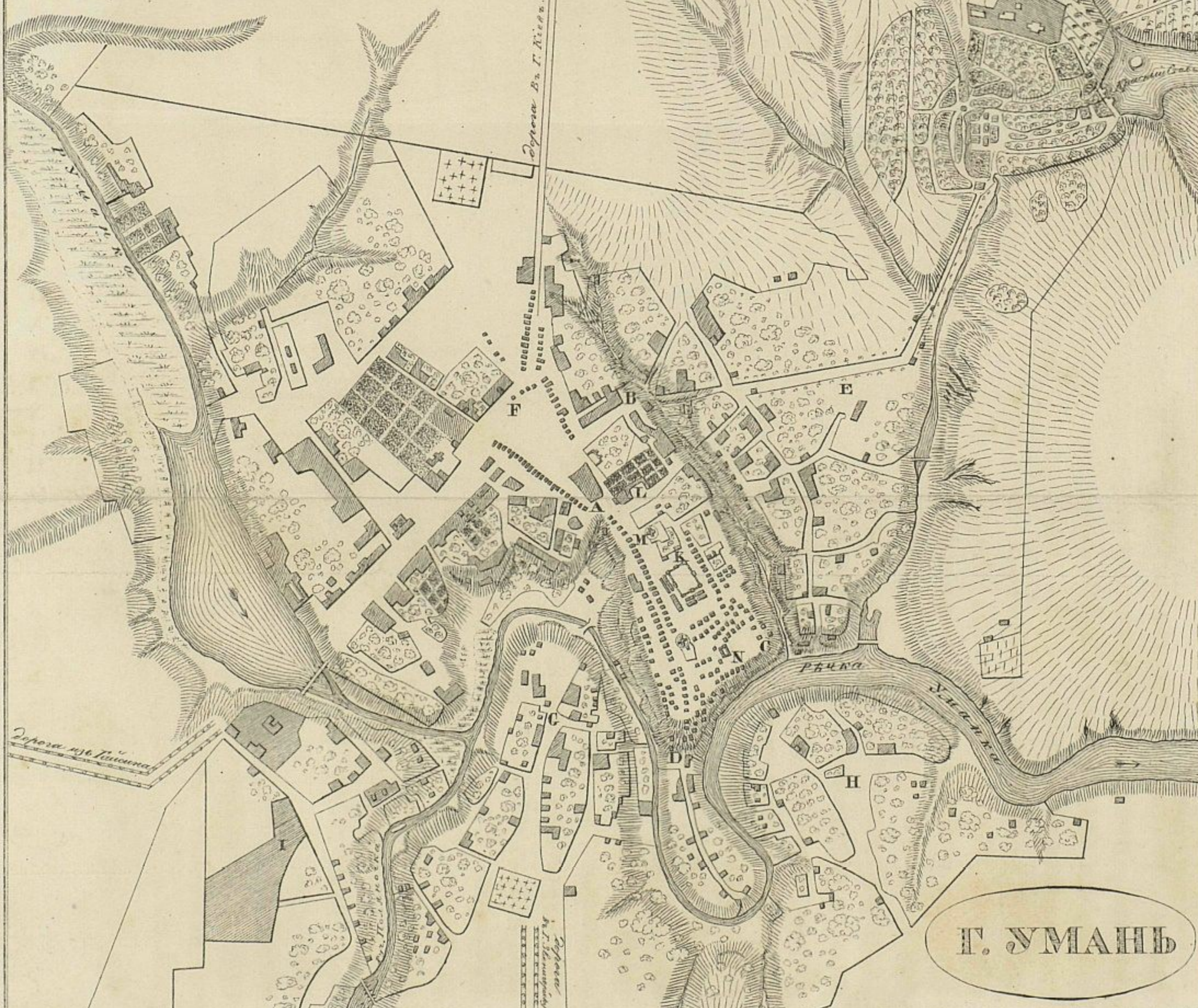
Маштабъ къ плану въ Англич. дюймѣхъ 250 сажо. 250 300 150 100 50 0 250 500 шаговъ.