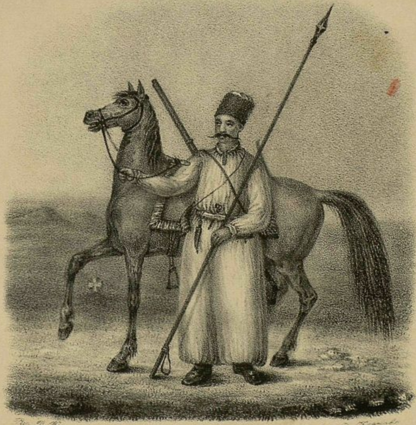
Рис. В. Козлова