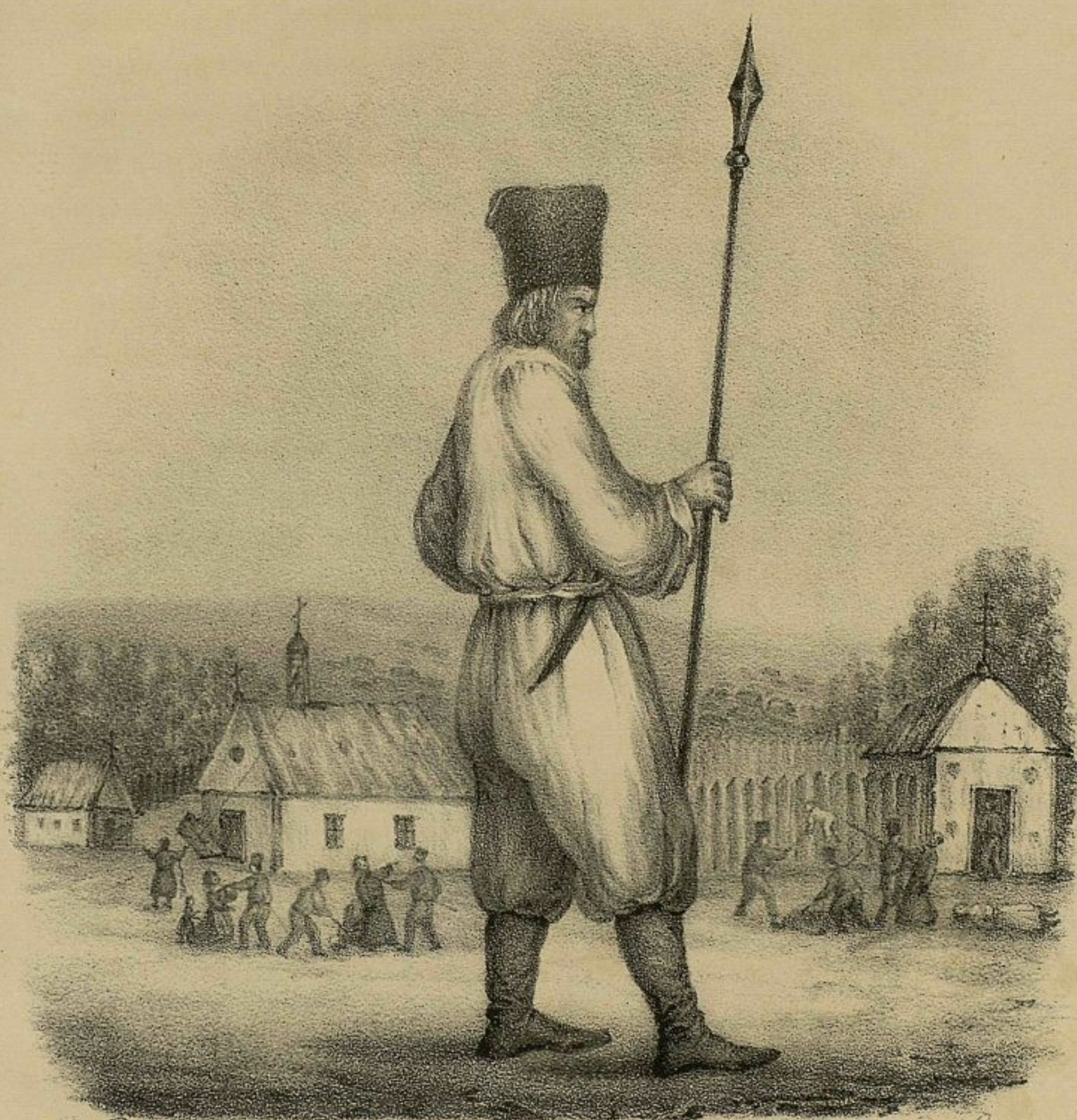
Рис. В. Калашников