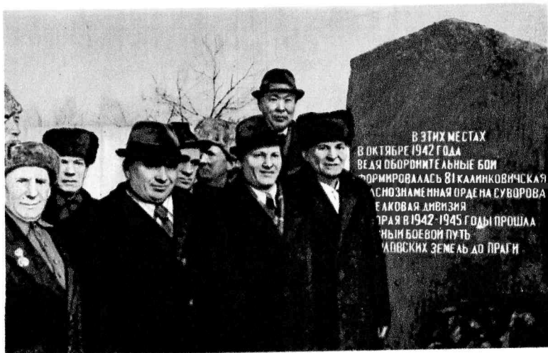
Группа ветеранов дивизии у памятного знака в селе Нижний Жерновец Верховского района Орловской области. Октябрь 1977 г.