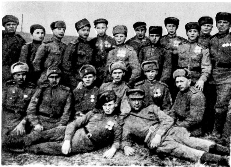
Группа разведчиков и автоматчиков 467-го стрелкового полка, Март 1945 г.