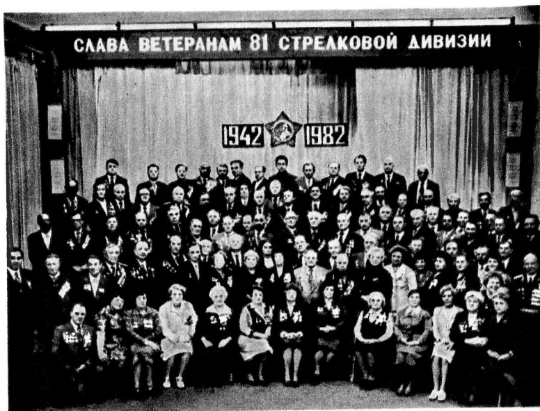
Юбилейная встреча ветеранов 81-й стрелковой дивизии 9 октября 1982 г. Москва.